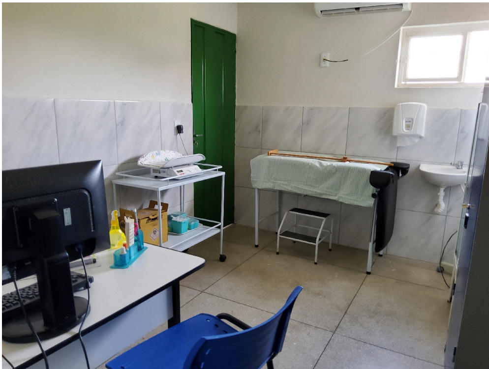
Sala de enfermagem