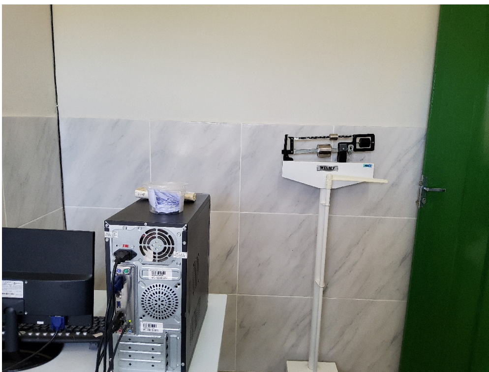
Sala de acolhimento e procedimentos (foto 2)