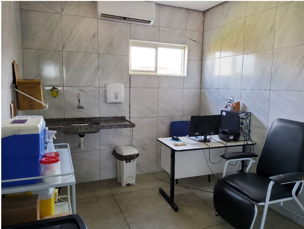
Sala de vacina (foto 1)