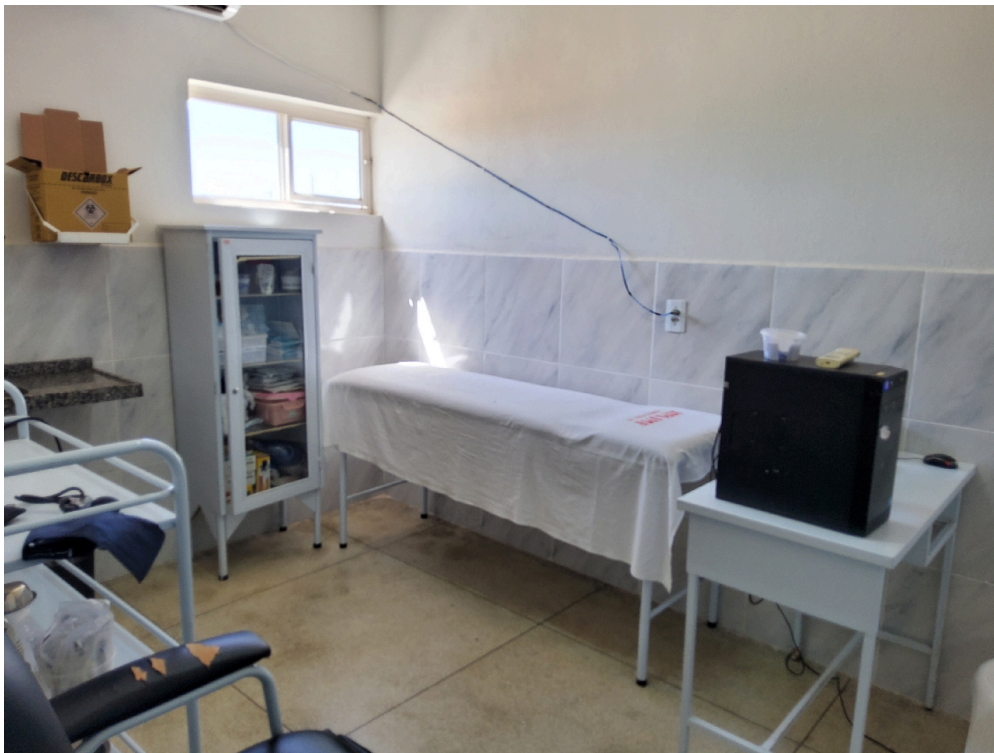
Sala de acolhimento e procedimentos (foto 1)