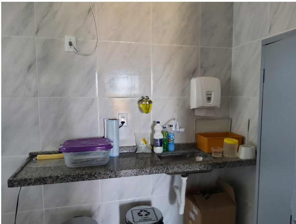
Consultório odontológico (foto 2)