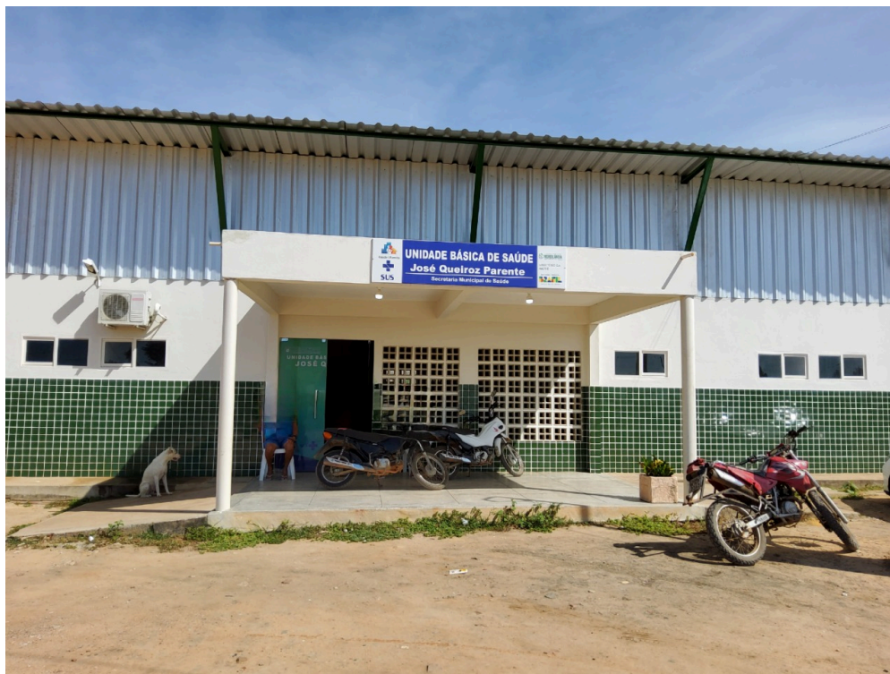
Unidade Básica de Saúde José Queiroz Parente