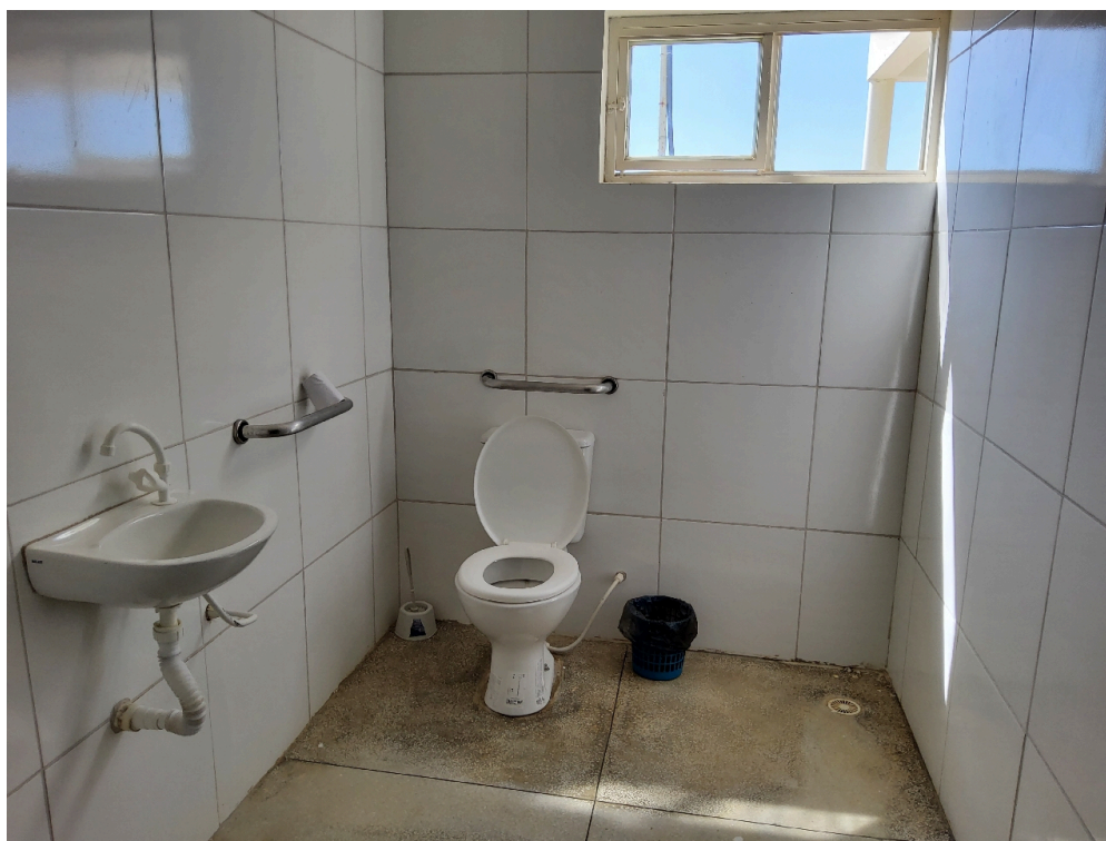
Banheiro de pacientes