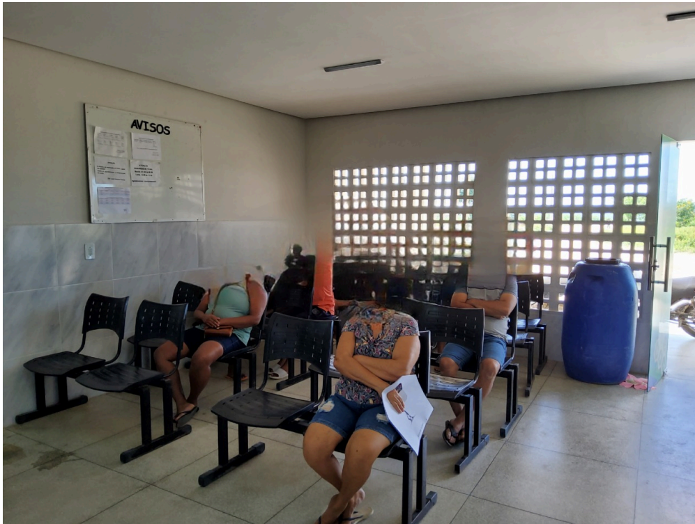
Sala de espera