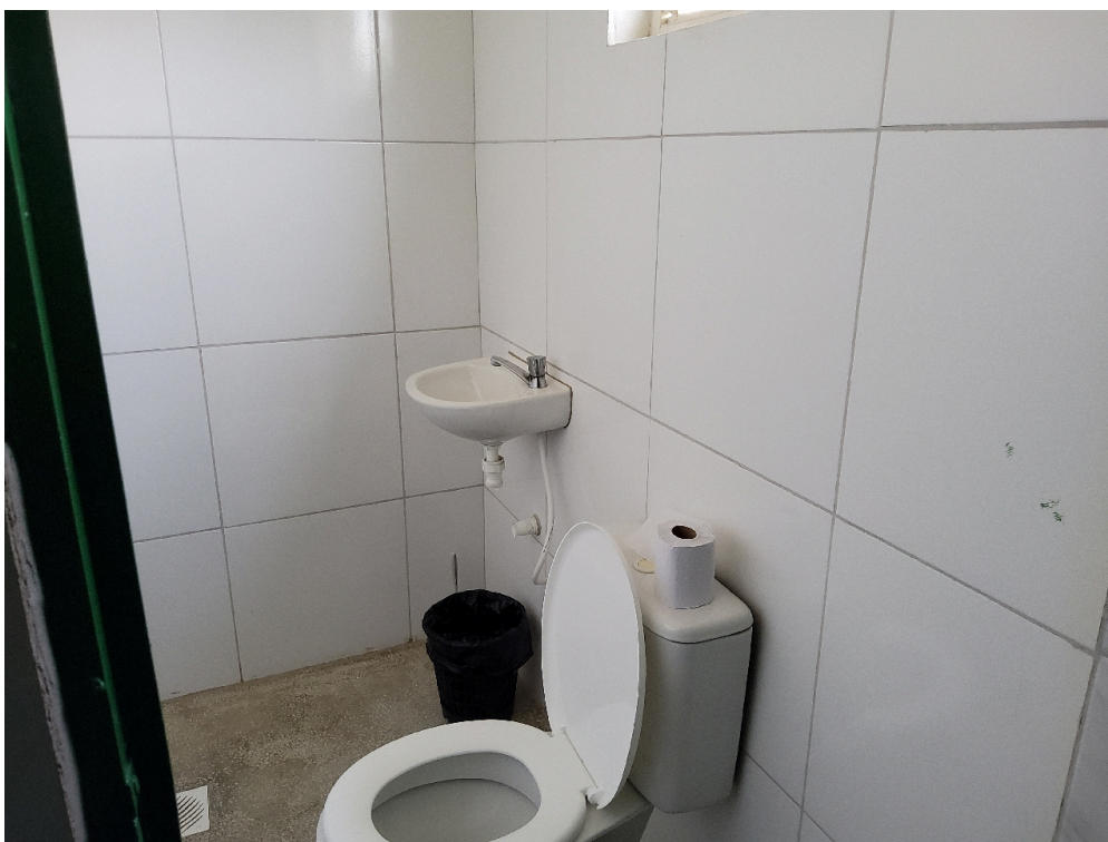
Banheiro da sala de enfermagem