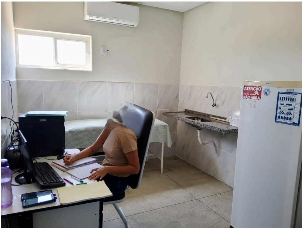
Sala de atendimento multidisciplinar