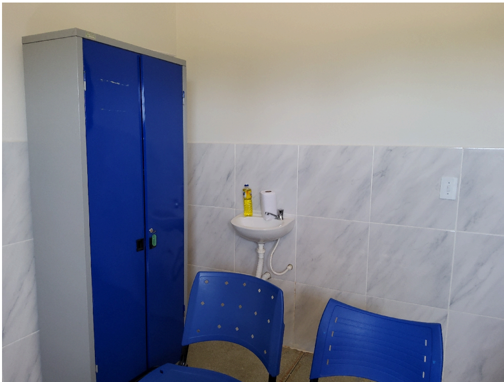
Consultório médico (foto 2)