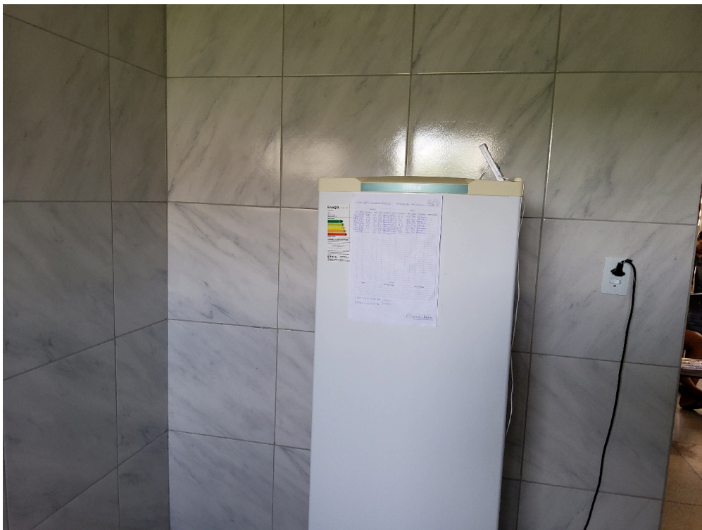
Sala de vacina (foto 2)