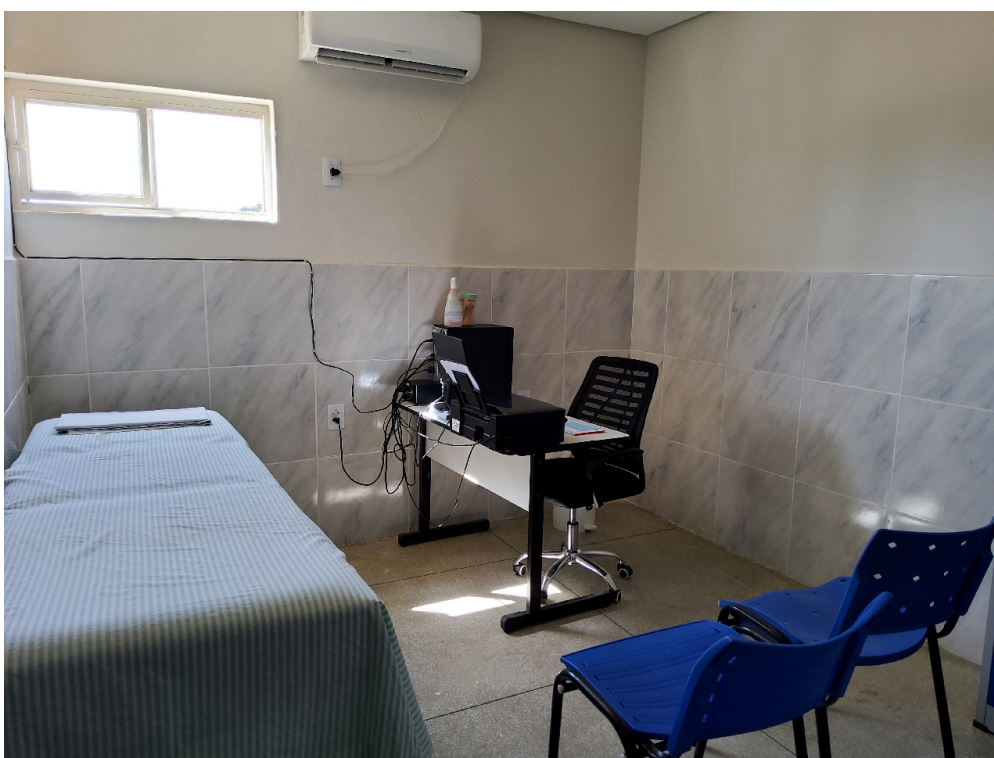
Consultório médico (foto 1)