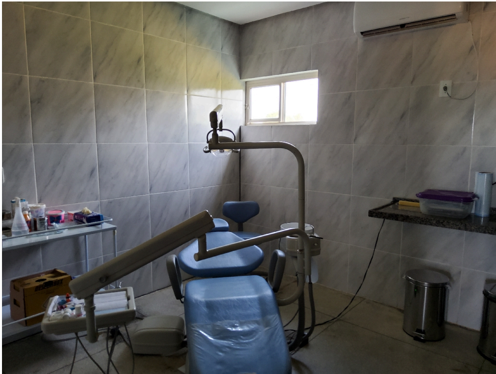
Consultório odontológico (foto 1)