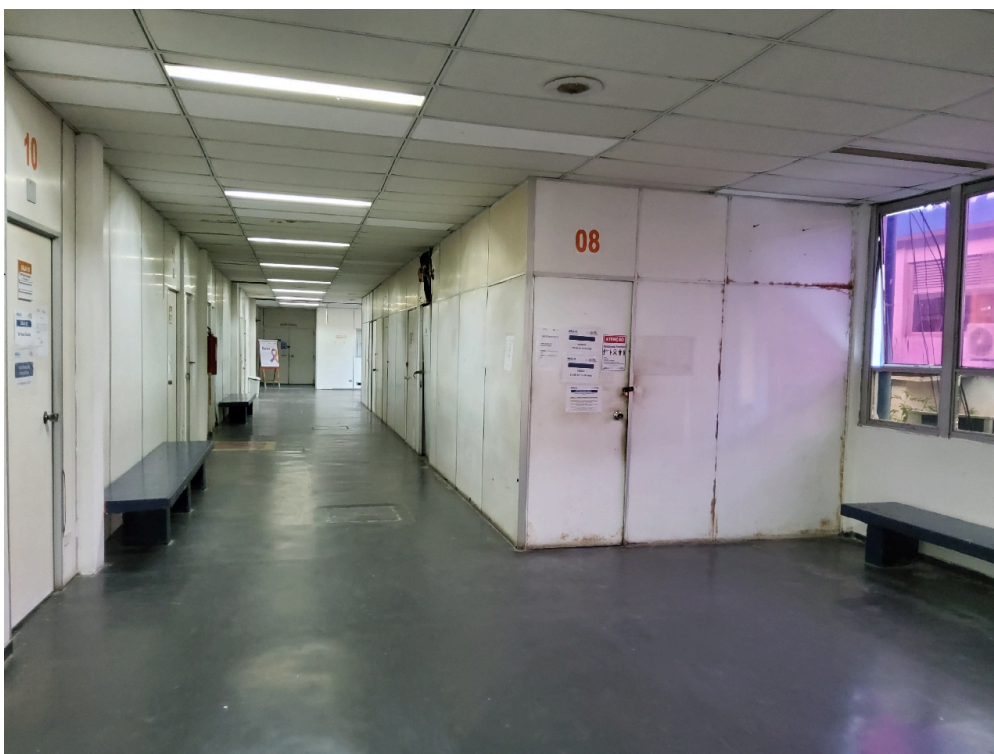
Instalações livres de trincas, rachaduras, mofos e/ou infiltrações