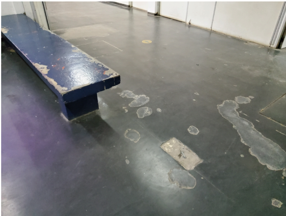
Instalações livres de trincas, rachaduras, mofos e/ou infiltrações