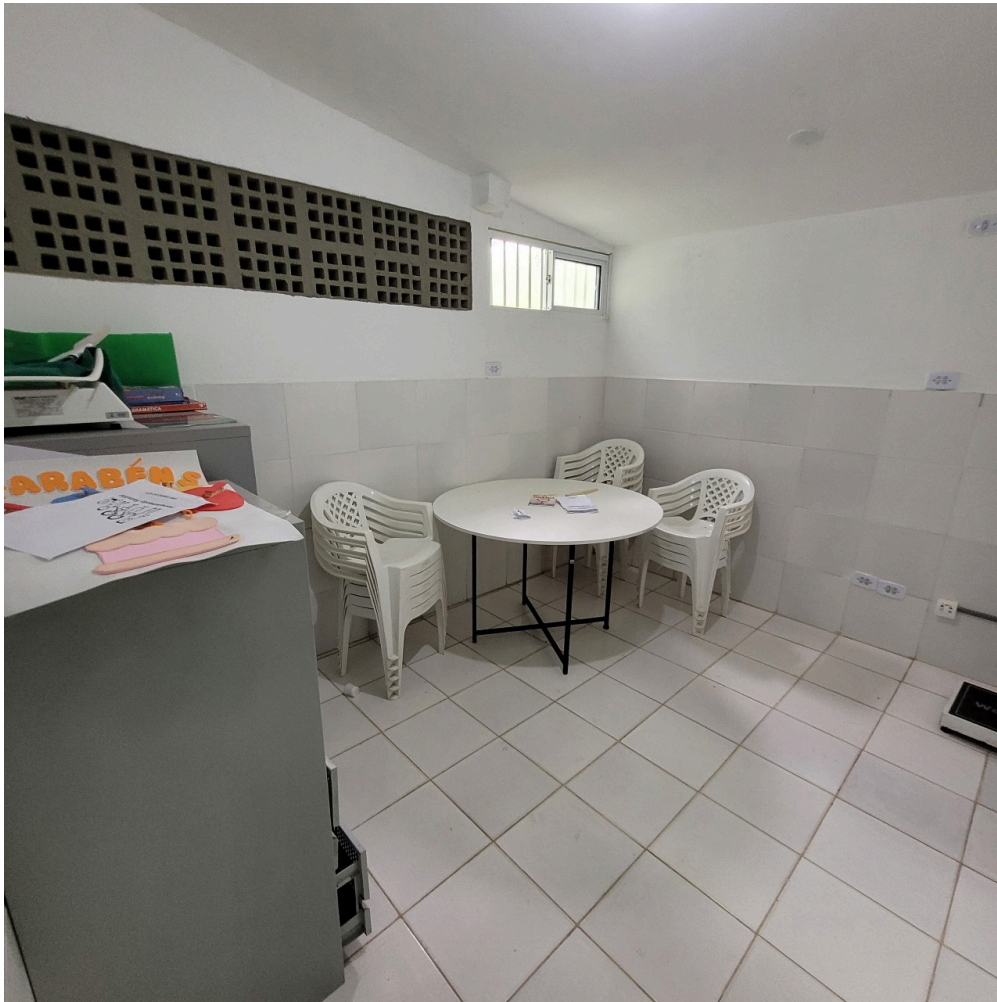
sala dos agentes comunitários de saúde - ACS