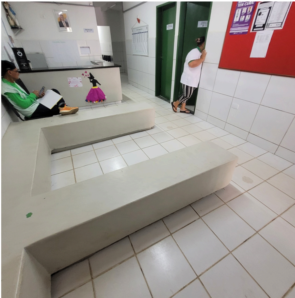
recepção e espera