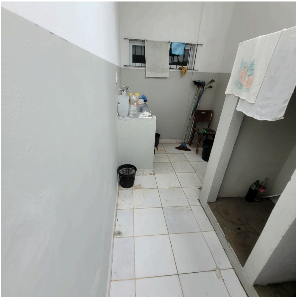
depósito de material de limpeza - DML