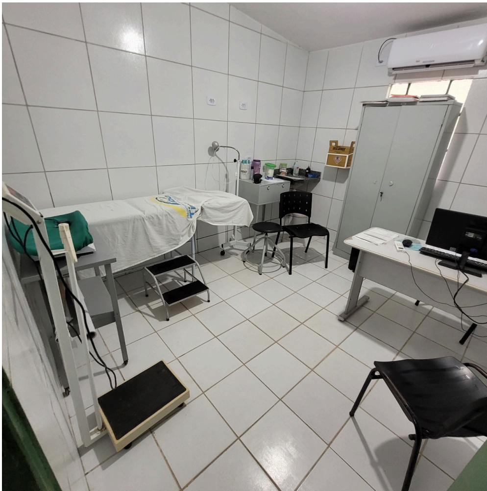
consultório de enfermagem