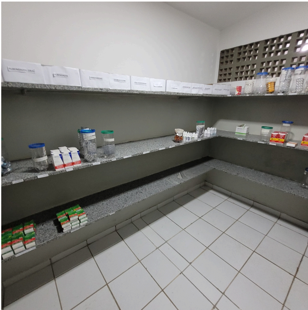
farmácia sem climatização com vários medicamentos faltando