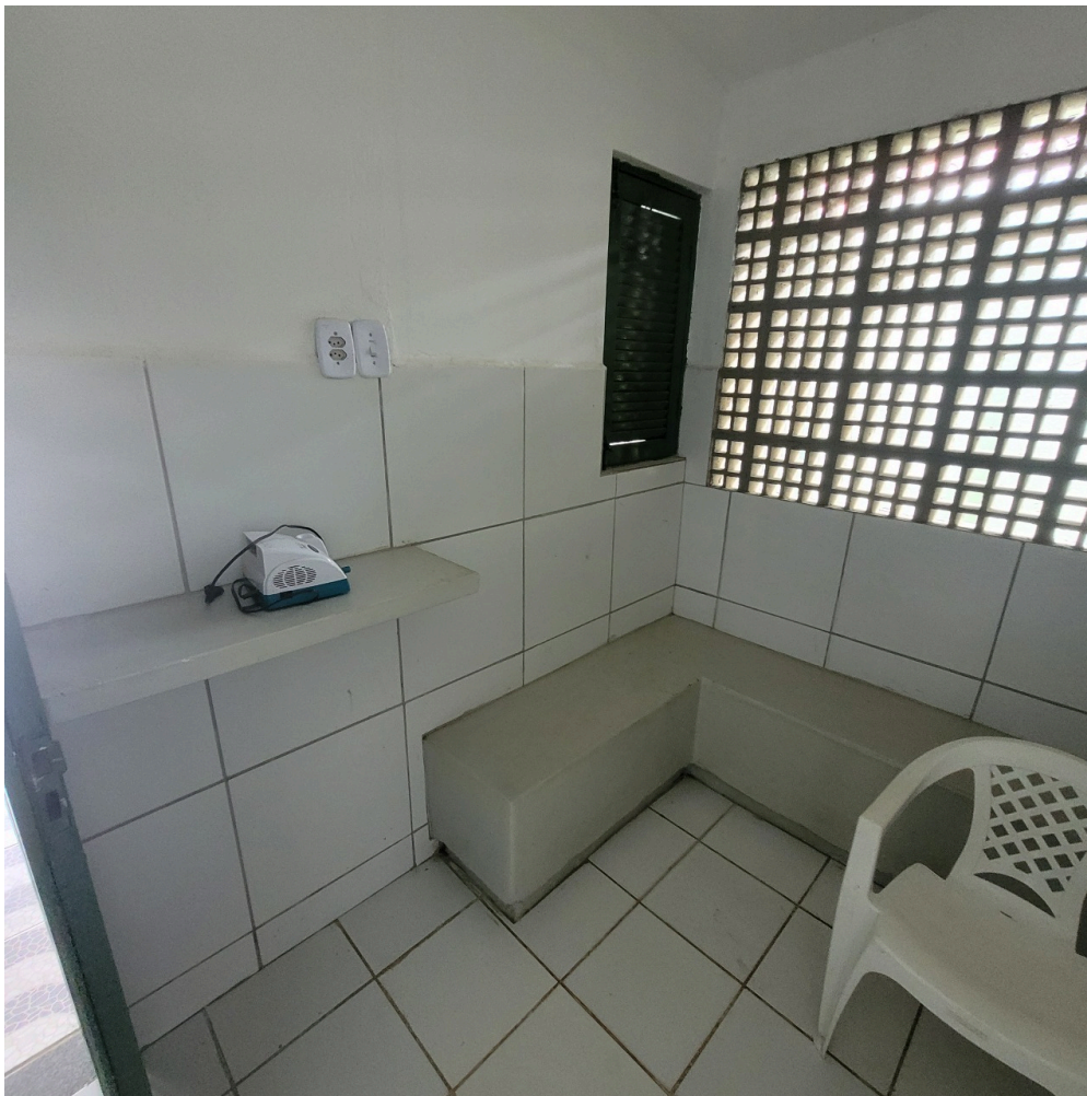
sala de nebulização