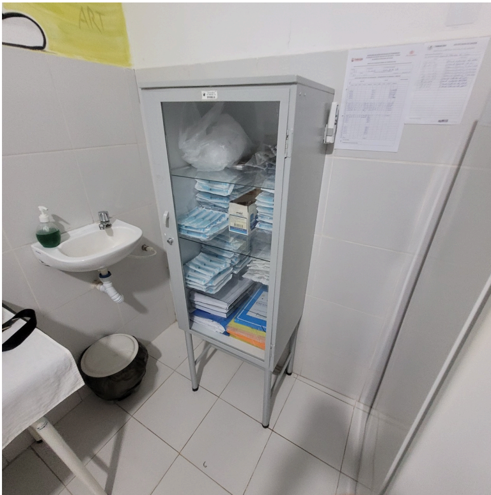
sala de vacinação