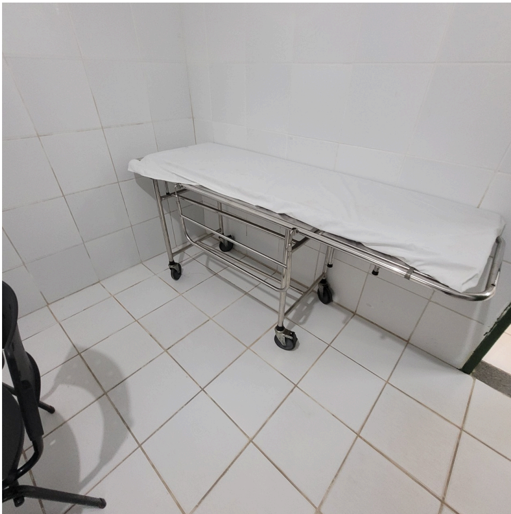
maca do consultório médico sem a escadinha de dois degraus