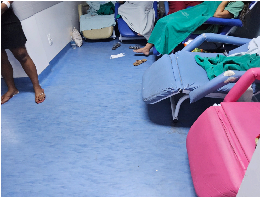
Iluminação suficiente para a realização das atividades com segurança