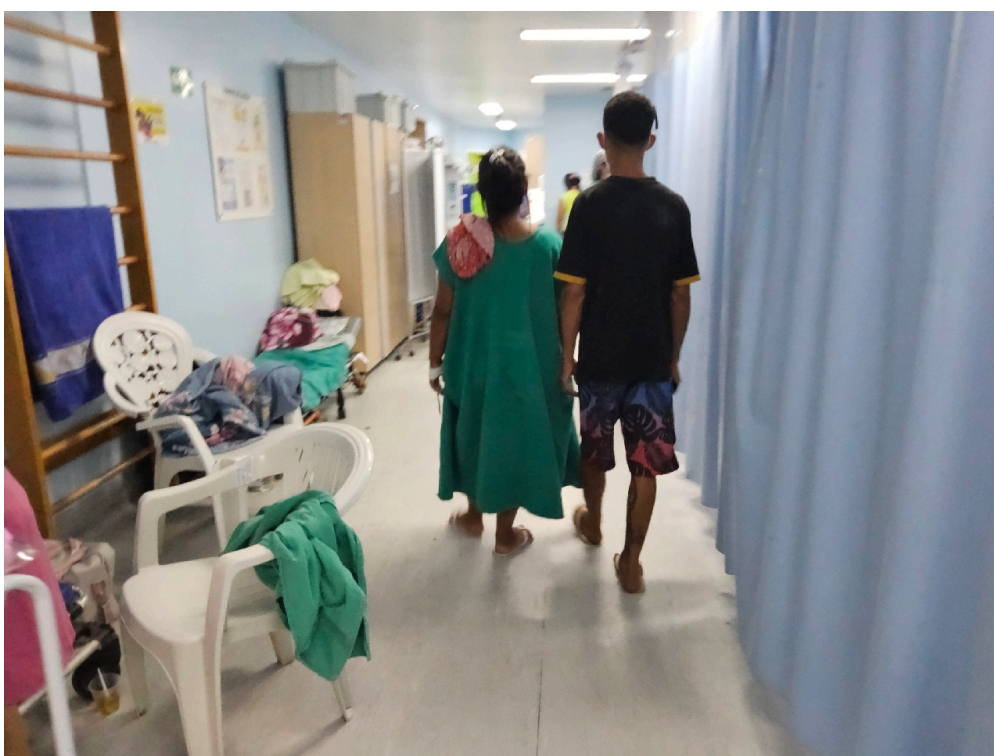
Item não conforme: Respeitada a privacidade das demais pacientes no ambiente