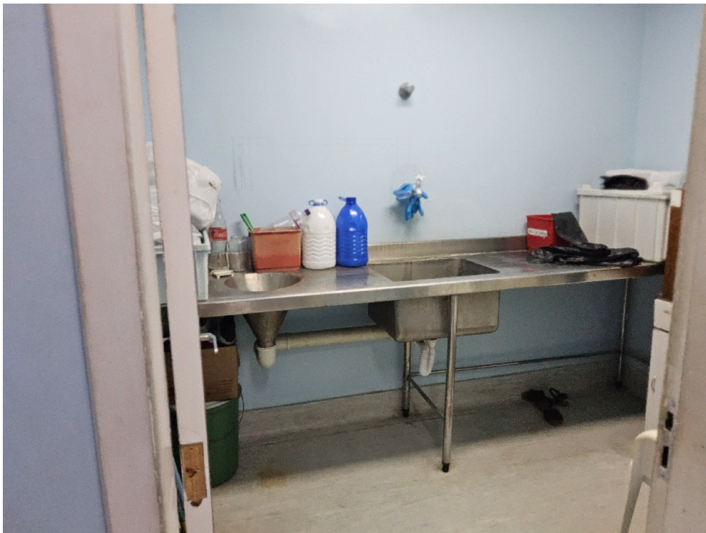
Área de expurgo ou sala de utilidades acordo com as regras sanitárias