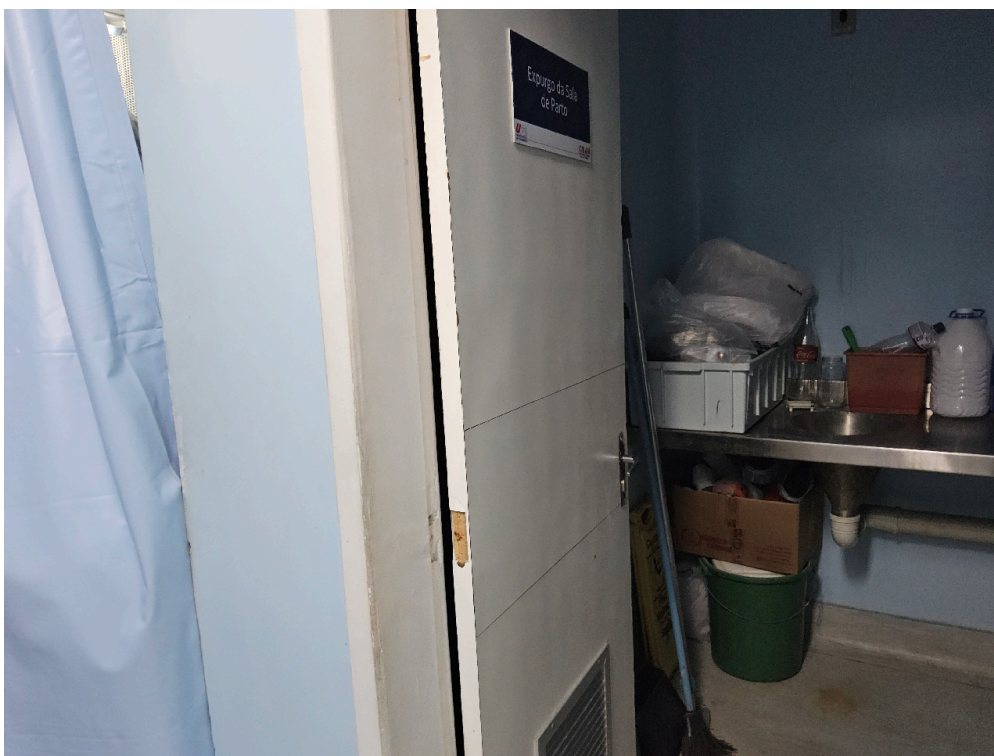
Área de expurgo ou sala de utilidades acordo com as regras sanitárias