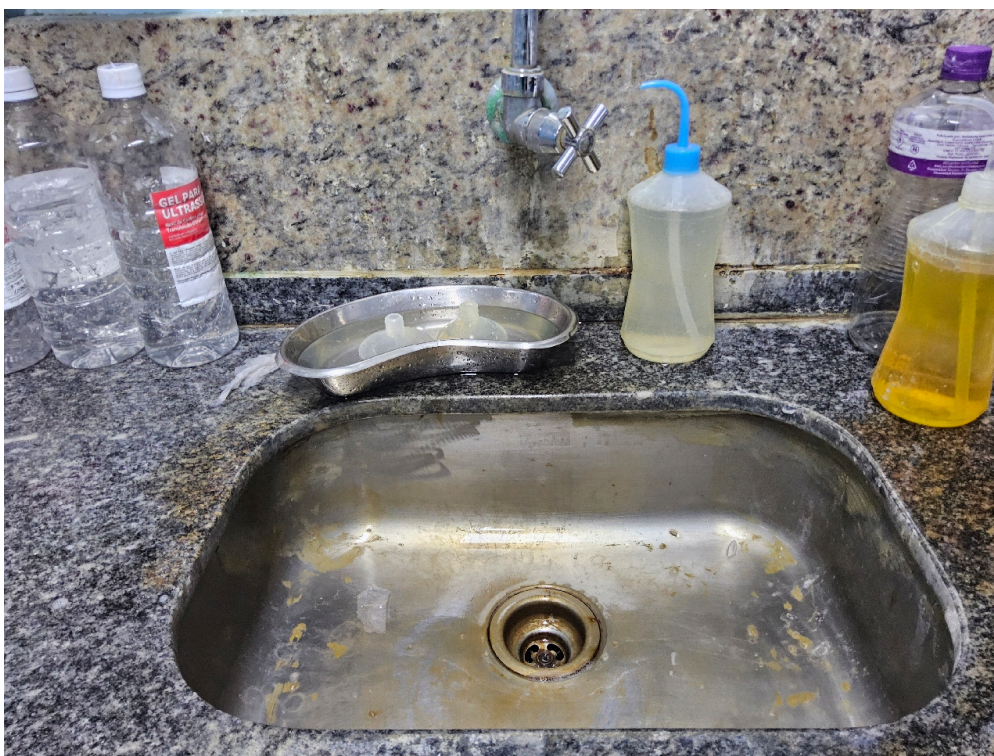
Bancada com cuba funda