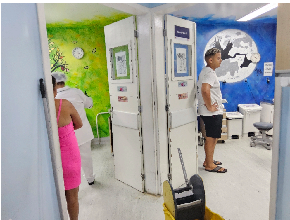
Salas de parto normal (número)