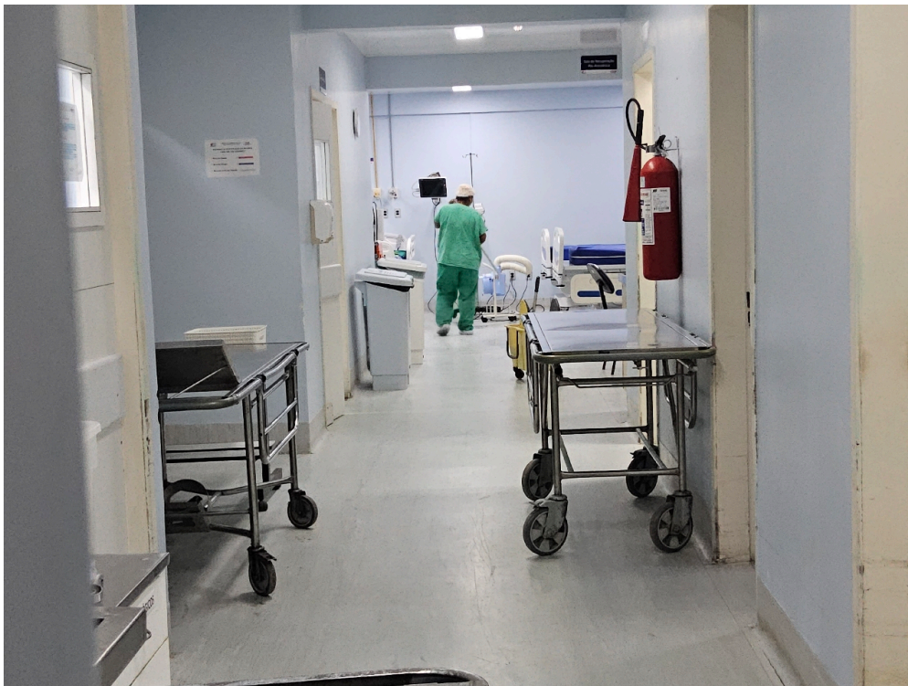
Leitos de recuperação pós-anestésica (número)