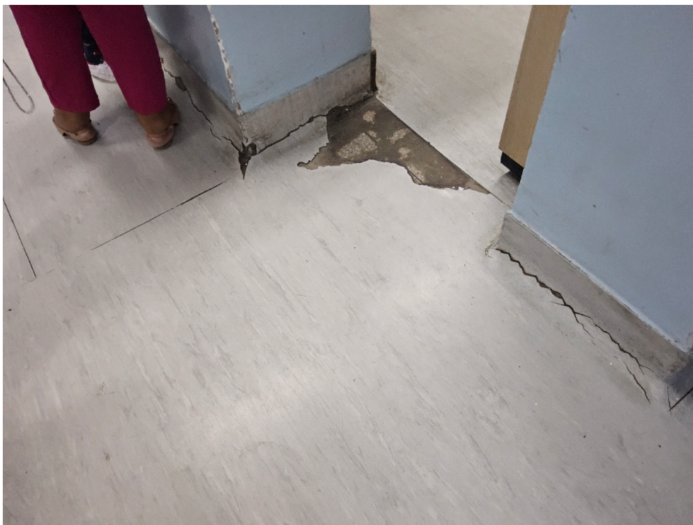
Instalações livres de trincas, rachaduras, mofos e/ou infiltrações