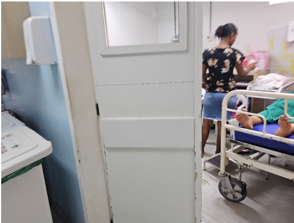
Salas de parto normal (número)