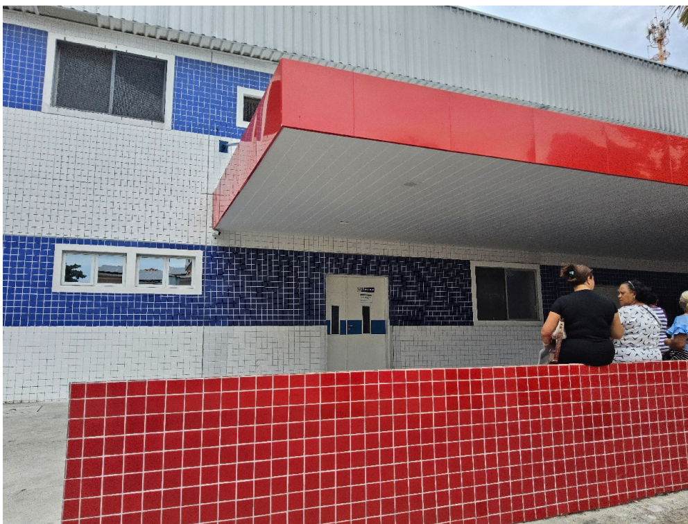
Registro Fotográfico da Fachada