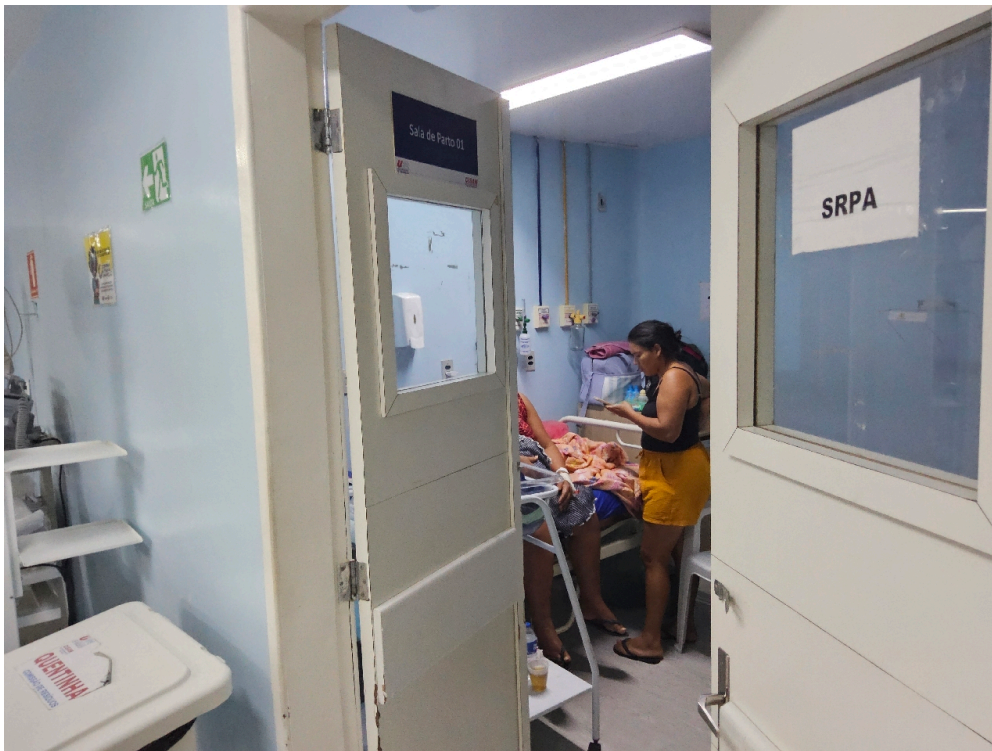
Item não conforme: Há garantias de privacidade para o paciente