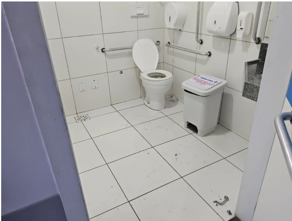
Sanitários para pacientes