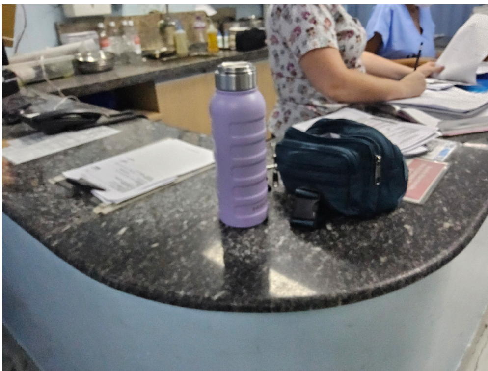
Item não conforme: Há garantias de confidencialidade do ato médico