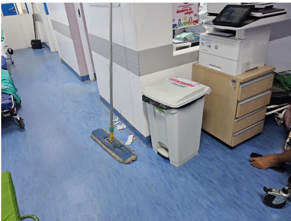
Ambiente com boas condições de higiene e limpeza