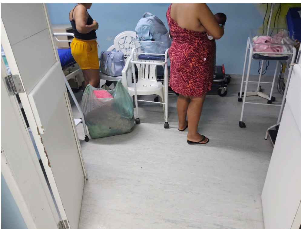
Salas de parto normal (número)