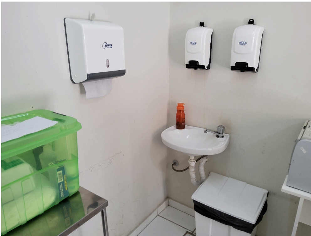
1 pia ou lavabo