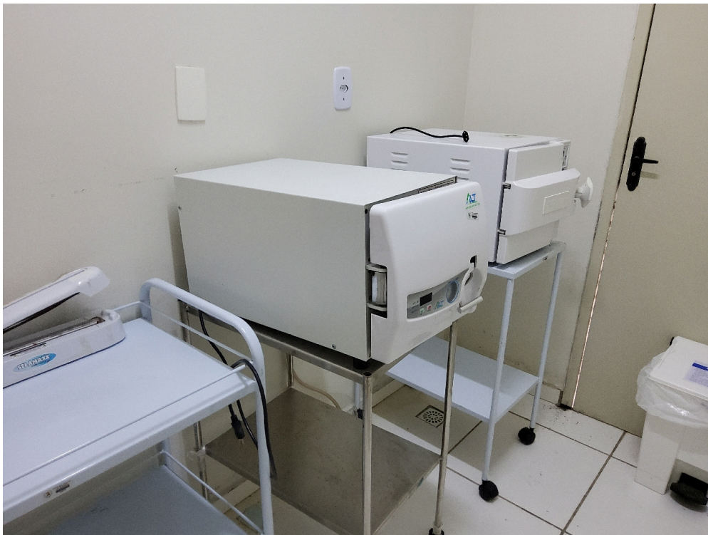
Sala de expurgo/esterilização