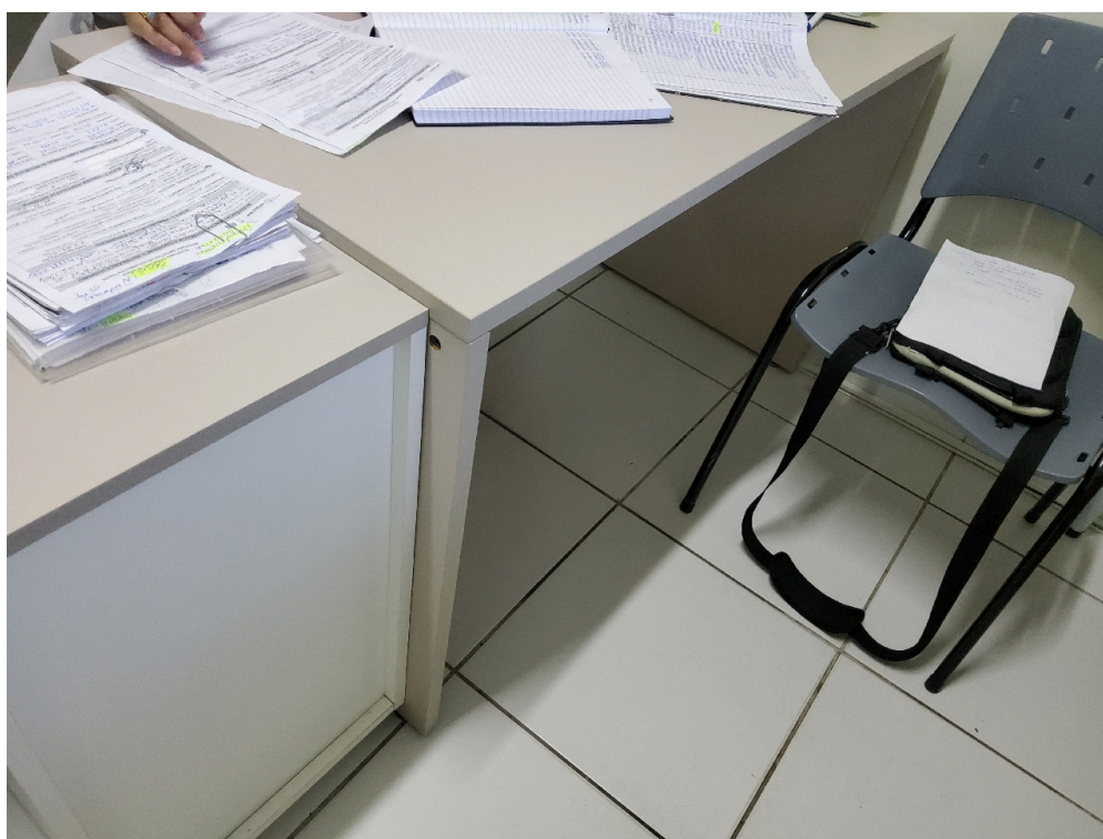
Mesa tipo escritório