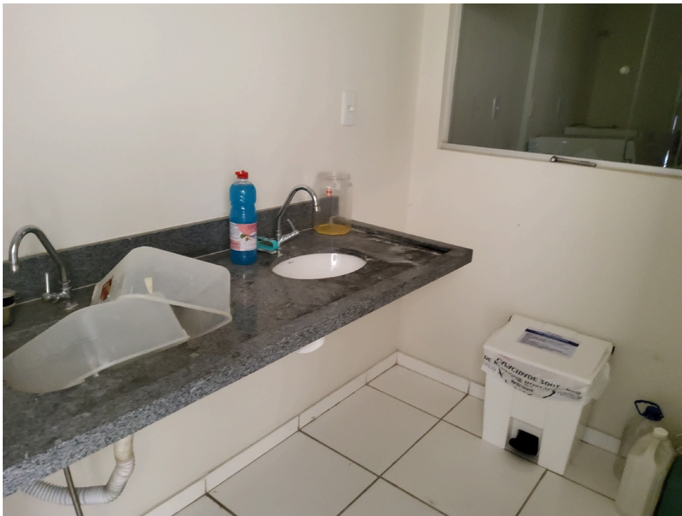
Sala de expurgo/esterilização