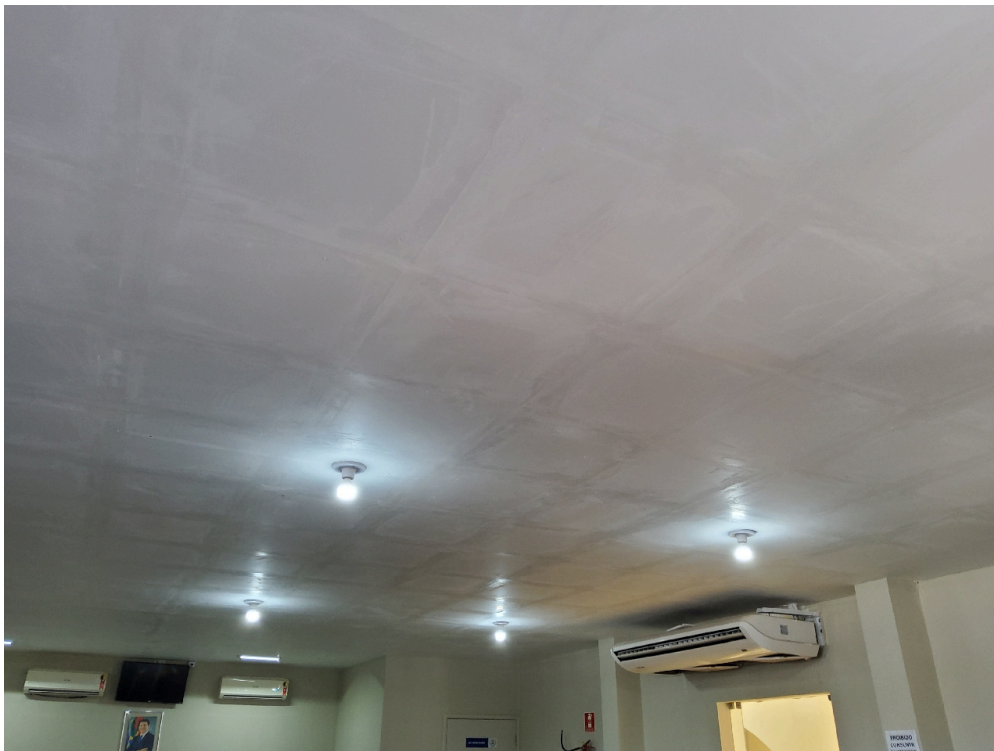
Recepção / Sala de espera