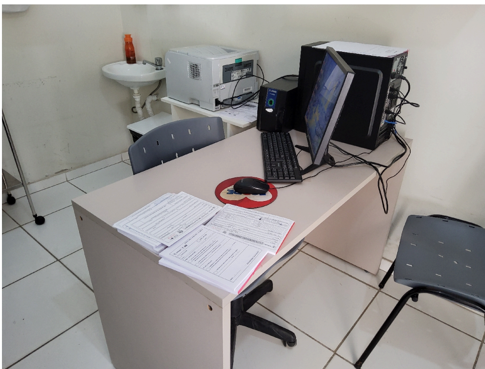
1 mesa / birô