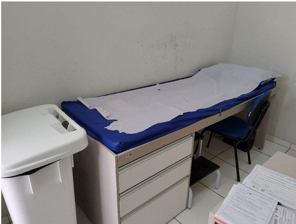
1 maca acolchoada simples, revestida com material impermeável