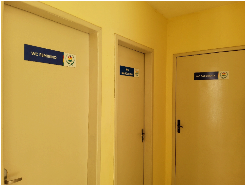
Sanitários para os funcionários