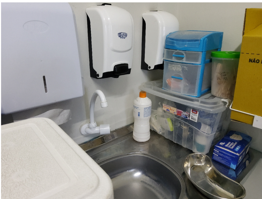
Caixa térmica munida de termômetro externo, para transporte e uso diário de vacinas