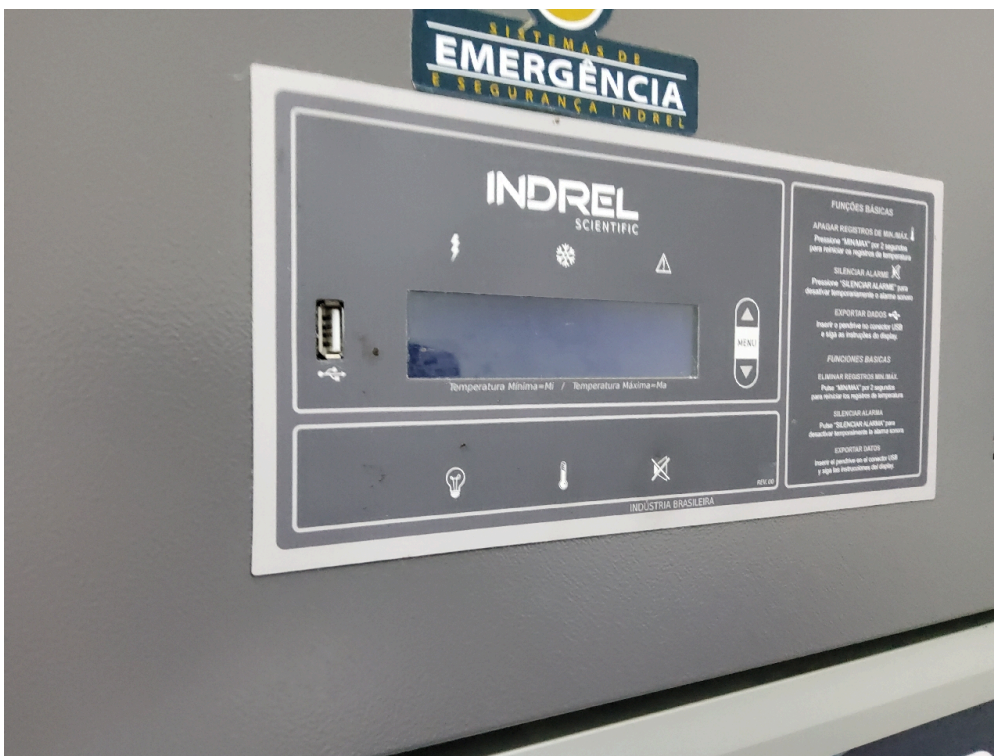
Item não conforme: Refrigerador para vacinas, munido de termômetro externo específico