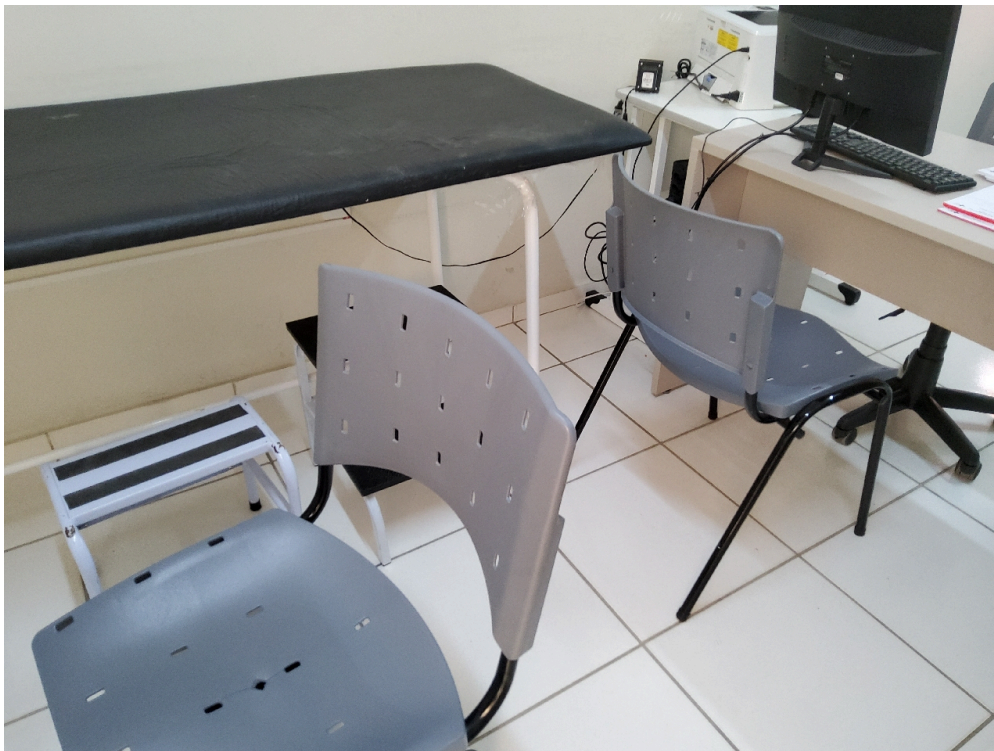
2 cadeiras ou poltronas - uma para o paciente e outra para o acompanhante