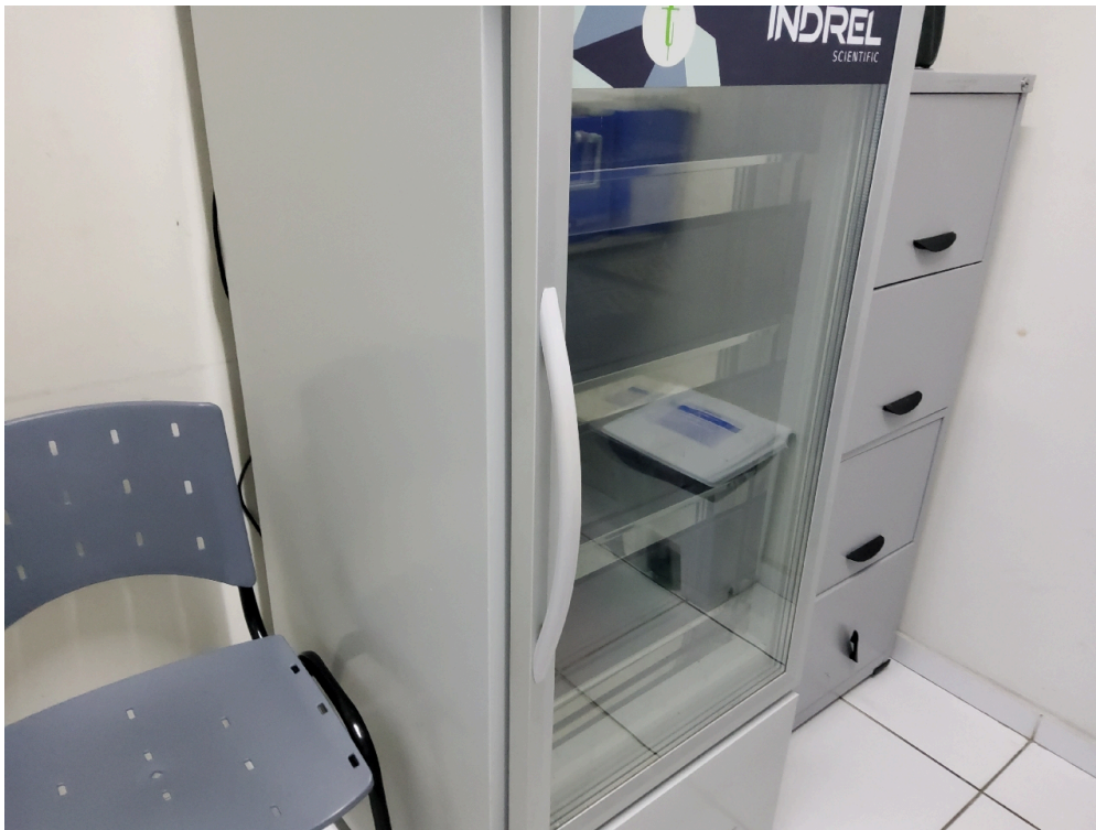
Item não conforme: Refrigerador para vacinas, munido de termômetro externo específico