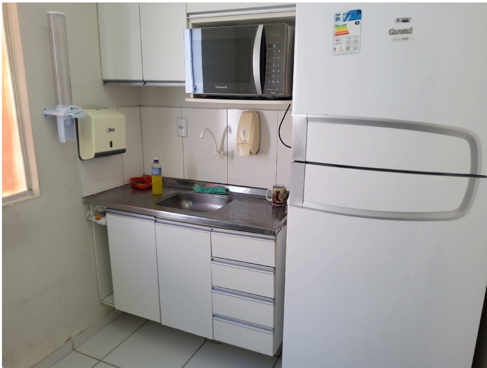
Item não conforme: Cesto de lixo