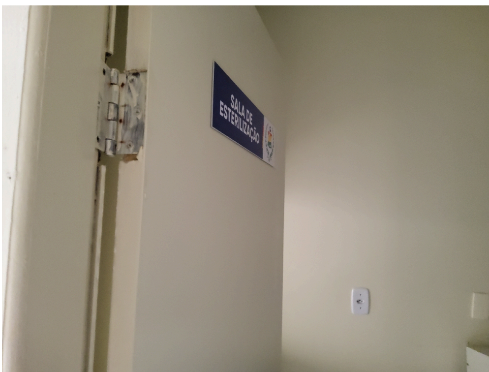
Sala de expurgo/esterilização