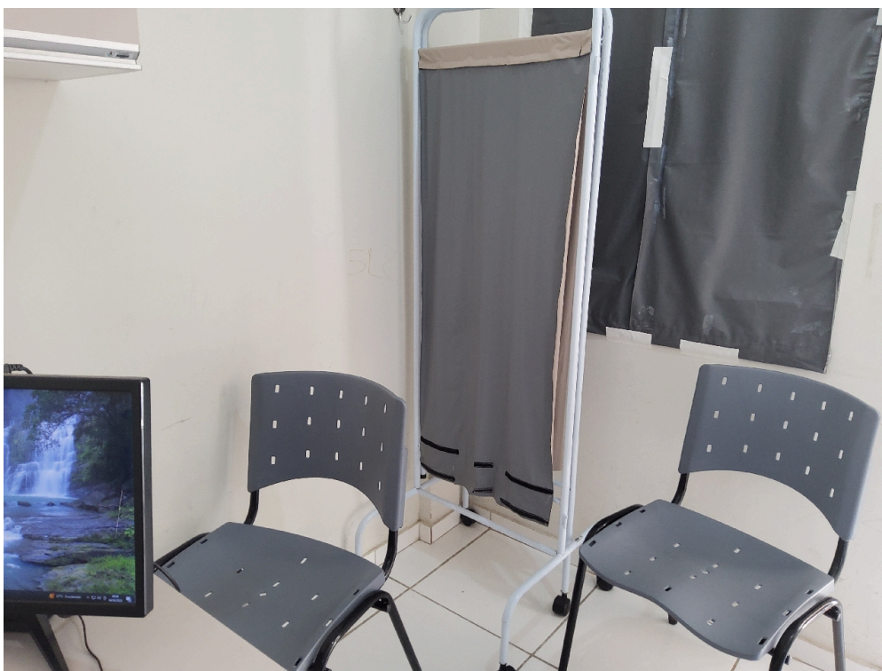
1 biombo ou outro meio de divisória