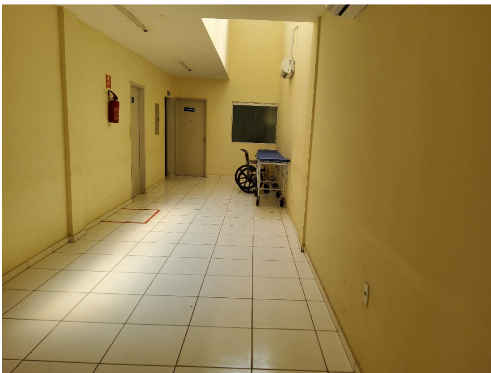
Local para macas e cadeira de rodas