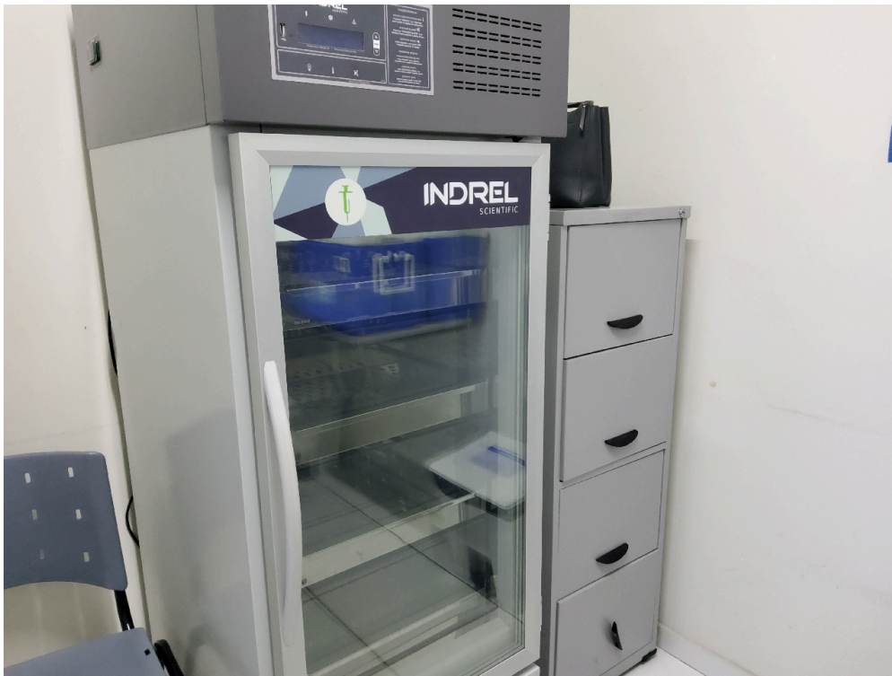
Item não conforme: Refrigerador para vacinas, munido de termômetro externo específico