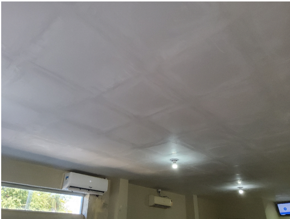
Recepção / Sala de espera