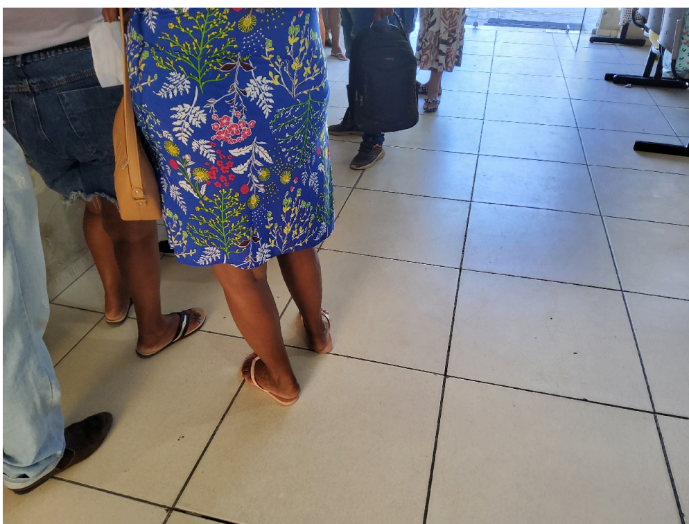
Recepção / Sala de espera