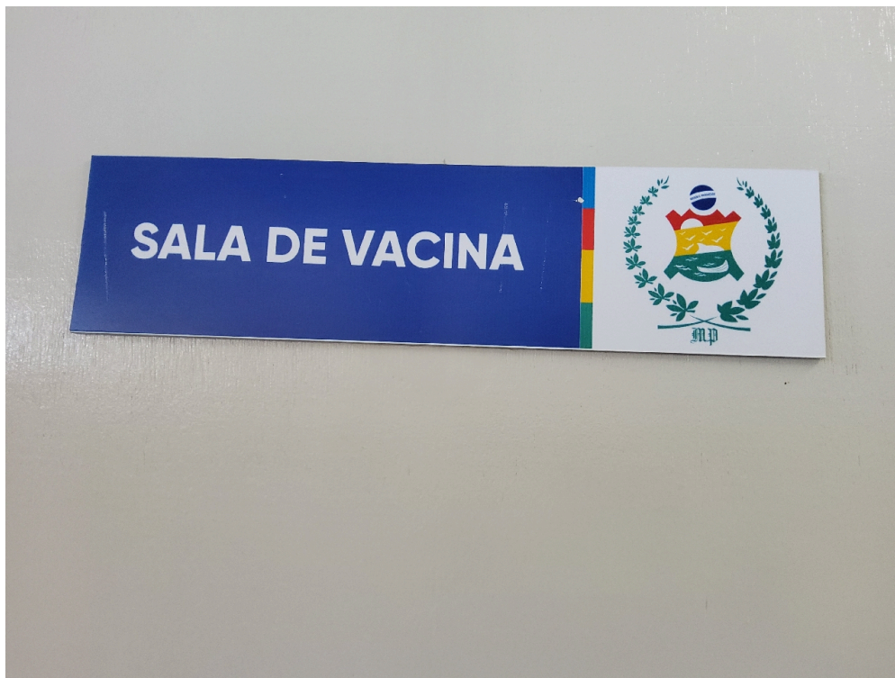
Dispõe de sala de imunização / vacinação