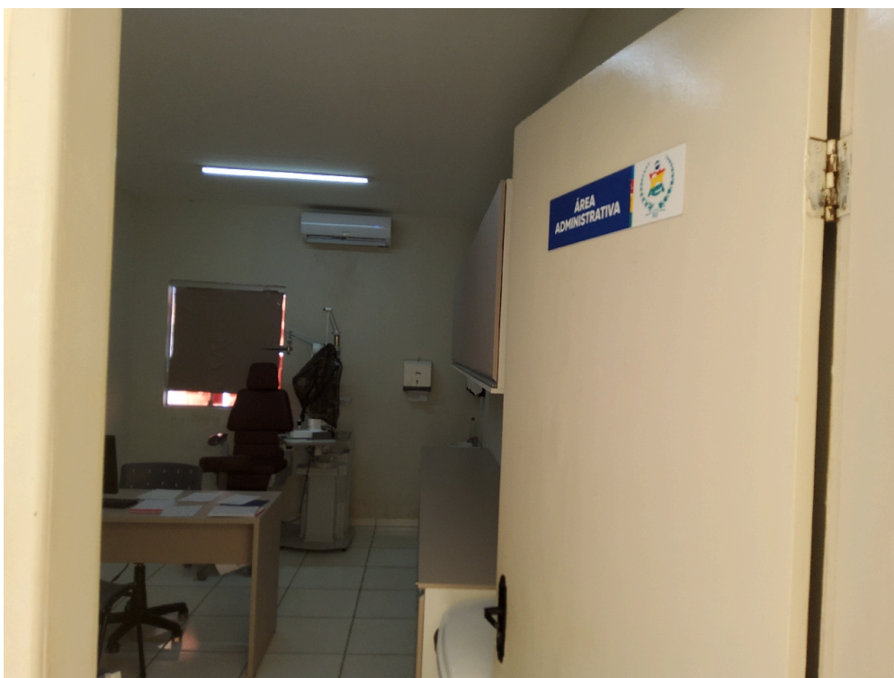
Há garantias de privacidade para o paciente