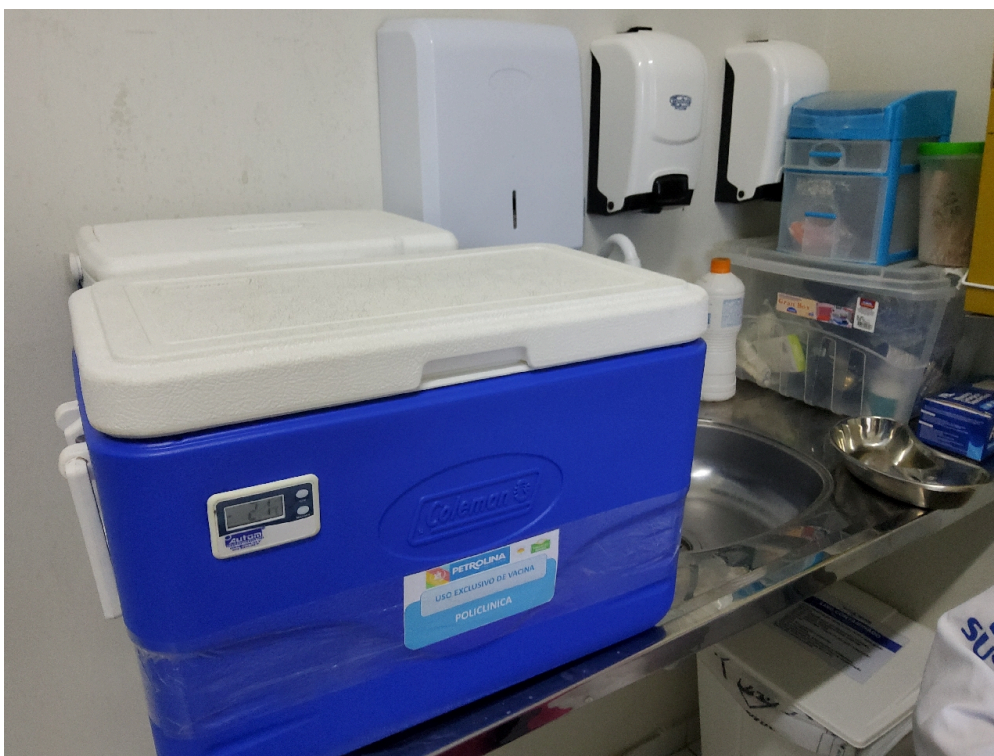
Recipientes de gelo sintético (Gelox) para proteção ao degelo