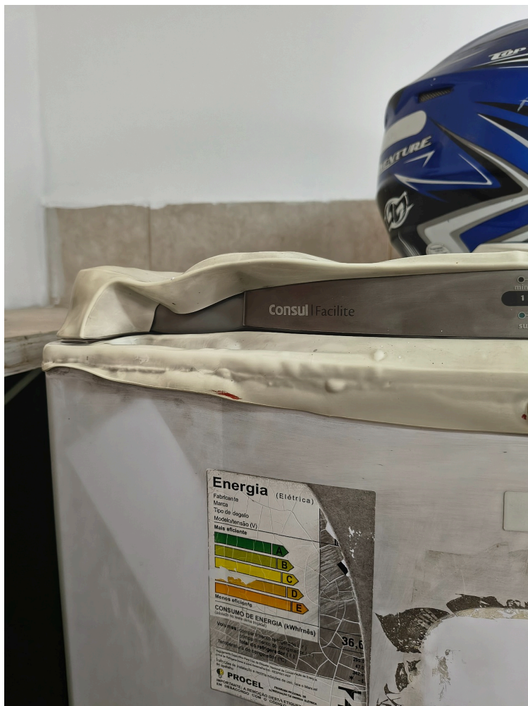
geladeira da copa\cozinha conserva as marcas de incêndio