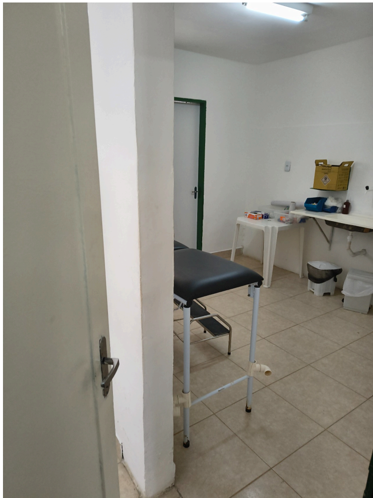
consultório de enfermagem