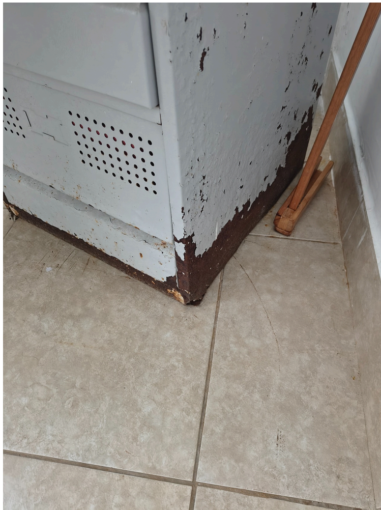
armário tipo gaveteiro enferrujado no consultório de enfermagem