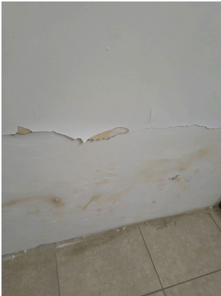
infiltrações em parede do consultório médico