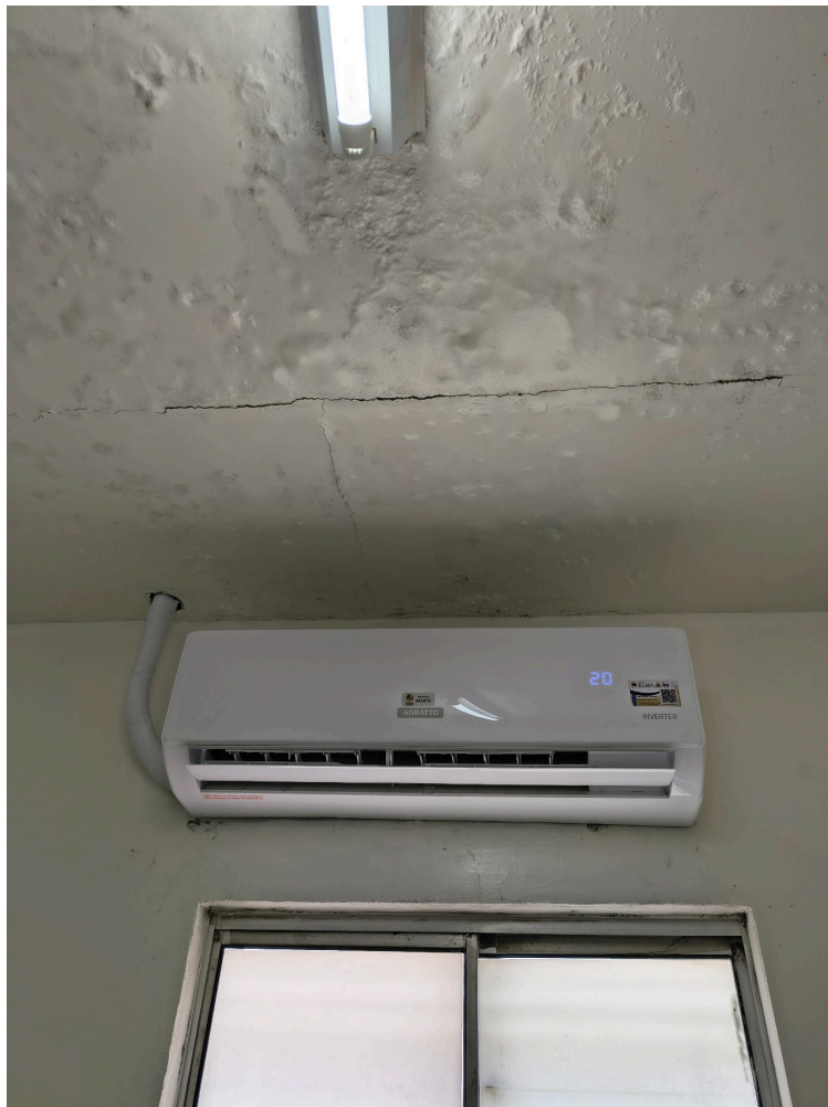
infiltrações e mofo no teto da sala de vacinas