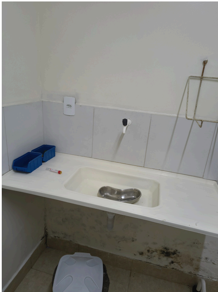
pia da sala de procedimentos apresentando infiltrações e mofo em parede abaixo