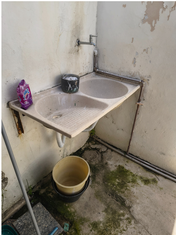
tanque/bancada de materiais de limpeza