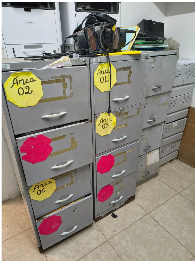
armários de ferro preservam prontuário físicos na sala dos agentes comunitários de saúde - ACS