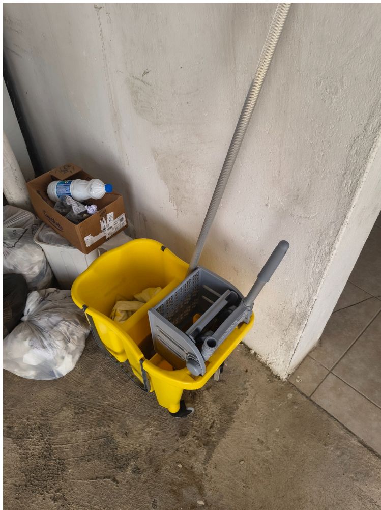
carrinho com materiais de limpeza