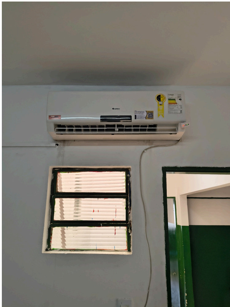
aparelho de ar condicionado do consultório médico instalado há uma semana