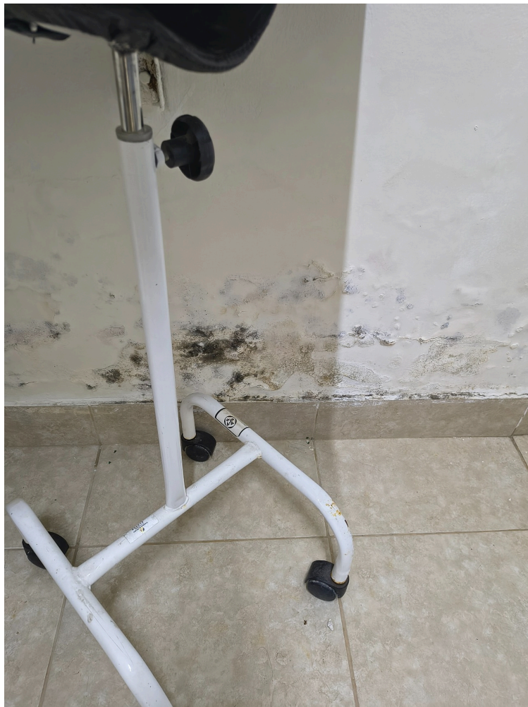
infiltrações e mofo na sala de procedimentos