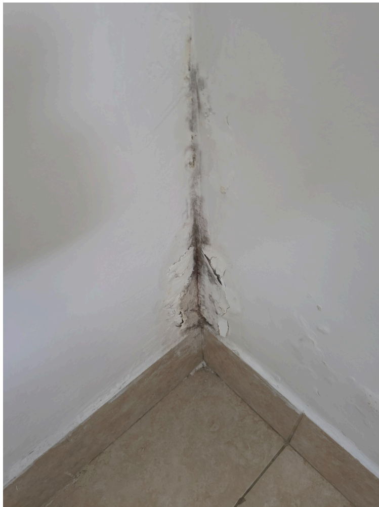
infiltração e mofo na parede do consultório de enfermagem