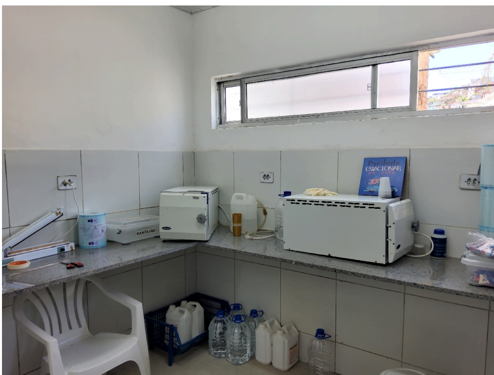
Esterilização (apenas para materiais odontológicos)