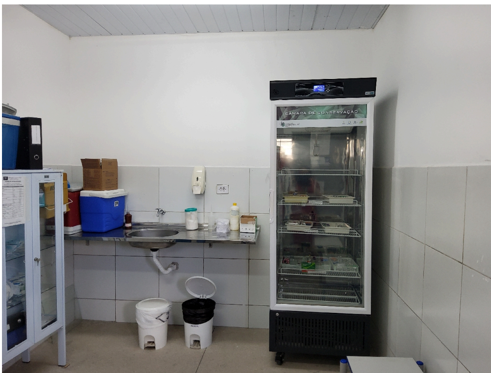
Sala de vacina (foto 2)