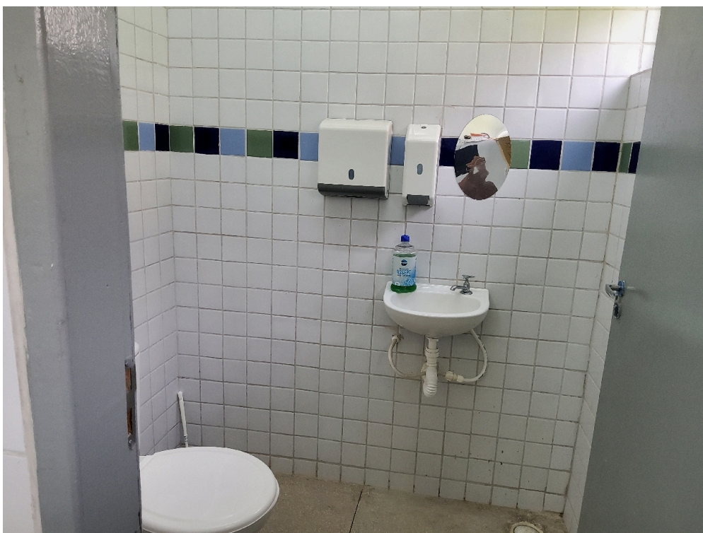
Banheiro do consultório de enfermagem