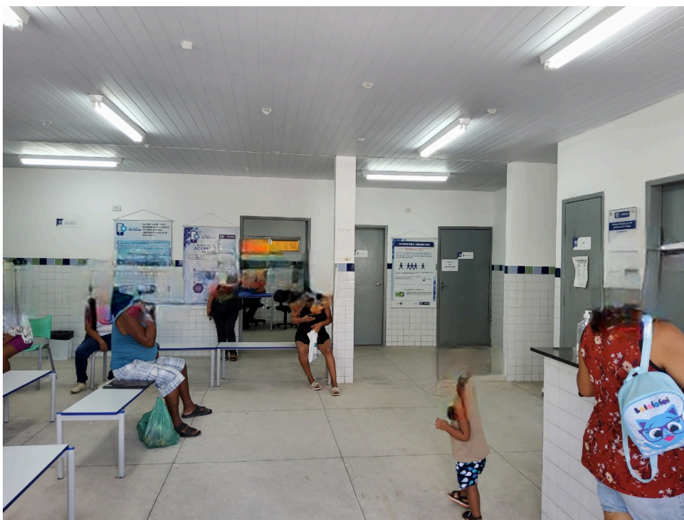
Recepção e sala de espera