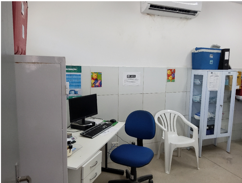
Sala de vacina (foto 1)