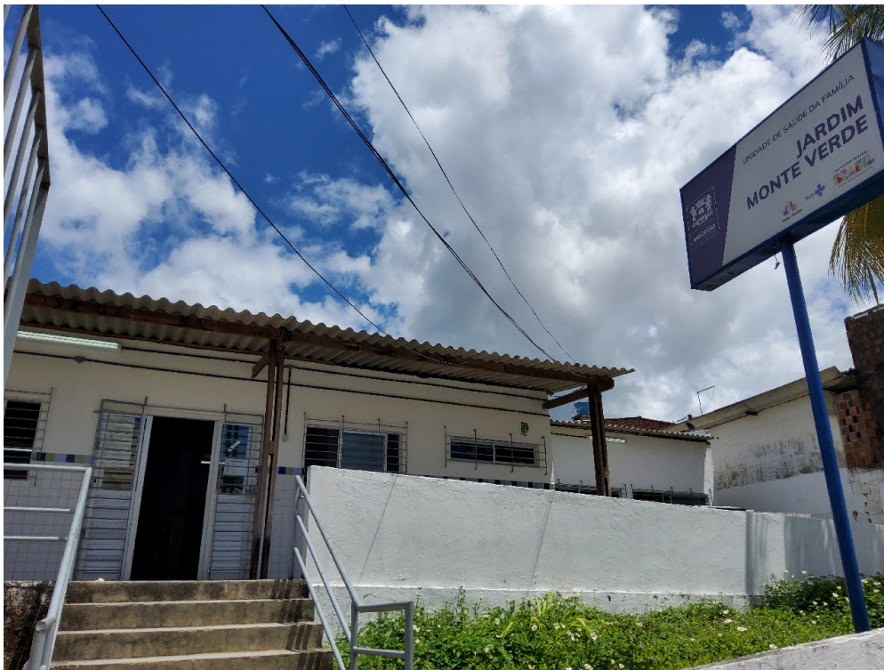
USF Jardim Monte Verde