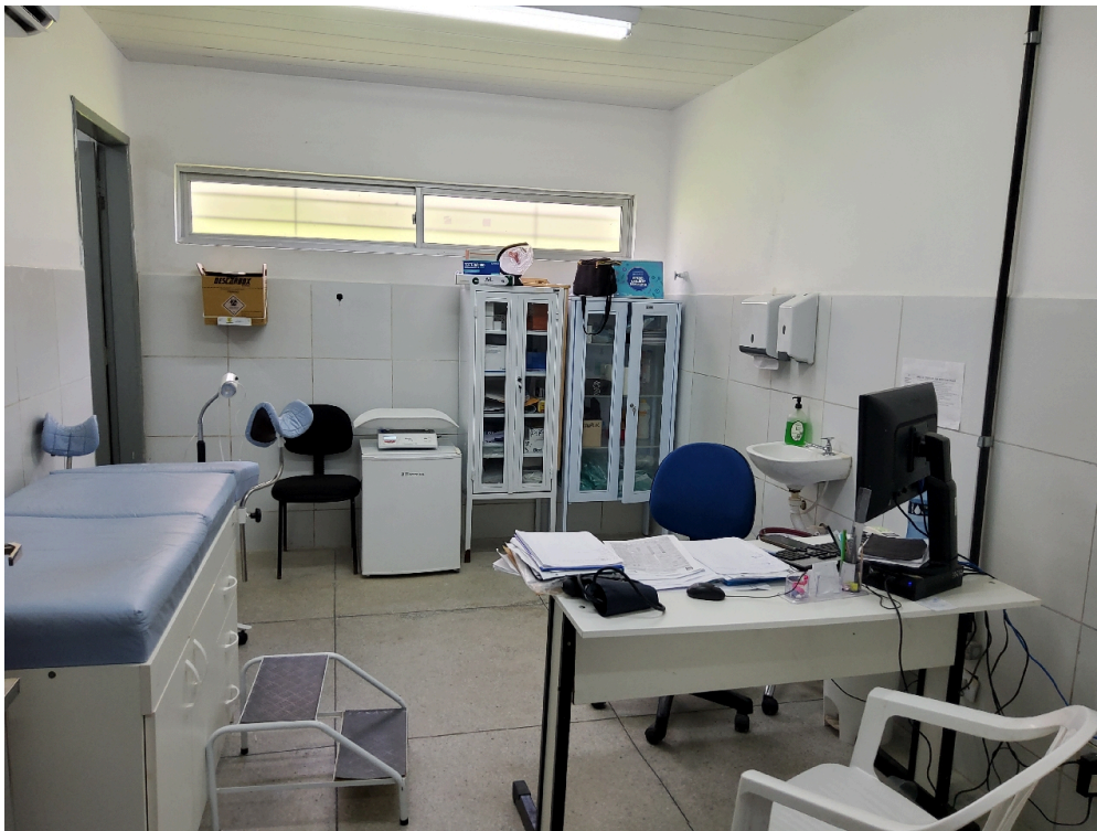
Consultório de enfermagem