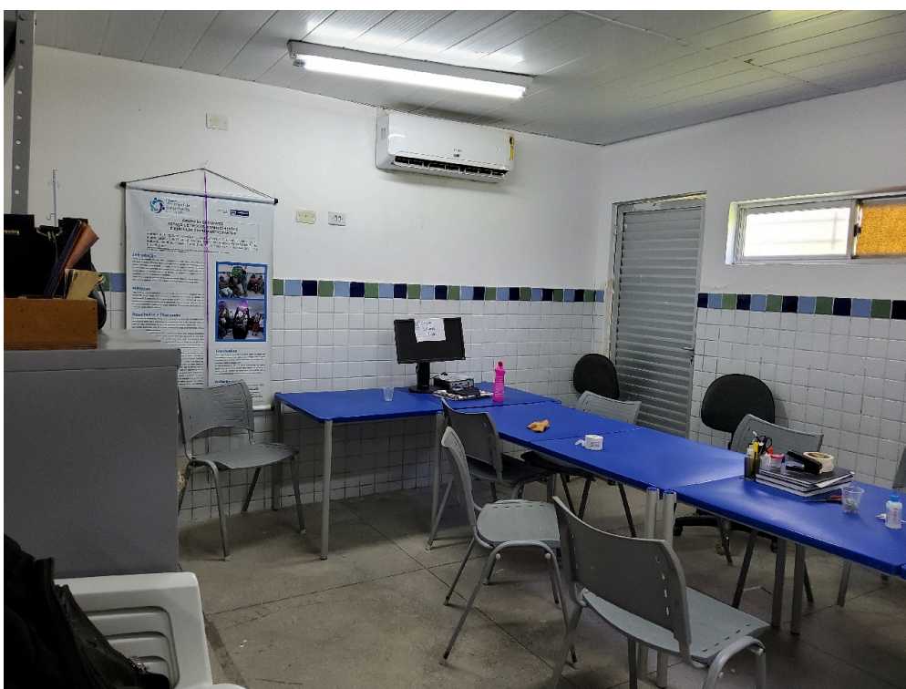
Sala de reuniões