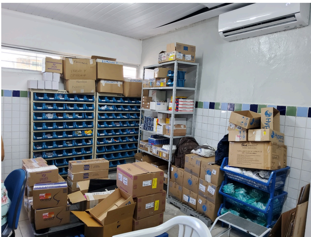
Farmácia (foto 1)