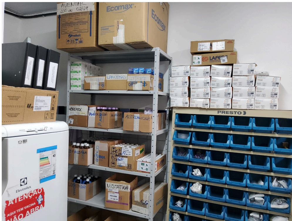
Farmácia (foto 2)