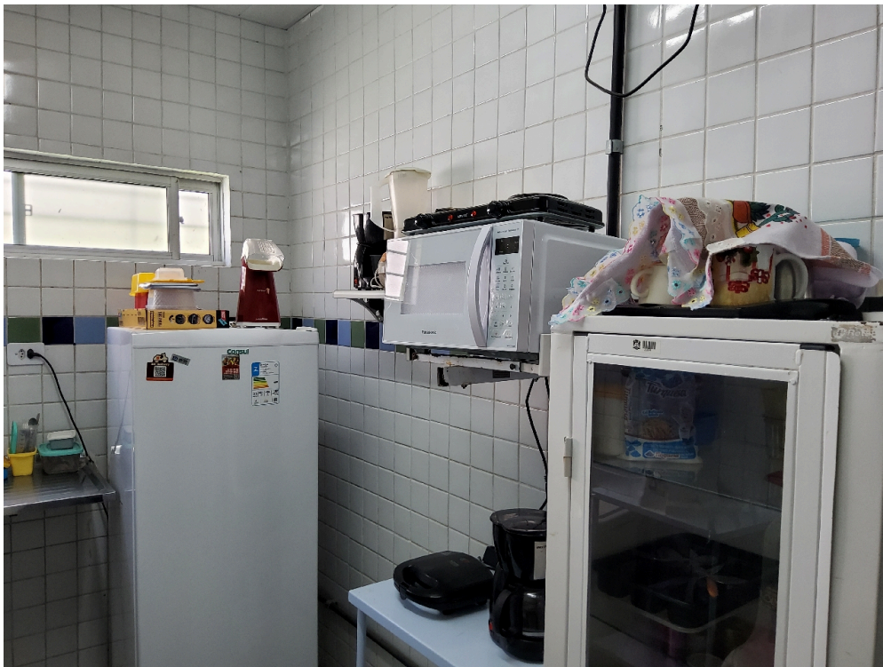
Cozinha (foto 2)