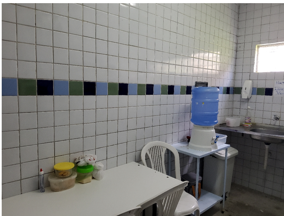
Cozinha (foto 1)