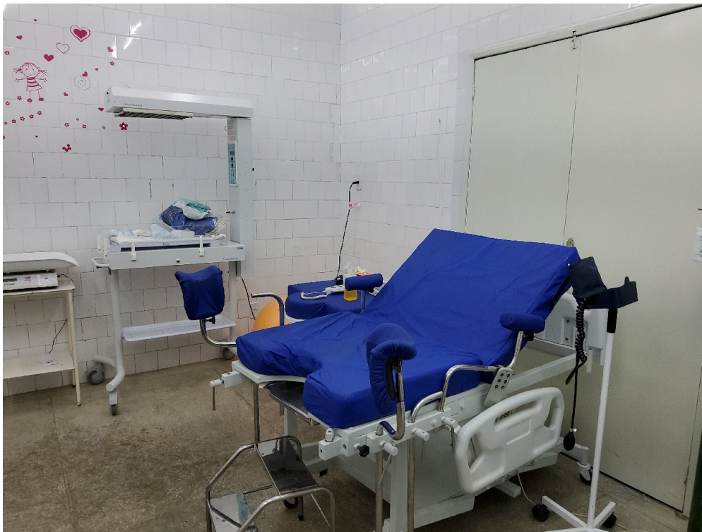
Sala de parto (foto 1)