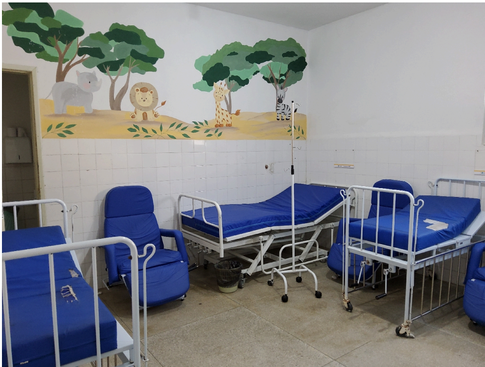
Enfermaria pediátrica (foto 1)