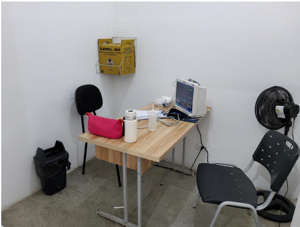
Classificação de risco - sem pia (foto 1)