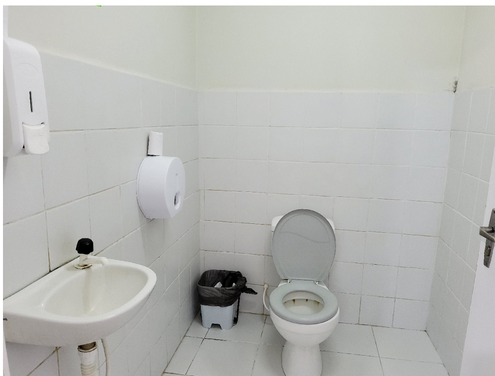
Banheiro dos pacientes