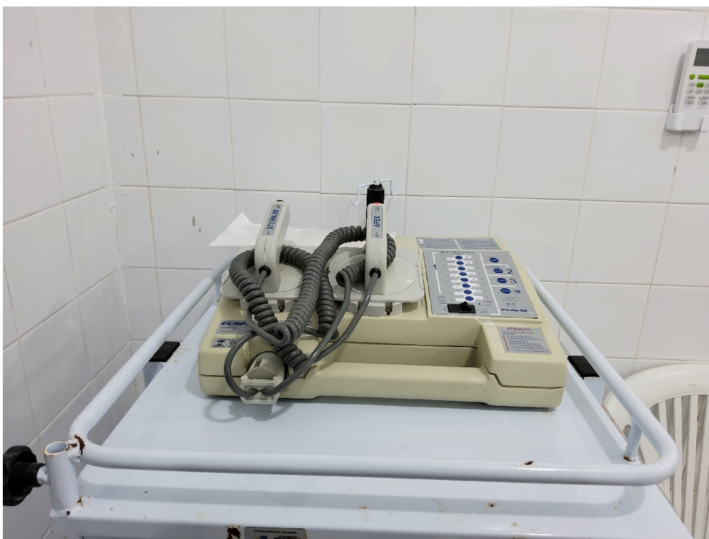
Desfibrilador do bloco cirúrgico