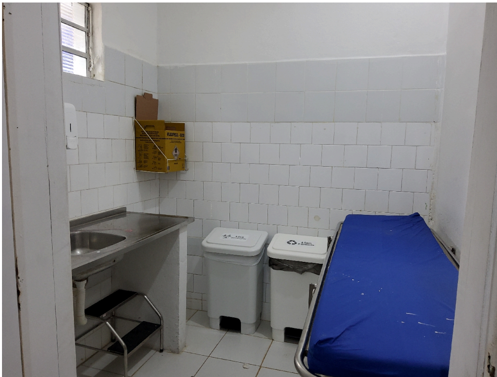
Sala de administração de medicamentos intramusculares