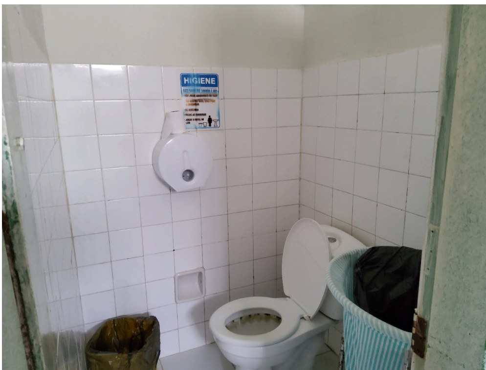
Banheiro da enfermaria (foto 2)