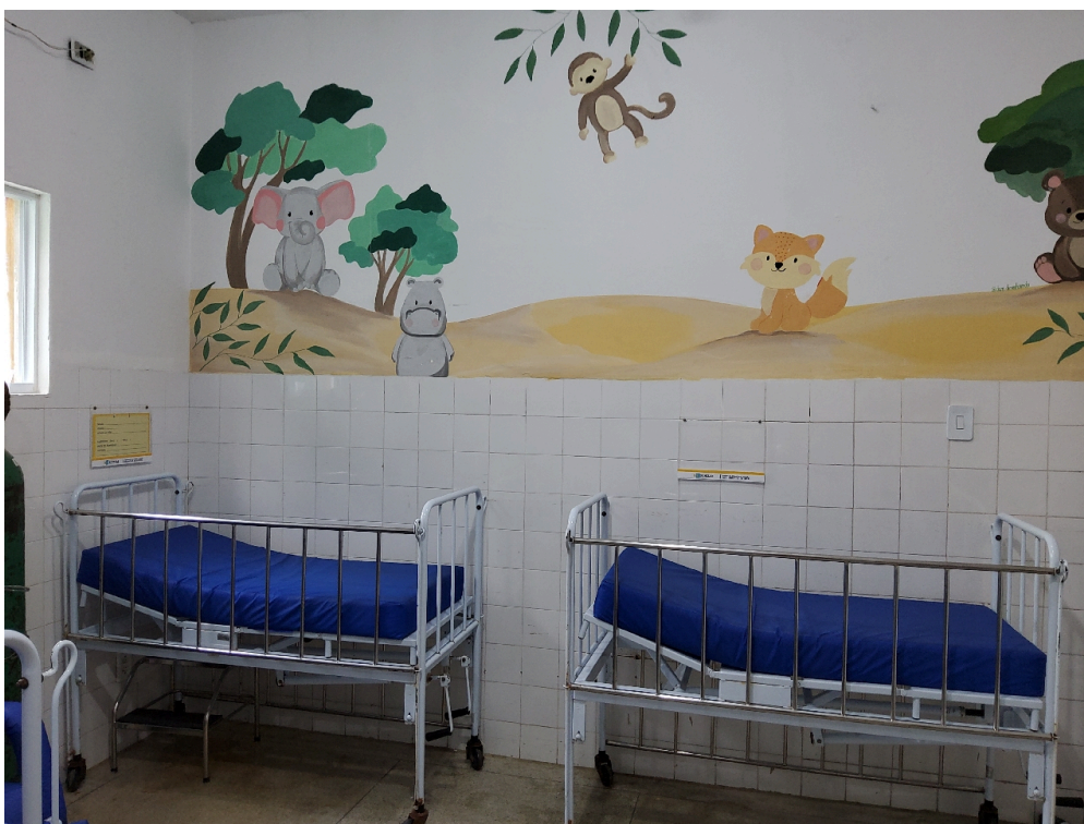
Enfermaria pediátrica (foto 2)