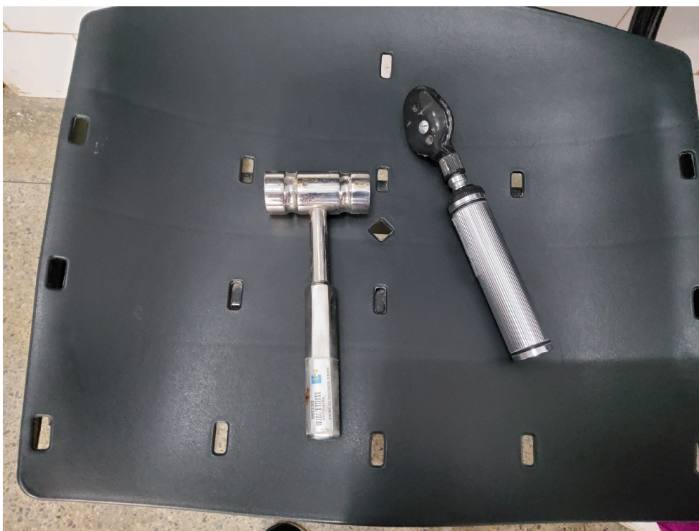
Oftalmoscópio e martelo para exame neurológico