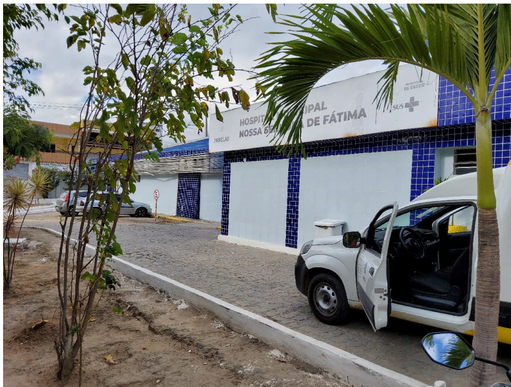
Hospital Municipal Nossa Senhora de Fátima