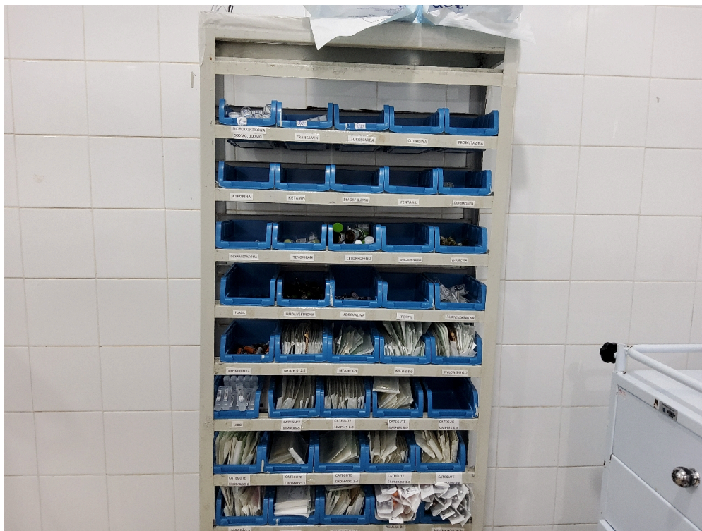
Medicamentos e insumos