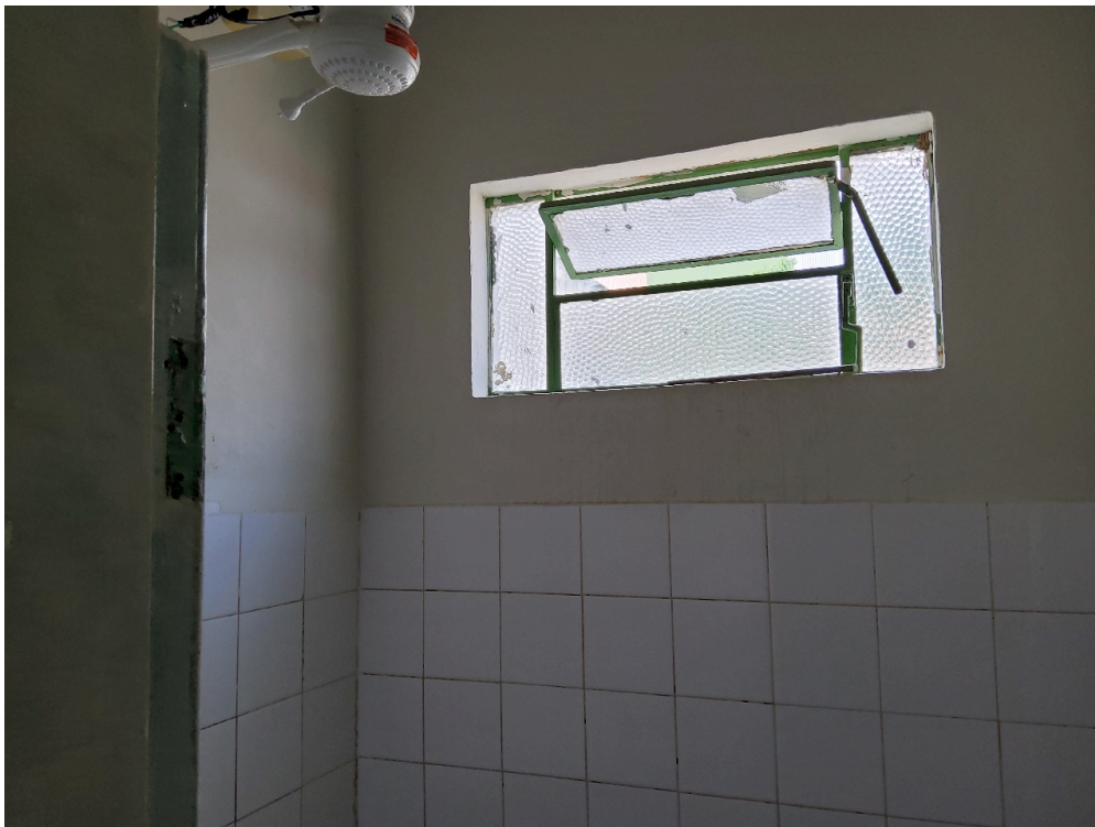
Banheiro da enfermaria (foto 3)