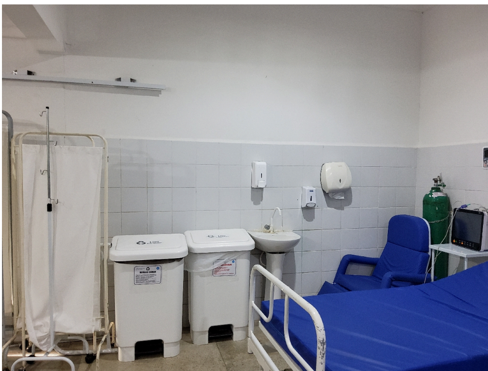
Sala vermelha (foto 2)