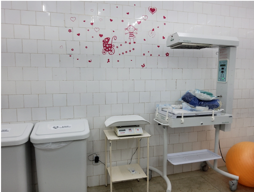
Sala de parto (foto 3)