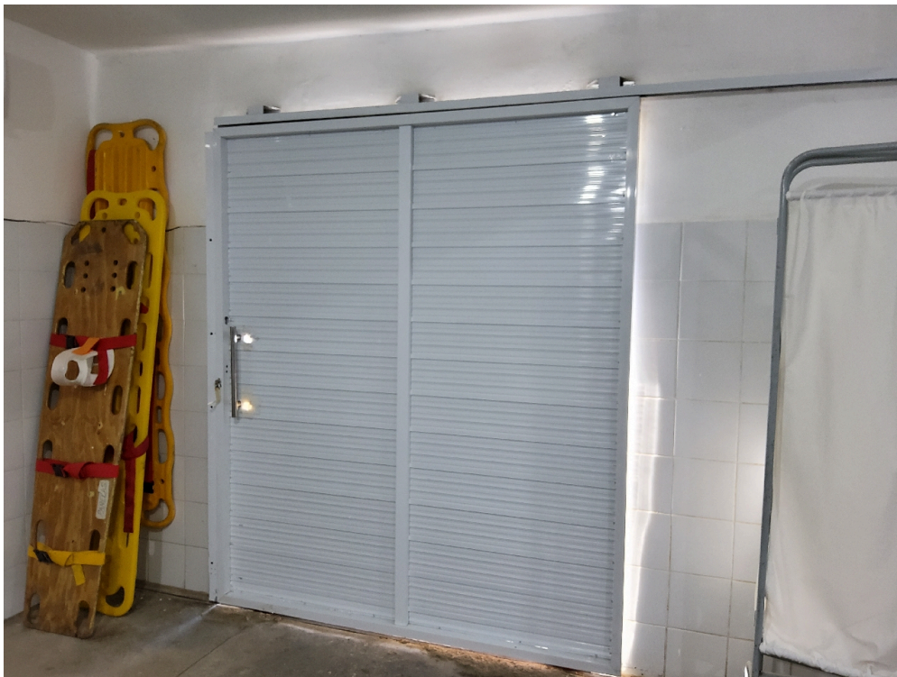
Sala vermelha (foto 3)