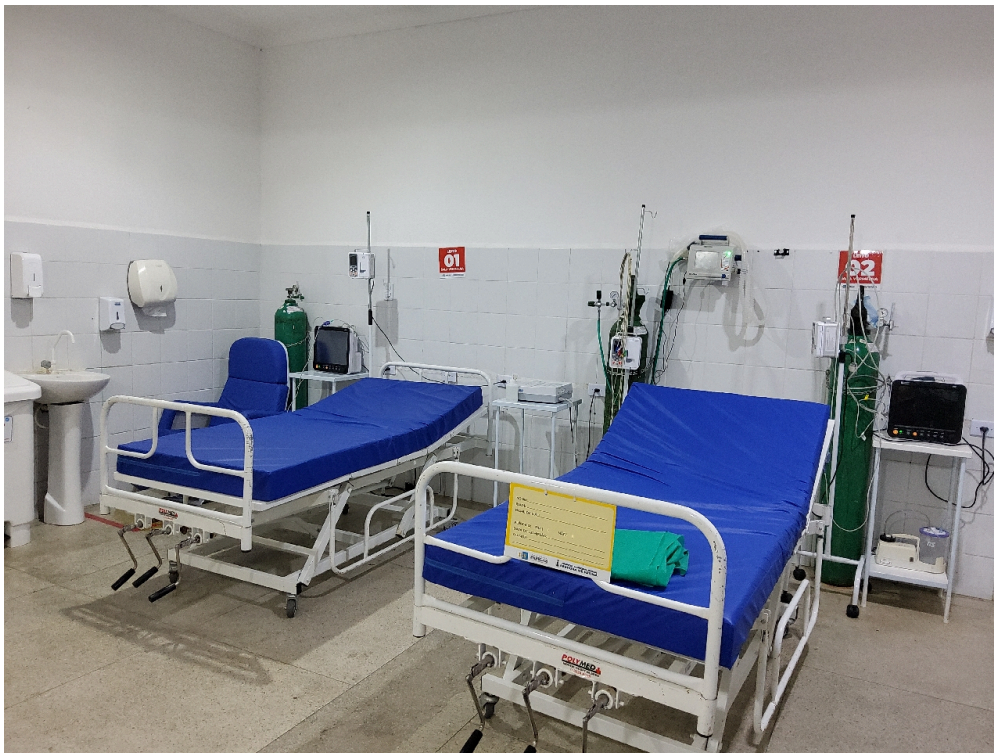
Sala vermelha (foto 1)