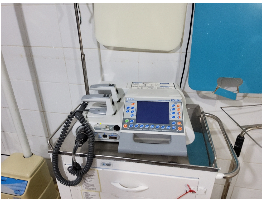
Sala vermelha (foto 4)