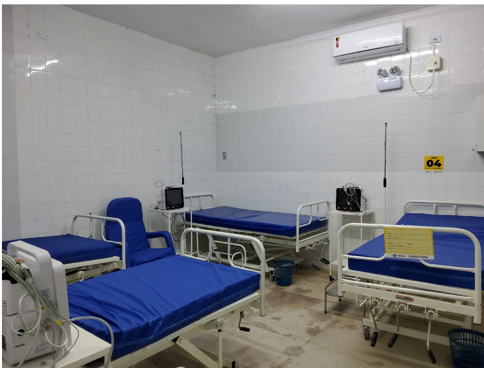
Sala de recuperação pós-anestésica