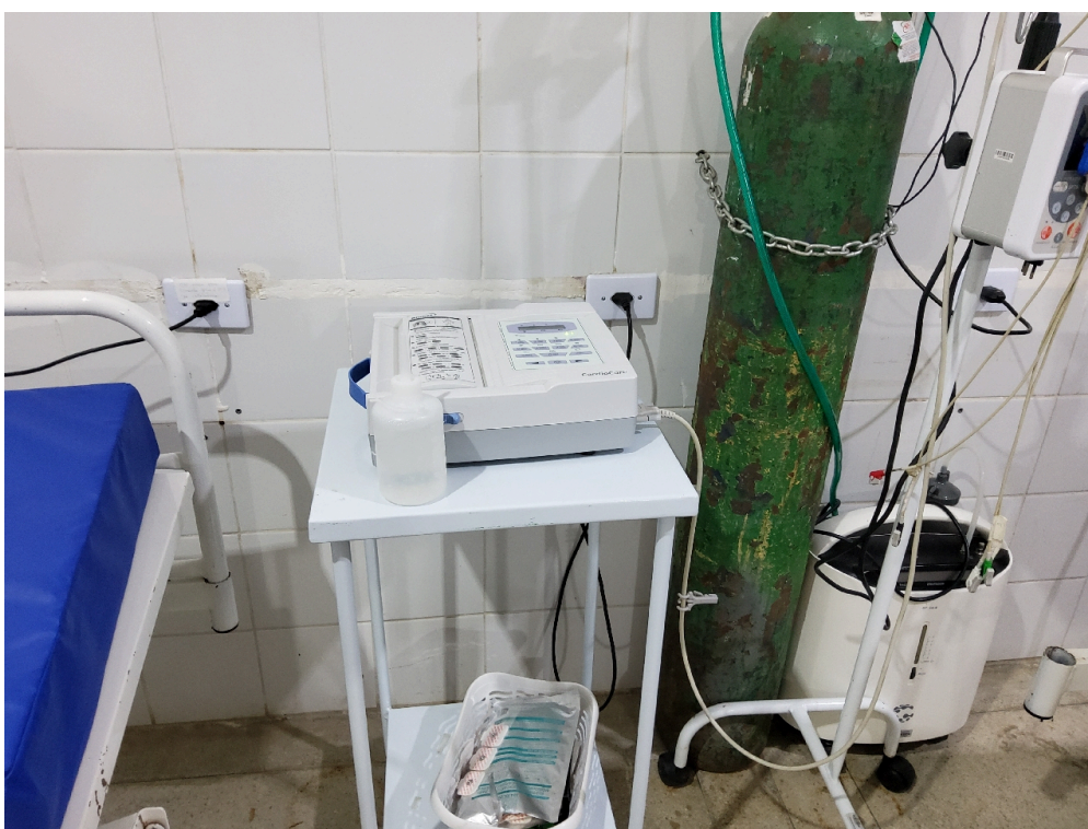
Sala vermelha (foto 6)