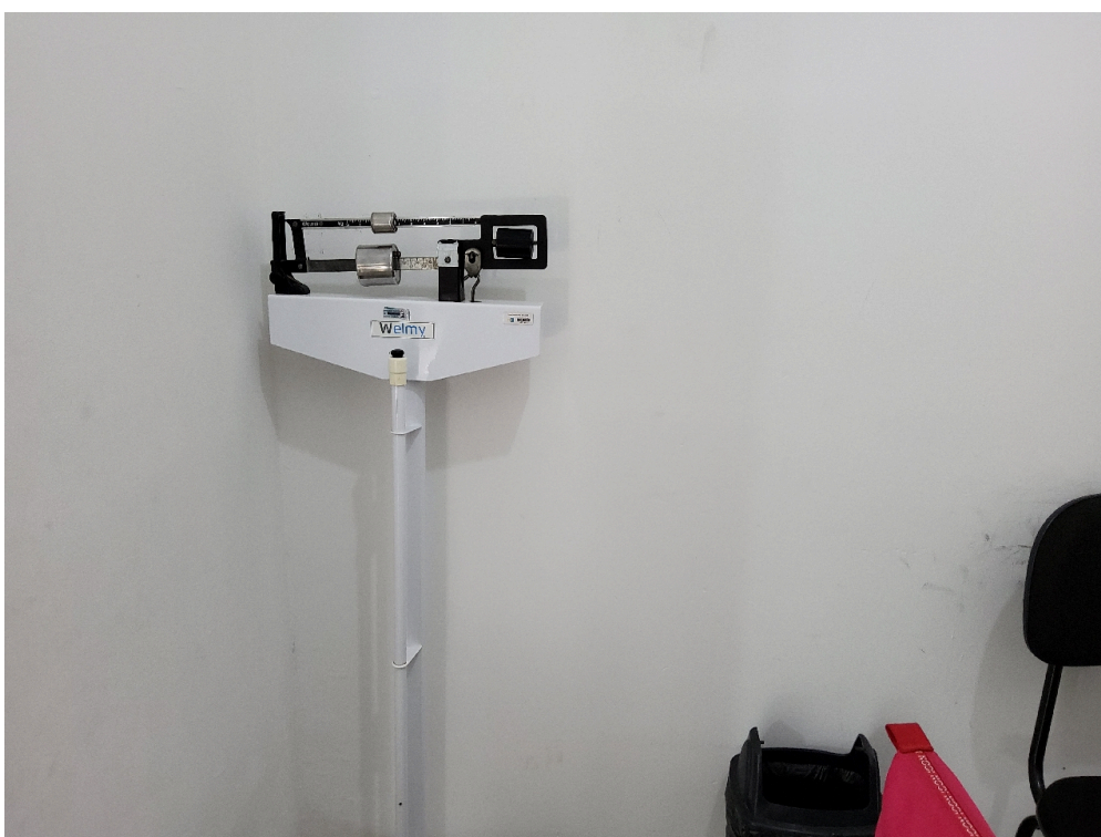
Classificação de risco - sem pia (foto 2)