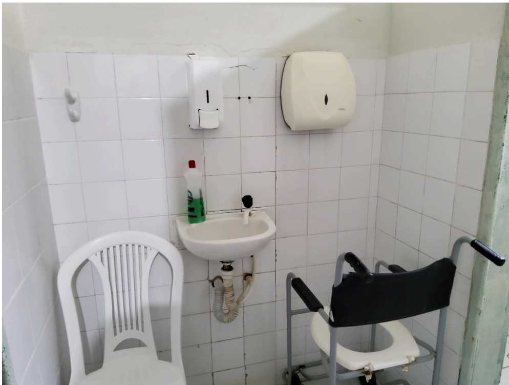
Banheiro da enfermaria (foto 1)