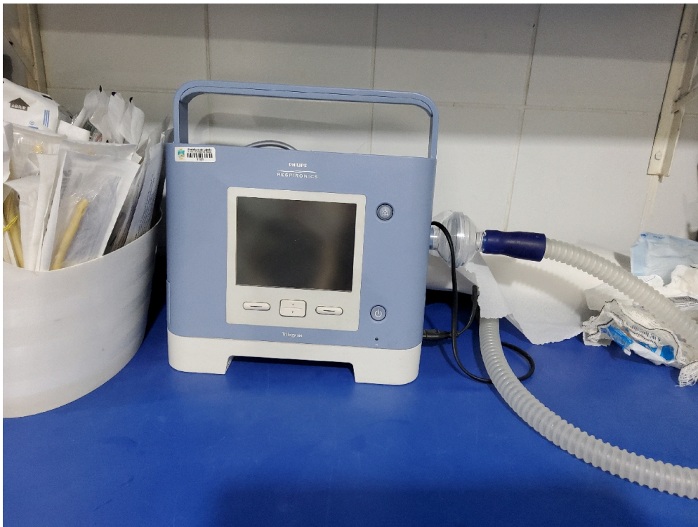
Sala vermelha (foto 5)