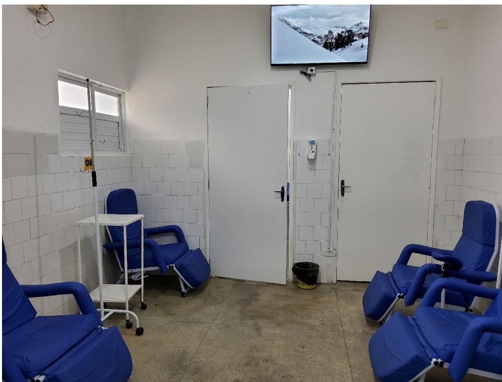
Sala de observação