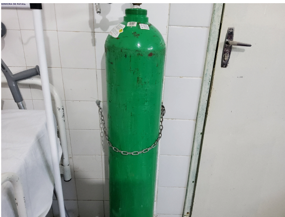
Cilindro fixo à parede