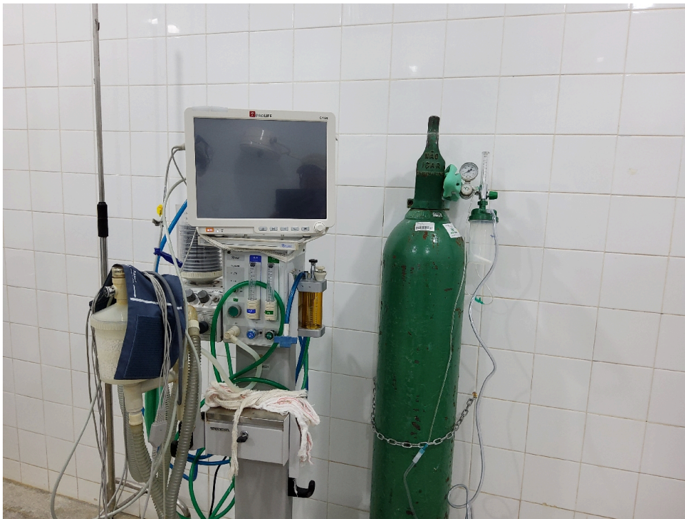
Carrinho de anestesia