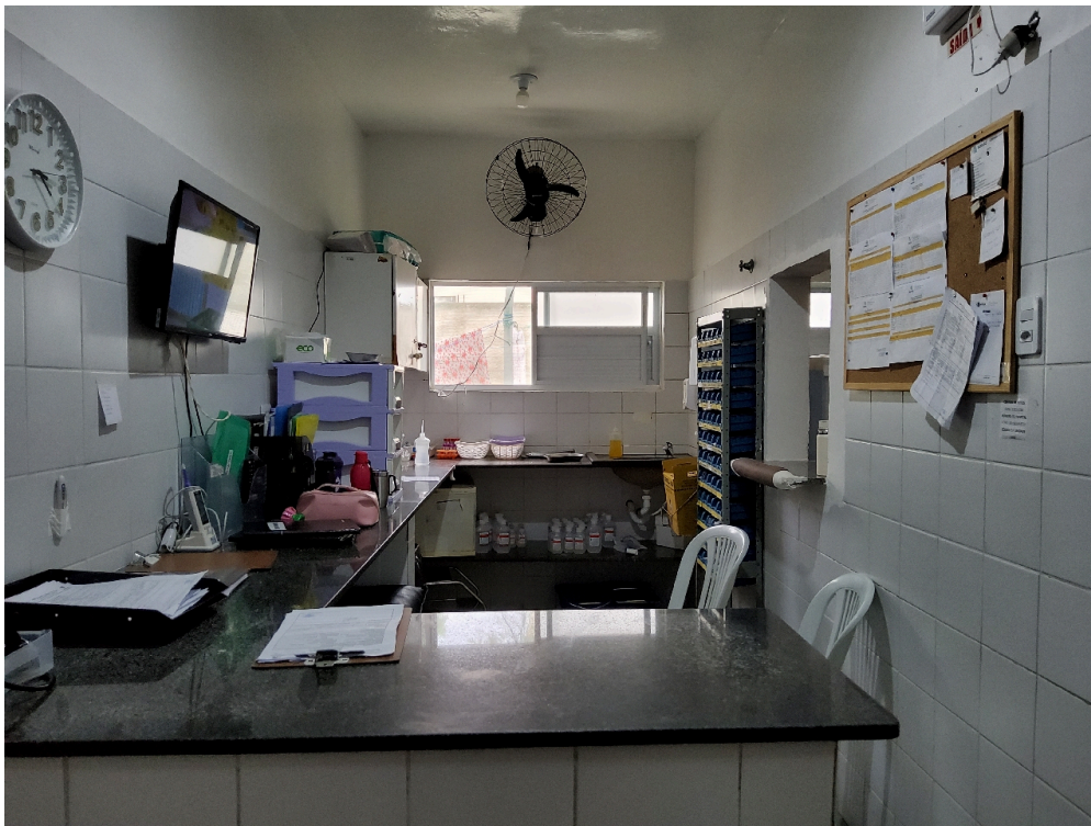
Posto de enfermagem comum (emergência e enfermaria)