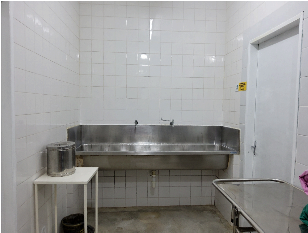
Área de escovação