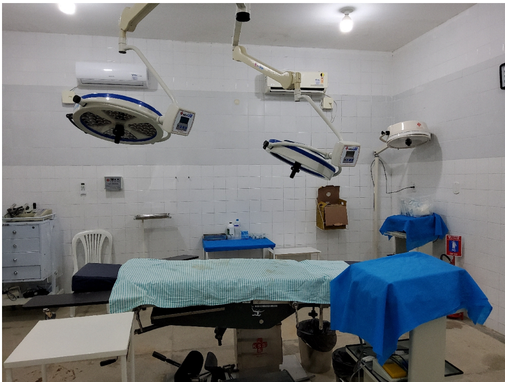
Sala de cirurgia