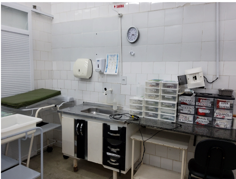
Sala de parto (foto 2)