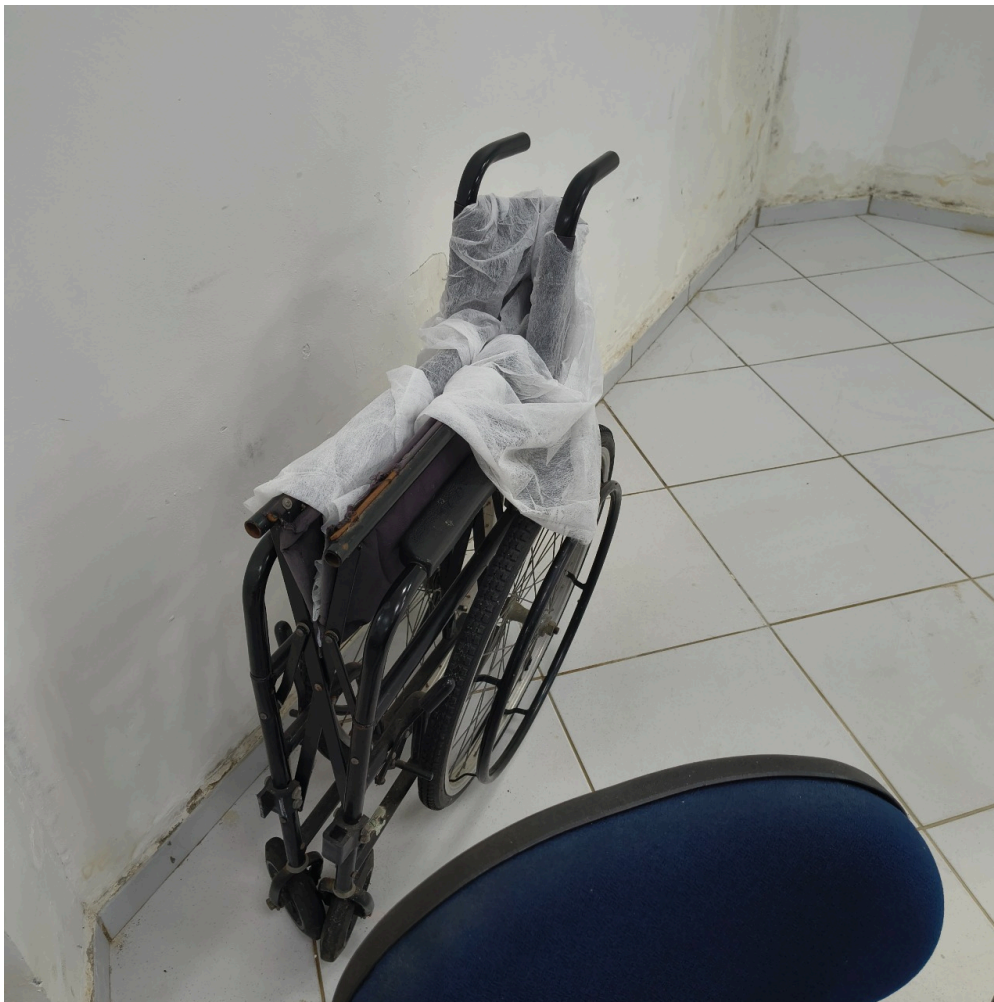
Cadeira de rodas para usuários cadeirantes