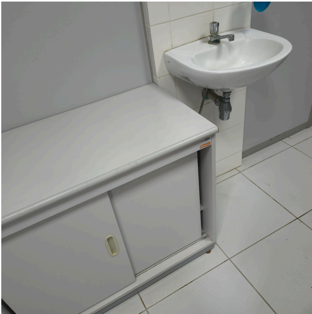
Pia sem toalha de papel no consultório 01. O sabão líquido está em dispensador obsoleto