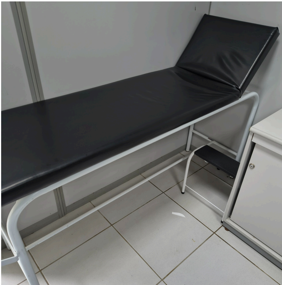
Maca do consultório 01