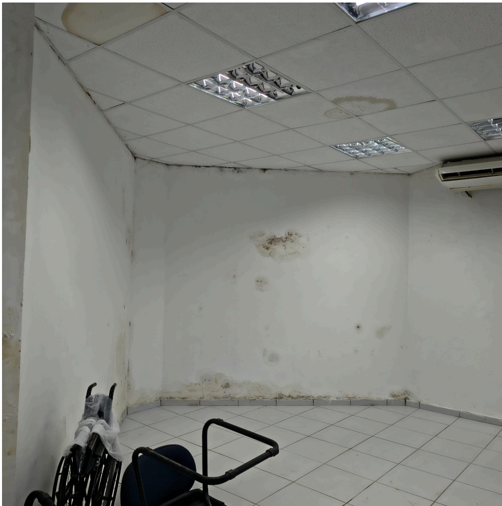
Parede com infiltrações e mofo