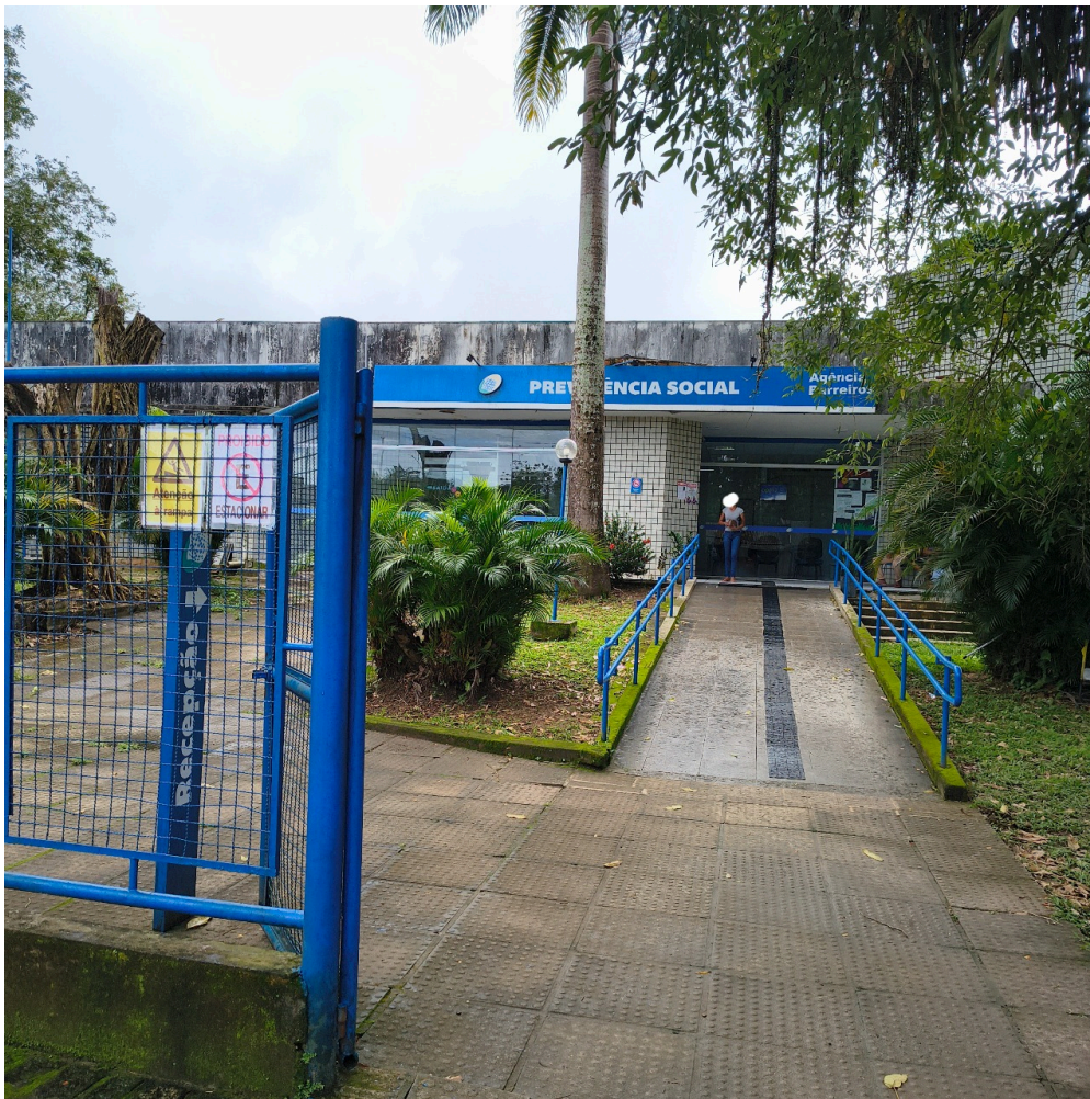
DADOS CADASTRAIS - Registro Fotográfico da Fachada