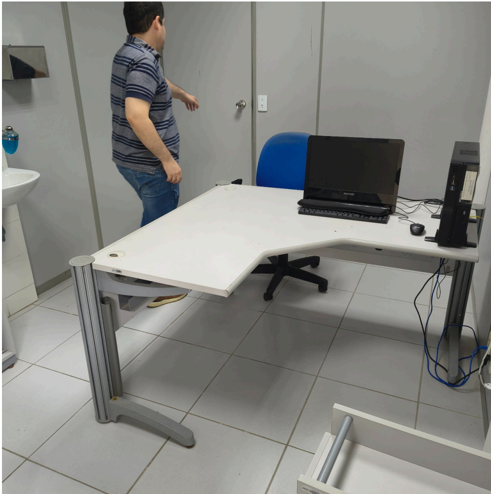
Consultório 01 (ainda sem operação)