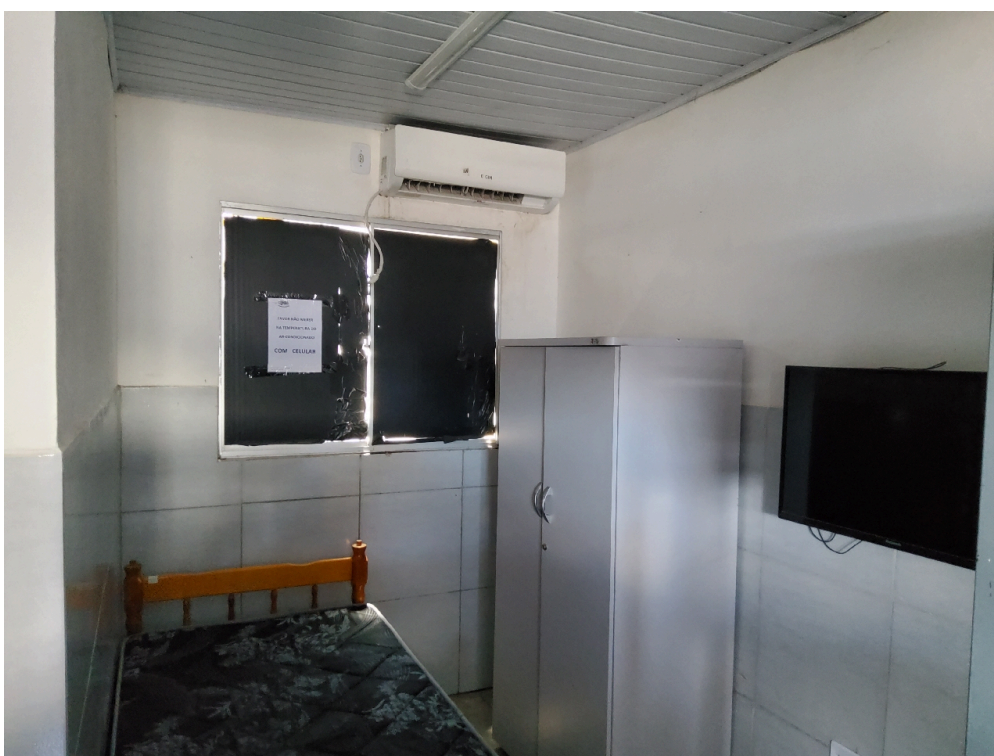
REPOUSO MÉDICO - Quarto para o médico plantonista