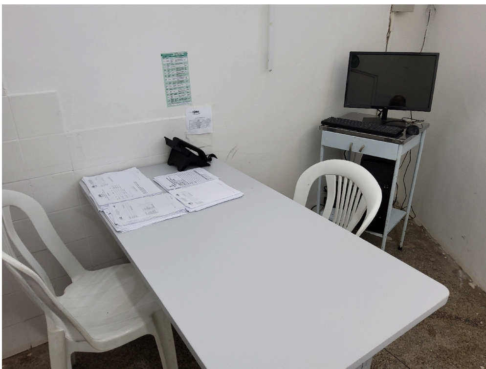
ESTRUTURA DA UNIDADE - Consultório Médico