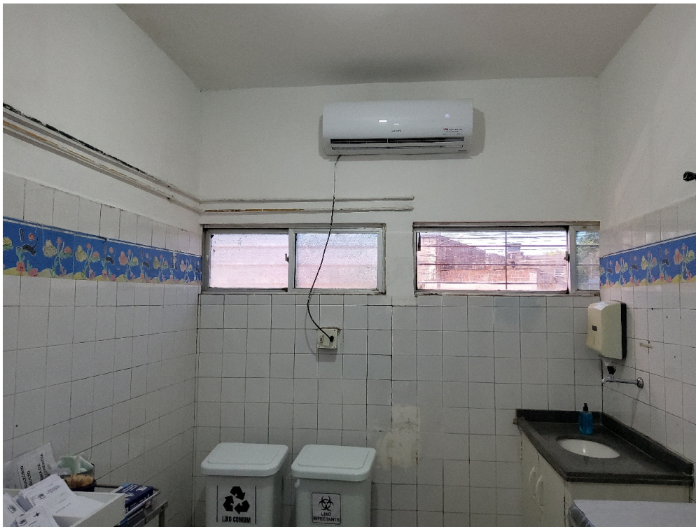
ESTRUTURA DA UNIDADE - Consultório Médico