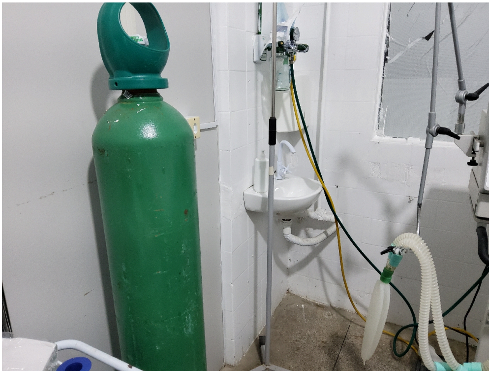
ESTRUTURA DA UNIDADE - Sala de Reanimação e Estabilização de Pacientes Graves