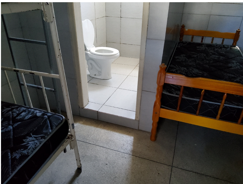
REPOUSO MÉDICO - Quarto para o médico plantonista