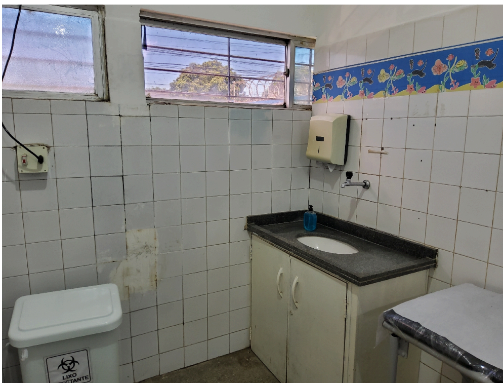
ESTRUTURA DA UNIDADE - Consultório Médico