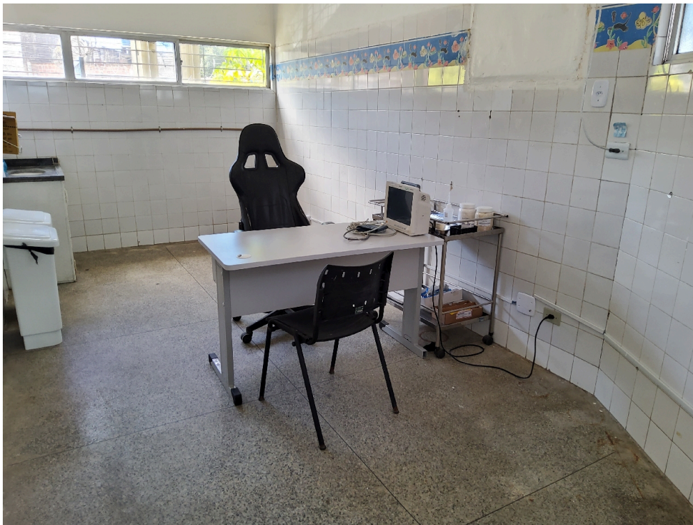
ESTRUTURA DA UNIDADE - Sala de Classificação de Risco