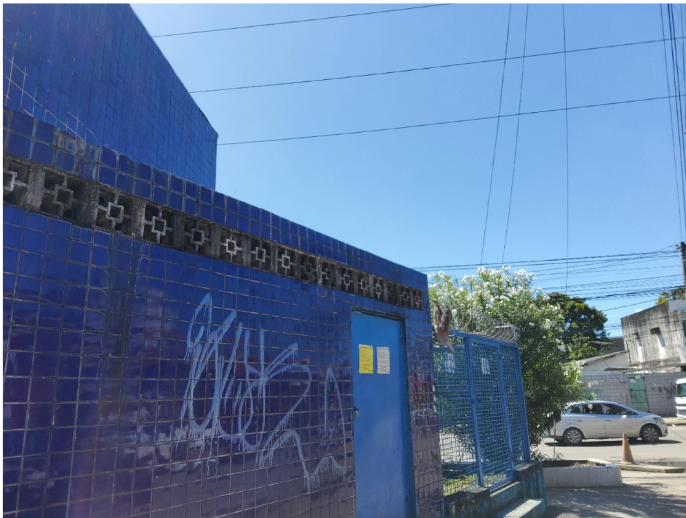
DADOS CADASTRAIS - Registro Fotográfico da Fachada