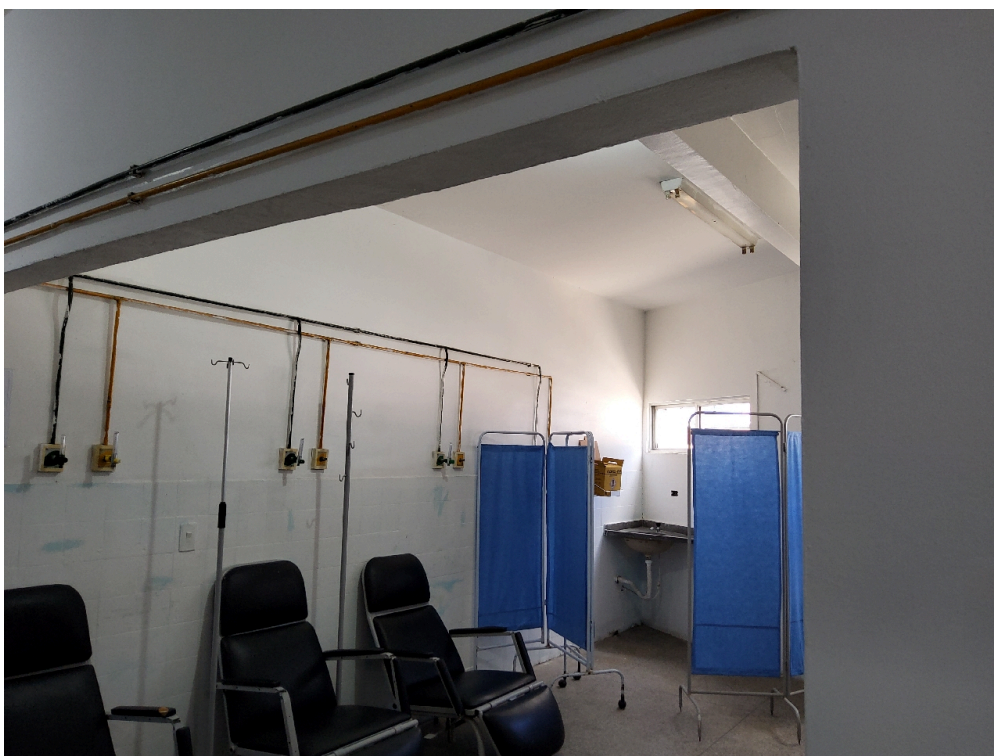
ESTRUTURA DA UNIDADE - Sala de Medicação