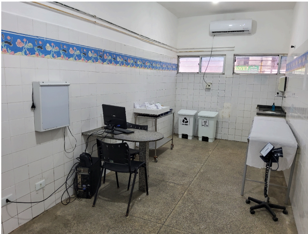
ESTRUTURA DA UNIDADE - Consultório Médico