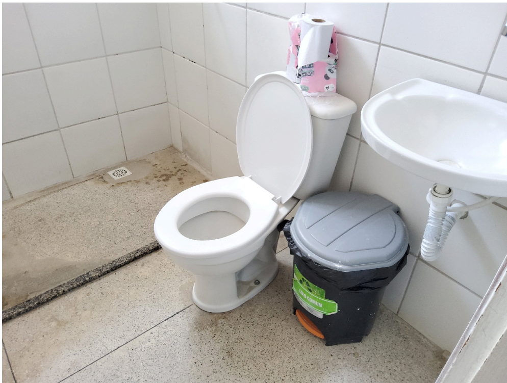
REPOUSO MÉDICO - Sanitário