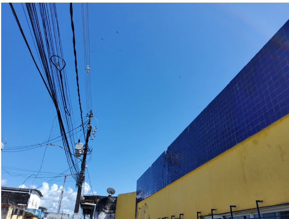
DADOS CADASTRAIS - Registro Fotográfico da Fachada