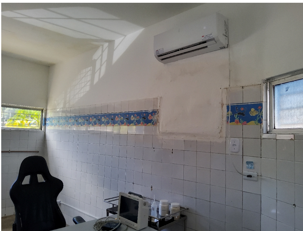
ESTRUTURA DA UNIDADE - Sala de Classificação de Risco