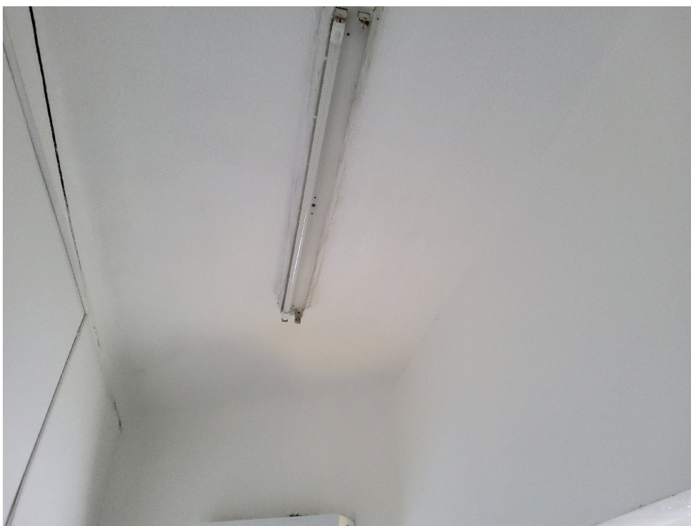
ESTRUTURA DA UNIDADE - Consultório Médico