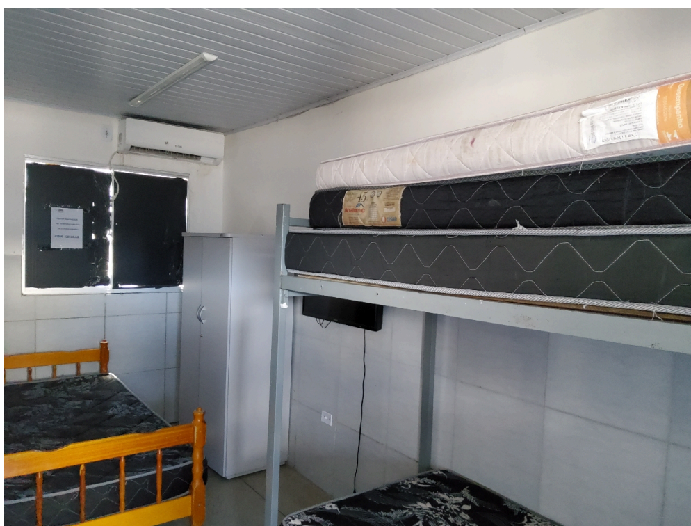
REPOUSO MÉDICO - Quarto para o médico plantonista