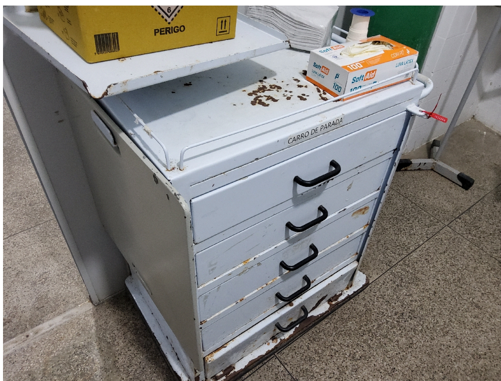
ESTRUTURA DA UNIDADE - Sala de Reanimação e Estabilização de Pacientes Graves