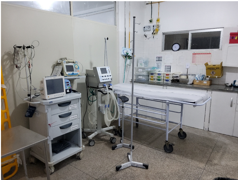
ESTRUTURA DA UNIDADE - Sala de Reanimação e Estabilização de Pacientes Graves