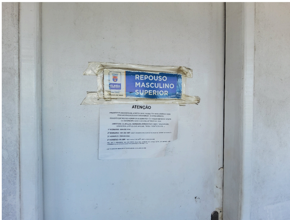
REPOUSO MÉDICO - Quarto para o médico plantonista