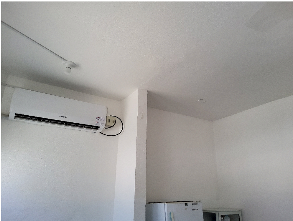
ESTRUTURA DA UNIDADE - Sala de Observação por critério de gravidade