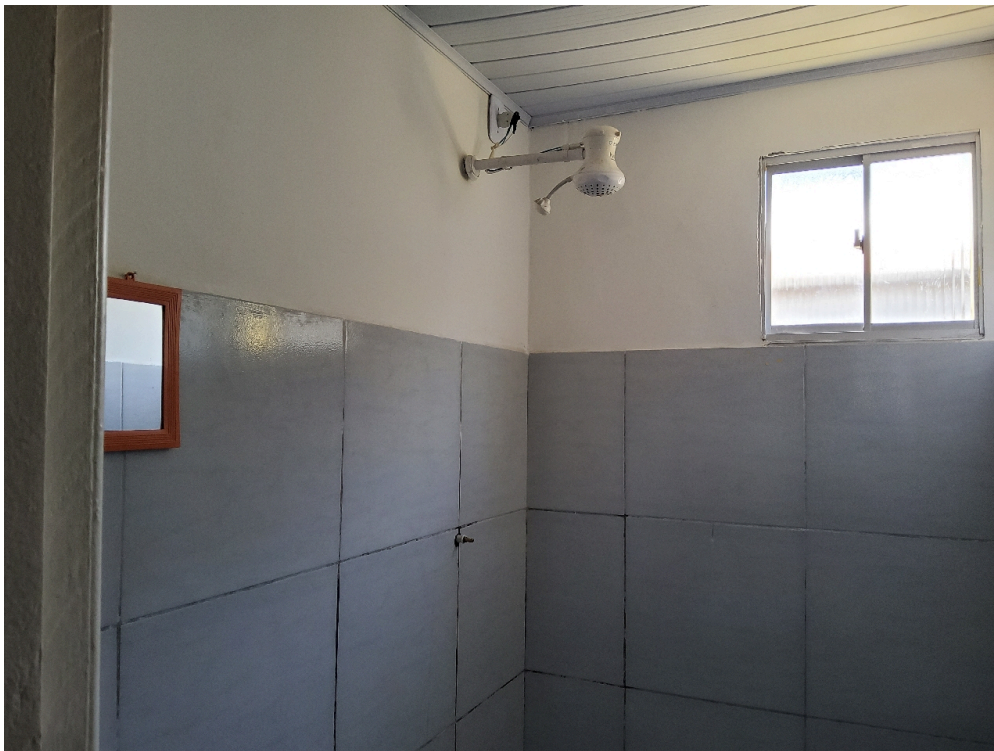
REPOUSO MÉDICO - Chuveiro