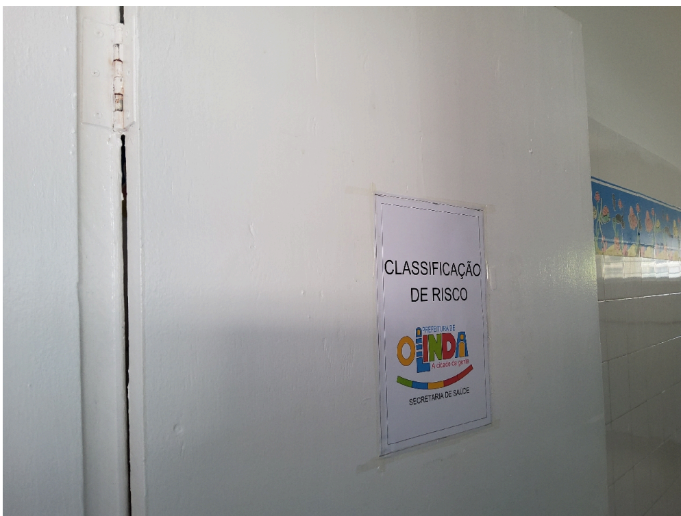
ESTRUTURA DA UNIDADE - Mínimo de dois leitos