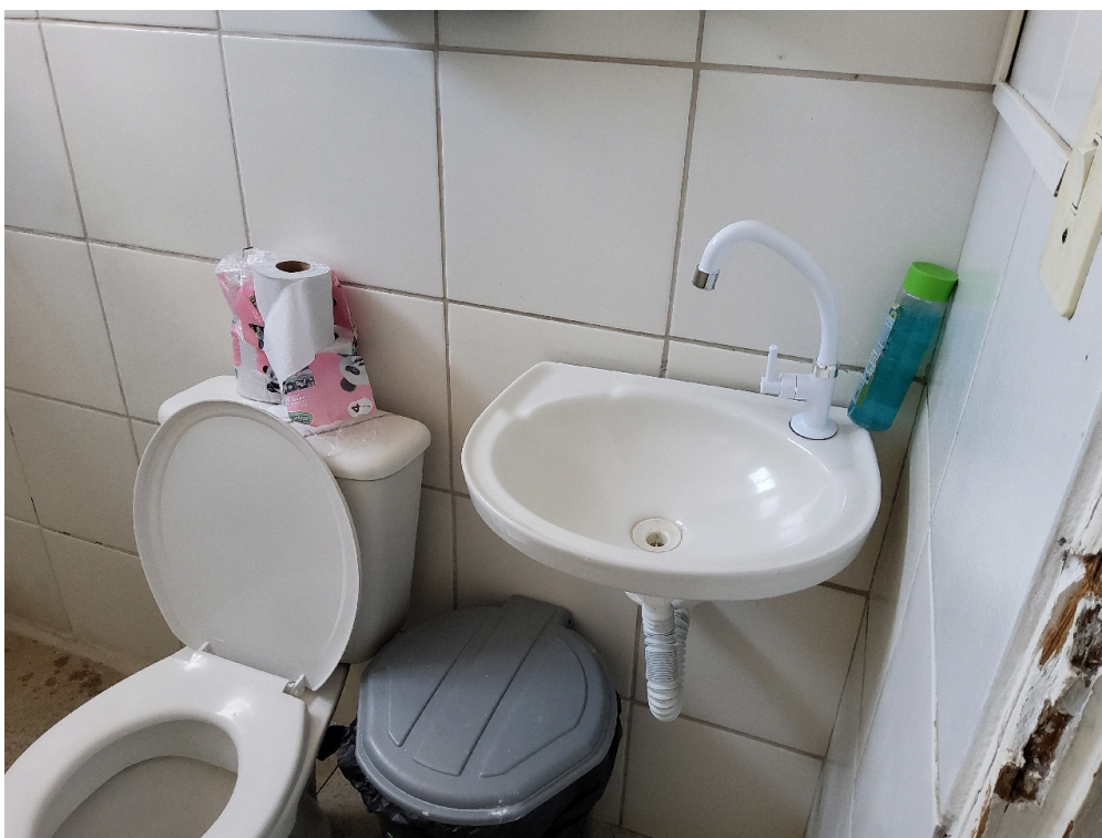
REPOUSO MÉDICO - Pia