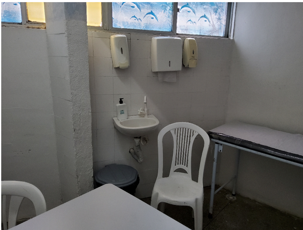
ESTRUTURA DA UNIDADE - Consultório Médico