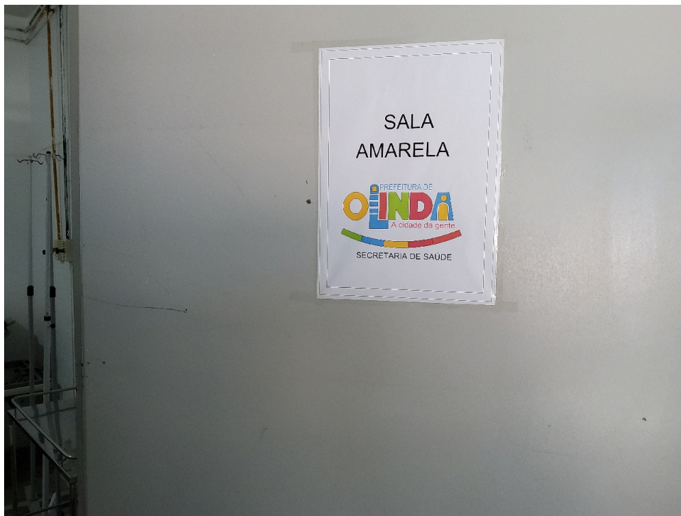
ESTRUTURA DA UNIDADE - Sala de Observação