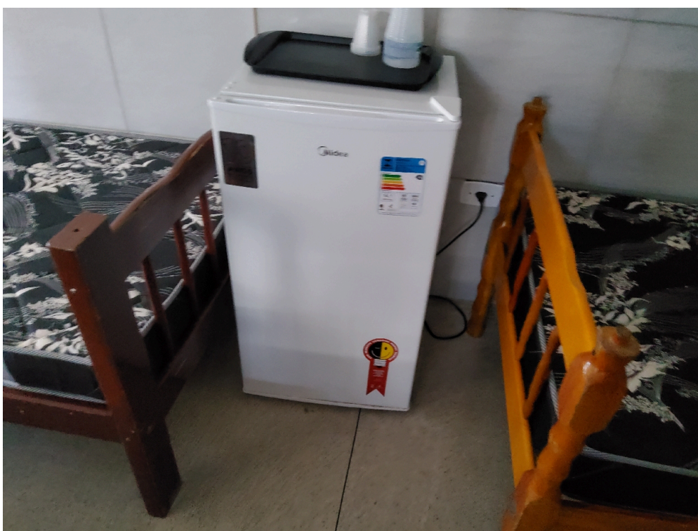
REPOUSO MÉDICO - Geladeira ou frigobar