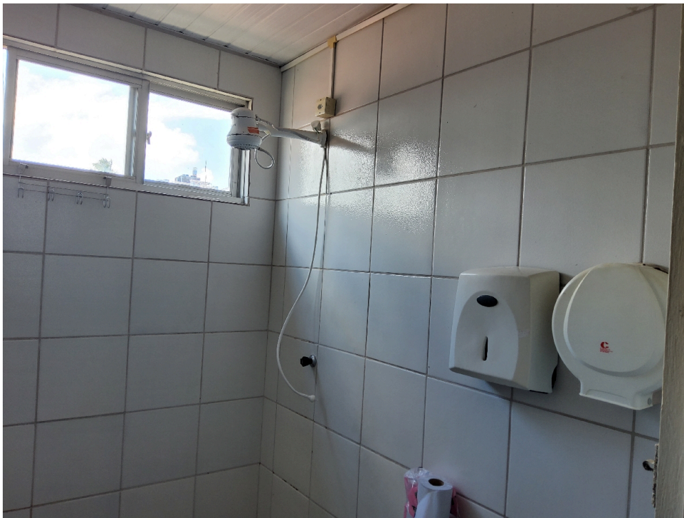
REPOUSO MÉDICO - Chuveiro