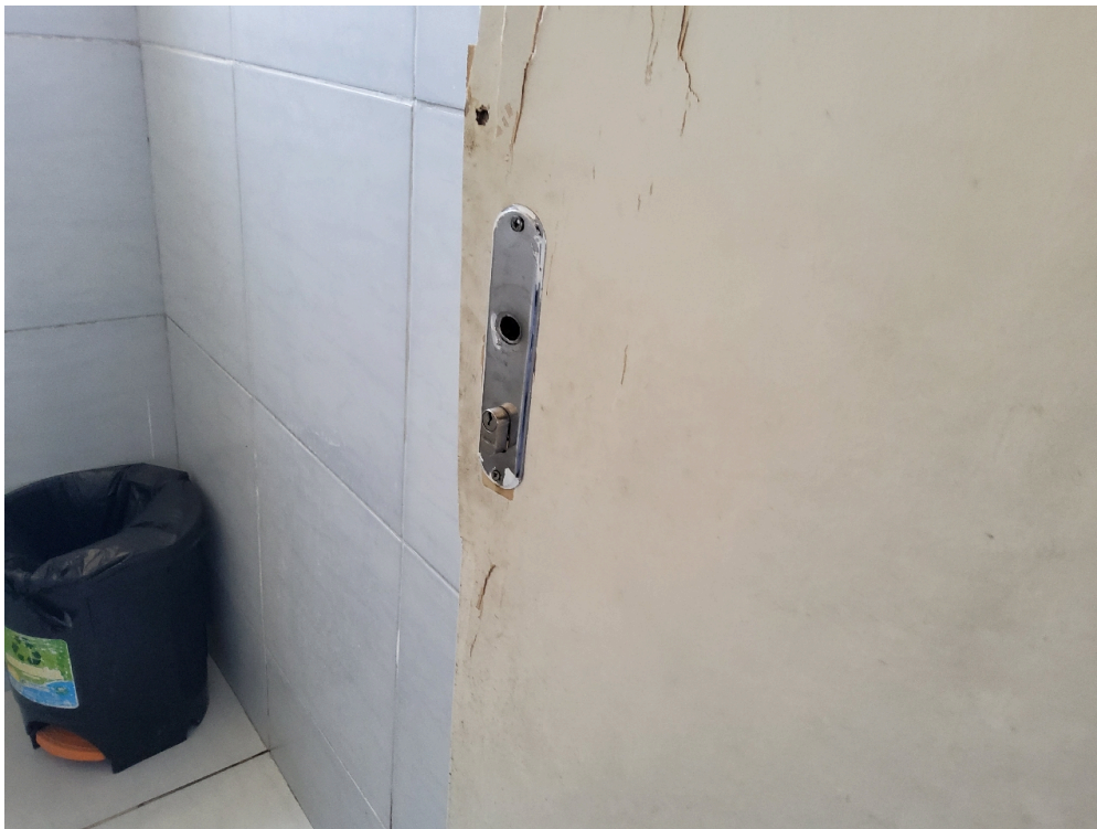
REPOUSO MÉDICO - Sanitário