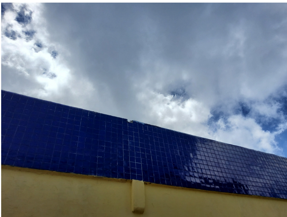
ESTRUTURA DA UNIDADE - Área externa para embarque e desembarque da ambulância é coberta