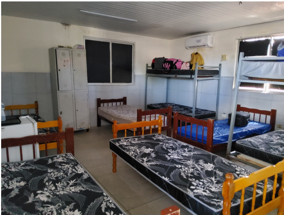
REPOUSO MÉDICO - Quarto para o médico plantonista