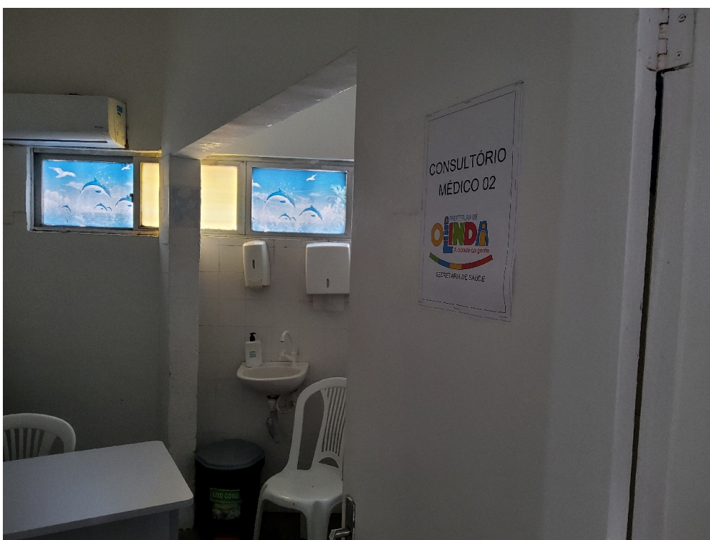
ESTRUTURA DA UNIDADE - Consultório Médico