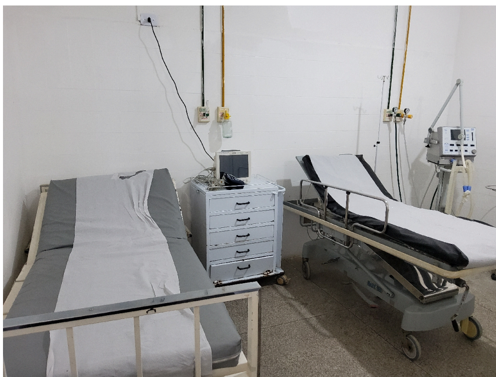
ESTRUTURA DA UNIDADE - Sala de Observação