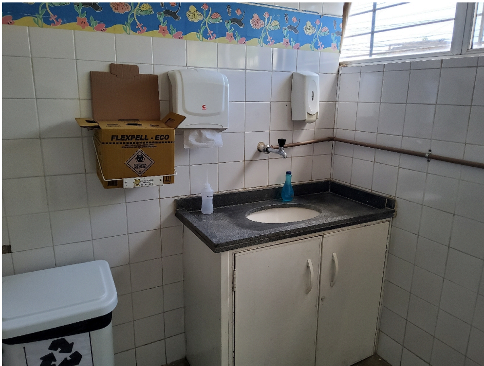
ESTRUTURA DA UNIDADE - Sala de Classificação de Risco