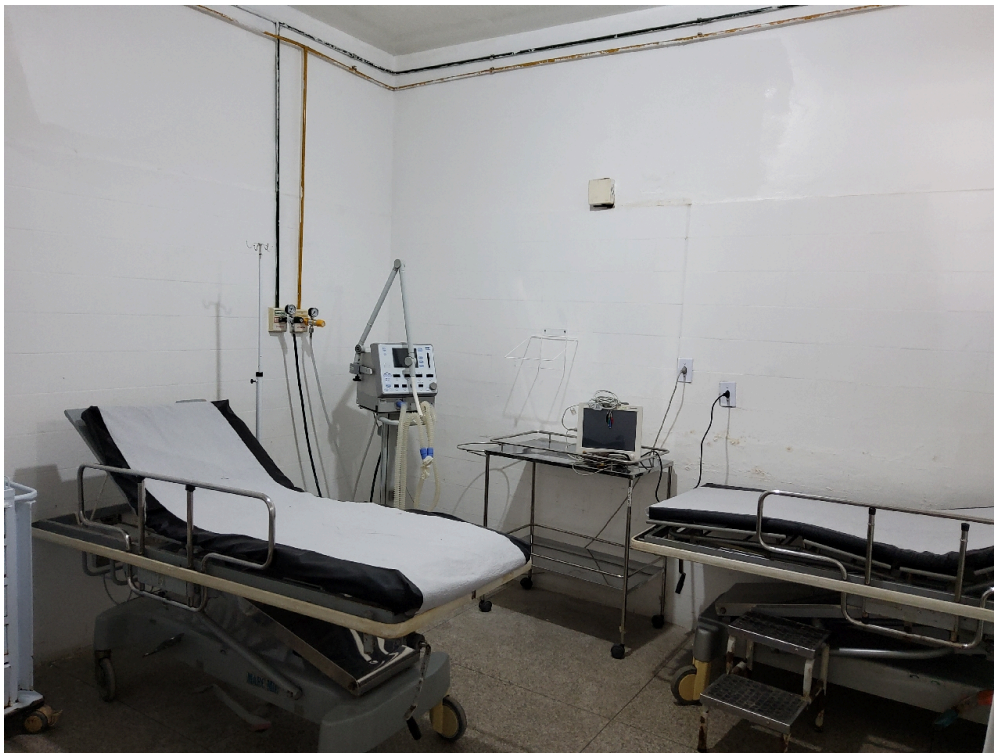
ESTRUTURA DA UNIDADE - Sala de Observação