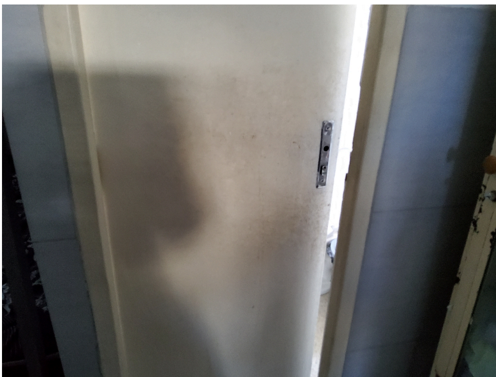
REPOUSO MÉDICO - Quarto para o médico plantonista