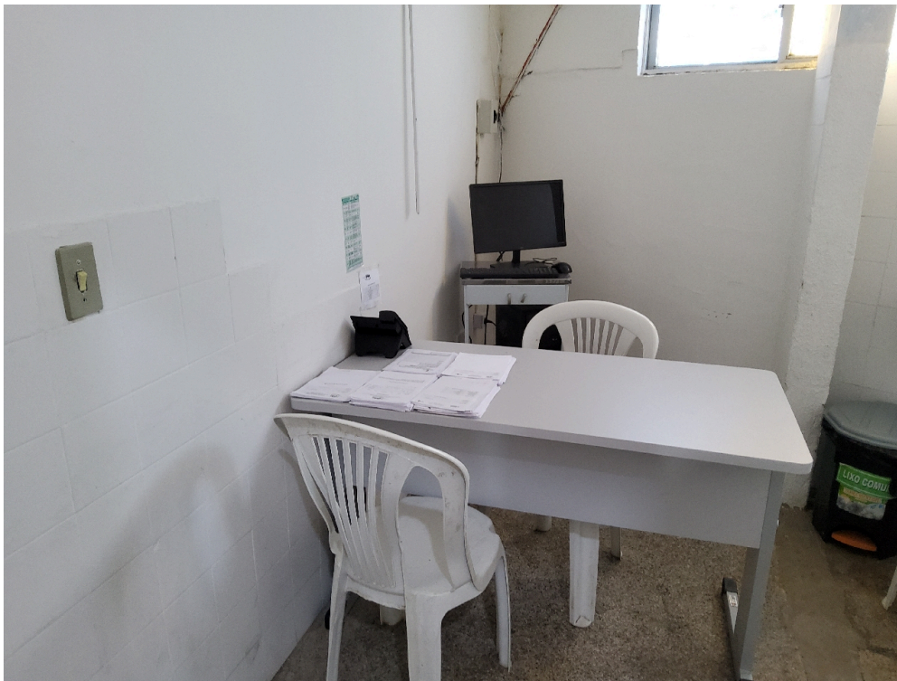
ESTRUTURA DA UNIDADE - Consultório Médico