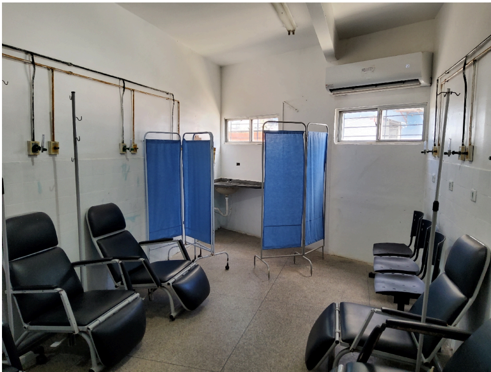
ESTRUTURA DA UNIDADE - Sala de Medicação