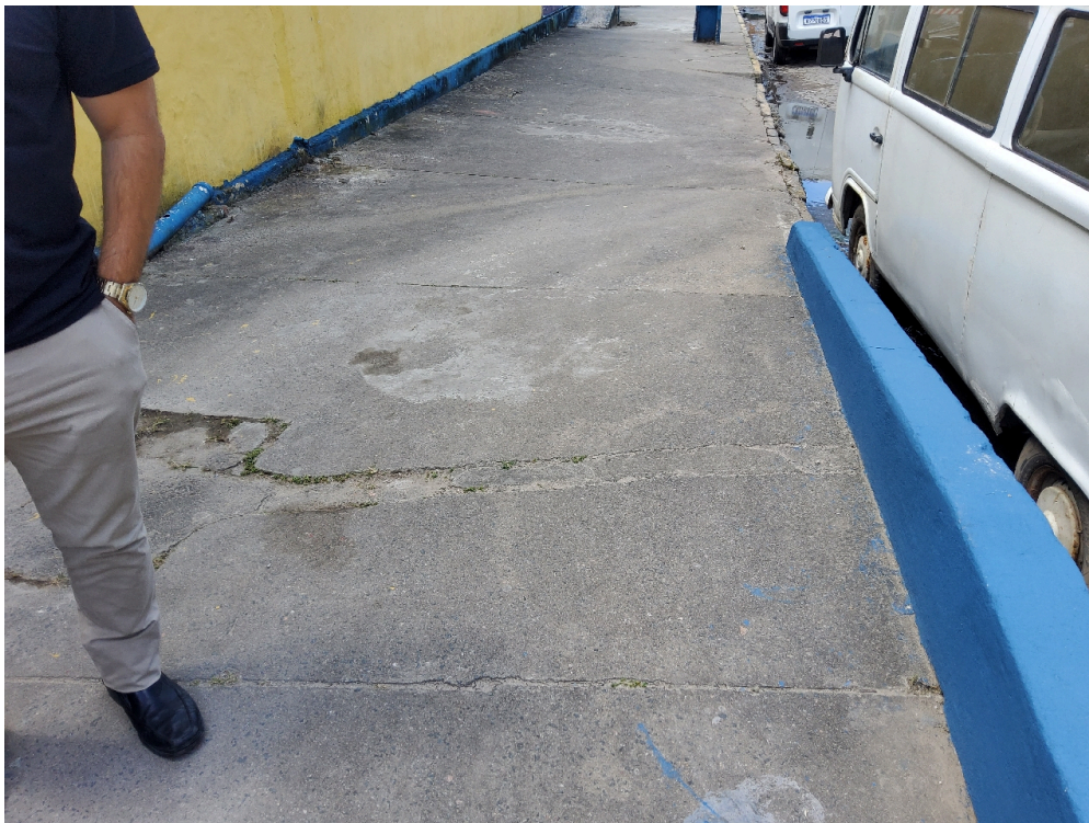
ESTRUTURA DA UNIDADE - Entrada da ambulância tem acesso ágil para a Sala de Reanimação e Estabilização de Pacientes Graves