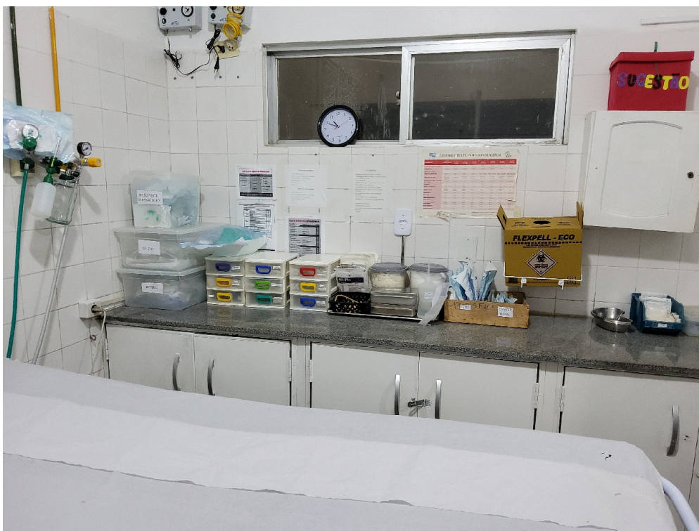
ESTRUTURA DA UNIDADE - Sala de Reanimação e Estabilização de Pacientes Graves