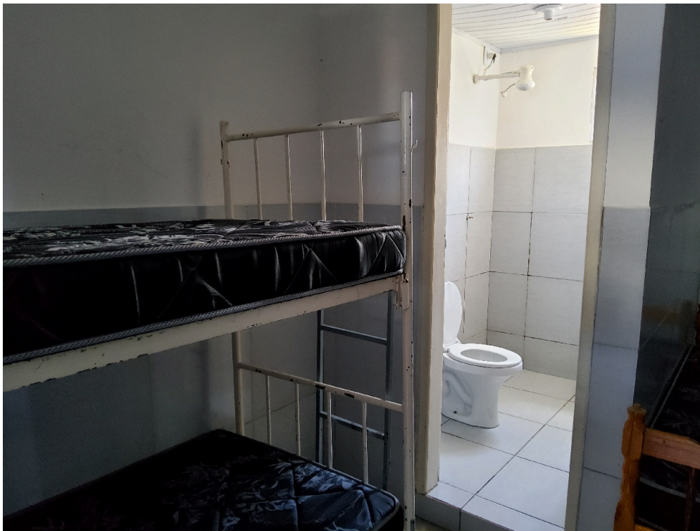
REPOUSO MÉDICO - Quarto para o médico plantonista