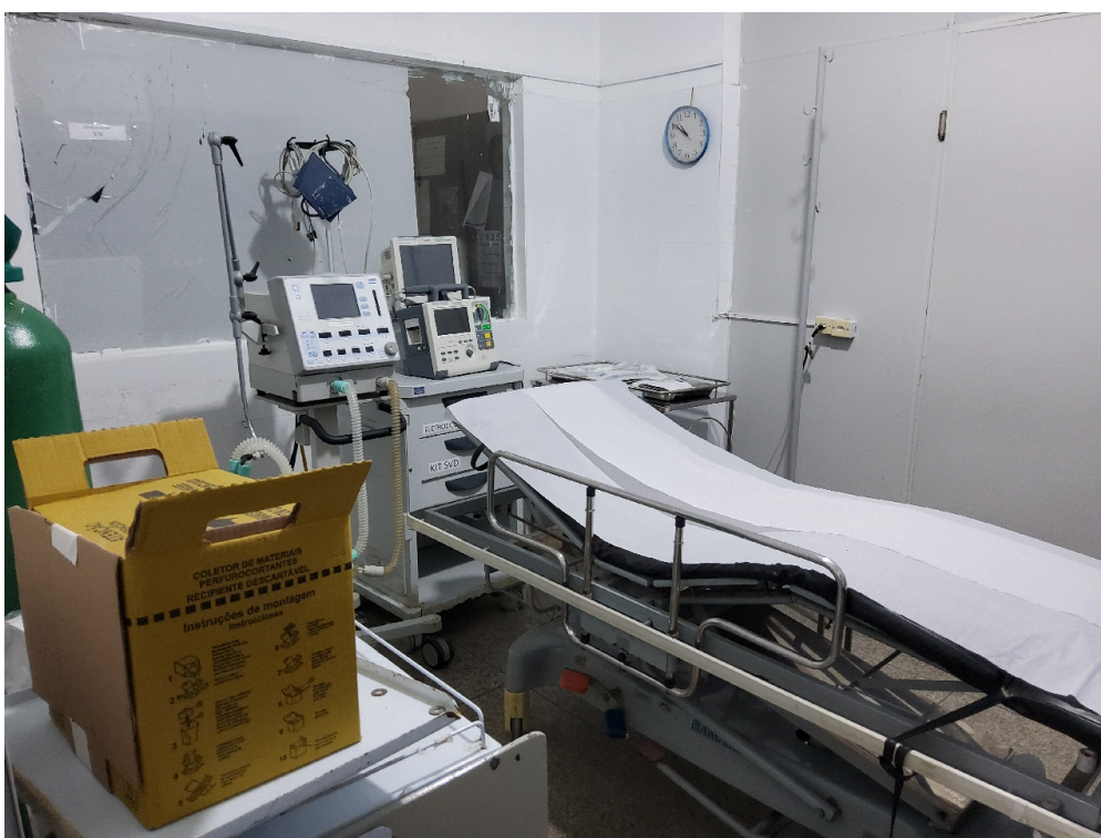
ESTRUTURA DA UNIDADE - Sala de Reanimação e Estabilização de Pacientes Graves