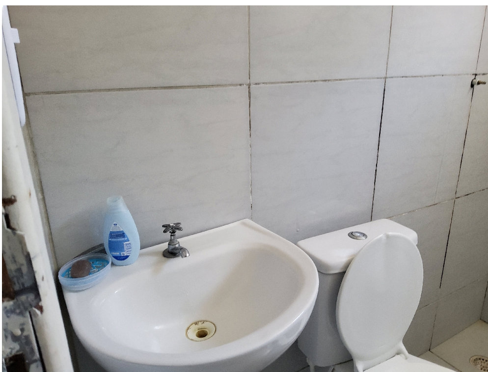
REPOUSO MÉDICO - Pia