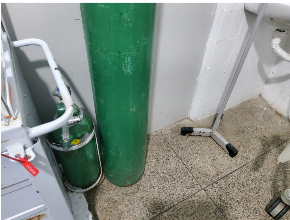
ESTRUTURA DA UNIDADE - Sala de Reanimação e Estabilização de Pacientes Graves