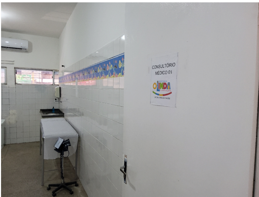
ESTRUTURA DA UNIDADE - Consultório Médico