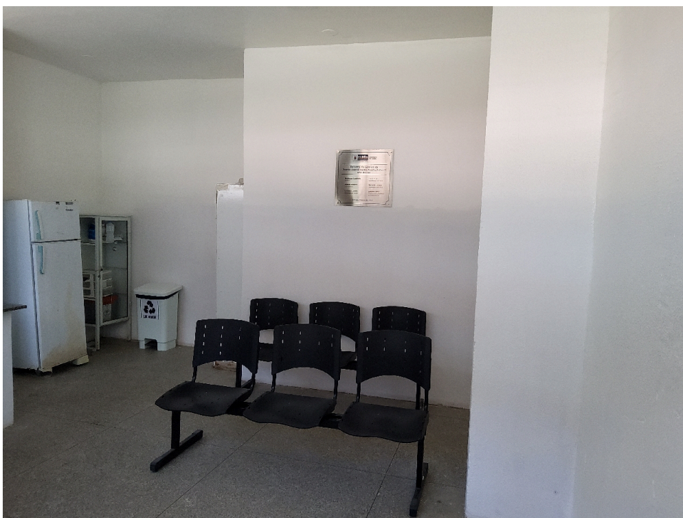
ESTRUTURA DA UNIDADE - Sala de Observação por critério de gravidade