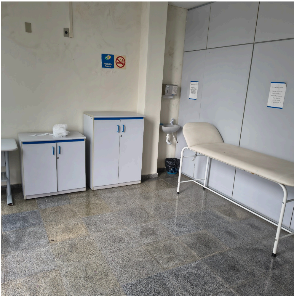
consultório médico para perícias presenciais sem uso