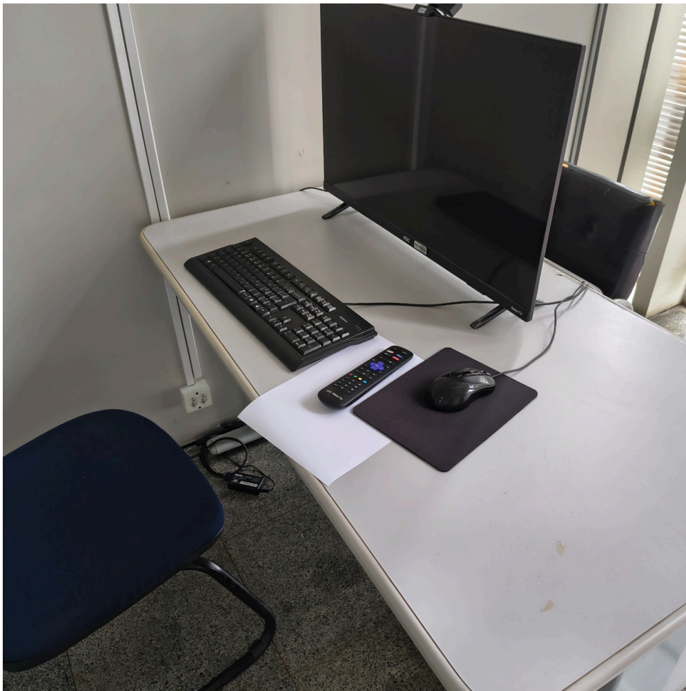
mesa de trabalho do consultório médico