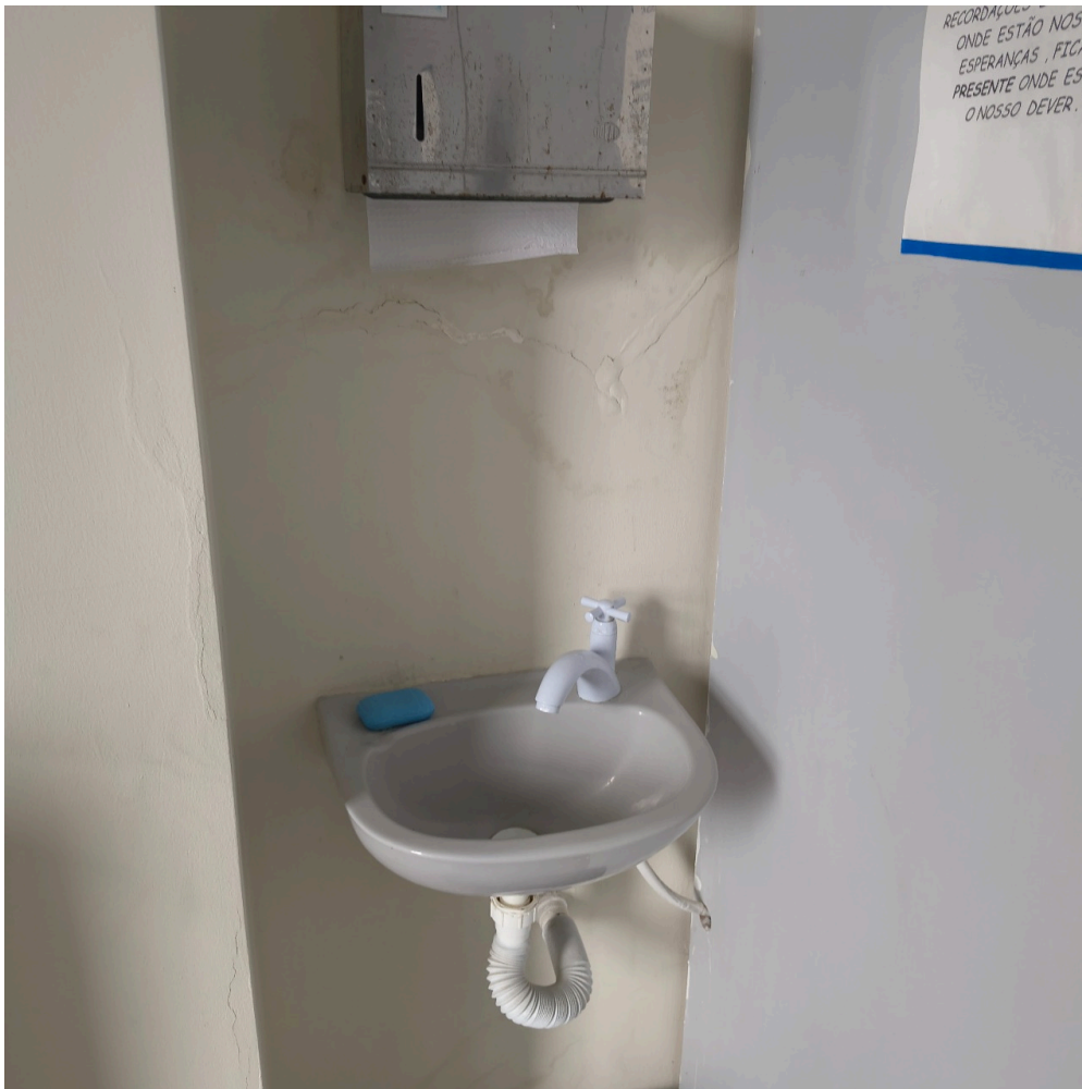
pia no consultório médico com área apresentando infiltração na parede