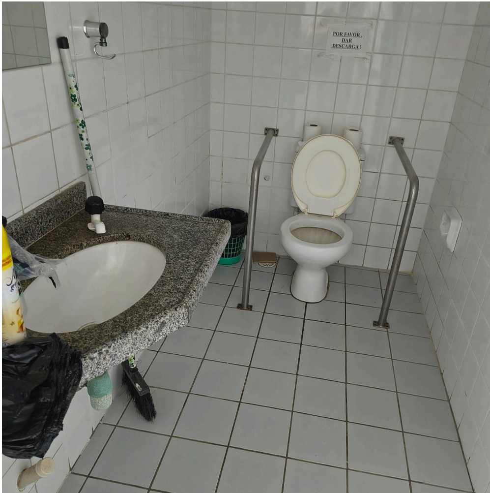
a agência do INSS conta com banheiro para cadeirantes