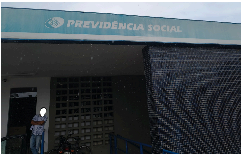
DADOS CADASTRAIS - Registro Fotográfico da Fachada