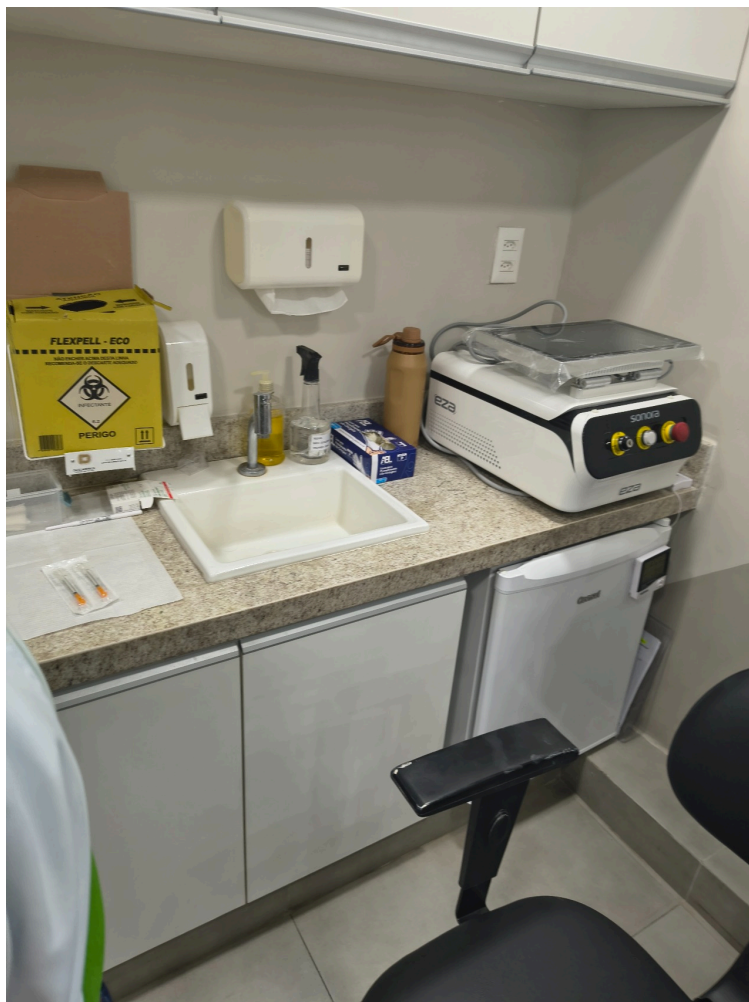
Pia, sabão e equipamento na Sala 1