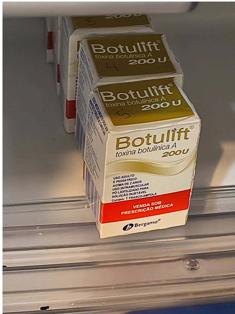
Frascos de toxina botulínica guardados na geladeira