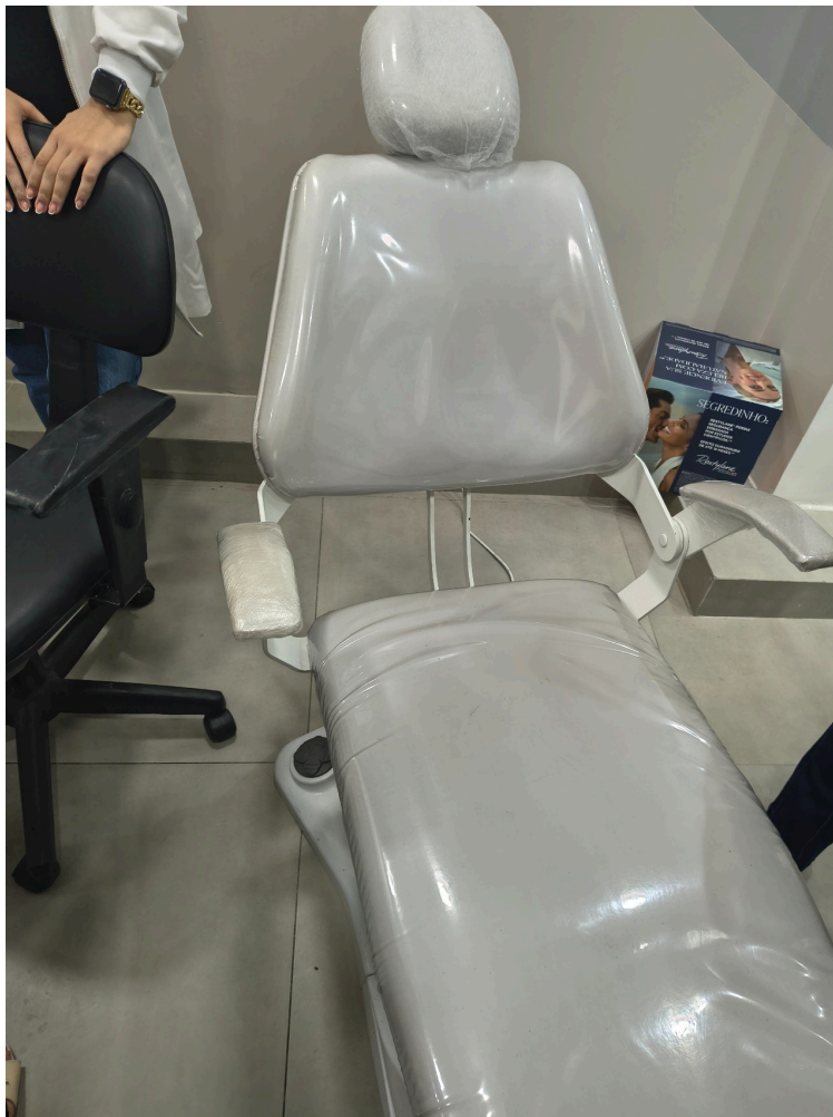
Esta é a Sala 1, onde estão sendo realizados a maior parte dos atendimentos. Em destaque a maca com material impermeável