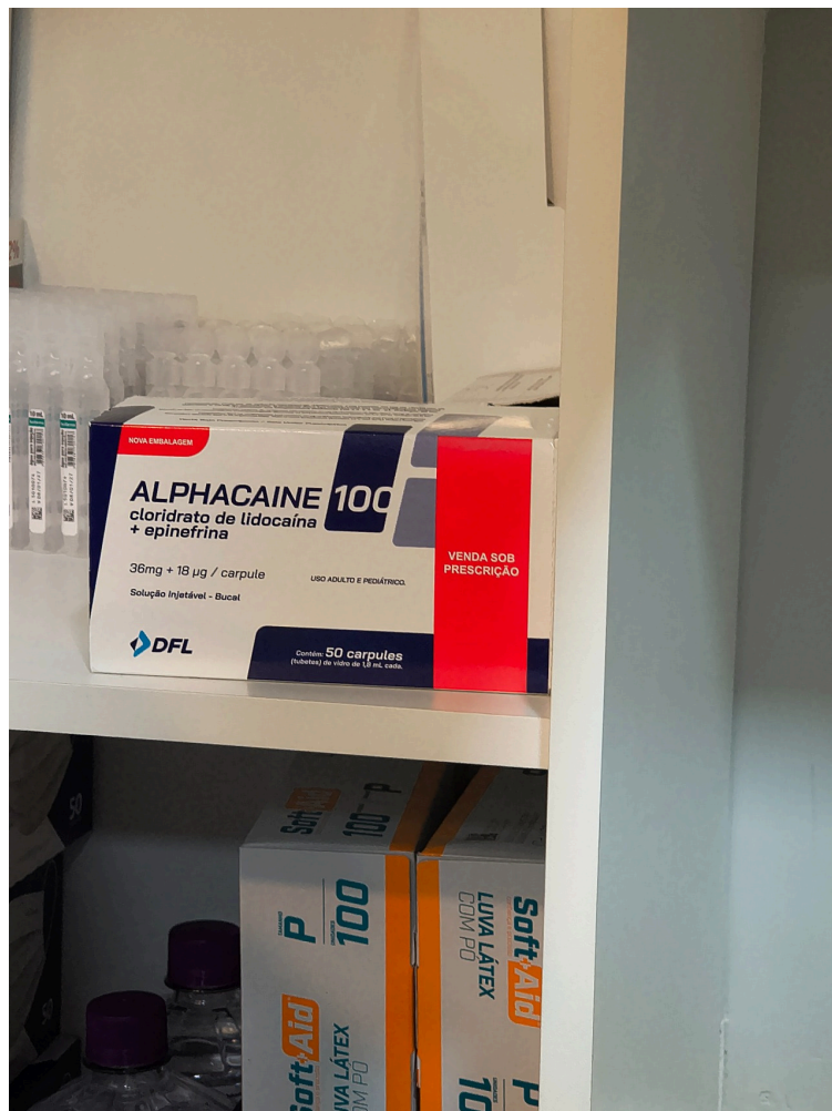
O produto na imagem é o anestésico odontológico Alphacaine 100.