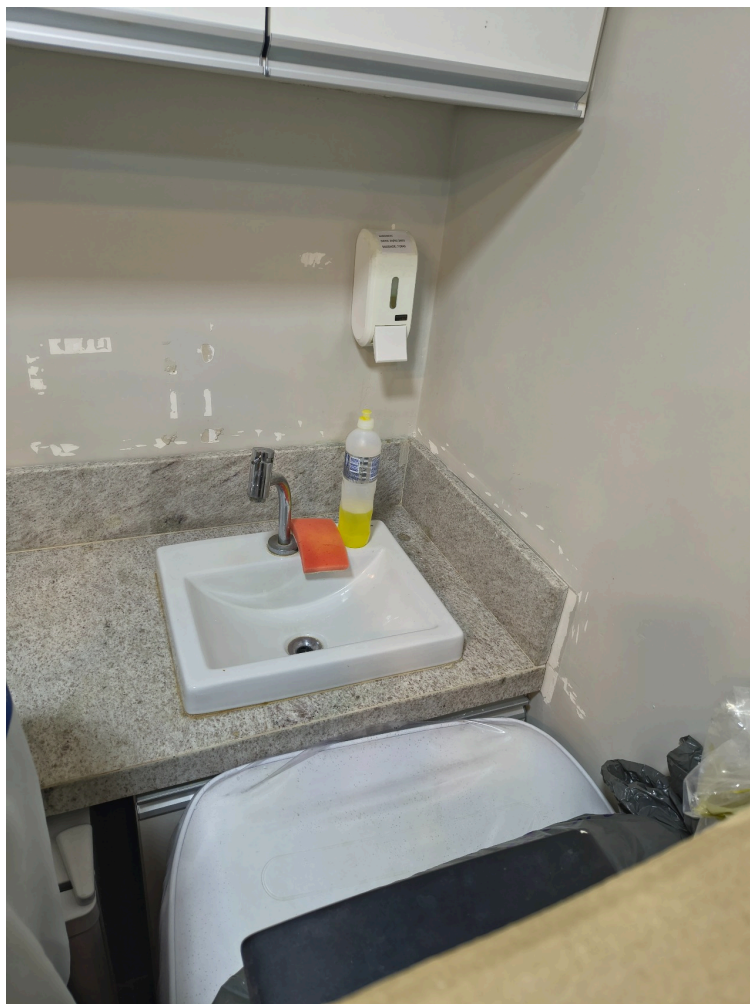
Pia na Sala 2