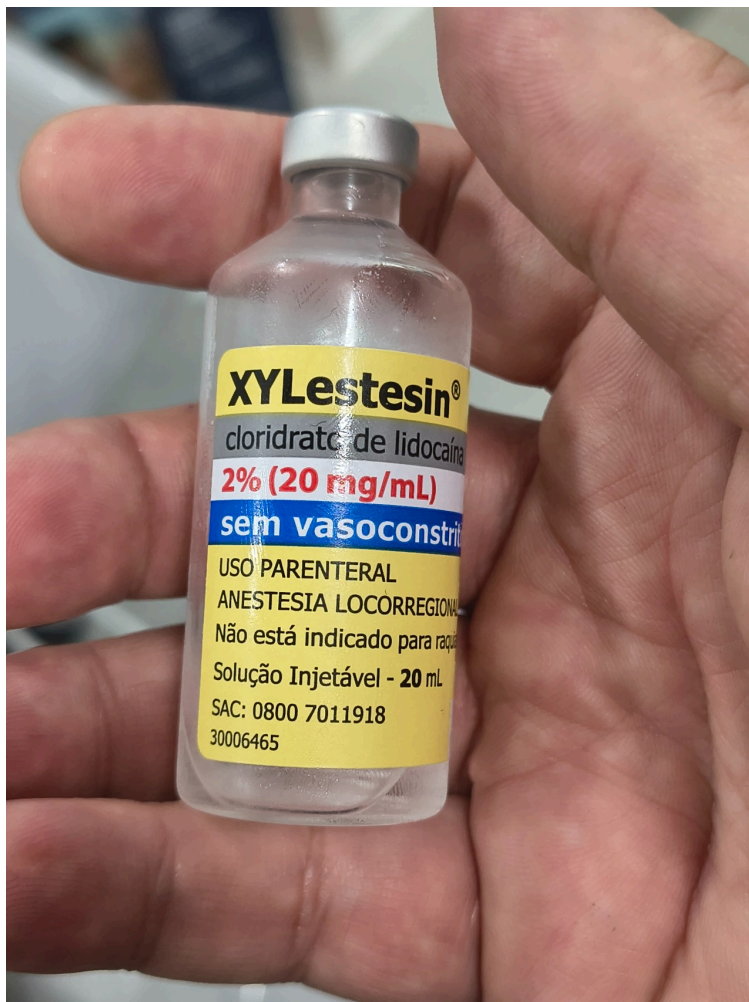
Xylestesin® (cloridrato de lidocaína) 2% sem vasoconstritor, uma solução injetável para anestesia local.