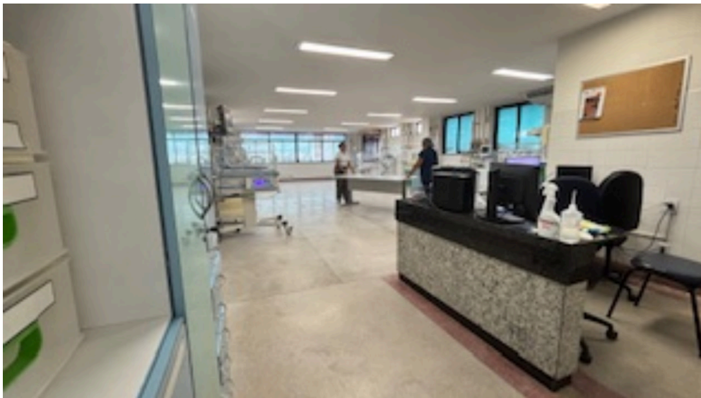
Imagem da 2ª constatação. (4)