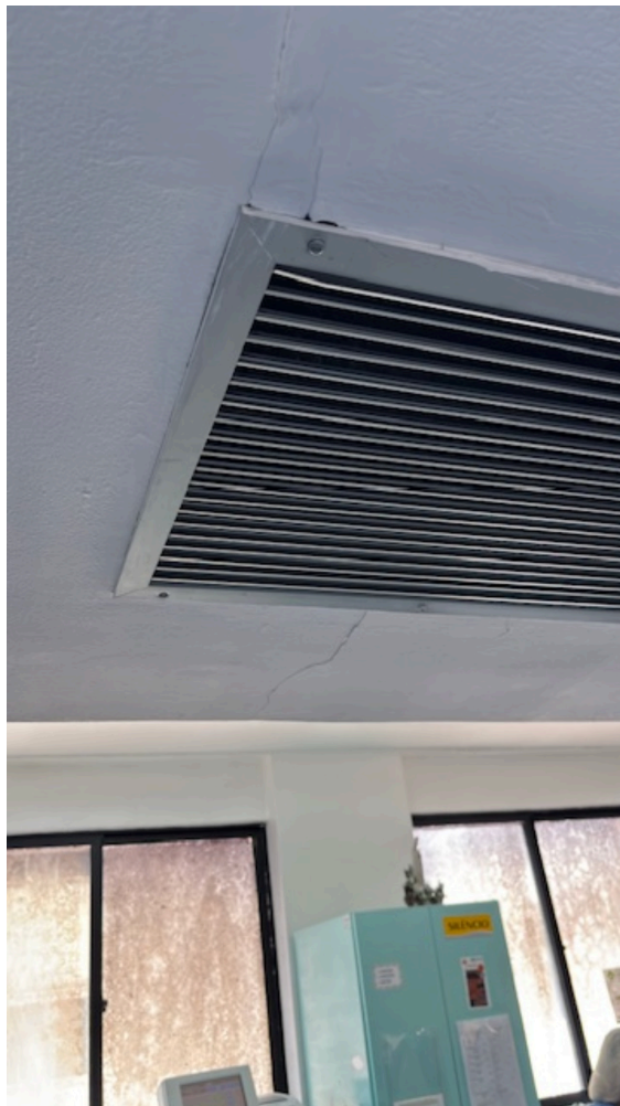
Imagem da 4ª constatação. (10)