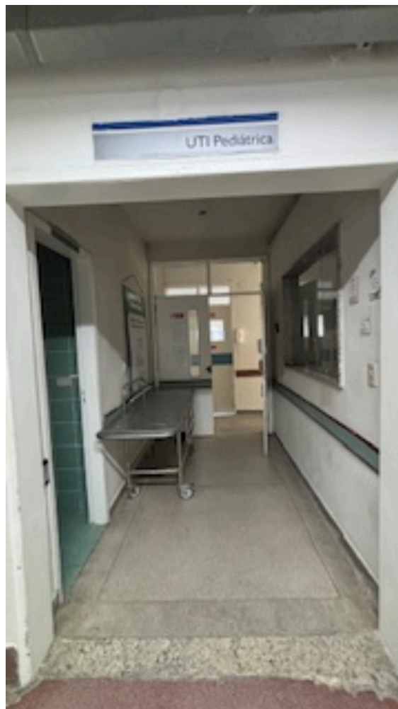
Imagem da 2ª constatação. (5)