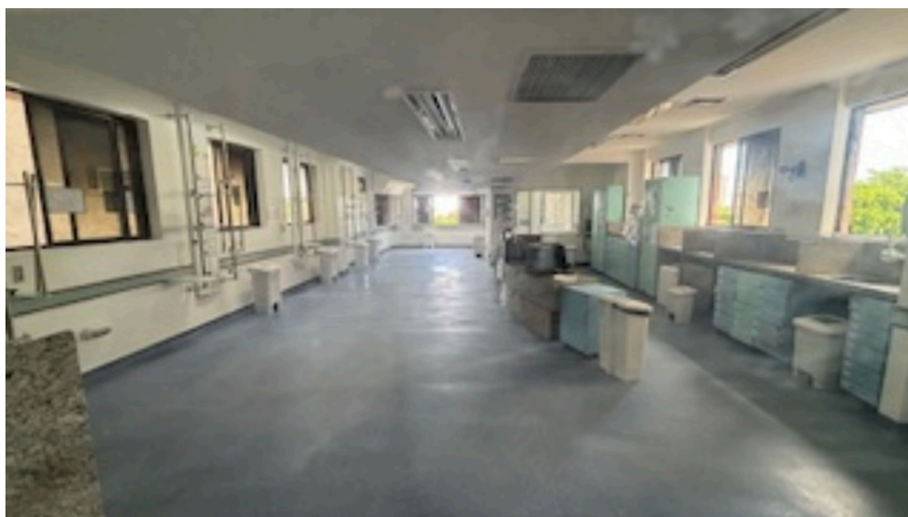
Imagem da 2ª constatação. (6)