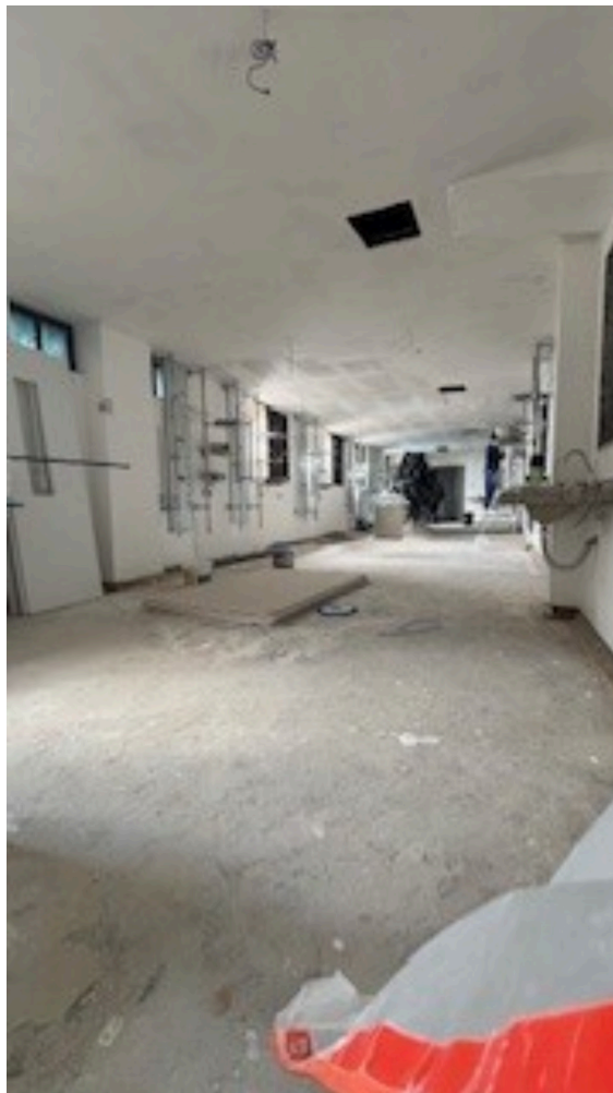
Imagem da 5ª constatação. (11)