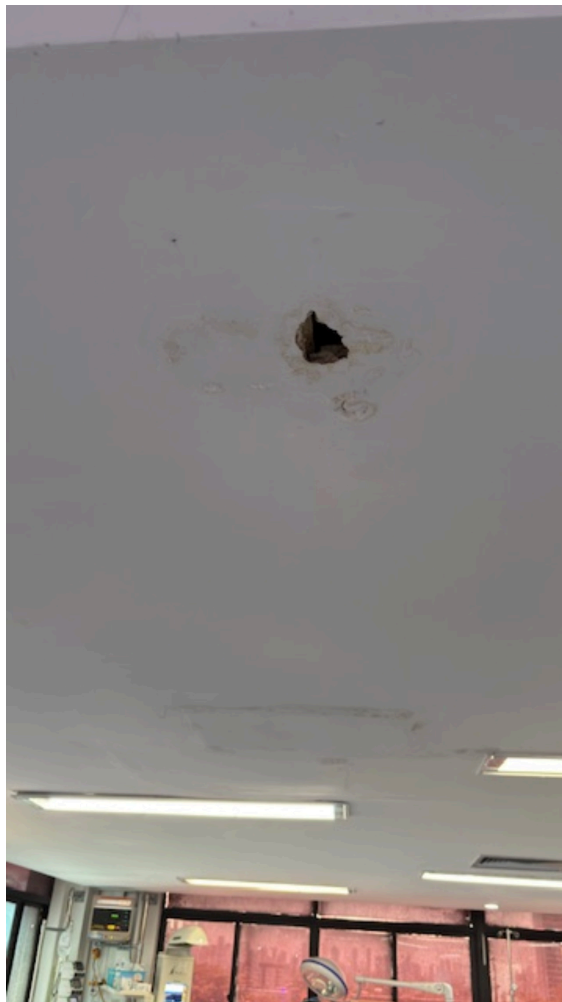
Imagem da 4ª constatação. (9)