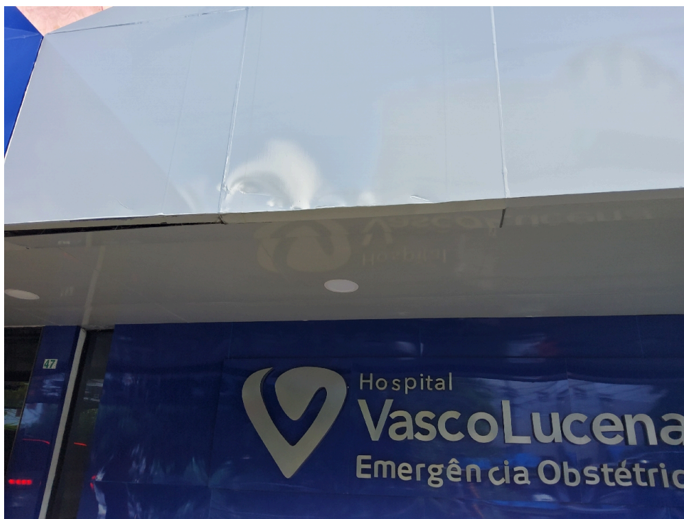
Registro Fotográfico da Fachada