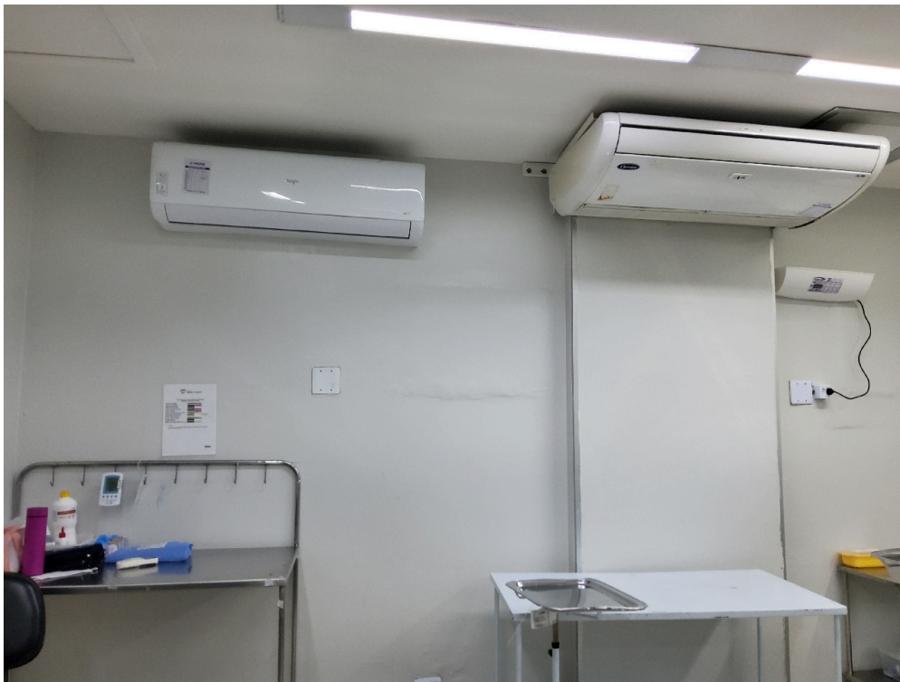
Centro Cirúrgico Obstétrico