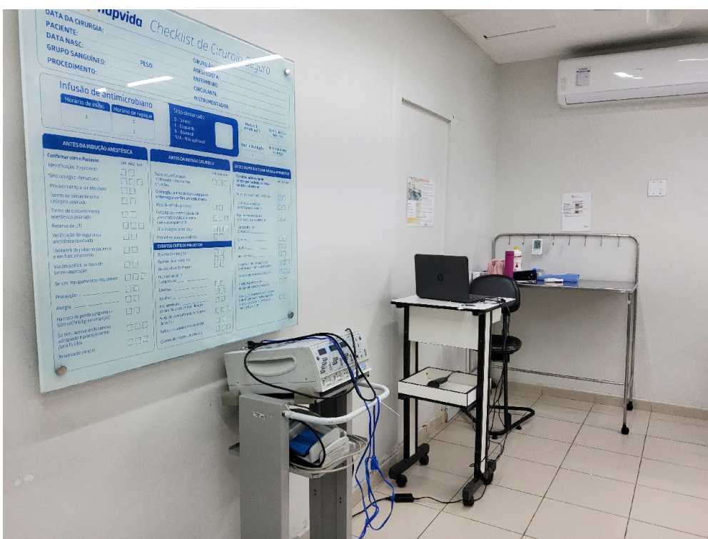
Centro Cirúrgico Obstétrico