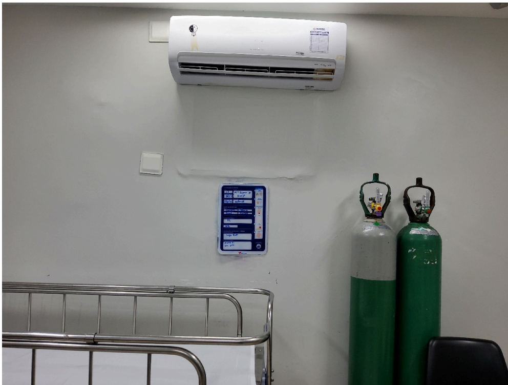
Sala de Recuperação Pós-Anestésica