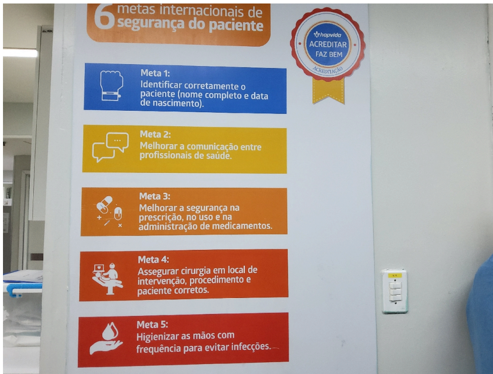
Centro Cirúrgico Obstétrico