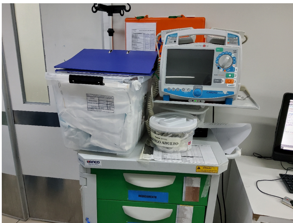
Centro Cirúrgico Obstétrico