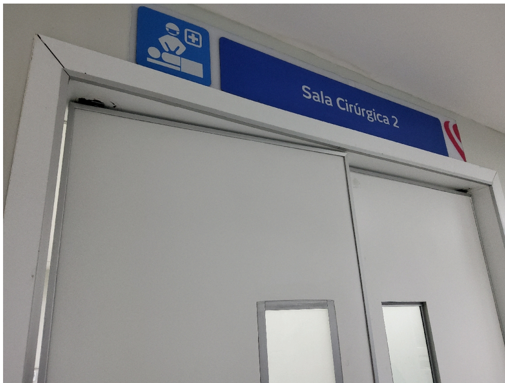
Centro Cirúrgico Obstétrico