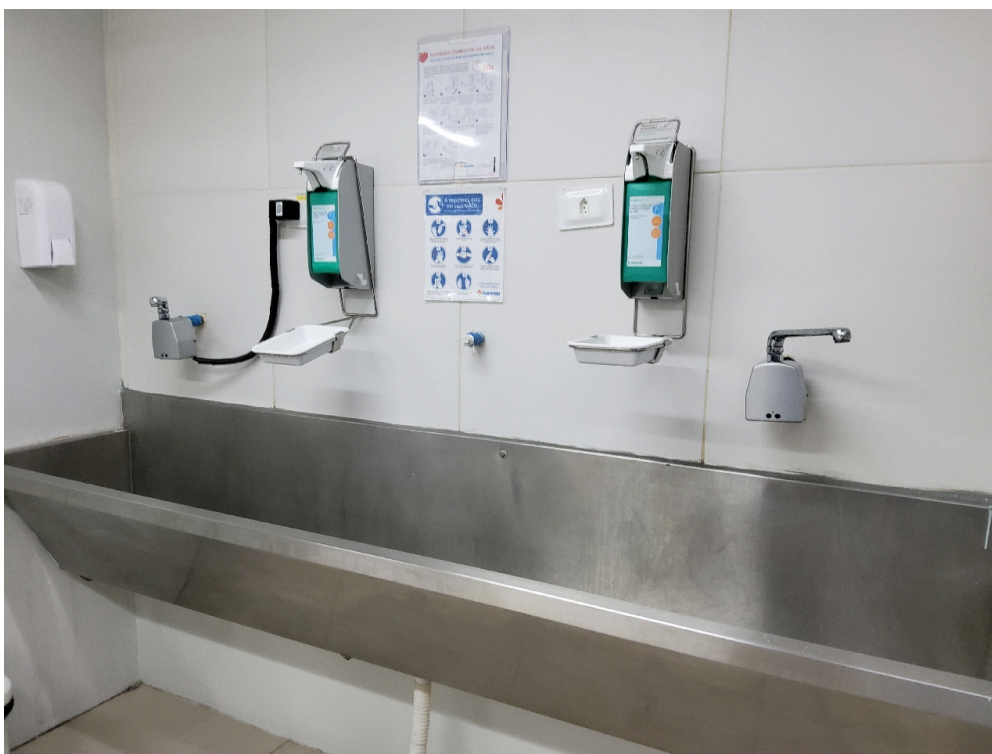
Centro Cirúrgico Obstétrico