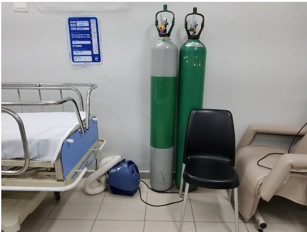
Sala de Recuperação Pós-Anestésica