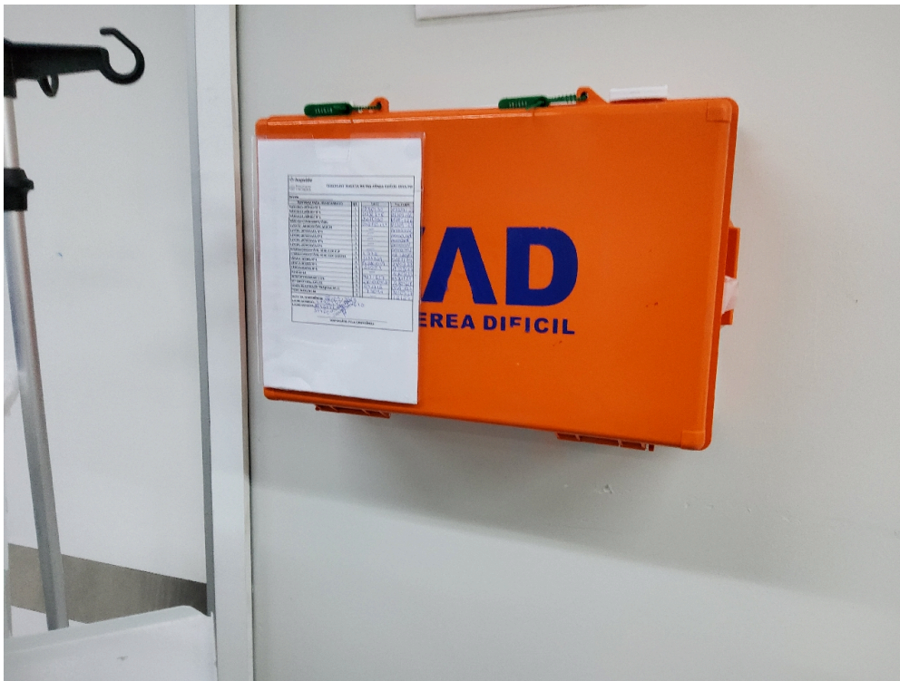
Centro Cirúrgico Obstétrico