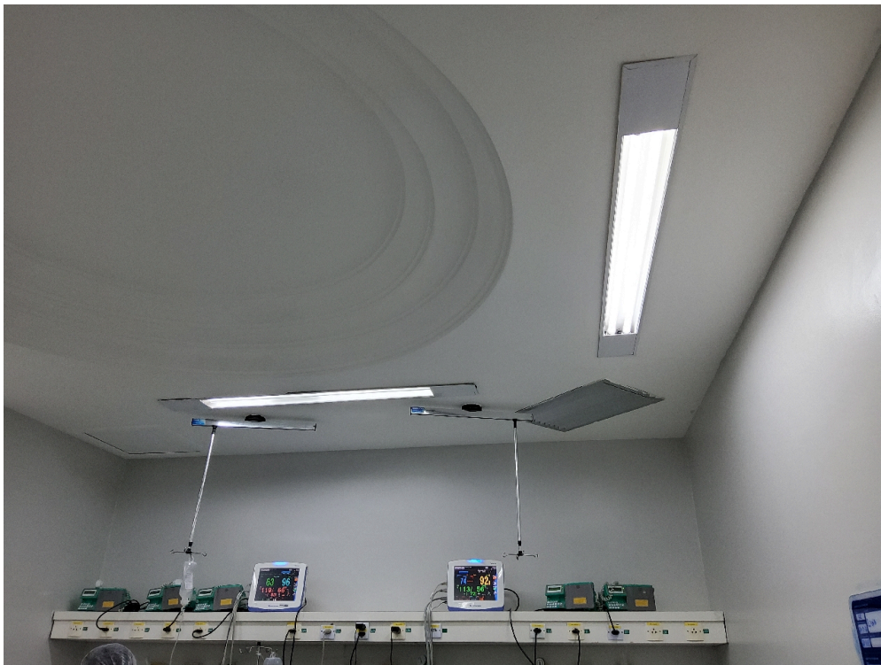
Sala de Recuperação Pós-Anestésica