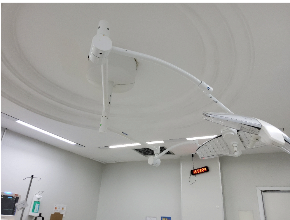
Centro Cirúrgico Obstétrico