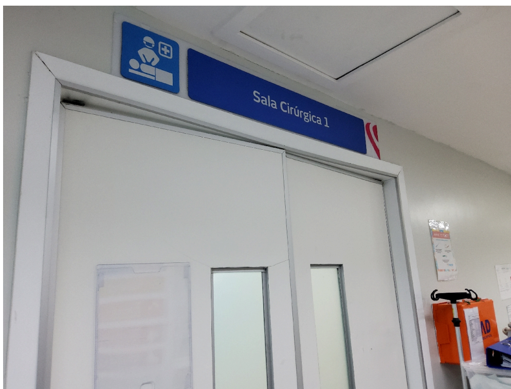
Centro Cirúrgico Obstétrico