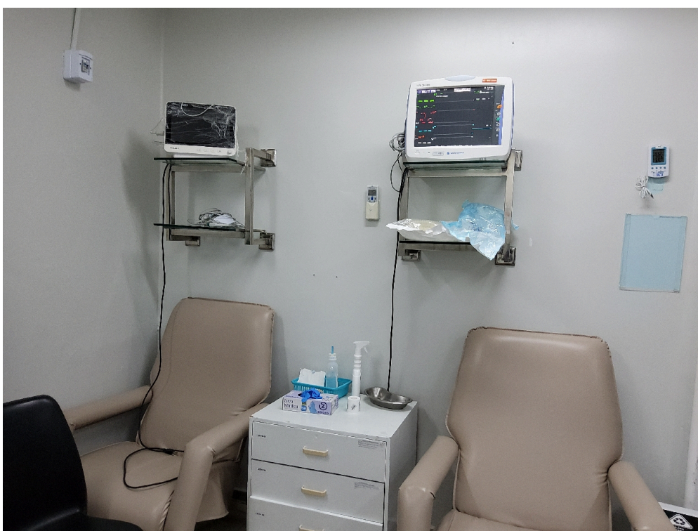
Sala de Recuperação Pós-Anestésica