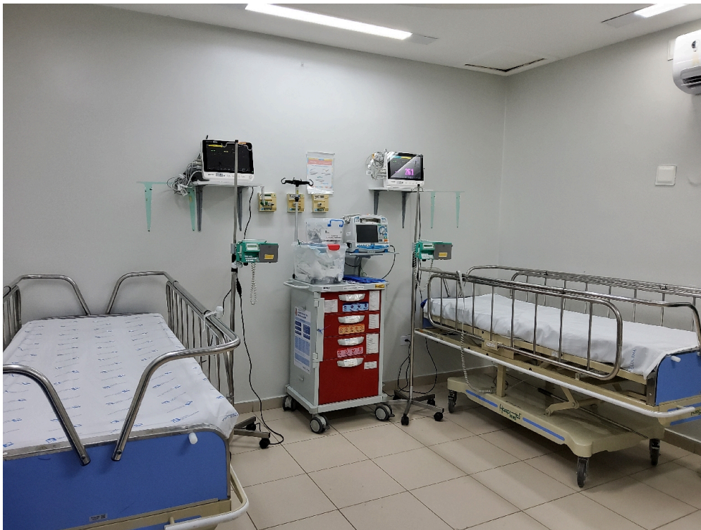
Sala de Recuperação Pós-Anestésica