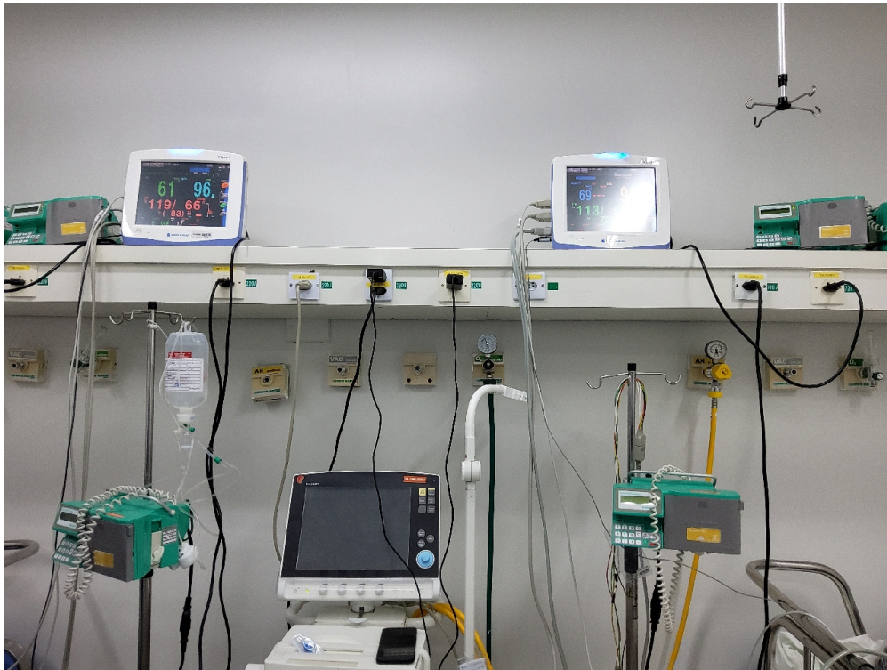
Sala de Recuperação Pós-Anestésica