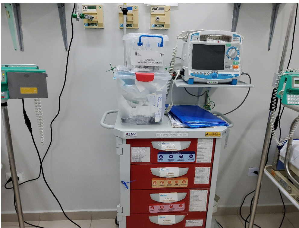
Sala de Recuperação Pós-Anestésica