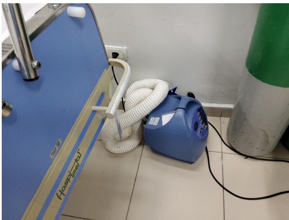
Sala de Recuperação Pós-Anestésica