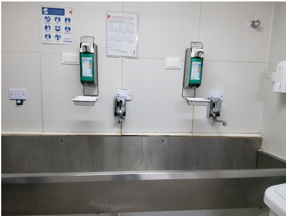
Centro Cirúrgico Obstétrico