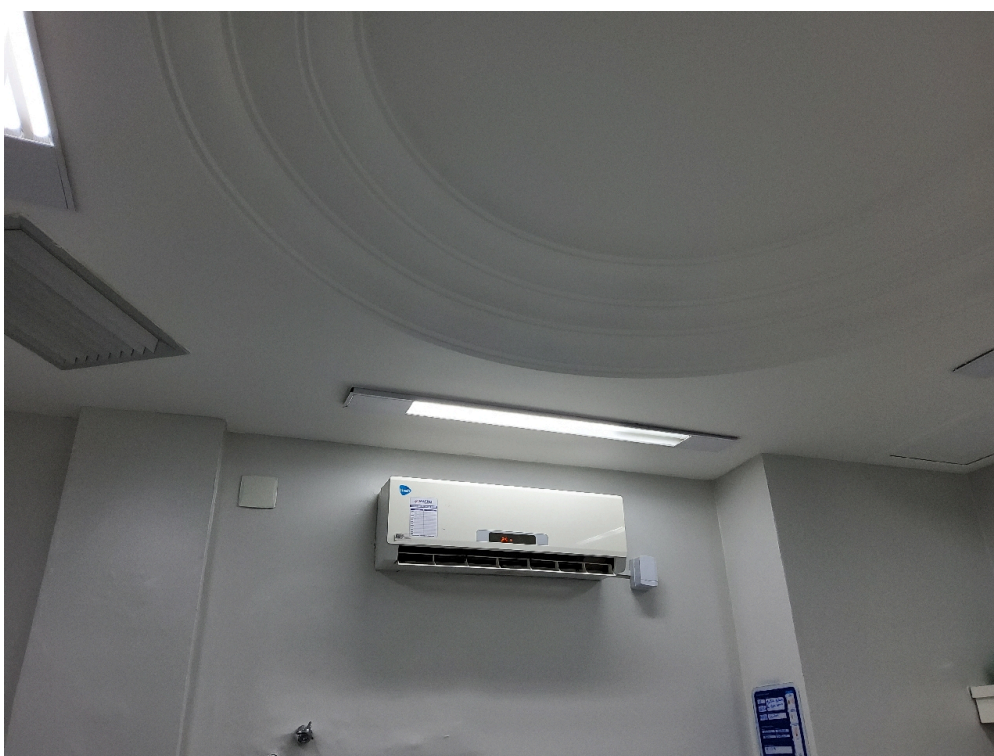
Sala de Recuperação Pós-Anestésica