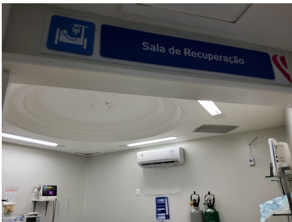
Sala de Recuperação Pós-Anestésica