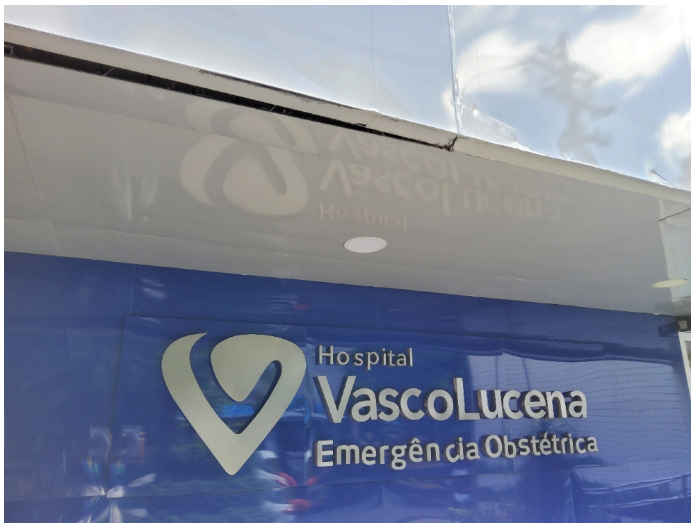
Registro Fotográfico da Fachada