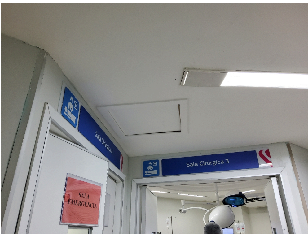
Centro Cirúrgico Obstétrico