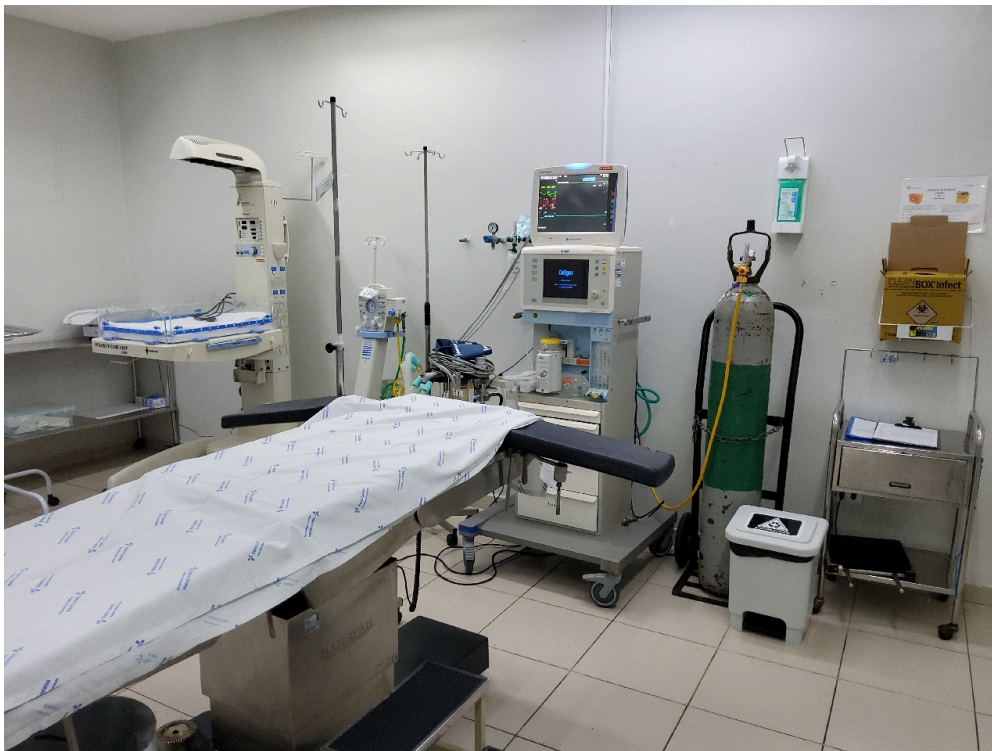
Centro Cirúrgico Obstétrico