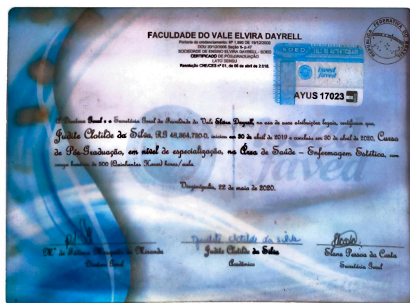
certificados fixados em parede do estabelecimento - imagem 2