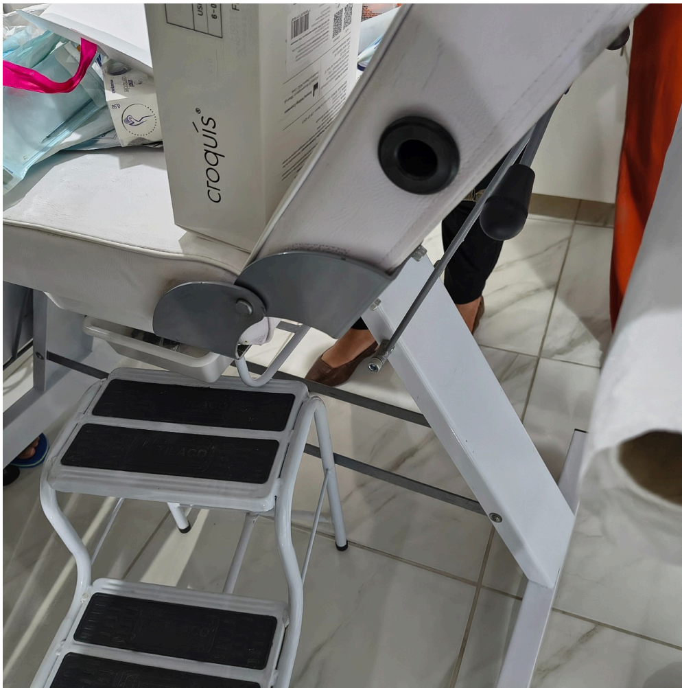
maca regulável com escadinha de dois degraus