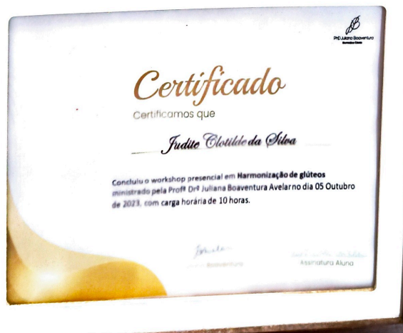
certificados fixados em parede do estabelecimento - imagem 1