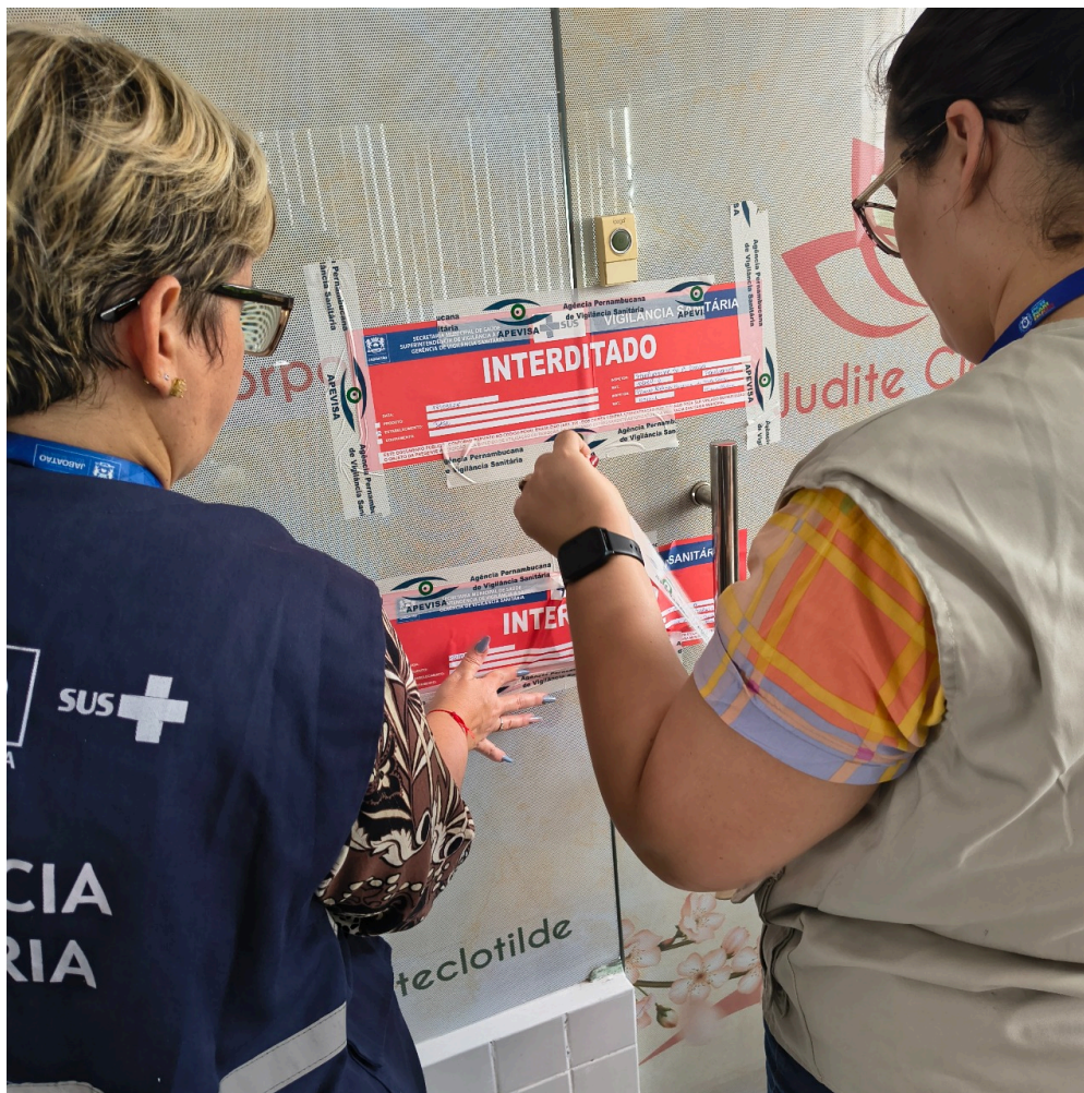
interdição do estabelecimento realizada pelas vigilâncias sanitárias de Jaboatão e APEVISA