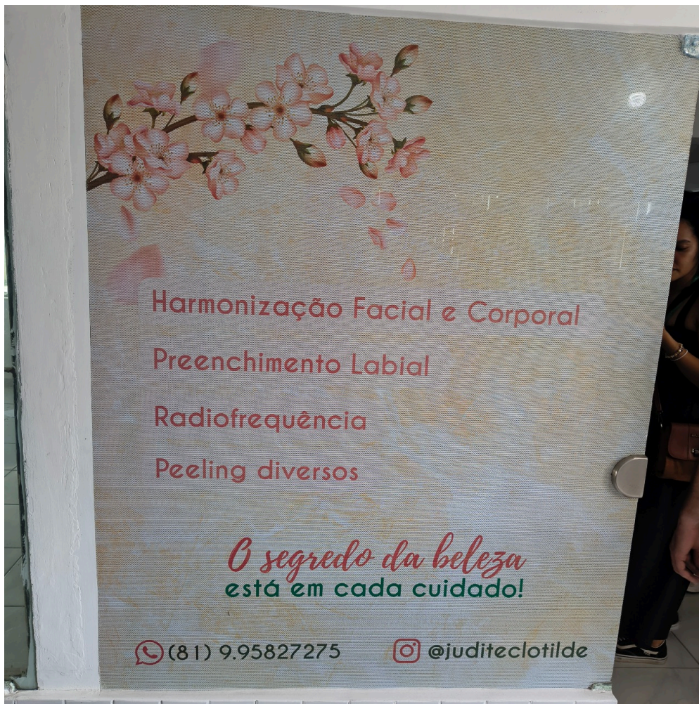
procedimentos estéticos anunciados na fachada do estabelecimento