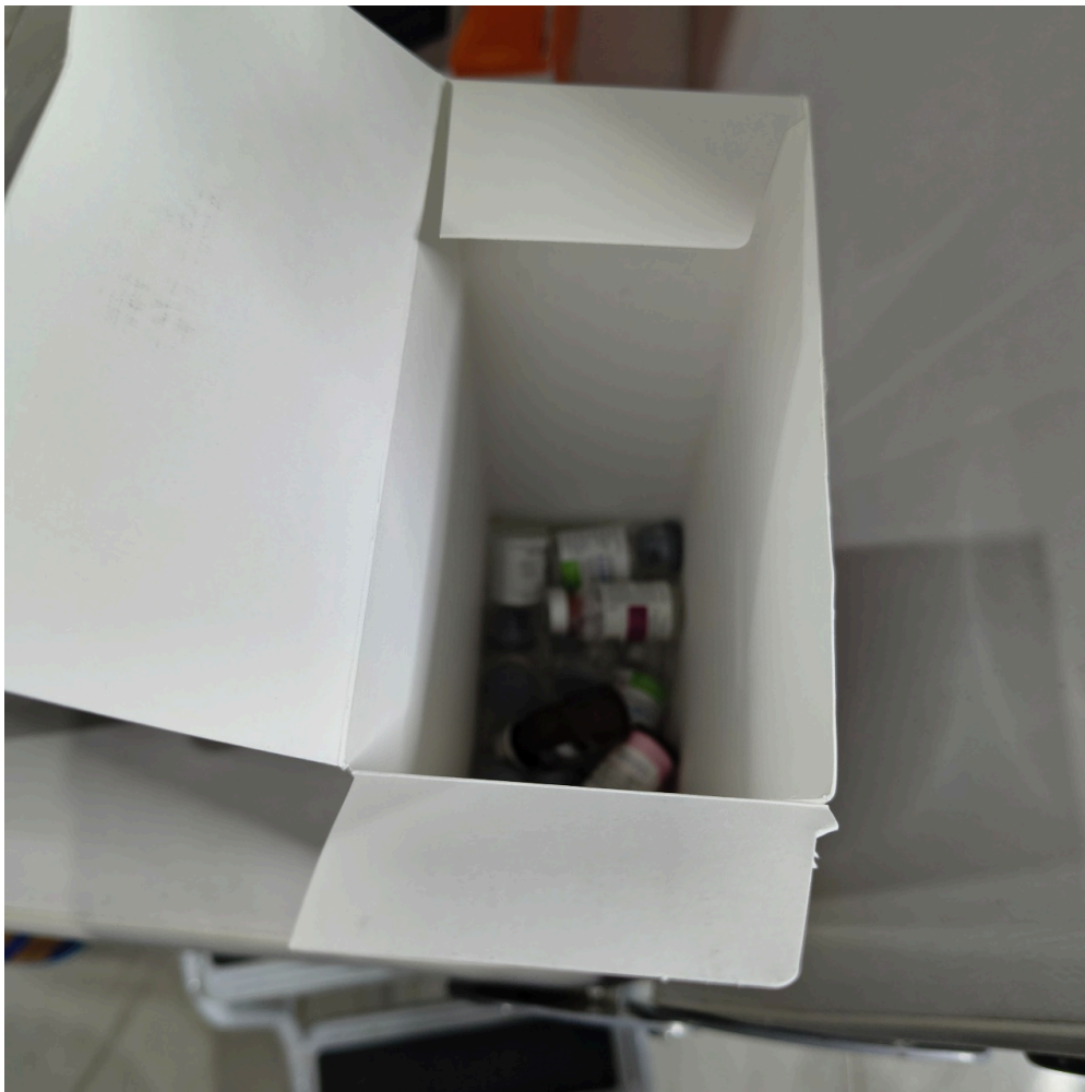
frascos de medicamentos injetáveis aguardando descarte em caixa improvisada de papelão