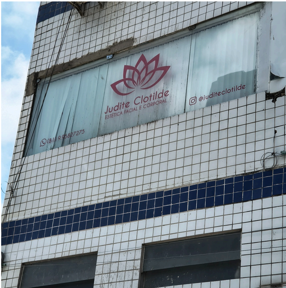
DADOS CADASTRAIS - Registro Fotográfico da Fachada