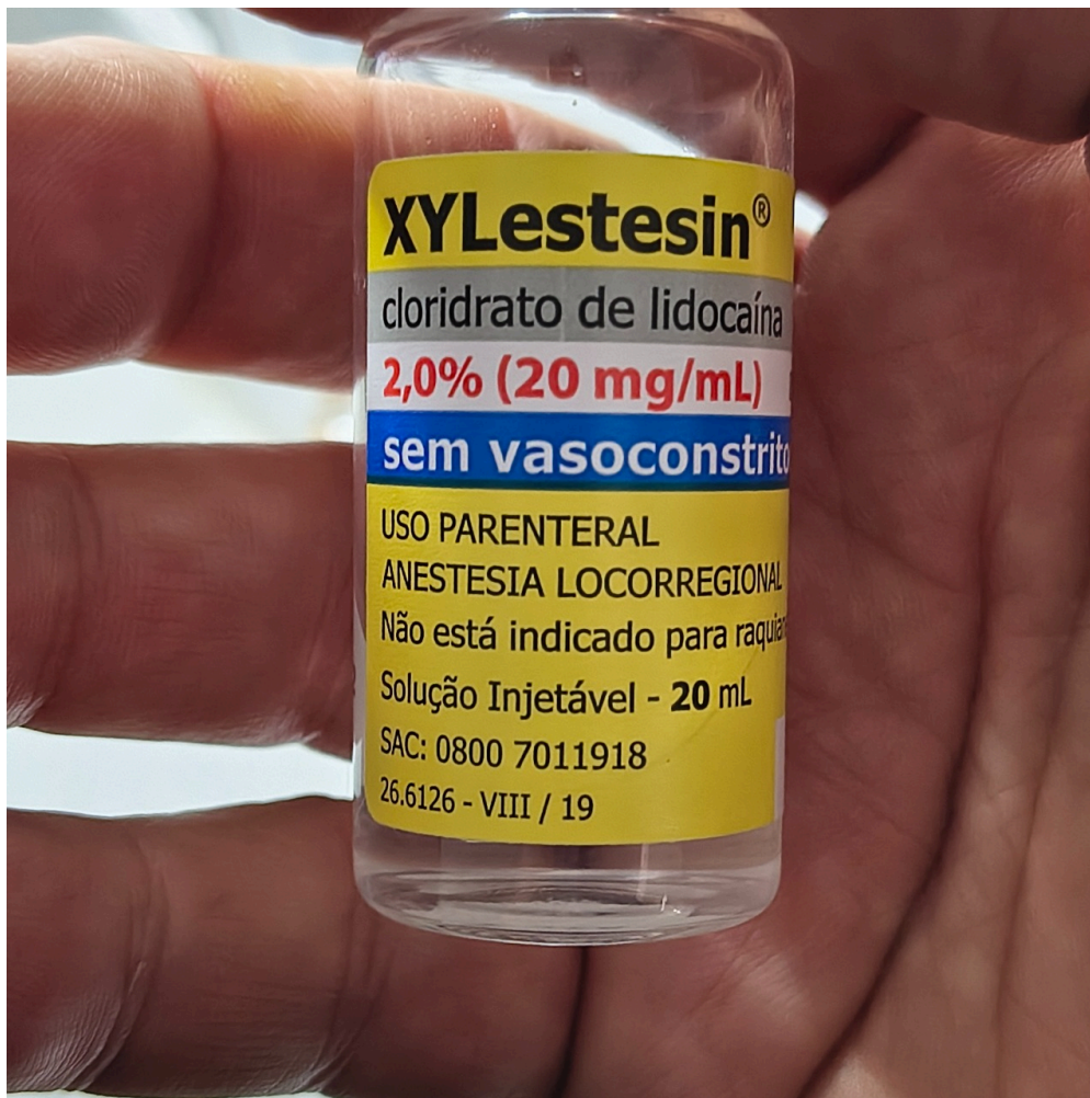
frasco de lidocaína