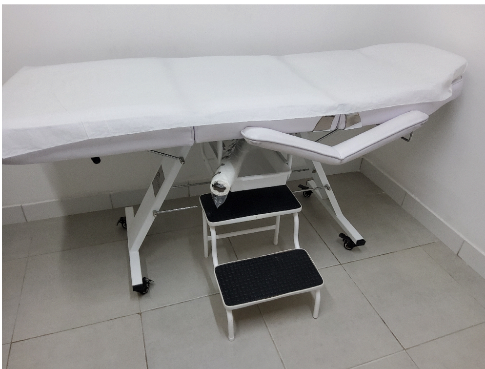
Consultório ANGIOLOGIA - grupo 3 # Consultório Angiologia - 1 maca acolchoada simples, revestida com material impermeável