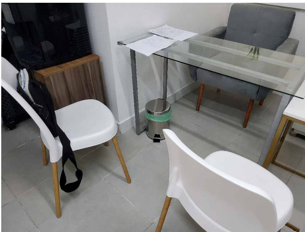
Consultório ANGIOLOGIA - grupo 3 # Consultório Angiologia - 2 cadeiras ou poltronas - uma para o paciente e outra para o acompanhante