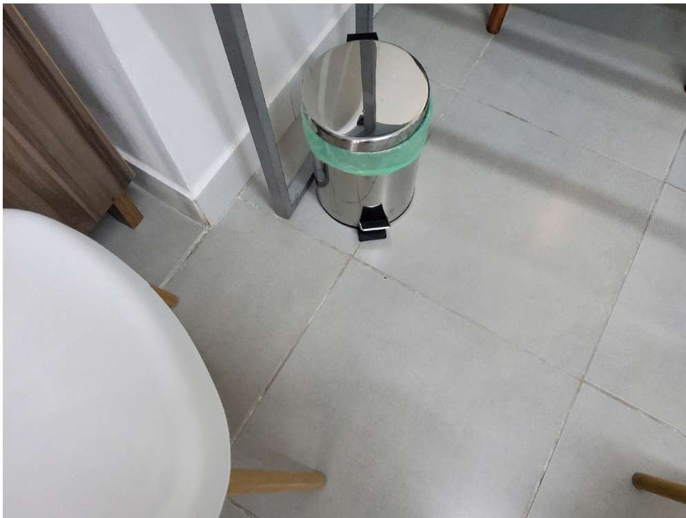
Consultório ANGIOLOGIA - grupo 3 # Consultório Angiologia - Lixeiras com pedal