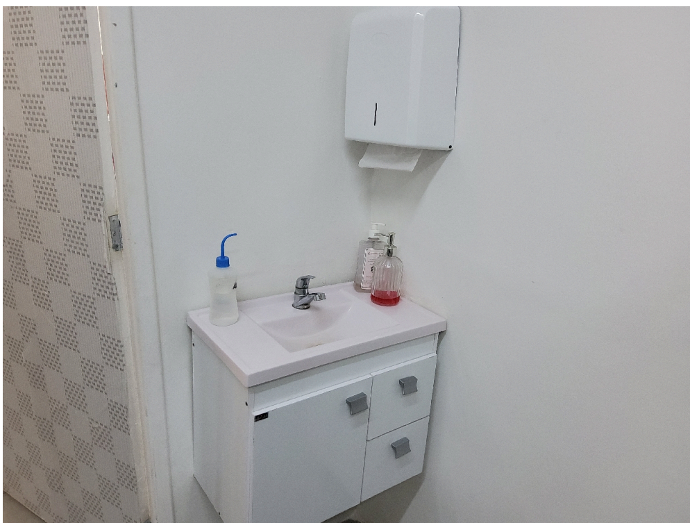
Consultório ANGIOLOGIA - grupo 3 # Consultório Angiologia - 1 pia ou lavabo