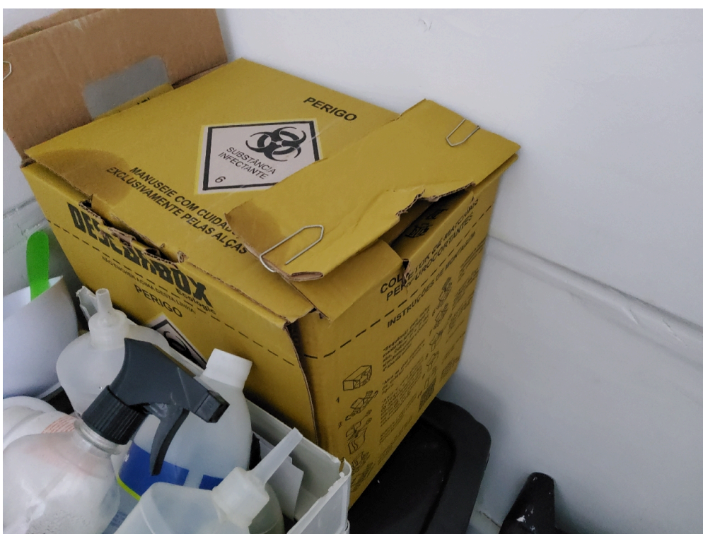
Consultório ANGIOLOGIA - grupo 3 # Consultório Angiologia - 1 recipiente rígido para o descarte de material perfurocortante