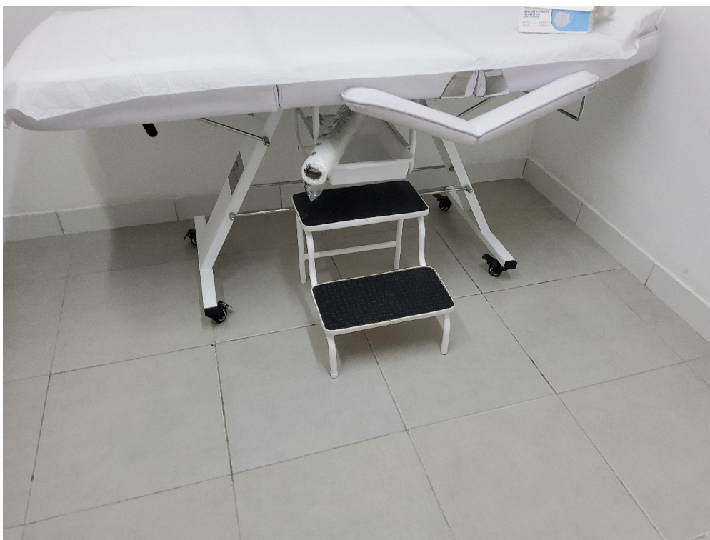
Consultório INDIFERENCIADO - grupo 1 # Consultorio - 1 escada de 2 ou 3 degraus para acesso dos pacientes à maca