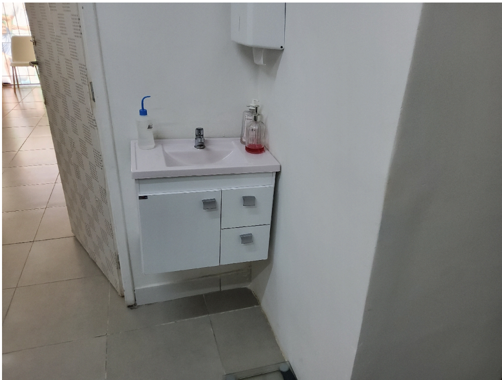
Consultório INDIFERENCIADO - grupo 1 # Consultorio - 1 pia ou lavabo