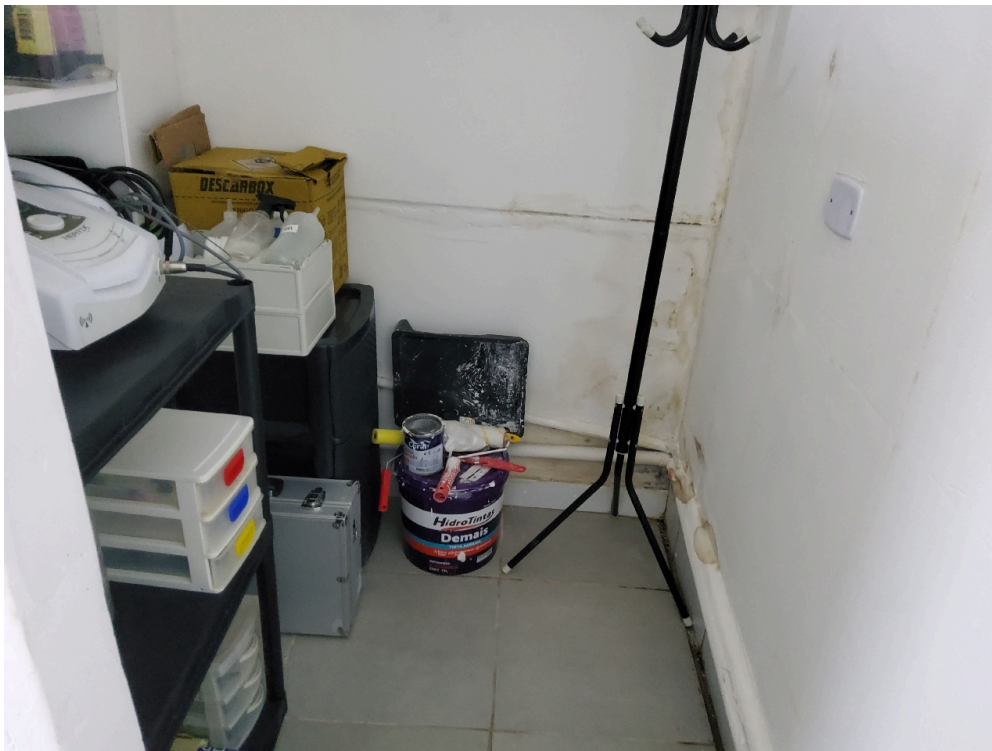
CONDIÇÕES ESTRUTURAIS DO AMBIENTE FÍSICO - GERAL - Instalações livres de trincas, rachaduras, mofos e/ou infiltrações