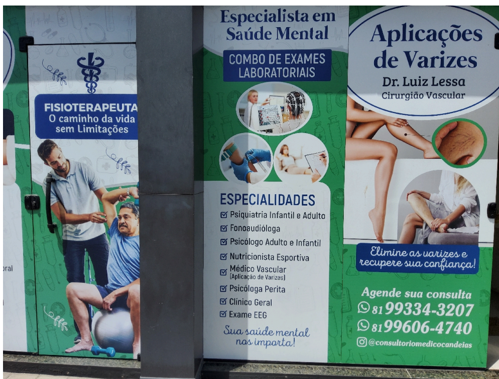
DADOS CADASTRAIS - Registro Fotográfico da Fachada