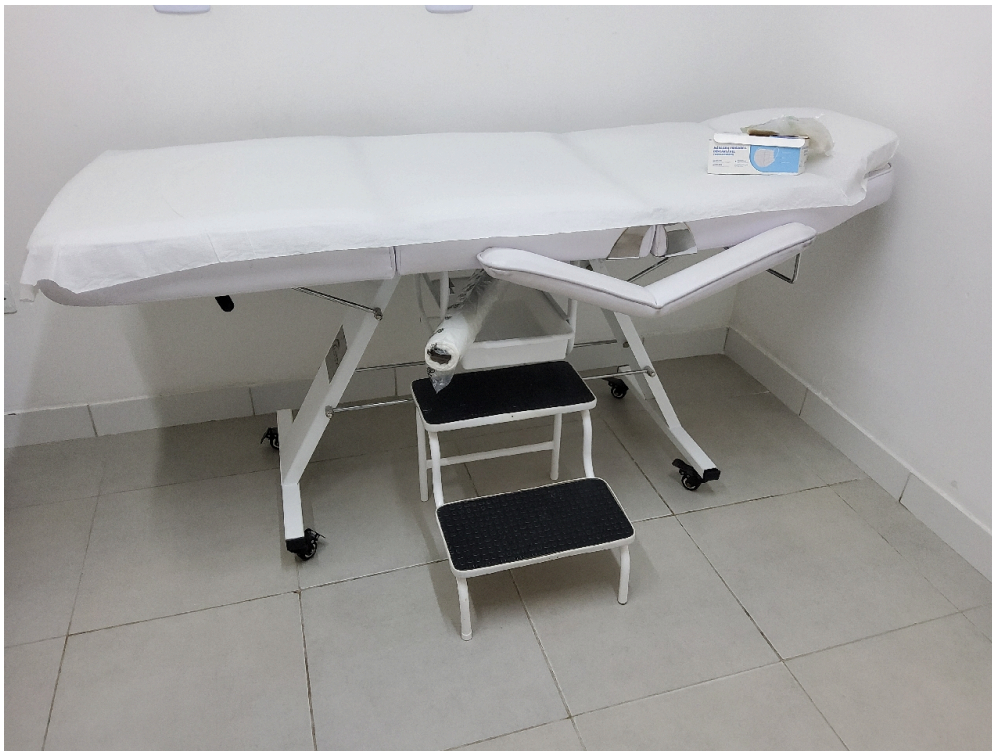
Consultório INDIFERENCIADO - grupo 1 # Consultorio - 1 maca acolchoada simples, revestida com material impermeável