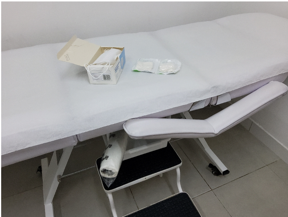
Consultório ANGIOLOGIA - grupo 3 # Consultório Angiologia - 1 maca acolchoada simples, revestida com material impermeável