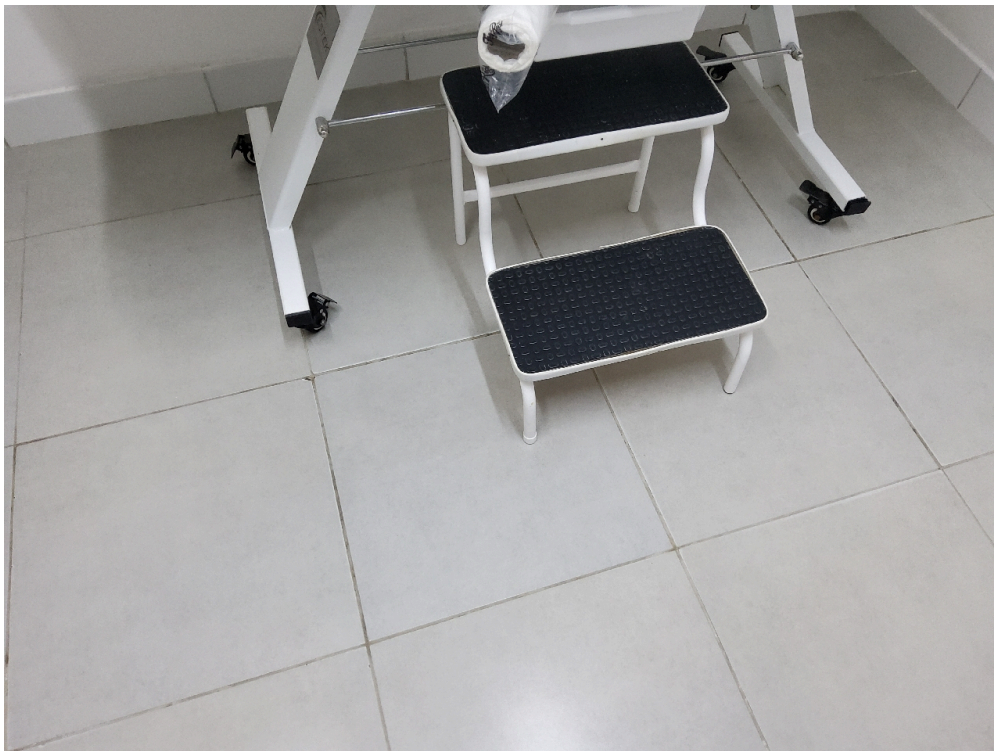
Consultório ANGIOLOGIA - grupo 3 # Consultório Angiologia - 1 escada de 2 ou 3 degraus para acesso dos pacientes à maca