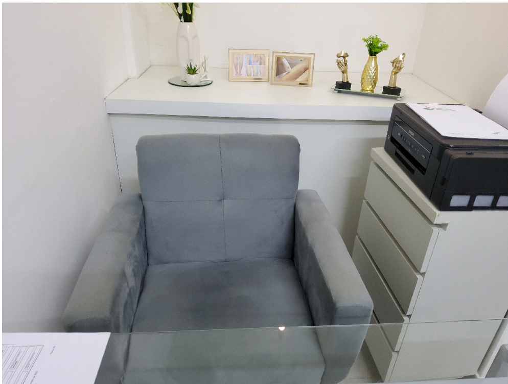
Consultório ANGIOLOGIA - grupo 3 # Consultório Angiologia - 1 cadeira ou poltrona para o médico