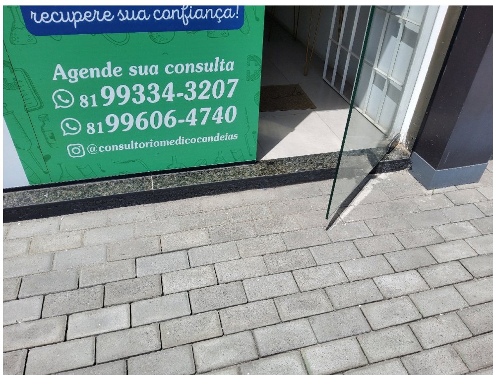
DADOS CADASTRAIS - Registro Fotográfico da Fachada