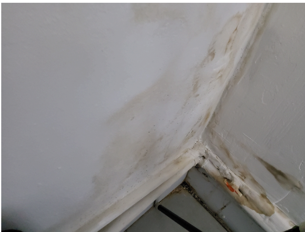
CONDIÇÕES ESTRUTURAIS DO AMBIENTE FÍSICO - GERAL - Instalações livres de trincas, rachaduras, mofos e/ou infiltrações