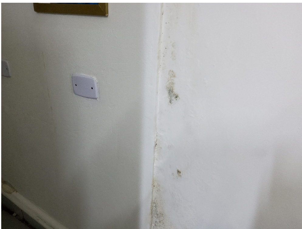
CONDIÇÕES ESTRUTURAIS DO AMBIENTE FÍSICO - GERAL - Instalações livres de trincas, rachaduras, mofo e/ou infiltrações