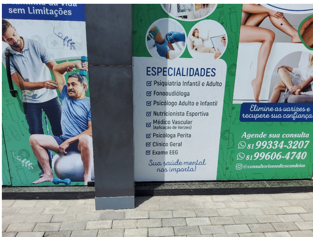
DADOS CADASTRAIS - Registro Fotográfico da Fachada