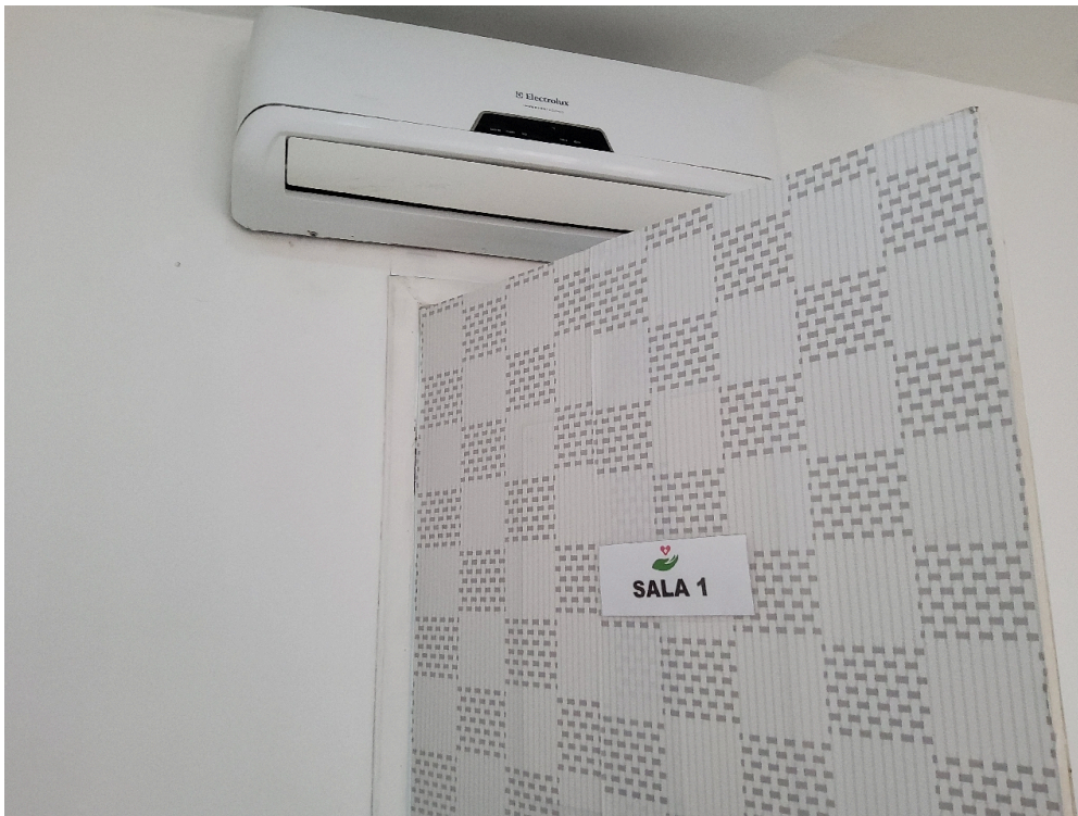
CONDIÇÕES ESTRUTURAIS DO AMBIENTE FÍSICO - GERAL - Sinalização de acessos