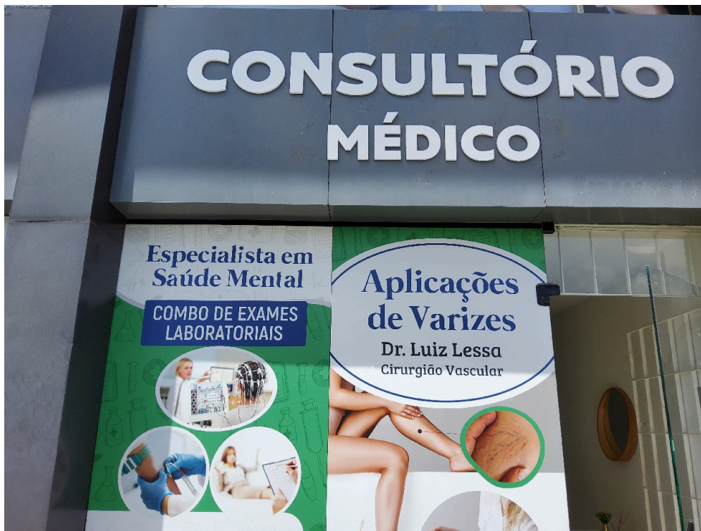
DADOS CADASTRAIS - Registro Fotográfico da Fachada