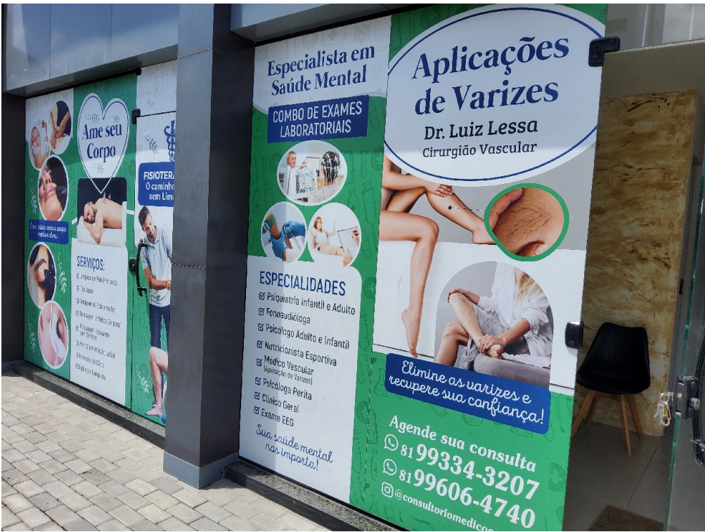
DADOS CADASTRAIS - Registro Fotográfico da Fachada