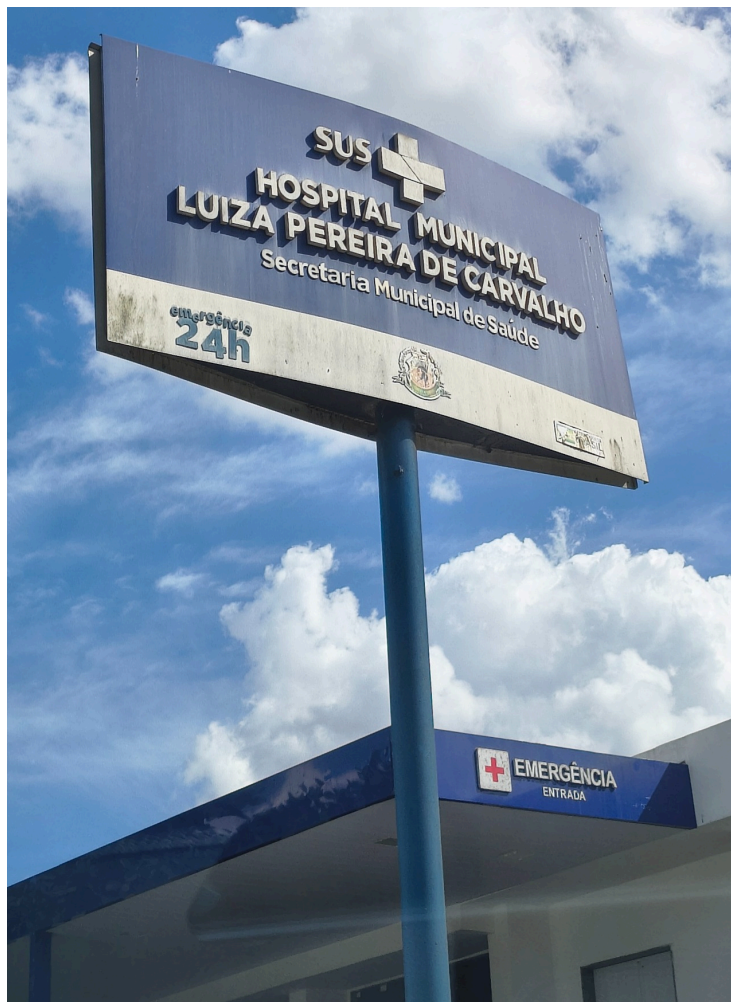
Frente e fachada