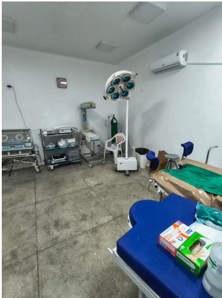
sala de parto