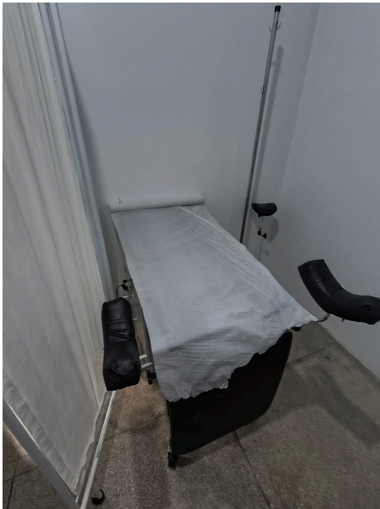
maca ginecológica da triagem obstétrica