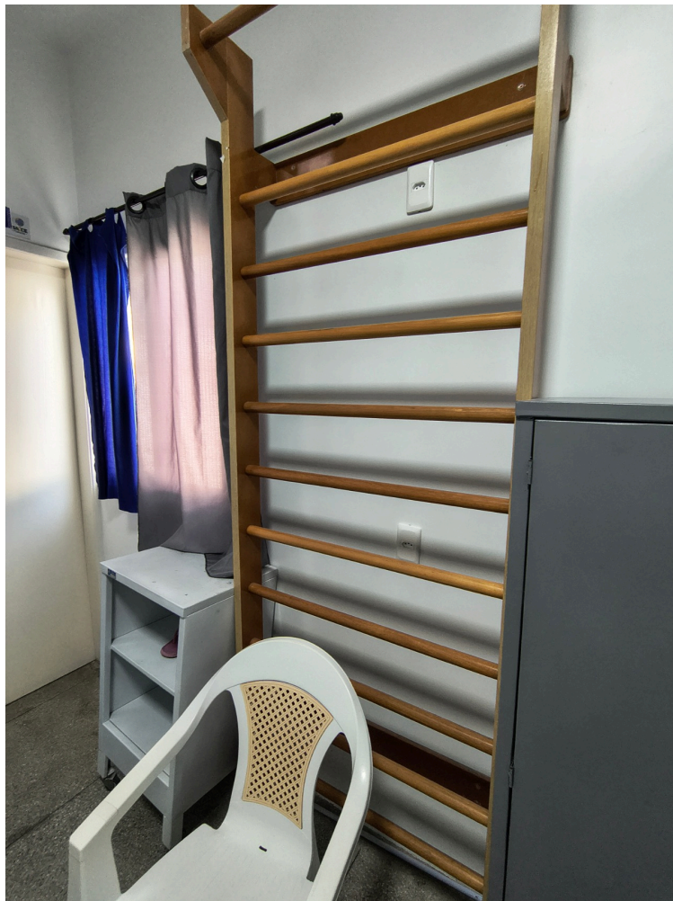
escada de ling instalada no pré parto