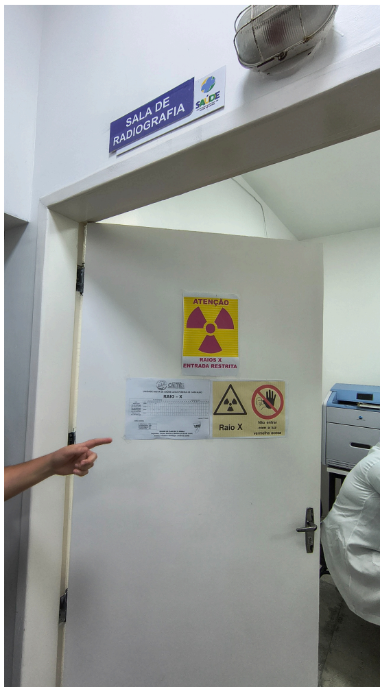
porta da sala de raio x