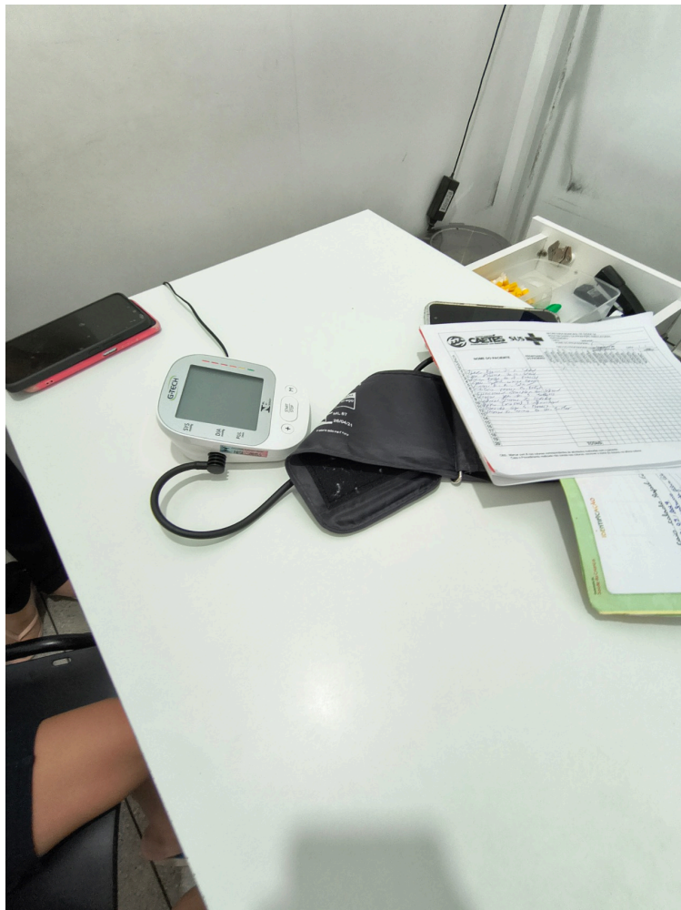
acolhimento e classificação de risco