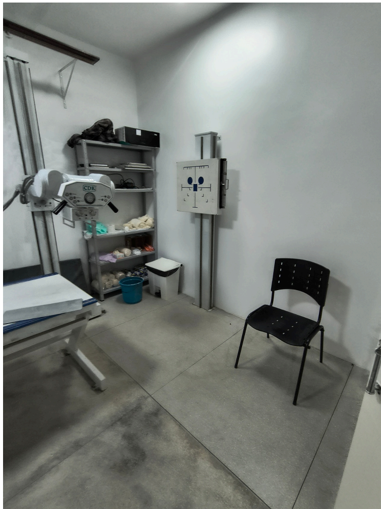
sala de raio x