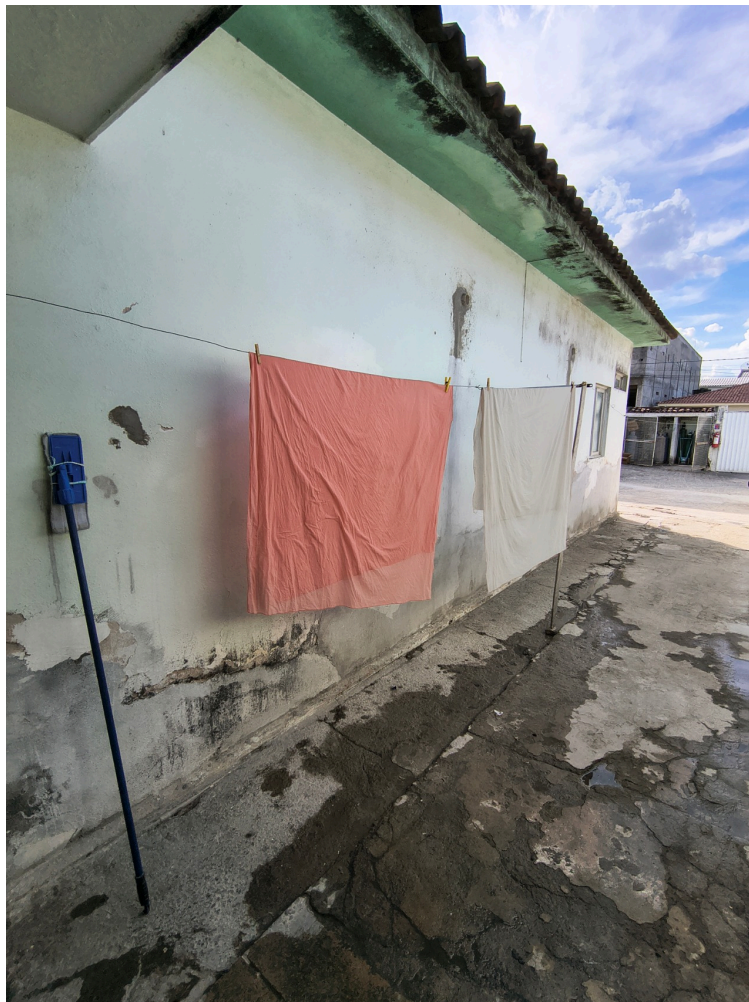
Lavanderia hospitalar com características de lavanderia doméstica apresenta roupas secando em varal