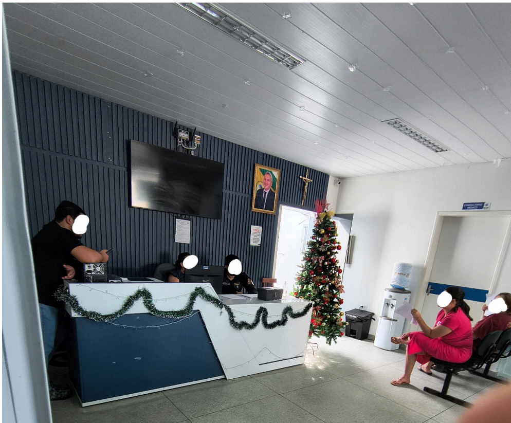
recepção e sala de espera