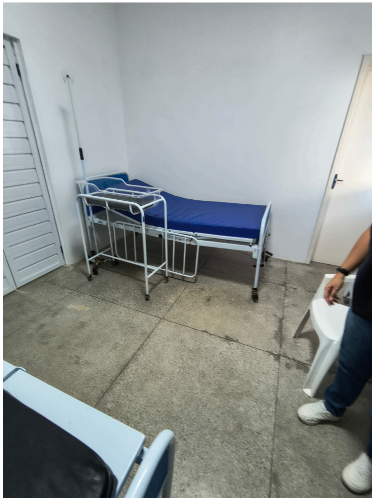
pré-parto com dois leitos