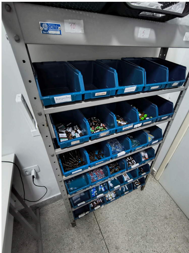
farmácia hospitalar abastecida