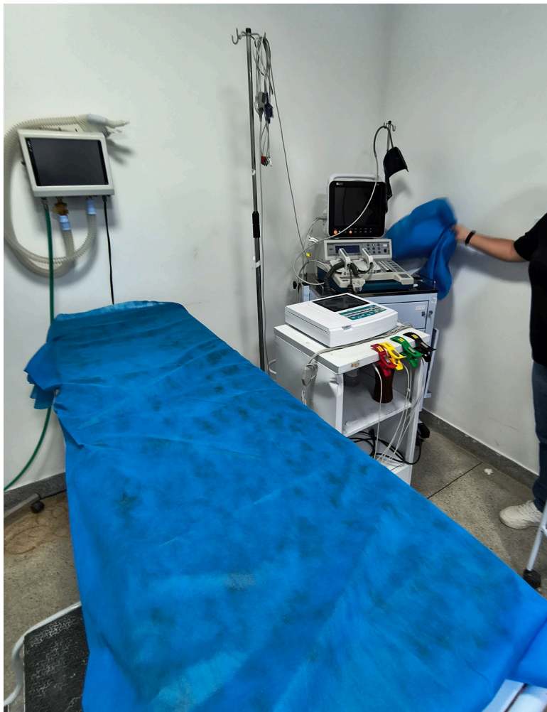
leito da sala de estabilização