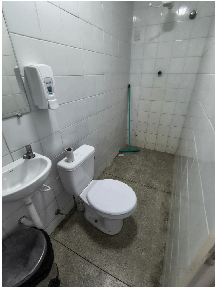
banheiro do repouso médico