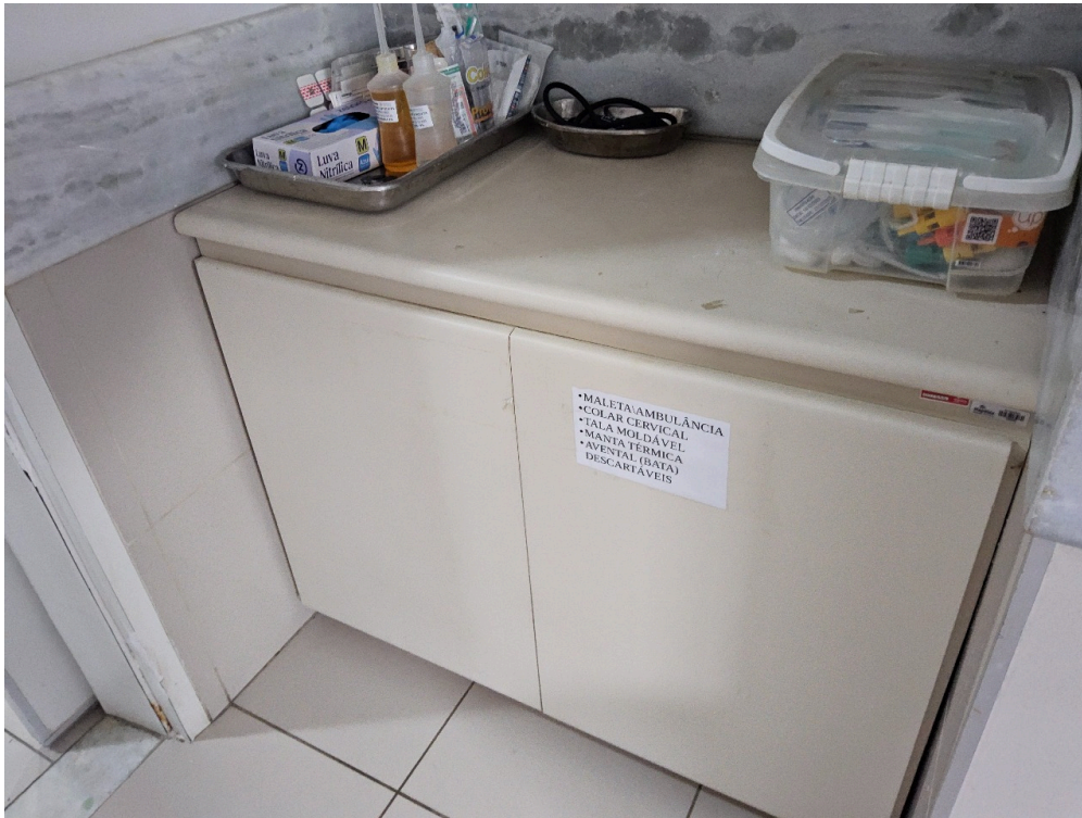
ESTRUTURA DA UNIDADE - Sala de Reanimação e Estabilização de Pacientes Graves