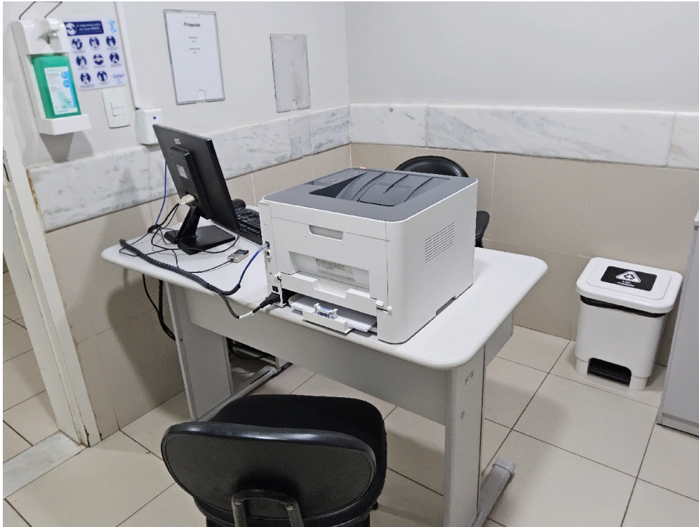
ESTRUTURA DA UNIDADE - Consultório Médico