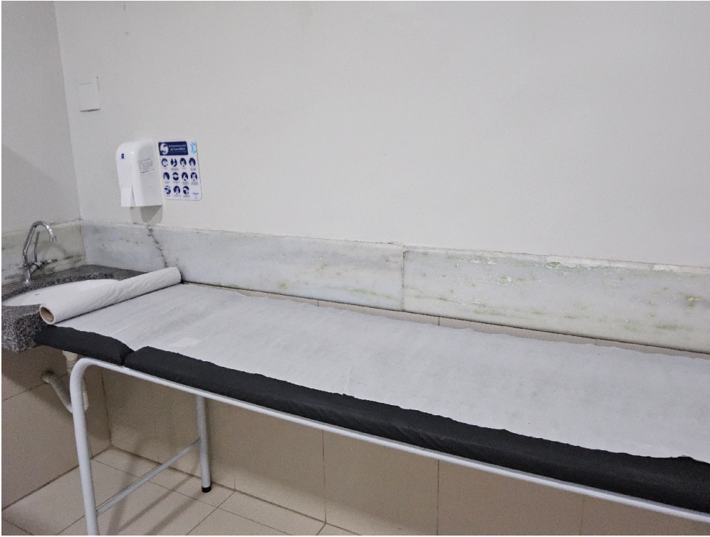
ESTRUTURA DA UNIDADE - Consultório Médico