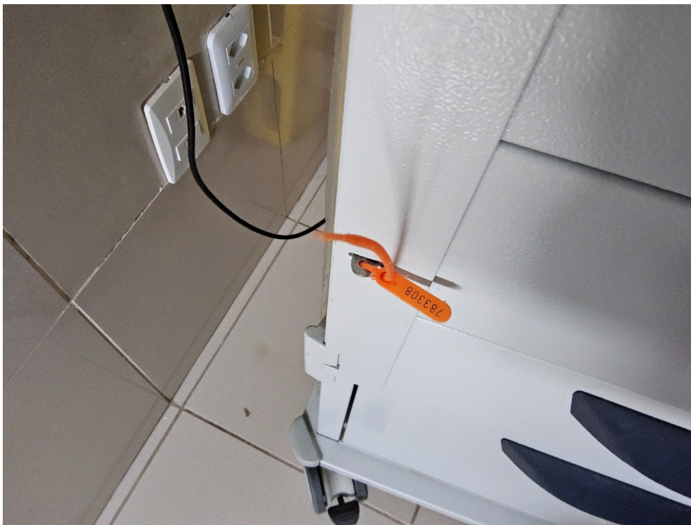
ESTRUTURA DA UNIDADE - Sala de Reanimação e Estabilização de Pacientes Graves