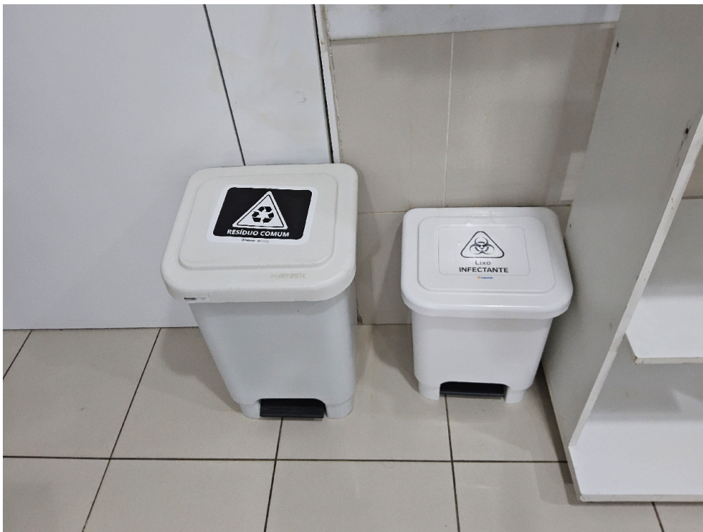
ESTRUTURA DA UNIDADE - Sala de Observação