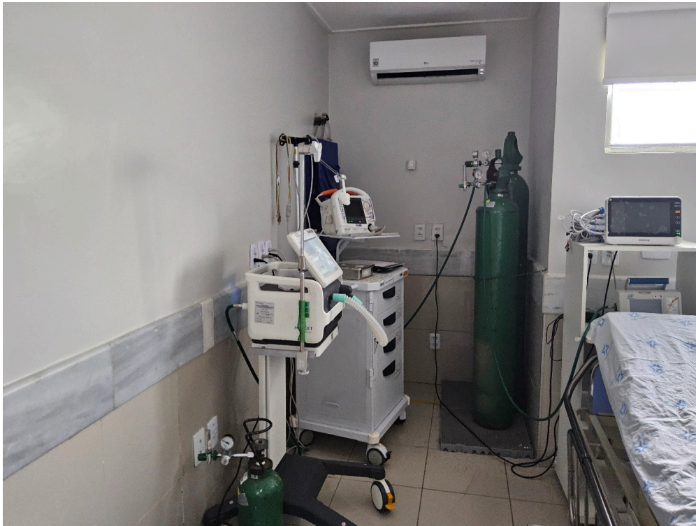
ESTRUTURA DA UNIDADE - Sala de Reanimação e Estabilização de Pacientes Graves