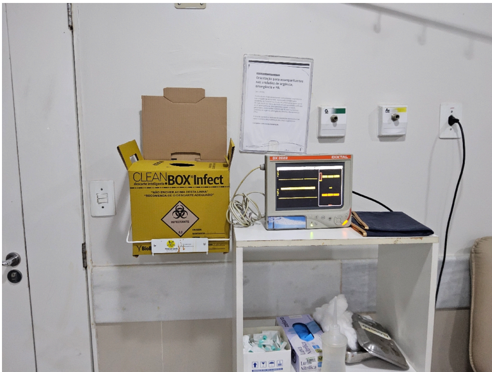
ESTRUTURA DA UNIDADE - Sala de Observação