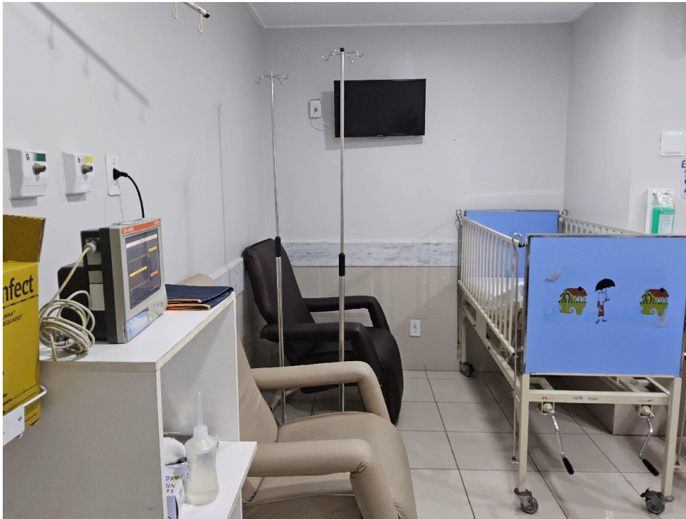
ESTRUTURA DA UNIDADE - Sala de Observação