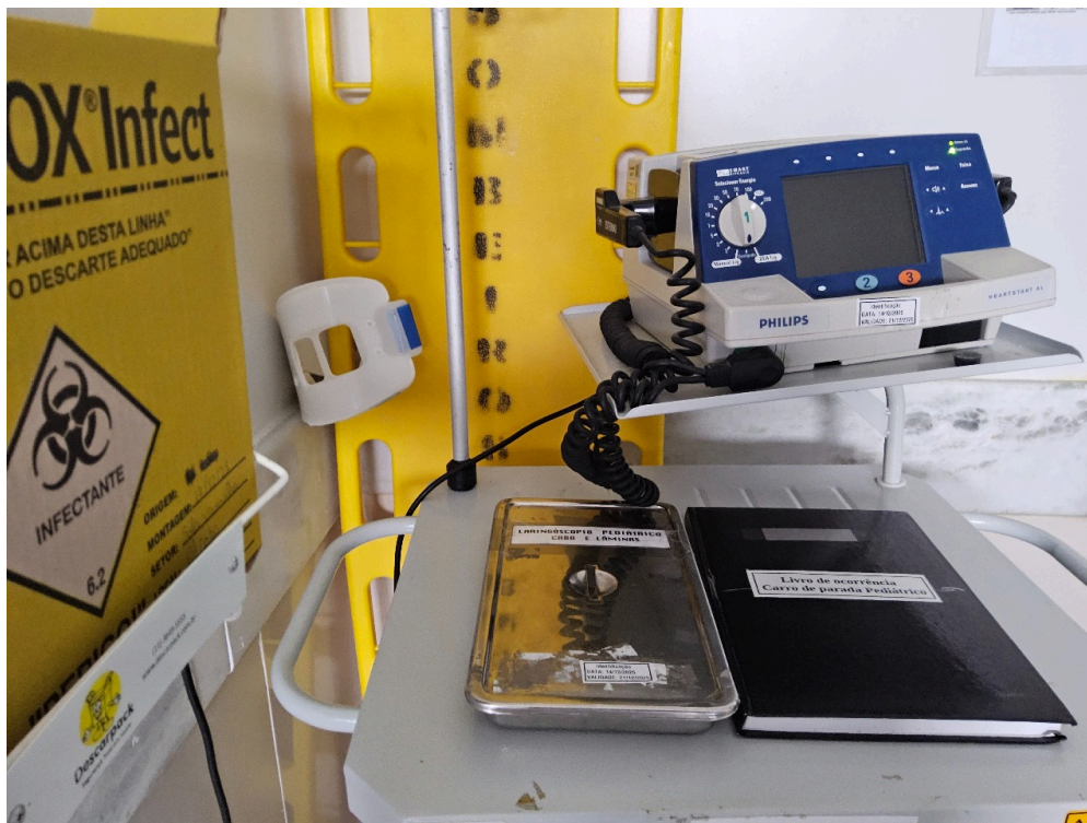
ESTRUTURA DA UNIDADE - Sala de Reanimação e Estabilização de Pacientes Graves