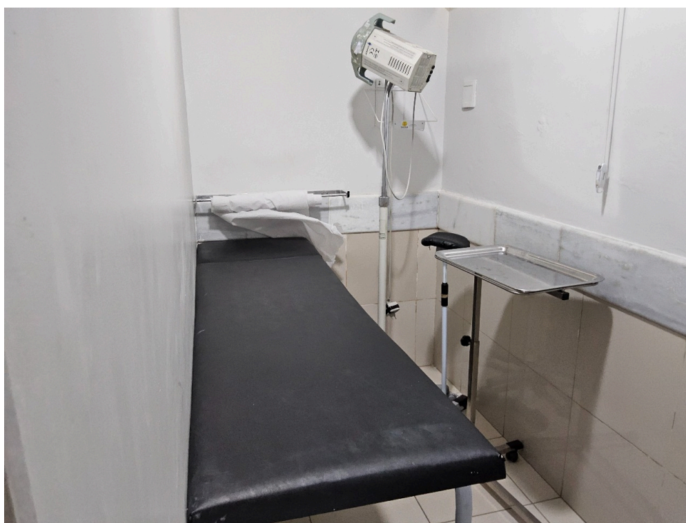
CONDICÕES MÍNIMAS PARA O EXERCÍCIO DA MEDICINA EM REGIME DE INTERNAÇÃO - Sala de curativo/sutura