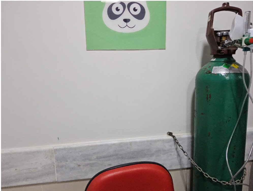
ESTRUTURA DA UNIDADE - Sala de Observação