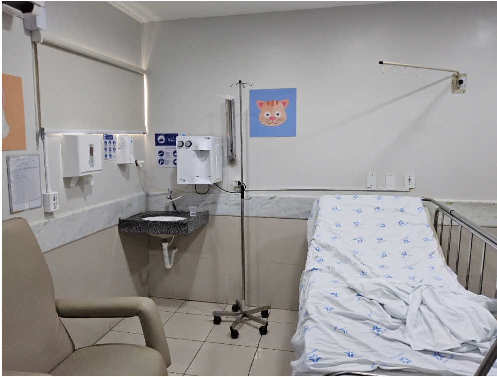
ESTRUTURA DA UNIDADE - Sala de Observação