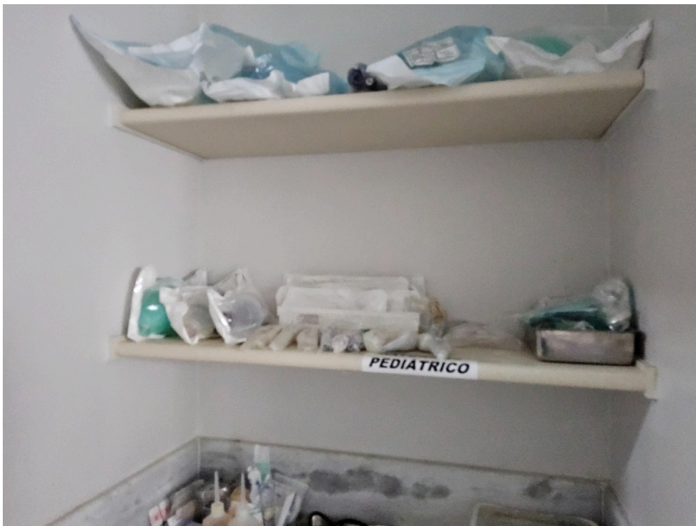
ESTRUTURA DA UNIDADE - Sala de Reanimação e Estabilização de Pacientes Graves