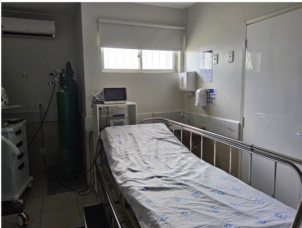
ESTRUTURA DA UNIDADE - Sala de Reanimação e Estabilização de Pacientes Graves