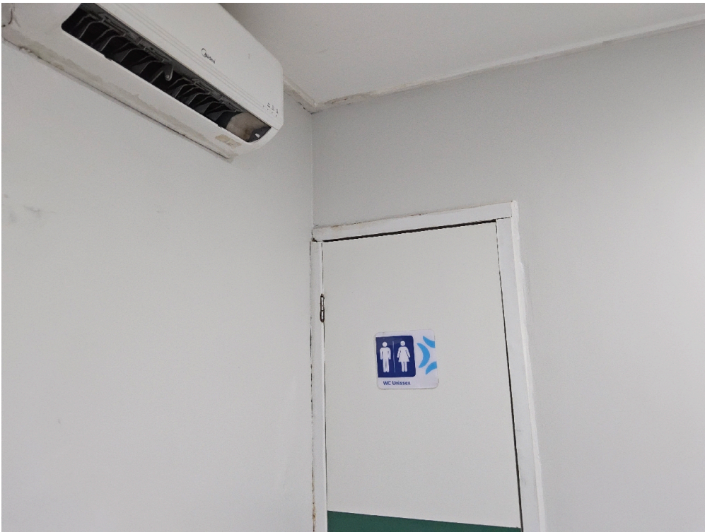
ESTRUTURA DA UNIDADE - Consultório Médico