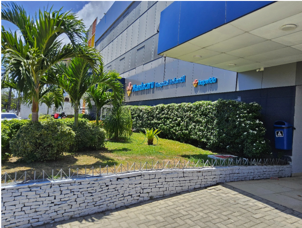
DADOS CADASTRAIS - Registro Fotográfico da Fachada