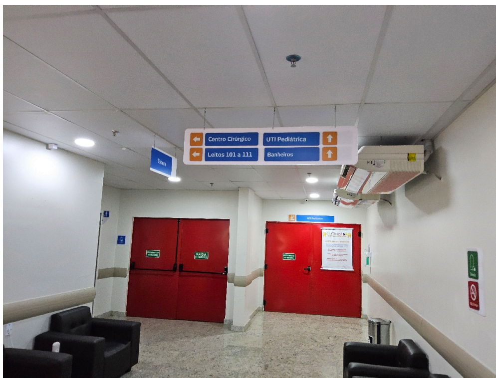
CONDIÇÕES ESTRUTURAIS DO AMBIENTE FÍSICO - GERAL - Sinalização de acessos