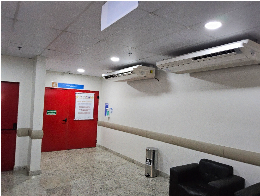
CONDIÇÕES ESTRUTURAIS DO AMBIENTE FÍSICO - GERAL - Ambiente com conforto térmico