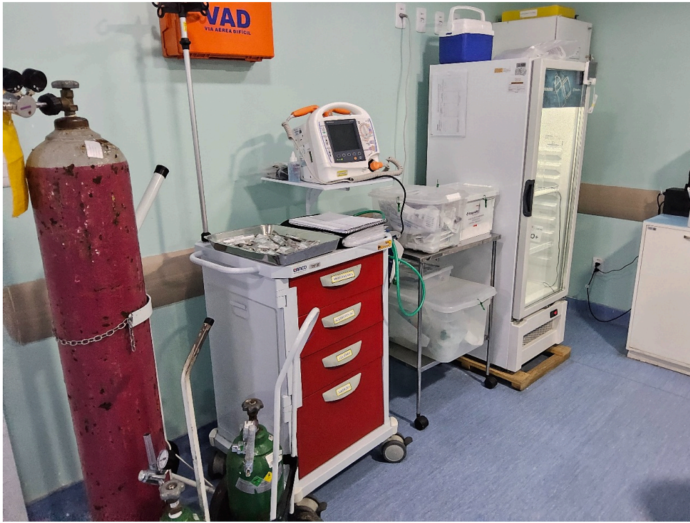
ATIVIDADES / SERVIÇOS HOSPITALARES (itens apenas informativos) - Centro cirúrgico