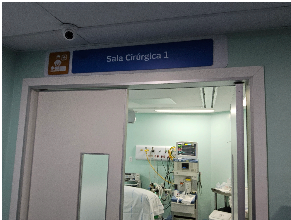
CENTRO CIRÚRGICO – CARACTERIZAÇÃO # centro cirúrgico - Número de salas cirúrgicas