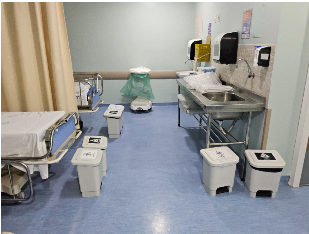
CENTRO CIRÚRGICO – CARACTERIZAÇÃO # centro cirúrgico - Número de leitos em Sala de Recuperação Pós-Anestésica