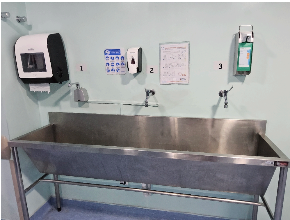
CENTRO CIRÚRGICO - INFRAESTRUTURA # centro cirúrgico - Área de escovação