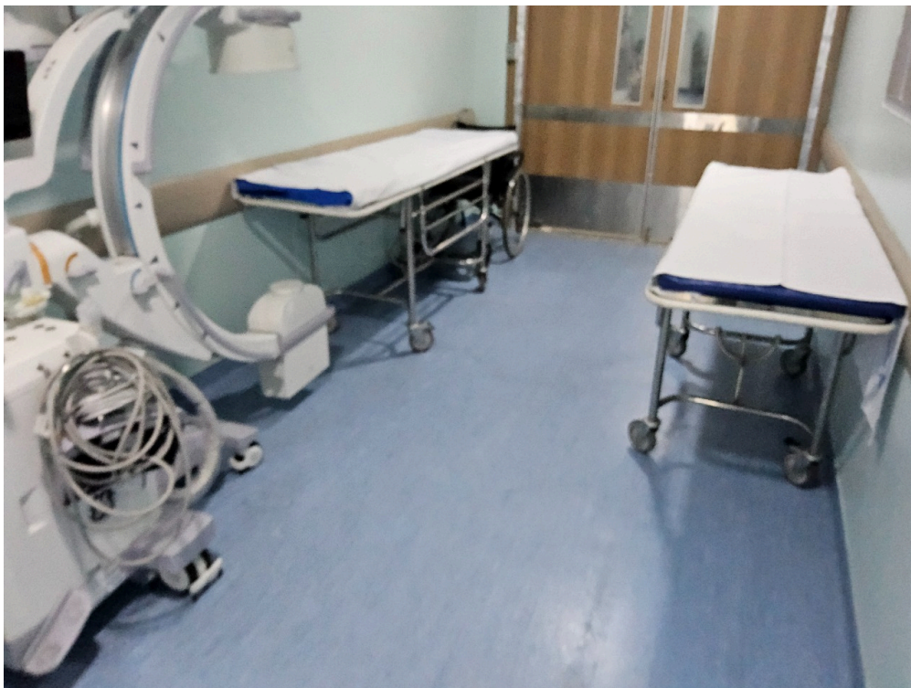
ATIVIDADES / SERVIÇOS HOSPITALARES (itens apenas informativos) - Centro cirúrgico