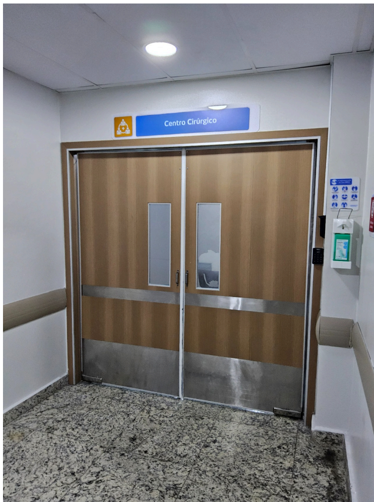
ATIVIDADES / SERVIÇOS HOSPITALARES (itens apenas informativos) - Centro cirúrgico