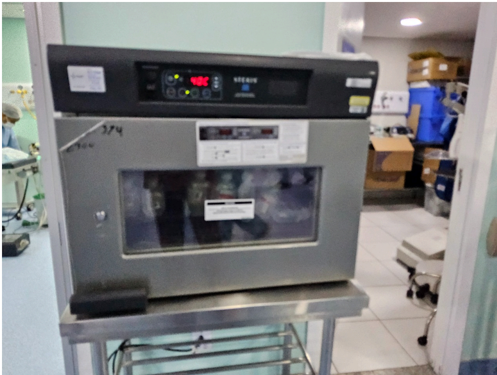
ATIVIDADES / SERVIÇOS HOSPITALARES (itens apenas informativos) - Centro cirúrgico