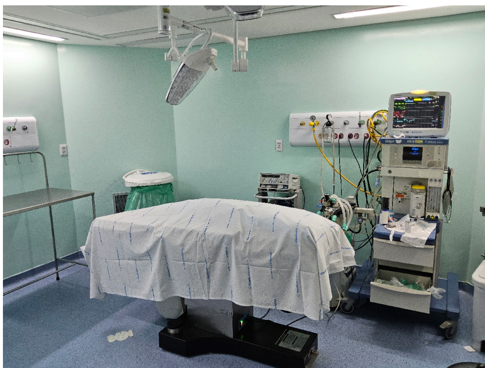
CENTRO CIRÚRGICO – CARACTERIZAÇÃO # centro cirúrgico - Número de salas cirúrgicas