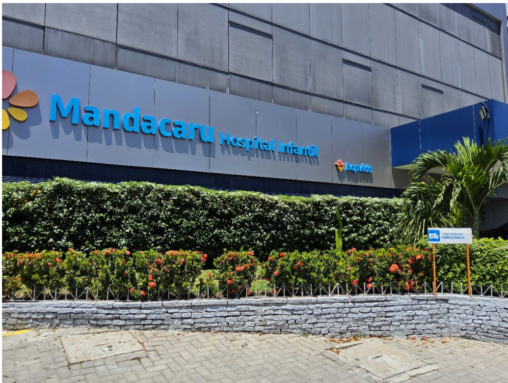
DADOS CADASTRAIS - Registro Fotográfico da Fachada