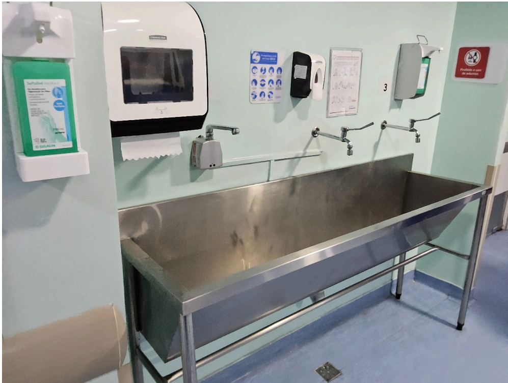
ATIVIDADES / SERVIÇOS HOSPITALARES (itens apenas informativos) - Centro cirúrgico