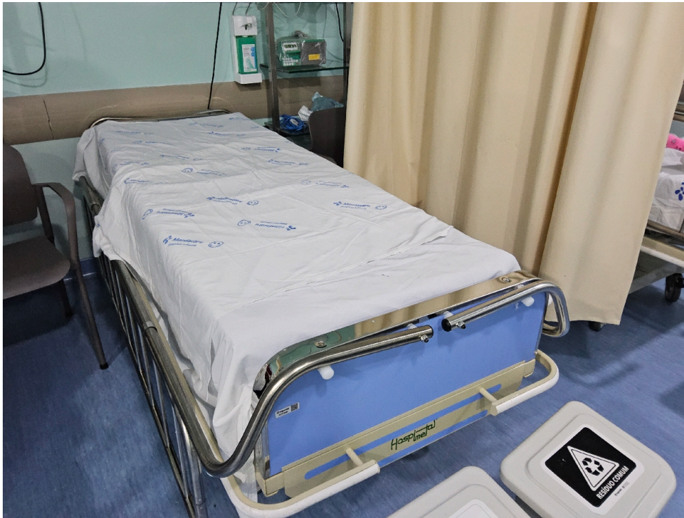
CENTRO CIRÚRGICO – CARACTERIZAÇÃO # centro cirúrgico - Número de leitos ocupados por pacientes em Sala de Recuperação Pós-Anestésica