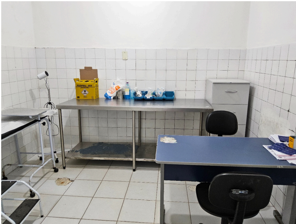
Imagem da 2ª constatação. (4)