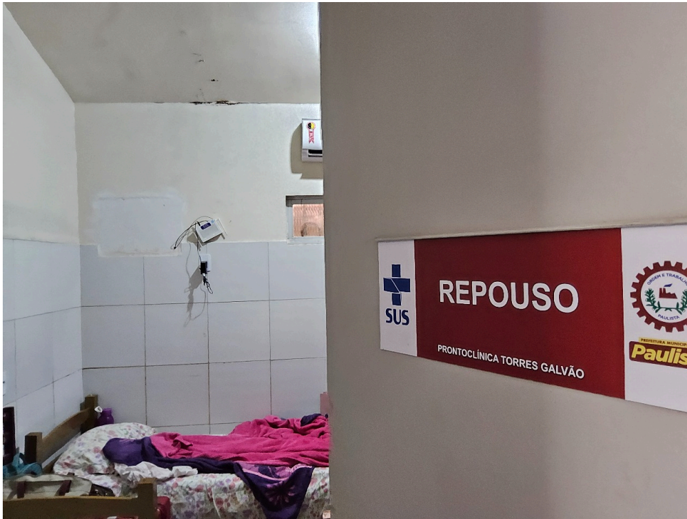
REPOUSO MÉDICO - Quarto com instalações de conforto para o médico plantonista