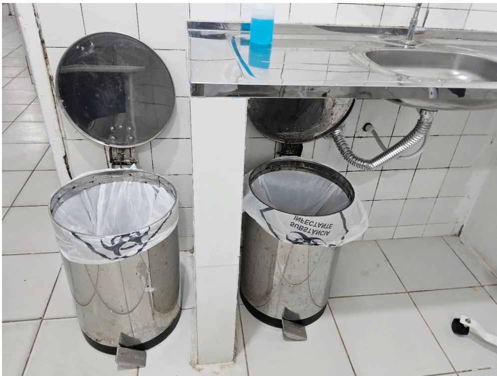
Imagem da 2ª constatação. (4)