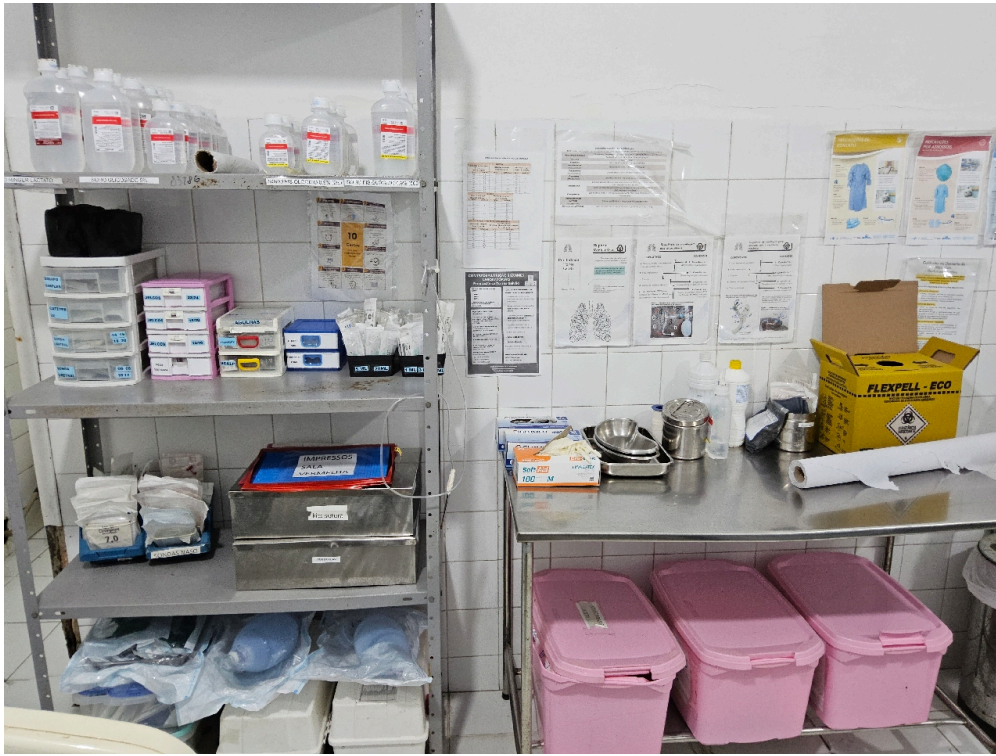
ESTRUTURA DA UNIDADE - Sala de Reanimação e Estabilização de Pacientes Graves