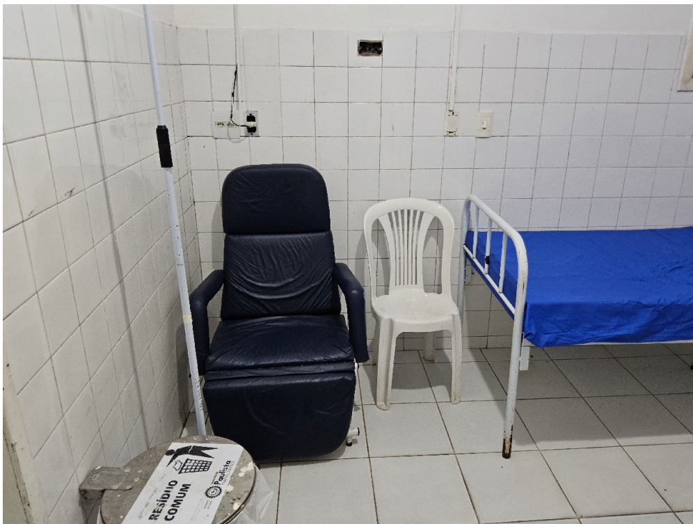
SALA DE OBSERVAÇÃO ADULTO - Número de leitos disponíveis