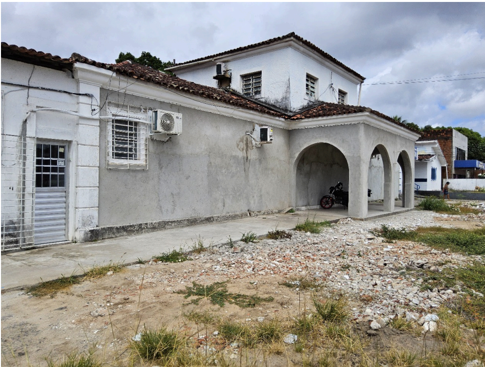
DADOS CADASTRAIS - Registro Fotográfico da Fachada