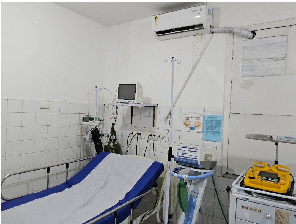
ESTRUTURA DA UNIDADE - Sala de Reanimação e Estabilização de Pacientes Graves