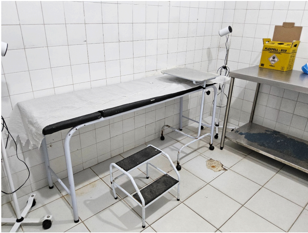
Imagem da 2ª constatação. (4)