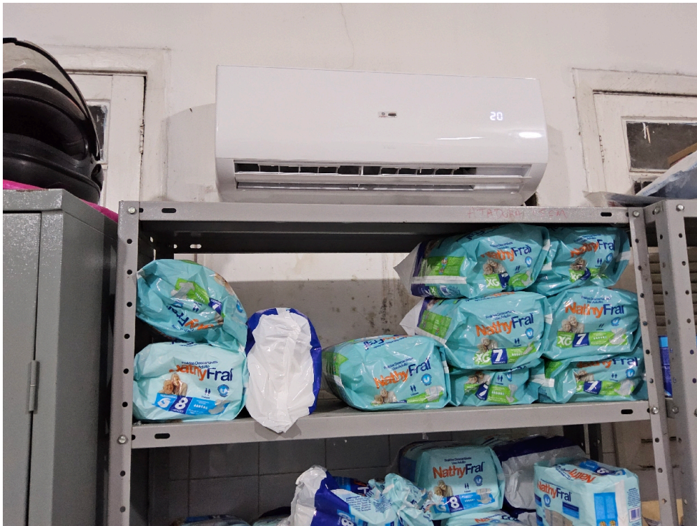
MEDICAMENTOS DISPONÍVEIS - Ácido acetilsalicílico 100