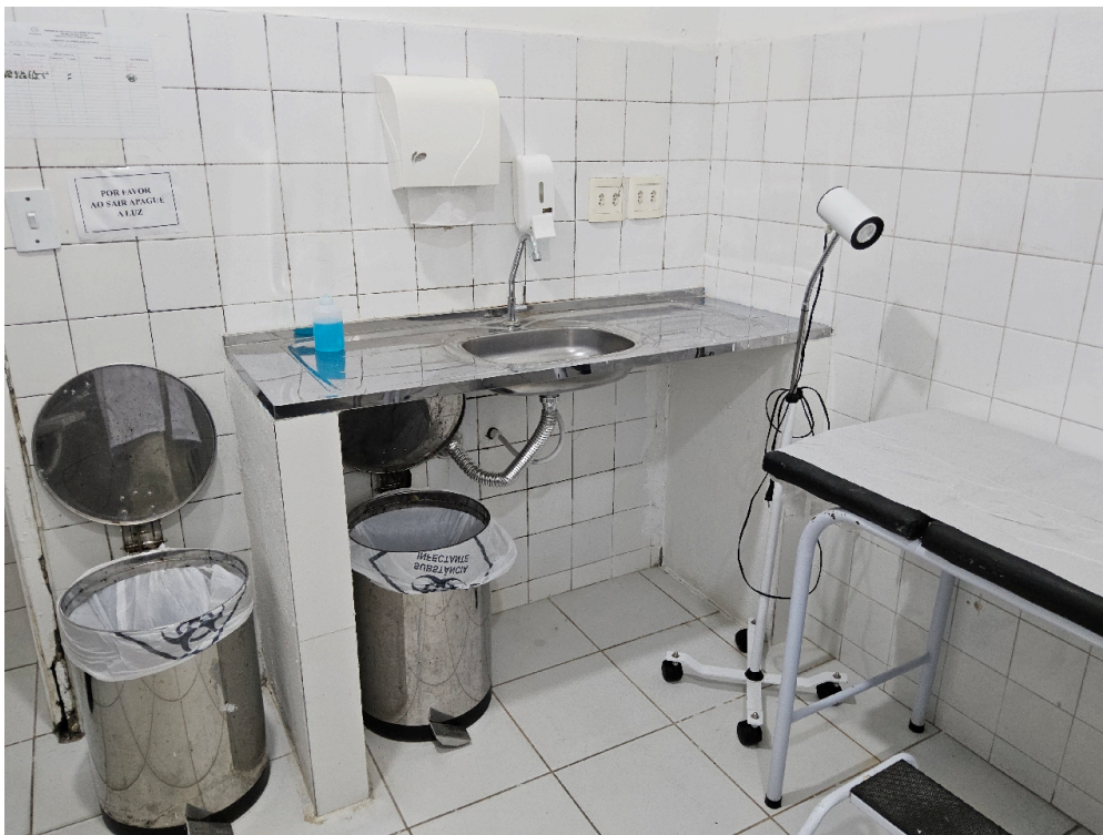
Consultório INDIFERENCIADO - grupo 1 # consultório - Há garantias de privacidade para o paciente