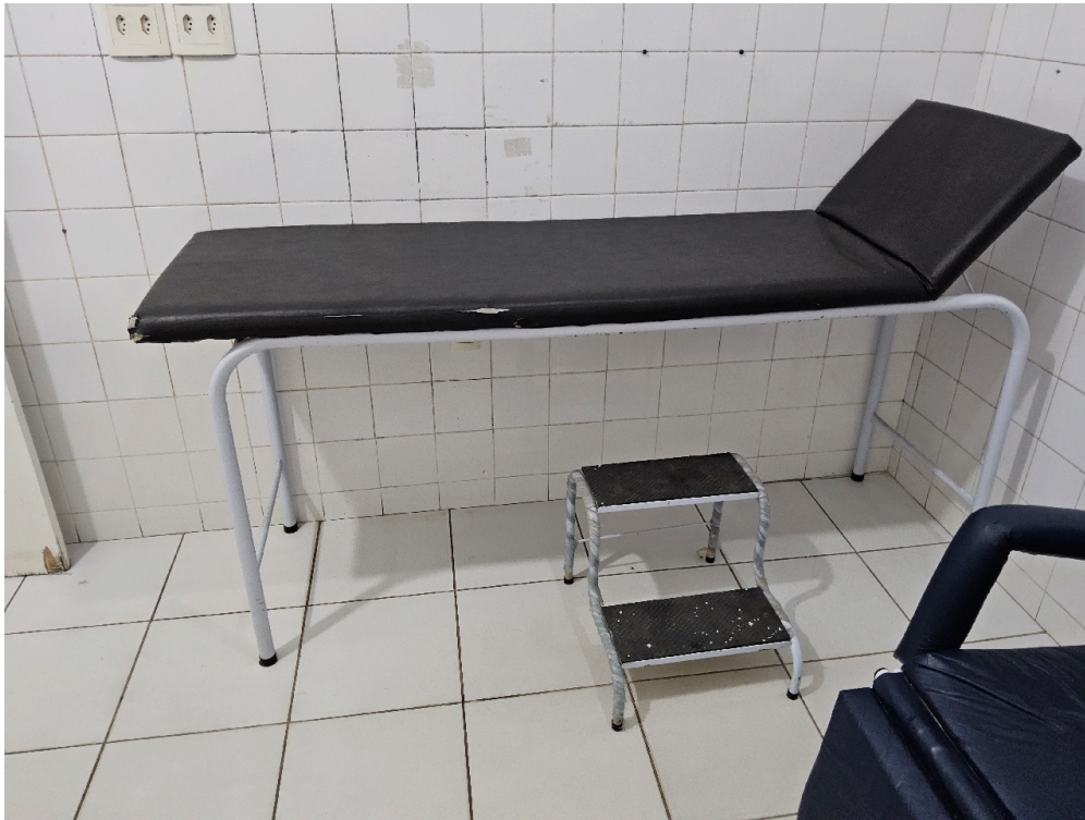
Consultório INDIFERENCIADO - grupo 1 # consultório - Lençóis para as macas