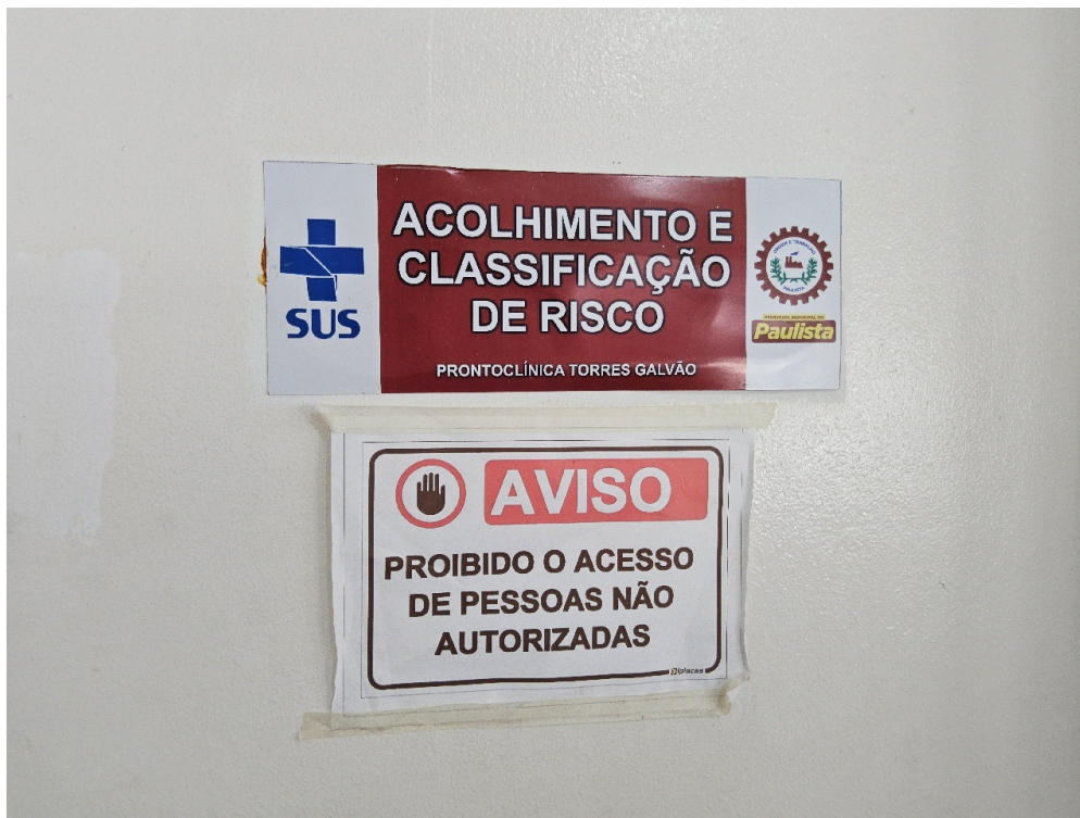
CLASSIFICAÇÃO DE RISCO - Há Acolhimento com Classificação de Risco