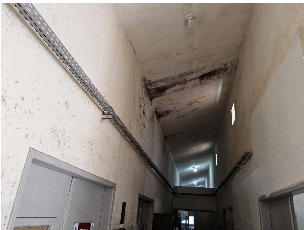
CONDIÇÕES ESTRUTURAIS DO AMBIENTE FÍSICO - GERAL - Instalações livres de trincas, rachaduras, mofos e/ou infiltrações