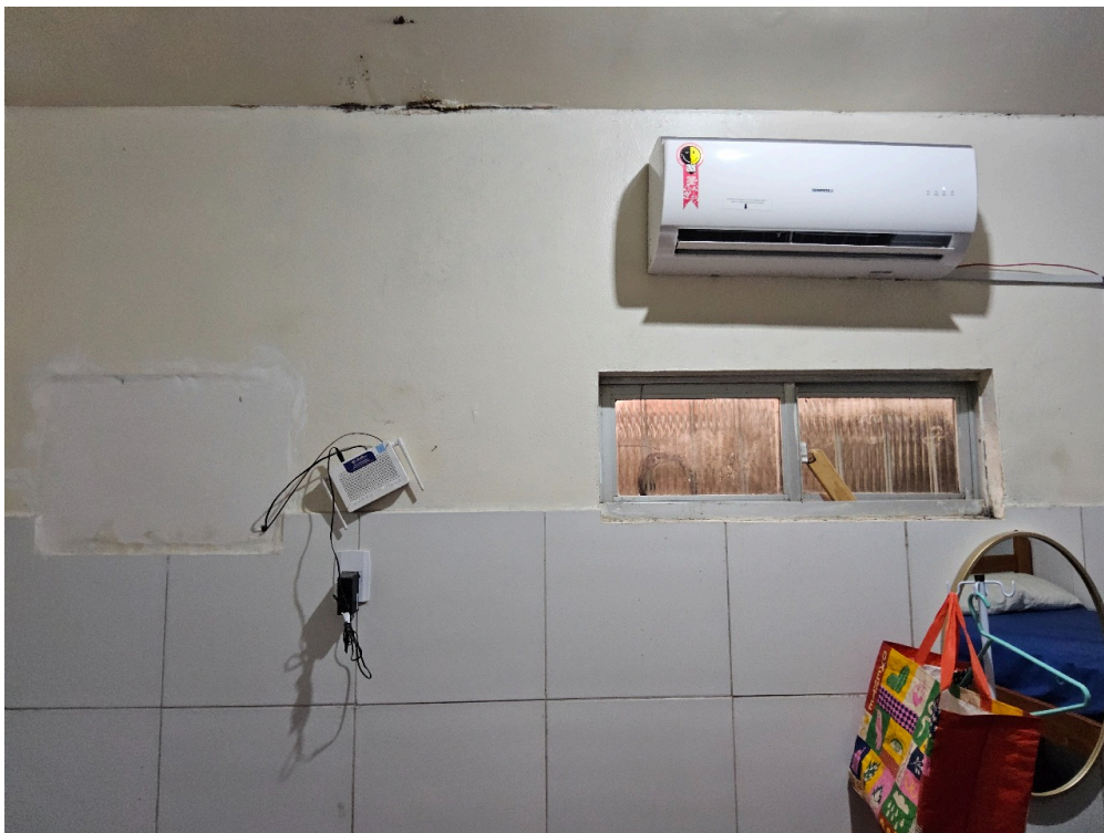
REPOUSO MÉDICO - Quarto com instalações de conforto para o médico plantonista