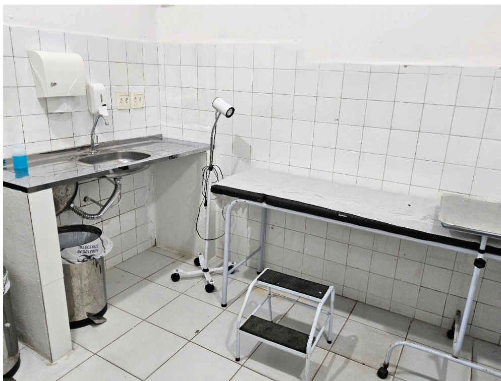
Imagem da 2ª constatação. (2)