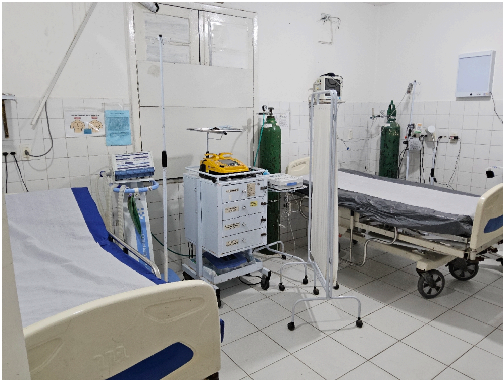
ESTRUTURA DA UNIDADE - Sala de Reanimação e Estabilização de Pacientes Graves