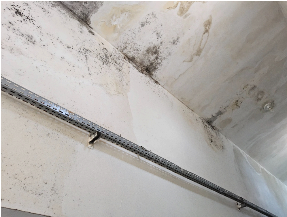
CONDIÇÕES ESTRUTURAIS DO AMBIENTE FÍSICO - GERAL - Instalações livres de trincas, rachaduras, mofos e/ou infiltrações