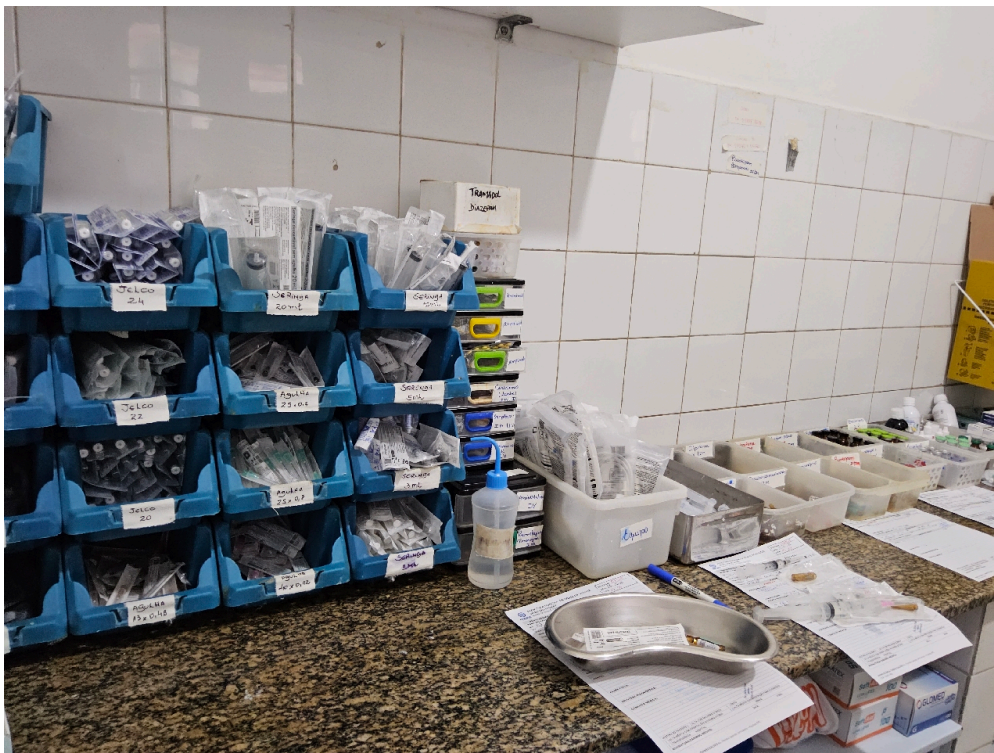
ESTRUTURA DA UNIDADE - Sala de Medicação