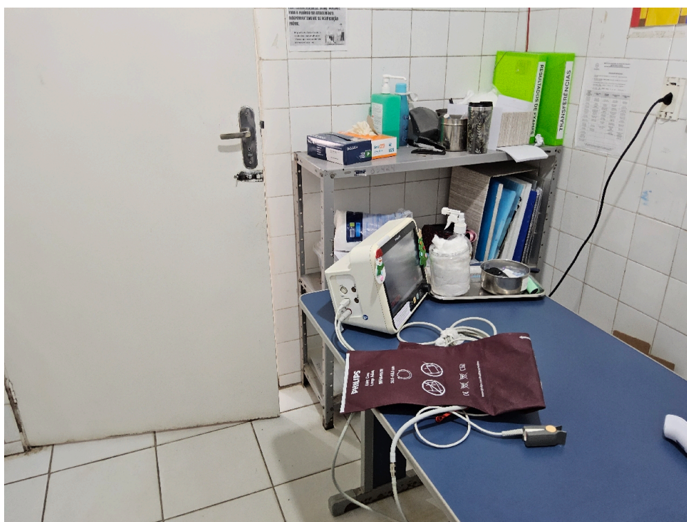
CLASSIFICAÇÃO DE RISCO - Há Acolhimento com Classificação de Risco