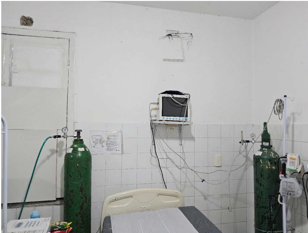
ESTRUTURA DA UNIDADE - Sala de Reanimação e Estabilização de Pacientes Graves