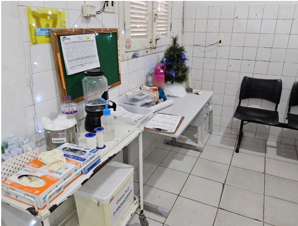
ESTRUTURA DA UNIDADE - Sala de Medicação