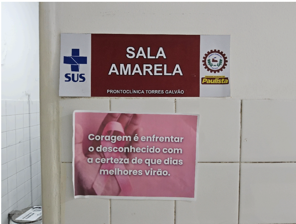
ESTRUTURA DA UNIDADE - Sala de Observação