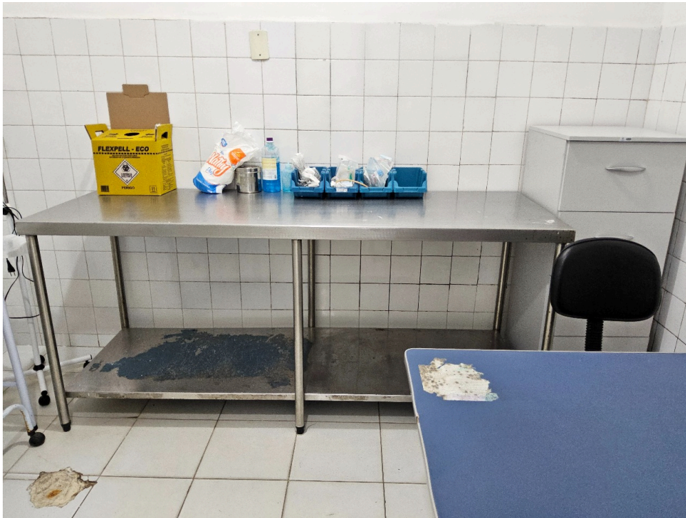
Imagem da 2ª constatação. (3)