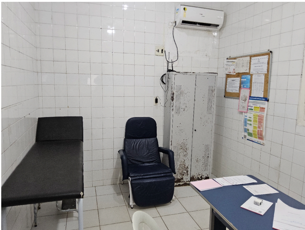
Consultório INDIFERENCIADO - grupo 1 # consultório - Os exames físicos são acompanhados por auxiliar de sala