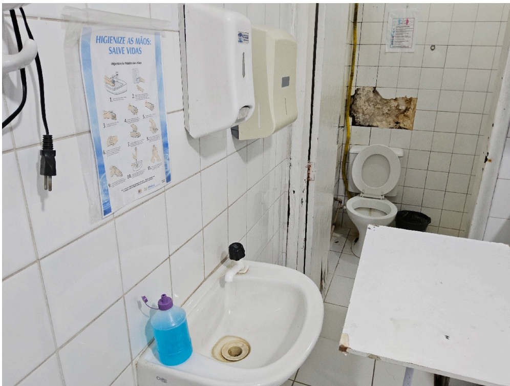
ESTRUTURA DA UNIDADE - Sala de Reanimação e Estabilização de Pacientes Graves