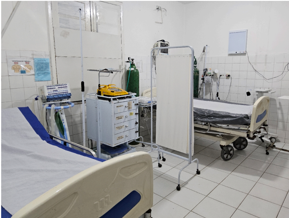
SALA DE REANIMAÇÃO E ESTABILIZAÇÃO DE PACIENTES GRAVES (SALA DE URGÊNCIA, EMERGÊNCIA OU VERMELHA) – ADULTO - Conta com, no mínimo, duas macas/leitos