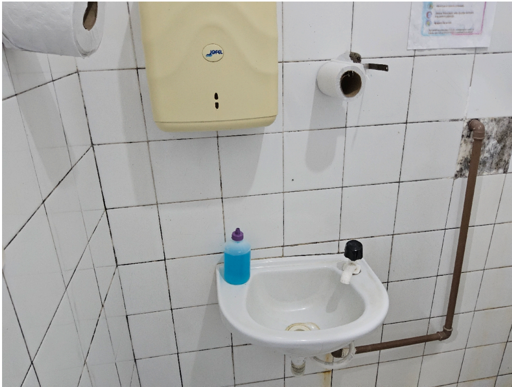
ESTRUTURA DA UNIDADE - Sala de Observação