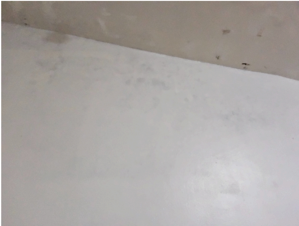
REPOUSO MÉDICO - Quarto com instalações de conforto para o médico plantonista