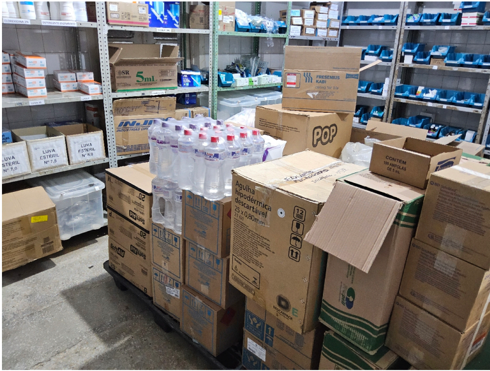
MEDICAMENTOS DISPONÍVEIS - Ácido acetilsalicílico 100