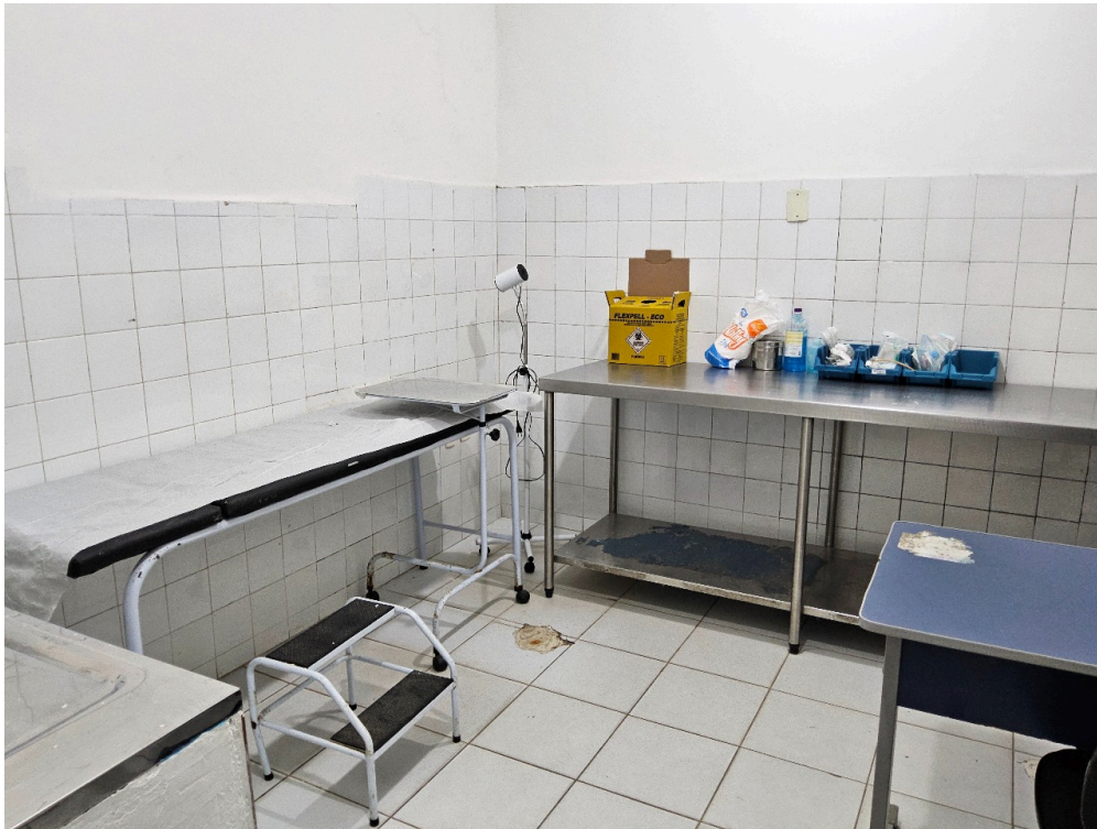
Imagem da 2ª constatação. (4)