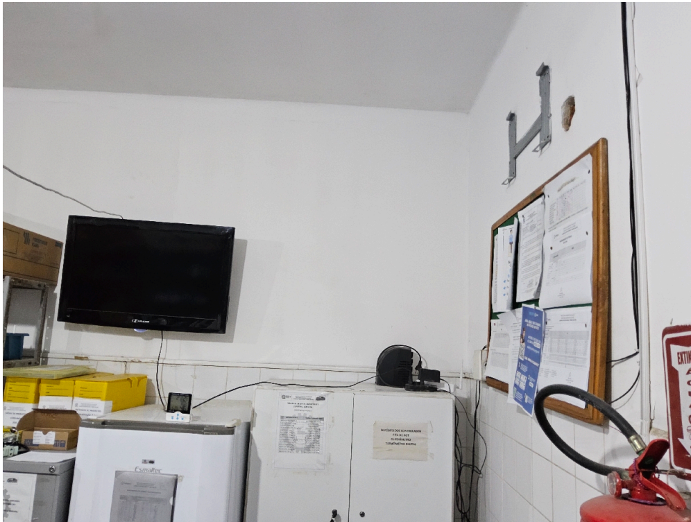
MEDICAMENTOS DISPONÍVEIS - Ácido acetilsalicílico 100