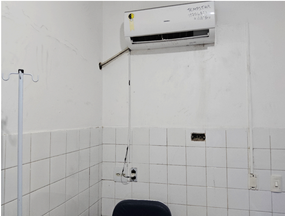
SALA DE OBSERVAÇÃO ADULTO - Número de leitos disponíveis