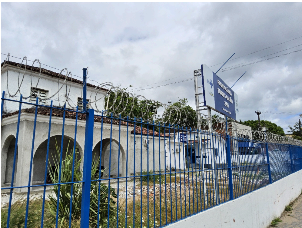
DADOS CADASTRAIS - Registro Fotográfico da Fachada