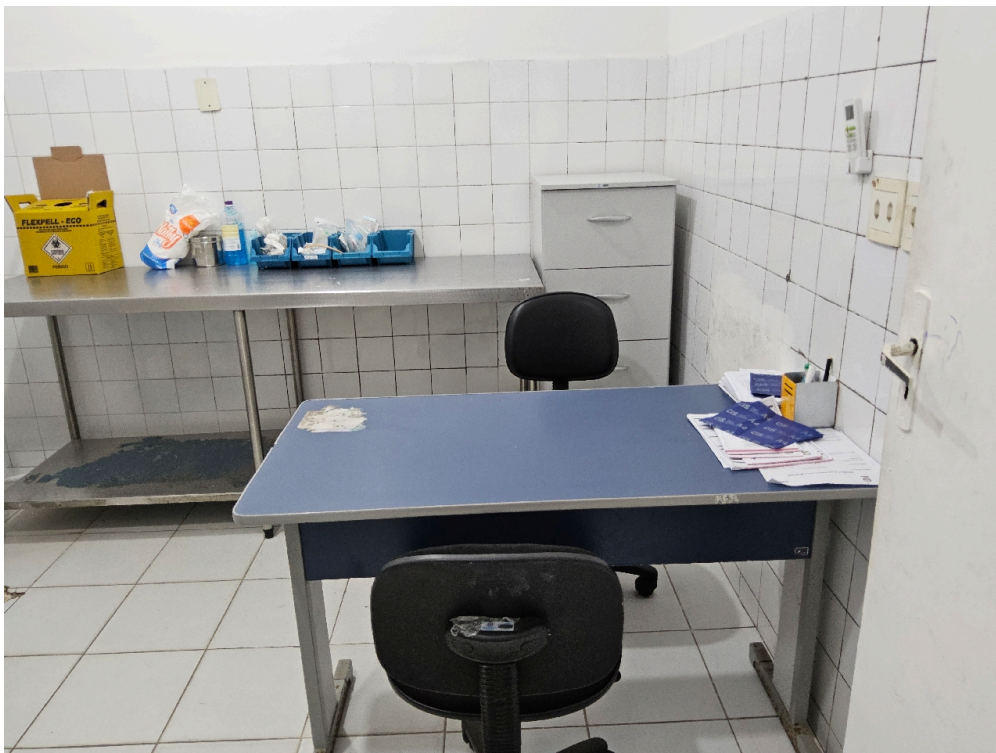
Consultório INDIFERENCIADO - grupo 1 # consultório - Há garantias de privacidade para o paciente