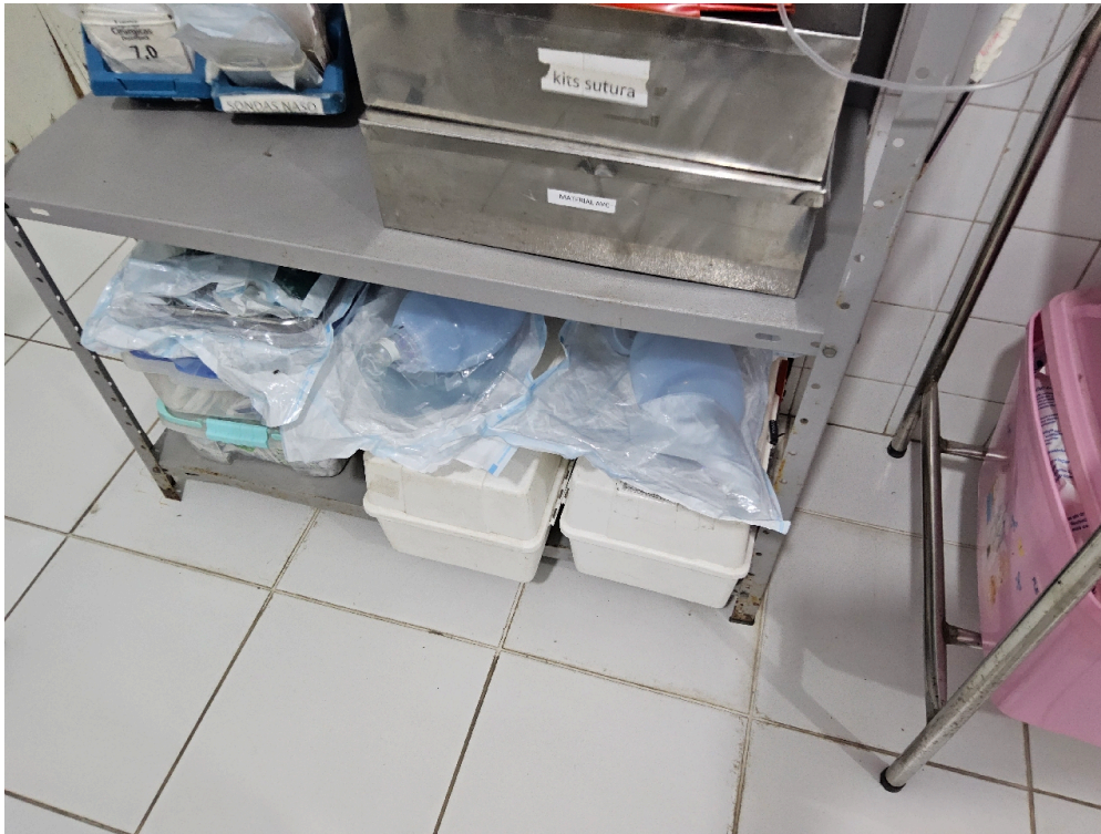
SALA DE REANIMAÇÃO E ESTABILIZAÇÃO DE PACIENTES GRAVES (SALA DE URGÊNCIA, EMERGÊNCIA OU VERMELHA) – ADULTO - Ressuscitador manual do tipo balão auto inflável com reservatório e máscara