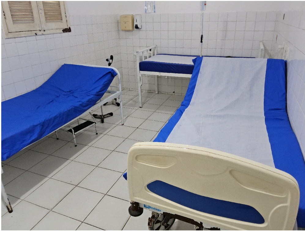
ESTRUTURA DA UNIDADE - Sala de Observação