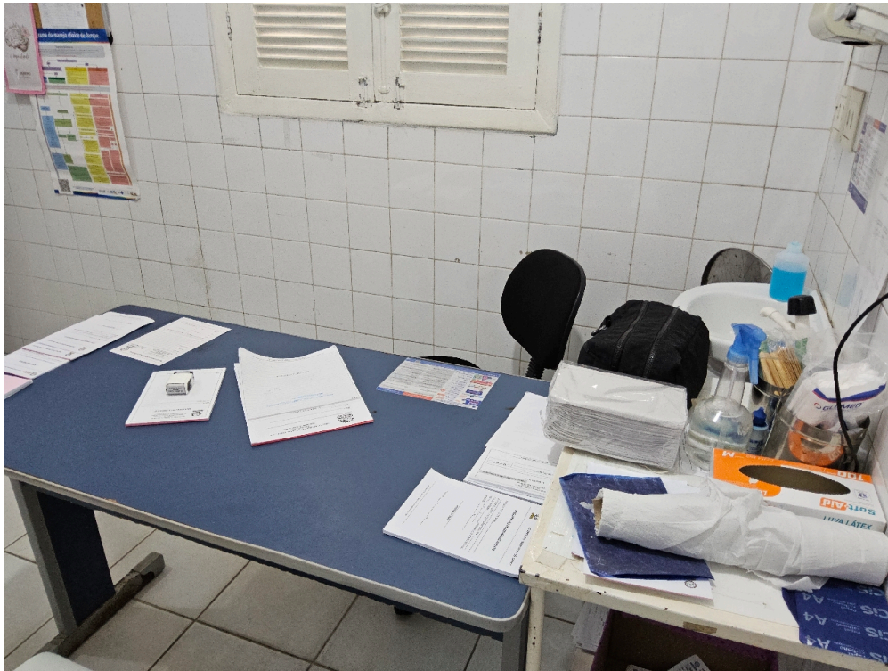
Consultório INDIFERENCIADO - grupo 1 # consultório - Há garantias de privacidade para o paciente