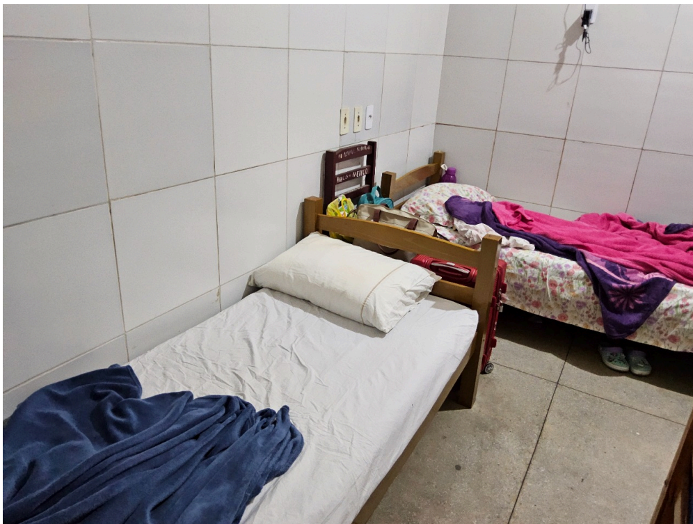
REPOUSO MÉDICO - Quarto com instalações de conforto para o médico plantonista