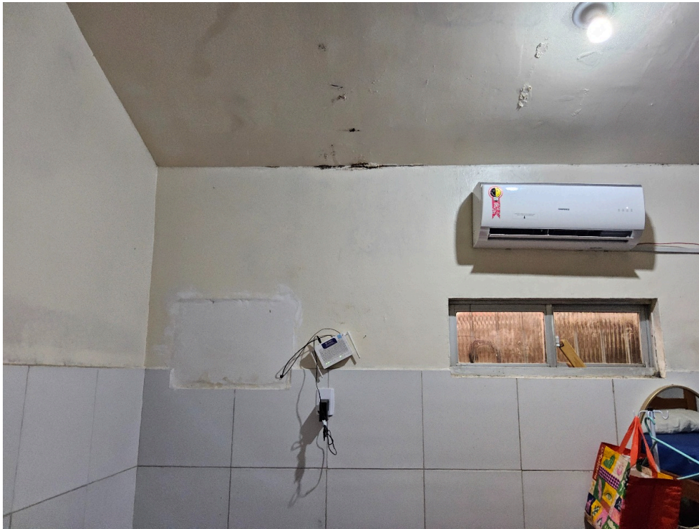
REPOUSO MÉDICO - Quarto com instalações de conforto para o médico plantonista