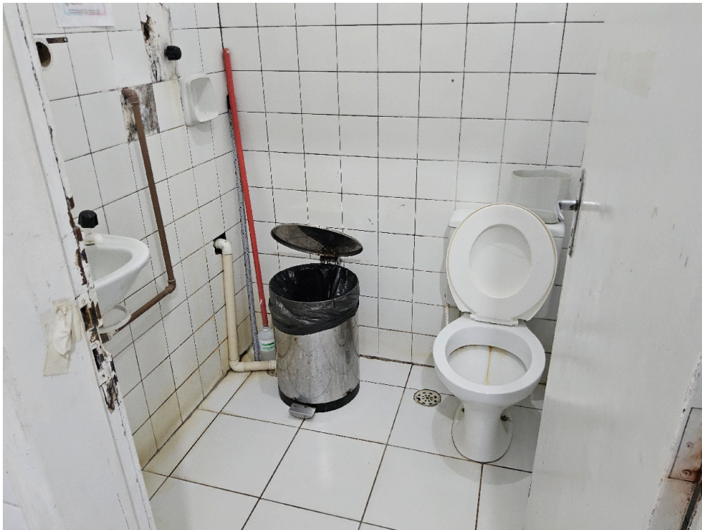
ESTRUTURA DA UNIDADE - Sala de Observação