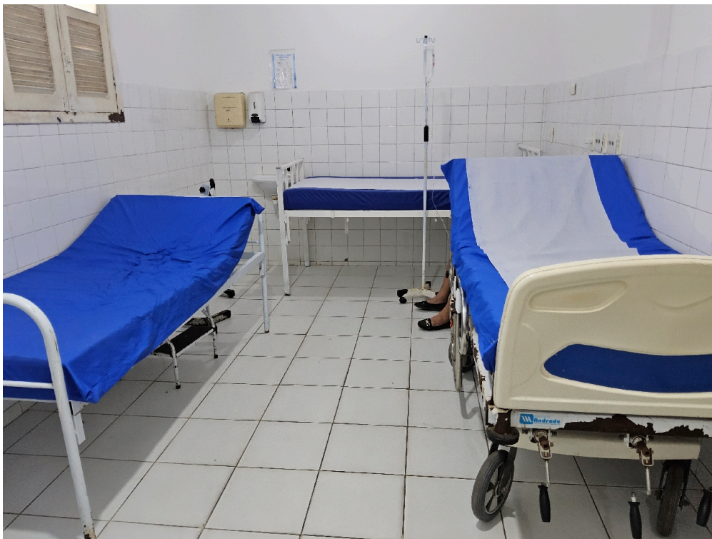
SALA DE OBSERVAÇÃO ADULTO - Número de leitos disponíveis