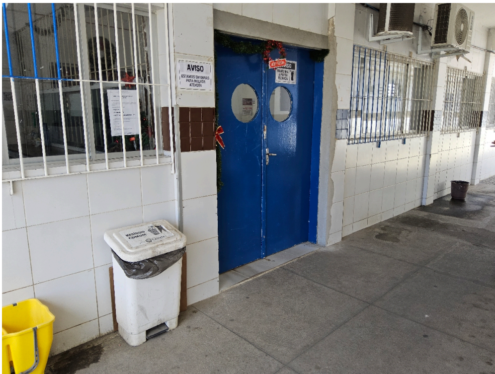
ESTRUTURA DA UNIDADE - Entrada da ambulância tem acesso ágil para a Sala de Reanimação e Estabilização de Pacientes Graves