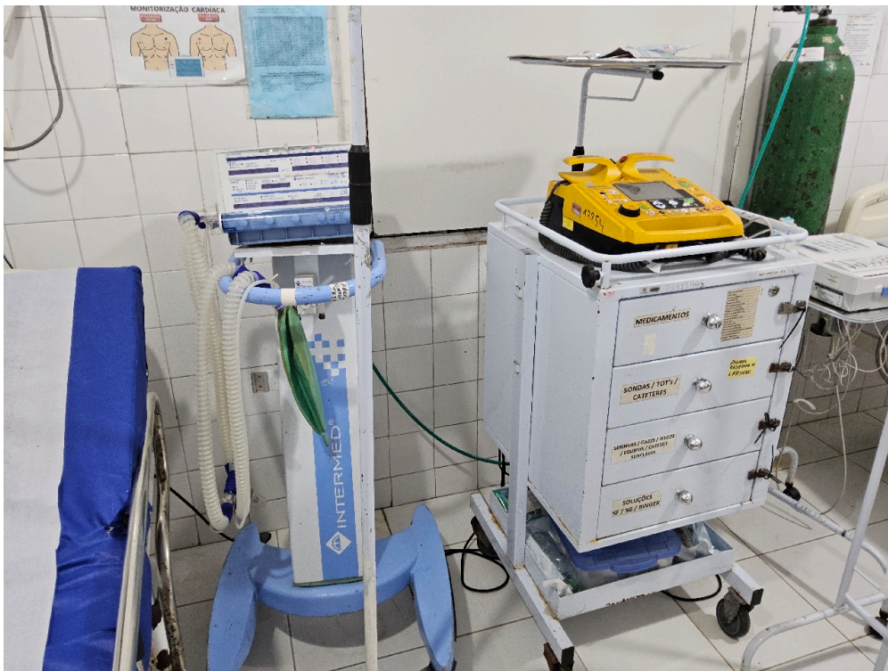
ESTRUTURA DA UNIDADE - Sala de Reanimação e Estabilização de Pacientes Graves