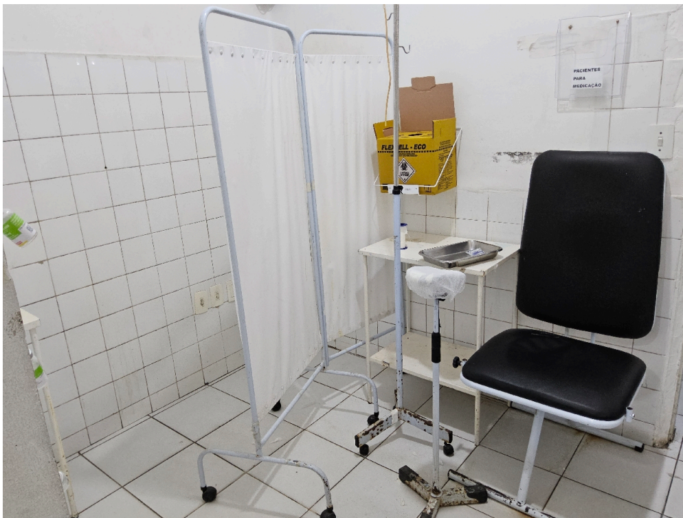
ESTRUTURA DA UNIDADE - Sala de Medicação