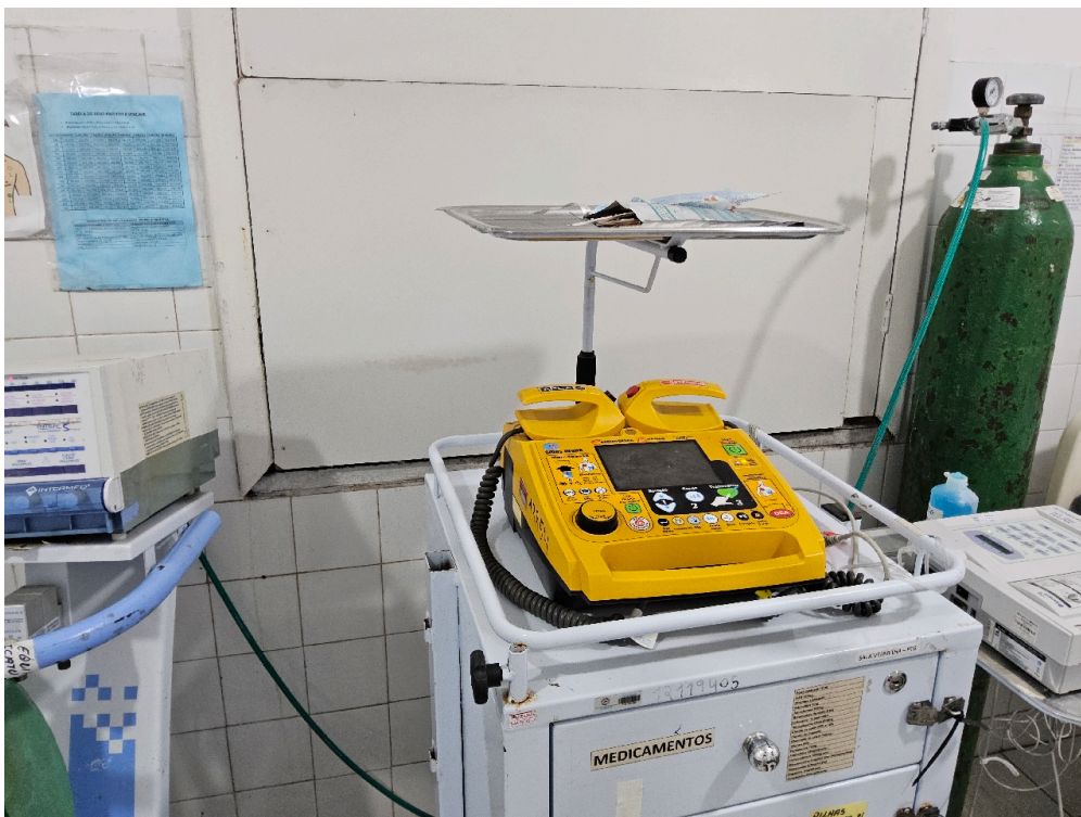
SALA DE REANIMAÇÃO E ESTABILIZAÇÃO DE PACIENTES GRAVES (SALA DE URGÊNCIA, EMERGÊNCIA OU VERMELHA) – ADULTO - Desfibrilador com monitor