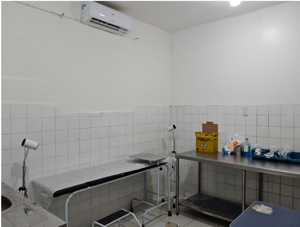
Consultório INDIFERENCIADO - grupo 1 # consultório - Há garantias de privacidade para o paciente