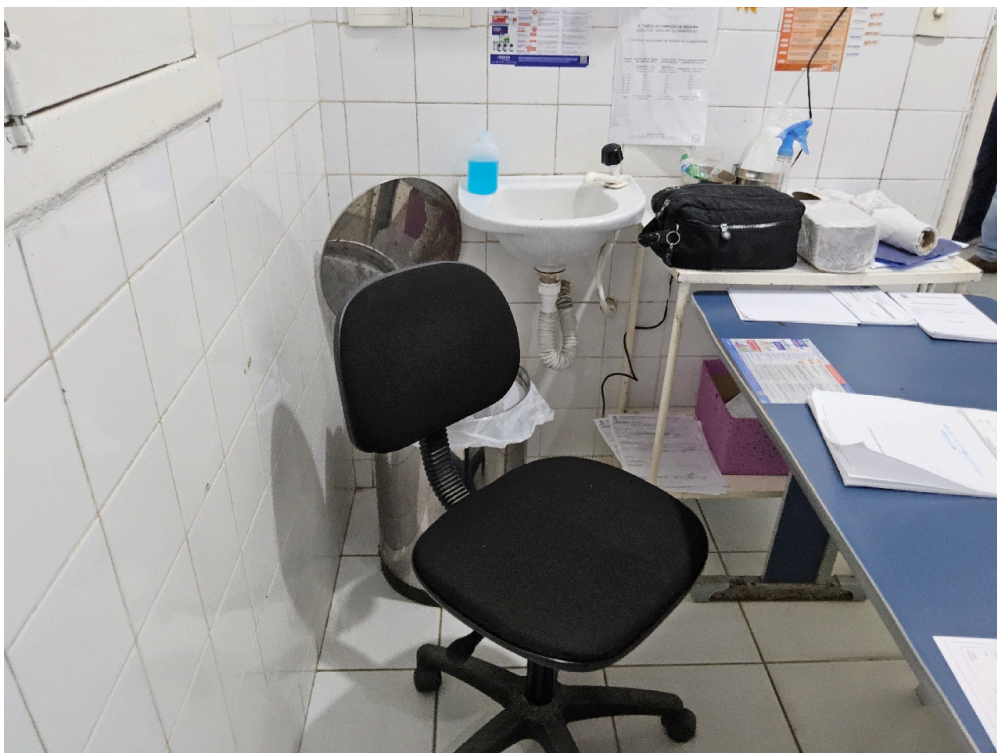
Consultório INDIFERENCIADO - grupo 1 # consultório - 1 cadeira ou poltrona para o médico