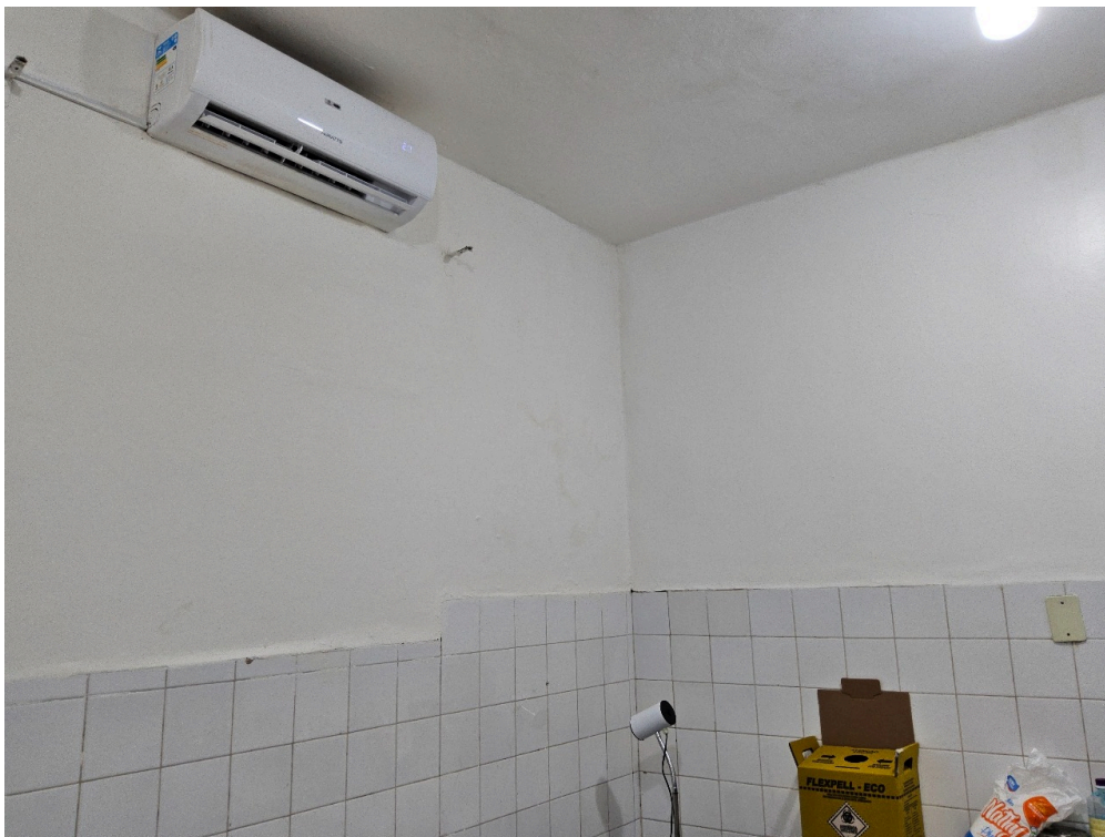
Imagem da 2ª constatação. (4)