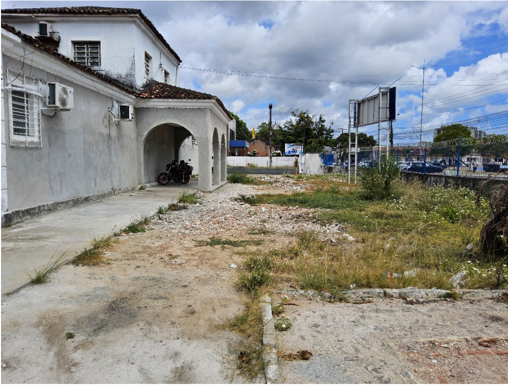
DADOS CADASTRAIS - Registro Fotográfico da Fachada