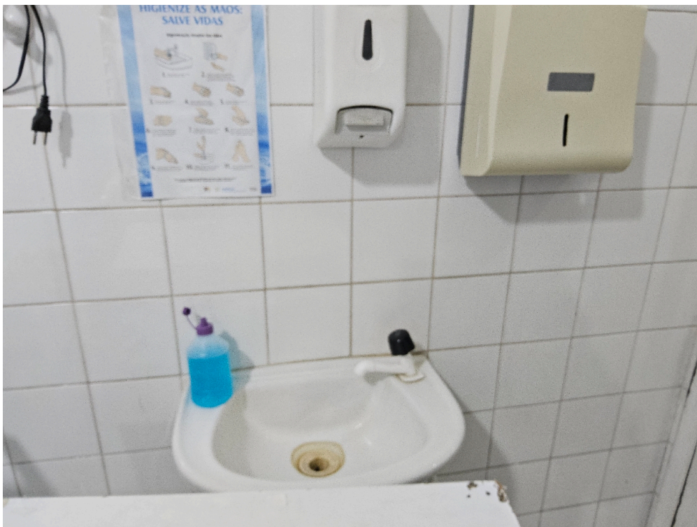
SALA DE REANIMAÇÃO E ESTABILIZAÇÃO DE PACIENTES GRAVES (SALA DE URGÊNCIA, EMERGÊNCIA OU VERMELHA) – ADULTO - Pia com água corrente