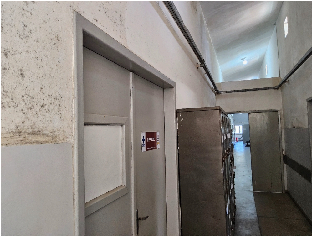
CONDIÇÕES ESTRUTURAIS DO AMBIENTE FÍSICO - GERAL - Instalações livres de trincas, rachaduras, mofos e/ou infiltrações