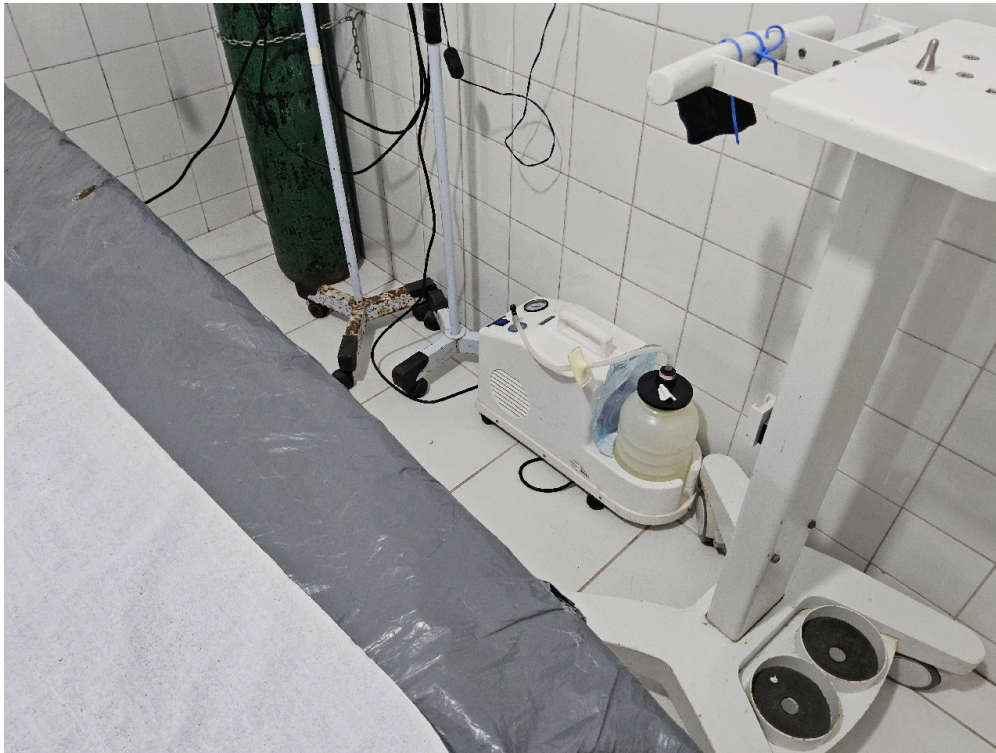
SALA DE REANIMAÇÃO E ESTABILIZAÇÃO DE PACIENTES GRAVES (SALA DE URGÊNCIA, EMERGÊNCIA OU VERMELHA) – ADULTO - Aspirador de secreções