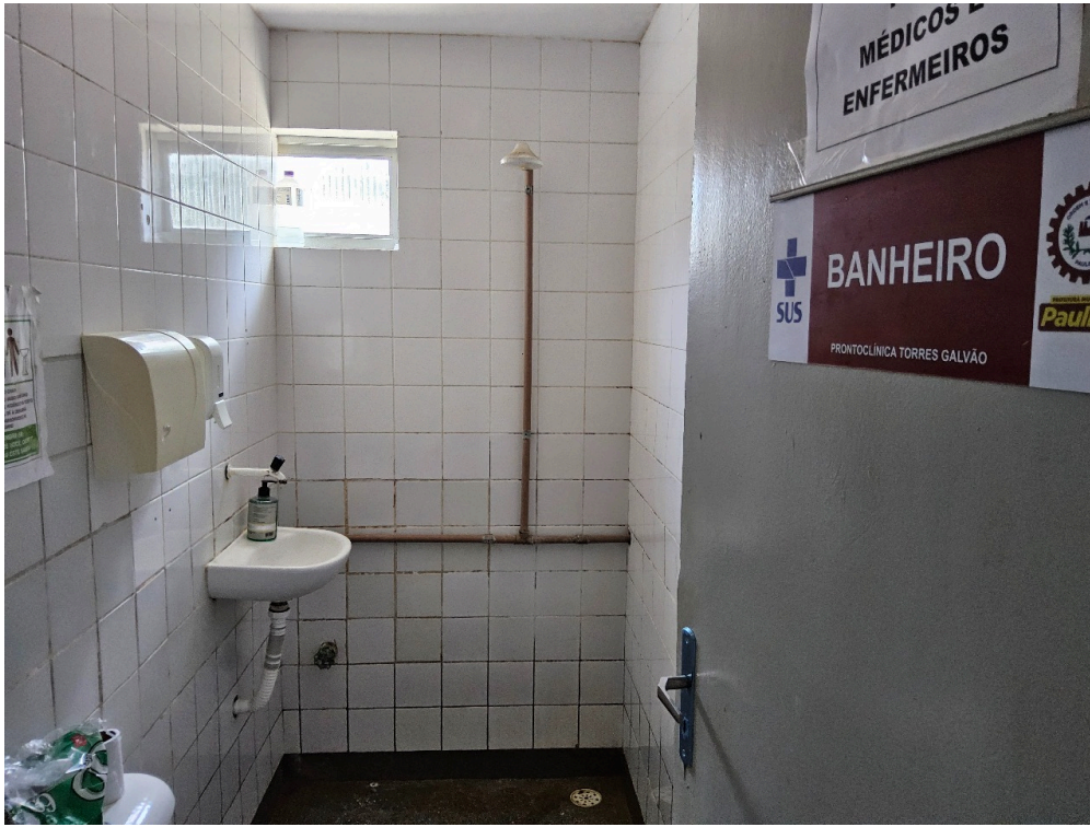
REPOUSO MÉDICO - Quarto com instalações de conforto para o médico plantonista