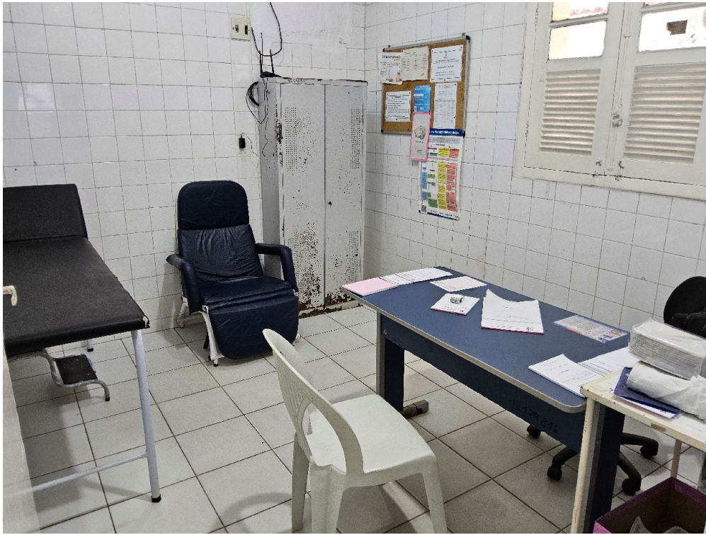
Consultório INDIFERENCIADO - grupo 1 # consultório - 2 cadeiras ou poltronas - uma para o paciente e outra para o acompanhante