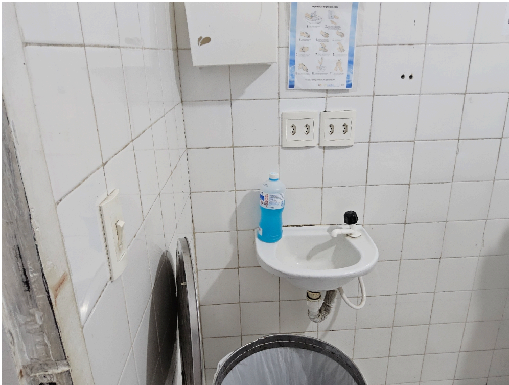
CLASSIFICAÇÃO DE RISCO - Há Acolhimento com Classificação de Risco