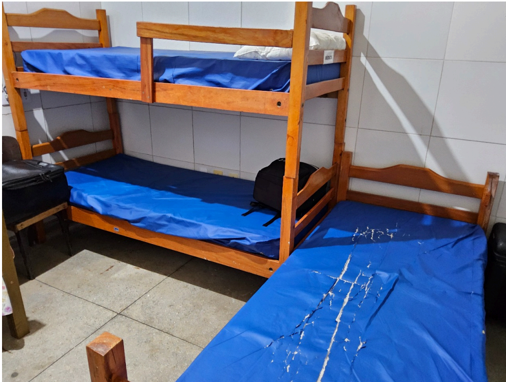
REPOUSO MÉDICO - Quarto com instalações de conforto para o médico plantonista