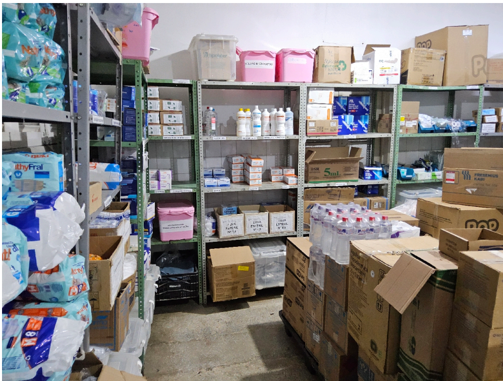
MEDICAMENTOS DISPONÍVEIS - Ácido acetilsalicílico 100