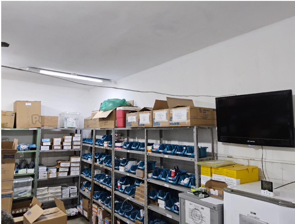
MEDICAMENTOS DISPONÍVEIS - Ácido acetilsalicílico 100