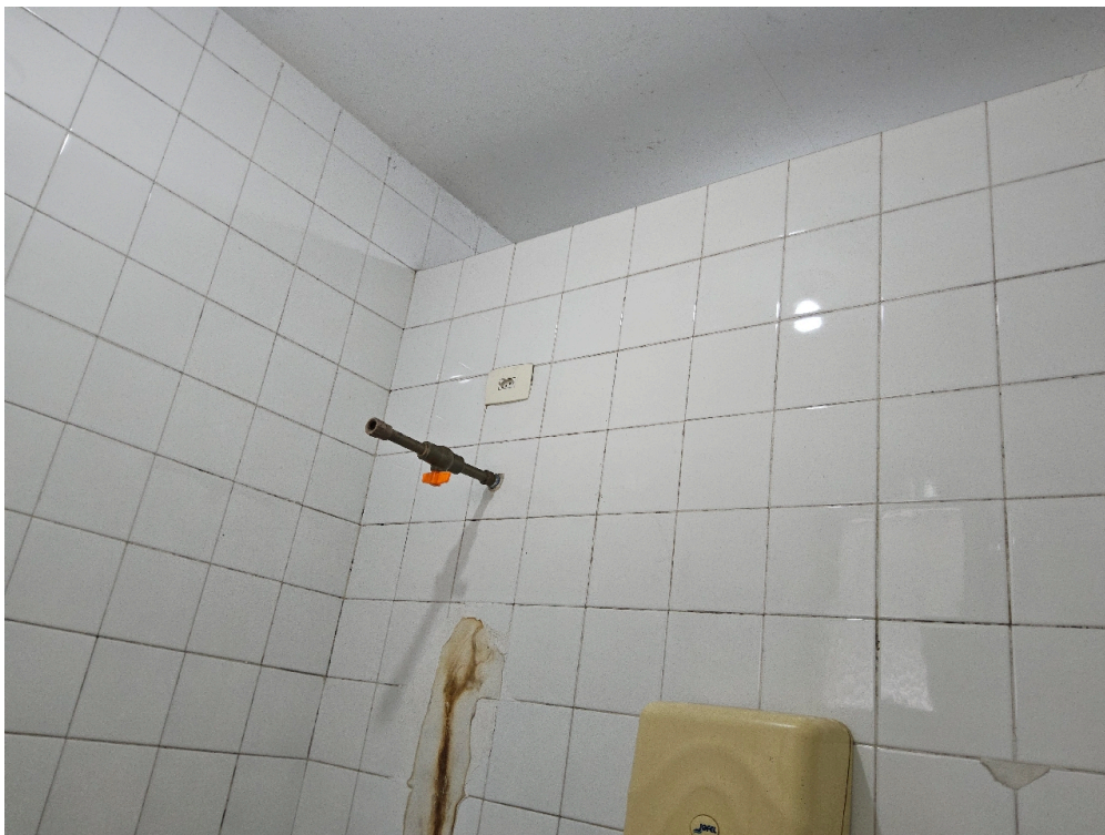
ESTRUTURA DA UNIDADE - Sala de Reanimação e Estabilização de Pacientes Graves