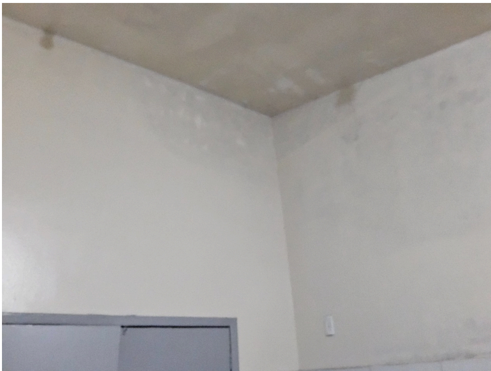
REPOUSO MÉDICO - Quarto com instalações de conforto para o médico plantonista