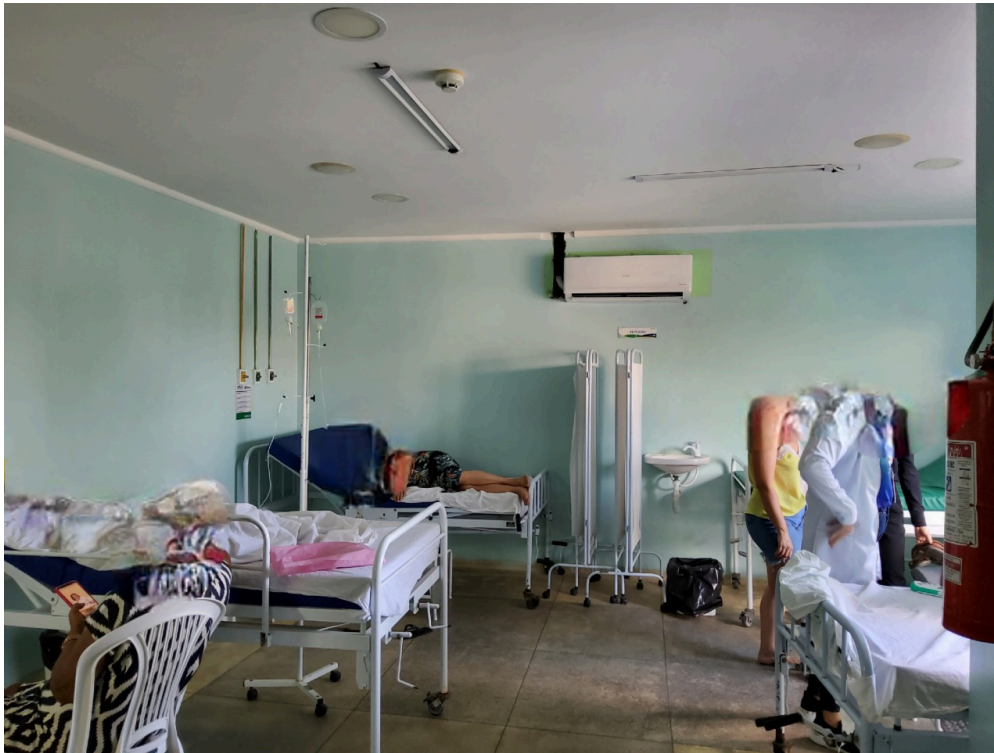
SALA COLETIVA DE OBSERVAÇÃO ADULTO