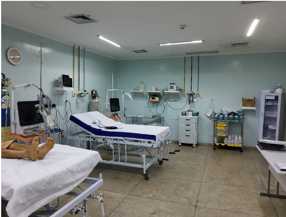
SALA DE REANIMAÇÃO E ESTABILIZAÇÃO DE PACIENTES GRAVES