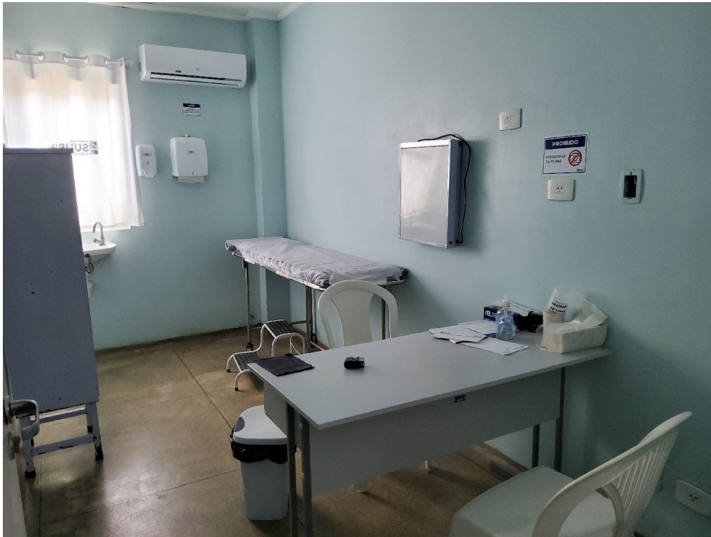
Consultório INDIFERENCIADO - grupo 1 # CONSULTORIO MEDICO