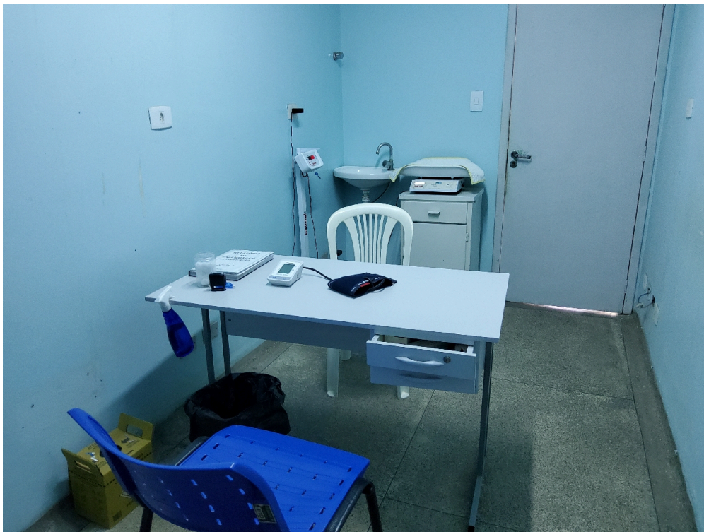
CLASSIFICAÇÃO DE RISCO - Há acolhimento com Classificação de Risco