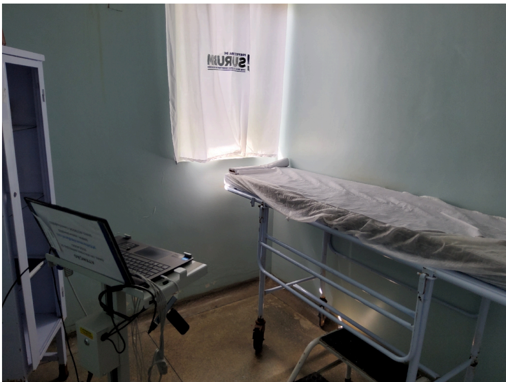
Sala de eletrocardiograma