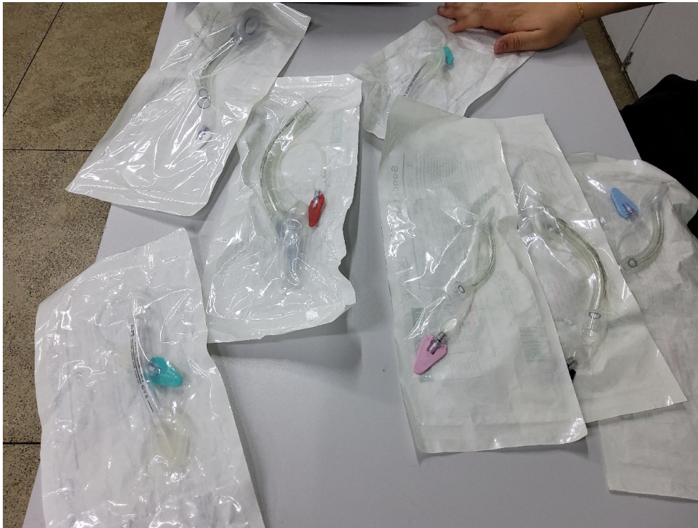
SALA DE REANIMAÇÃO E ESTABILIZAÇÃO DE PACIENTES GRAVES - Máscara laríngea