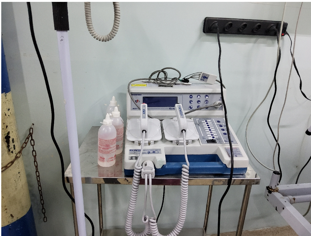
SALA DE REANIMAÇÃO E ESTABILIZAÇÃO DE PACIENTES GRAVES - Desfibrilador