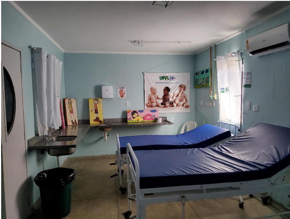
SALA COLETIVA DE OBSERVAÇÃO PEDIÁTRICA