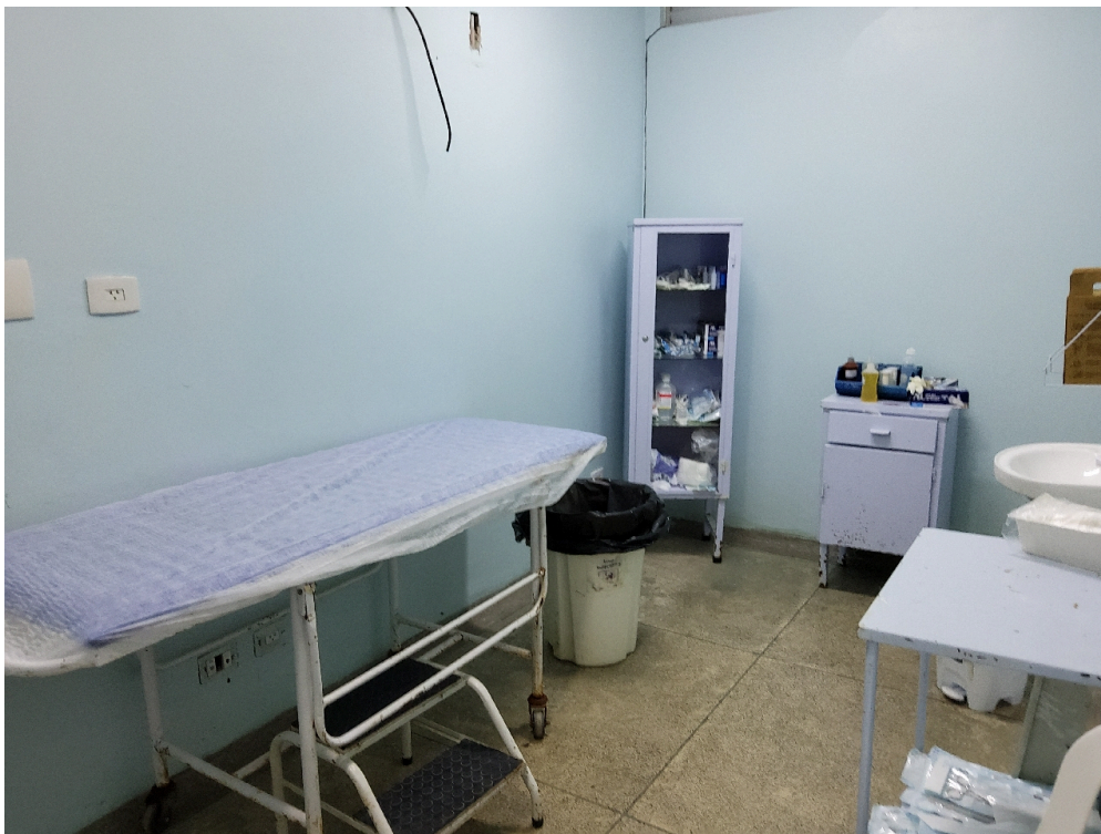
SALA DE PROCEDIMENTOS/CURATIVOS/SUTURAS