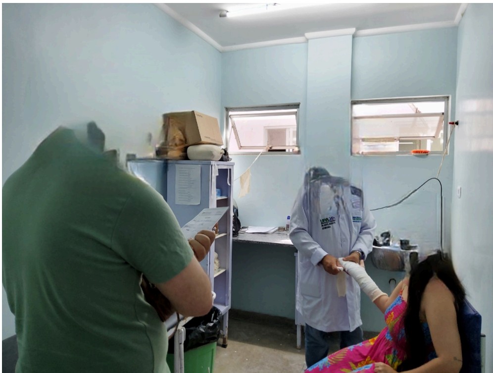
SALA DE GESSO