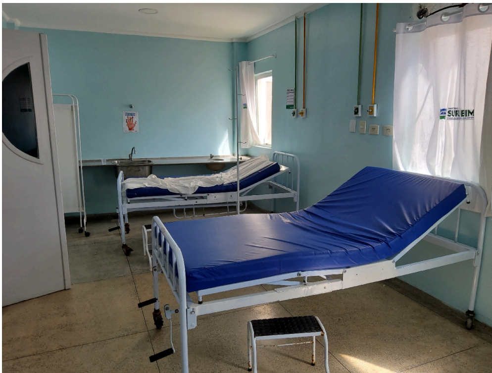
SALA DE ISOLAMENTO