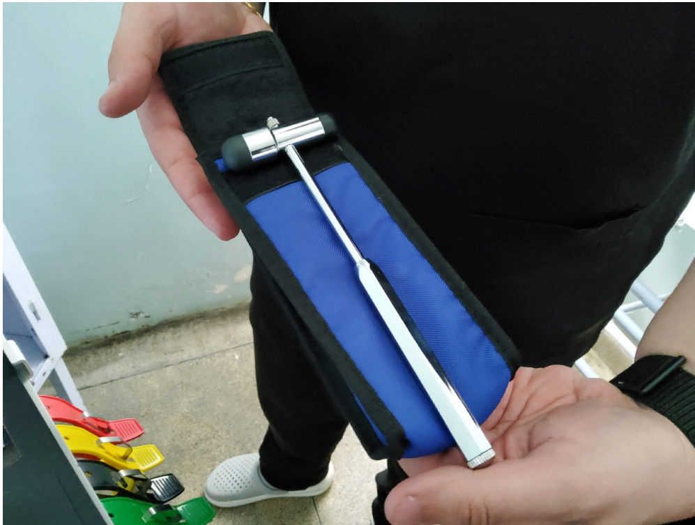
Consultório INDIFERENCIADO - grupo 1 # CONSULTORIO MEDICO - 1 martelo para exame neurológico