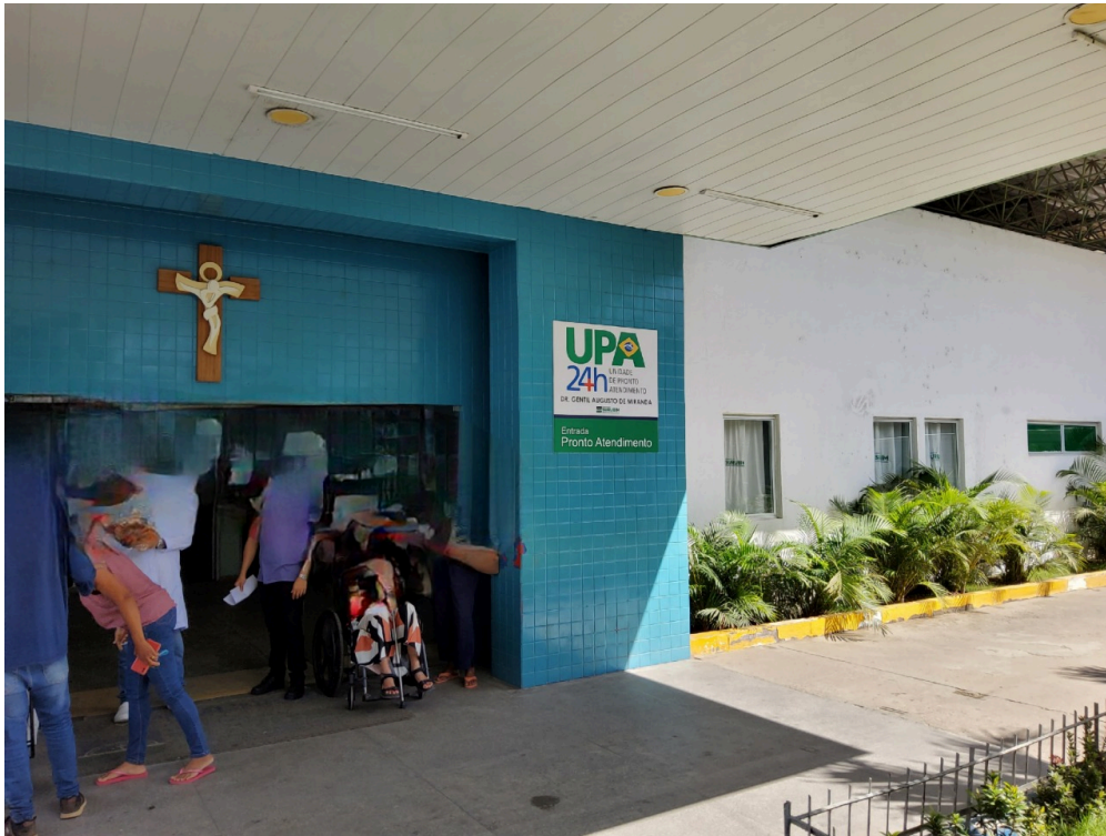
DADOS CADASTRAIS - Registro Fotográfico da Fachada