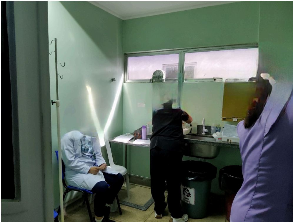
POSTO DE ENFERMAGEM