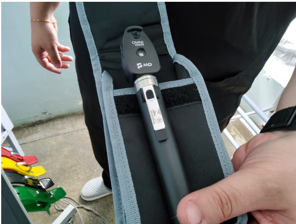
Consultório INDIFERENCIADO - grupo 1 # CONSULTORIO MEDICO - 1 oftalmoscópio