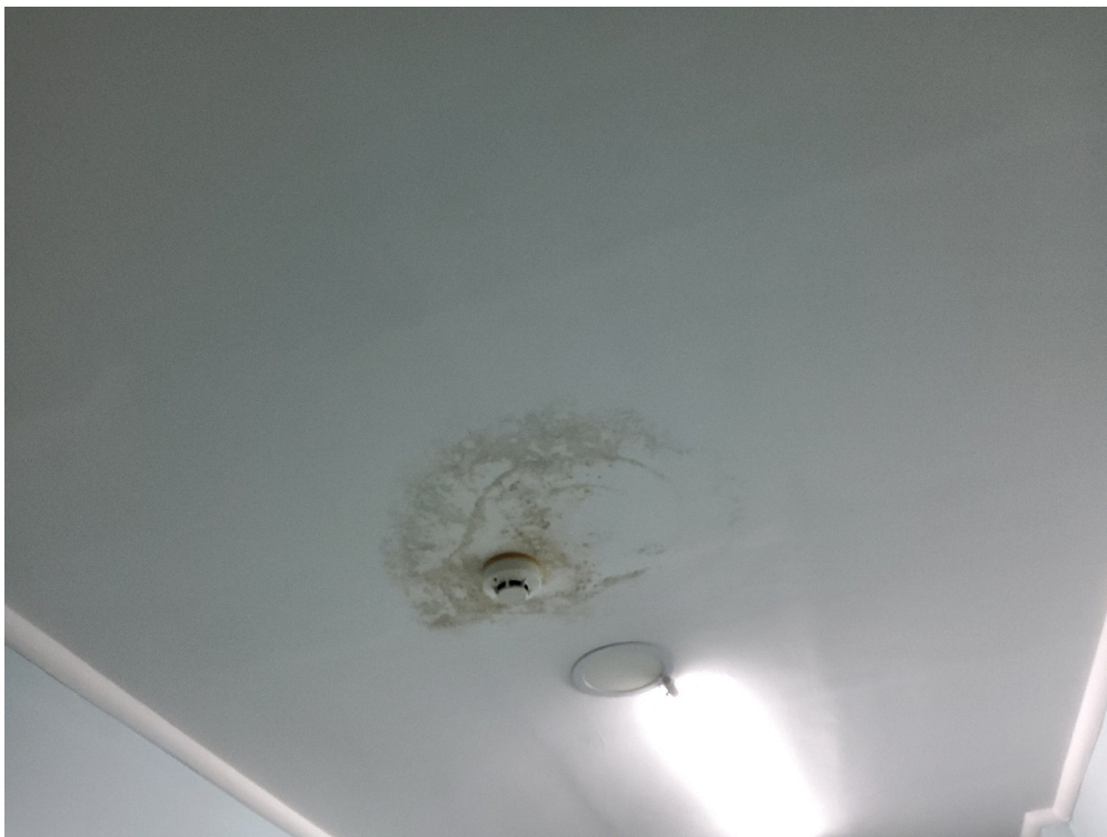
Infiltração no teto