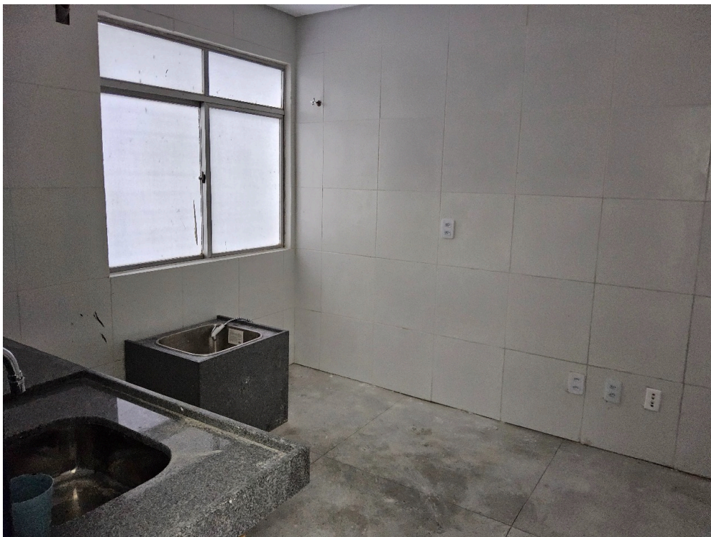
SALA DE CURATIVOS REFORMADA - Aguardando limpeza, mobiliário e climatização