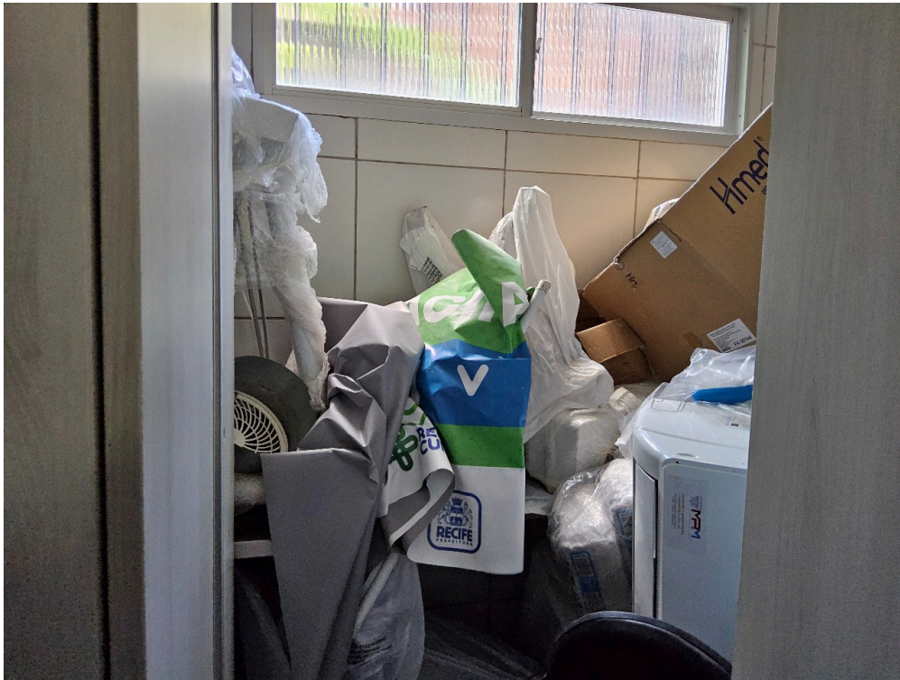
EQUIPAMENTOS - Aguardando instalação, armazenados no CME (não operante)