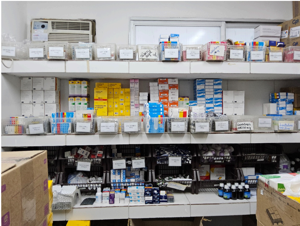
AMBIENTES E ESTRUTURAS FÍSICAS - Farmácia / Dispensário de Medicamentos