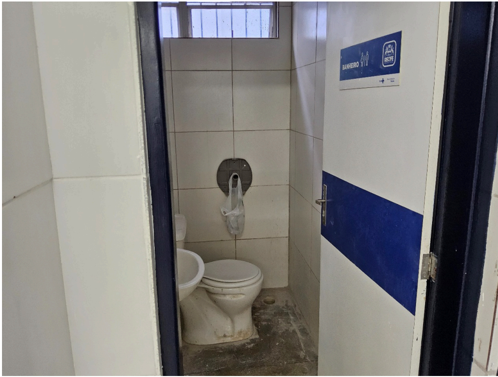
BANHEIRO - Problemas no sistema de descarga