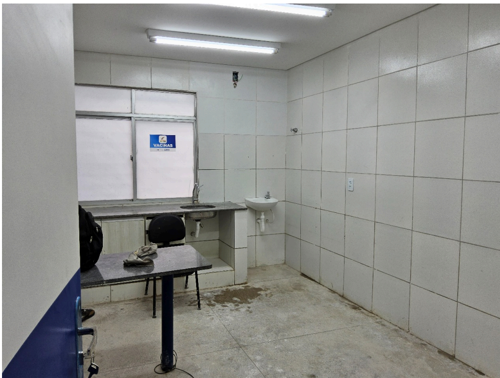
SALA REFORMADA - Aguardando limpeza, mobiliário e climatização