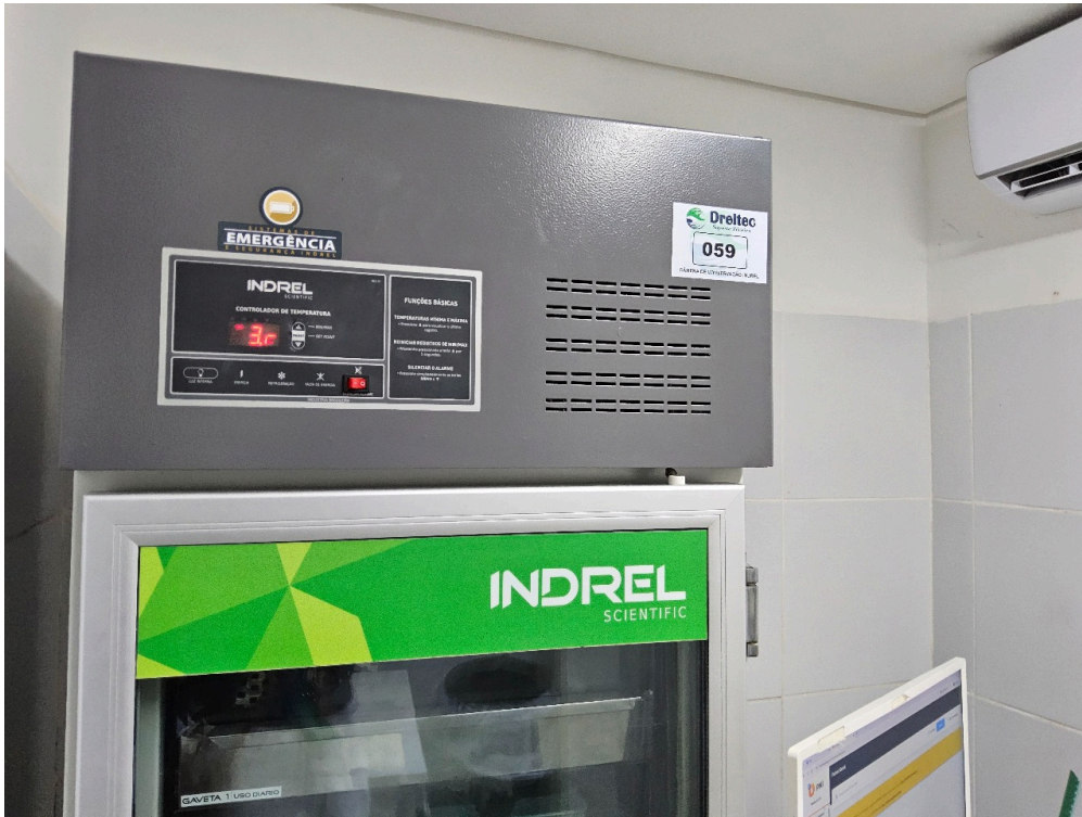
AMBIENTES E ESTRUTURAS FÍSICAS - Sala de Imunização / Vacinação