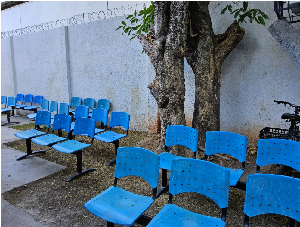
AMBIENTES E ESTRUTURAS FÍSICAS - Recepção / Sala de espera