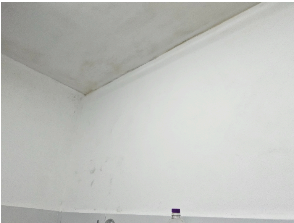
CONDIÇÕES ESTRUTURAIS DO AMBIENTE FÍSICO - GERAL - Instalações livres de trincas, rachaduras, mofos e/ou infiltrações