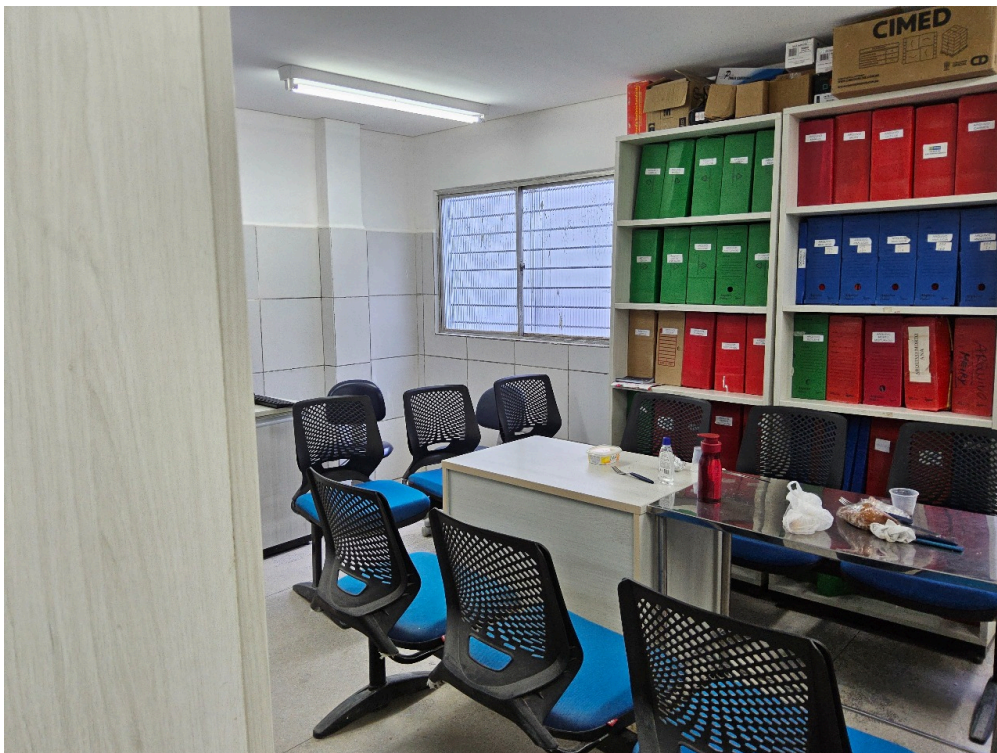
AMBIENTES E ESTRUTURAS FÍSICAS - Sala de Reuniões da Equipe