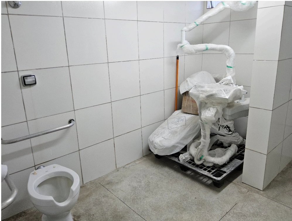
EQUIPAMENTOS DE SAÚDE BUCAL - Aguardando instalação, armazenados em um dos banheiros ainda não operantes