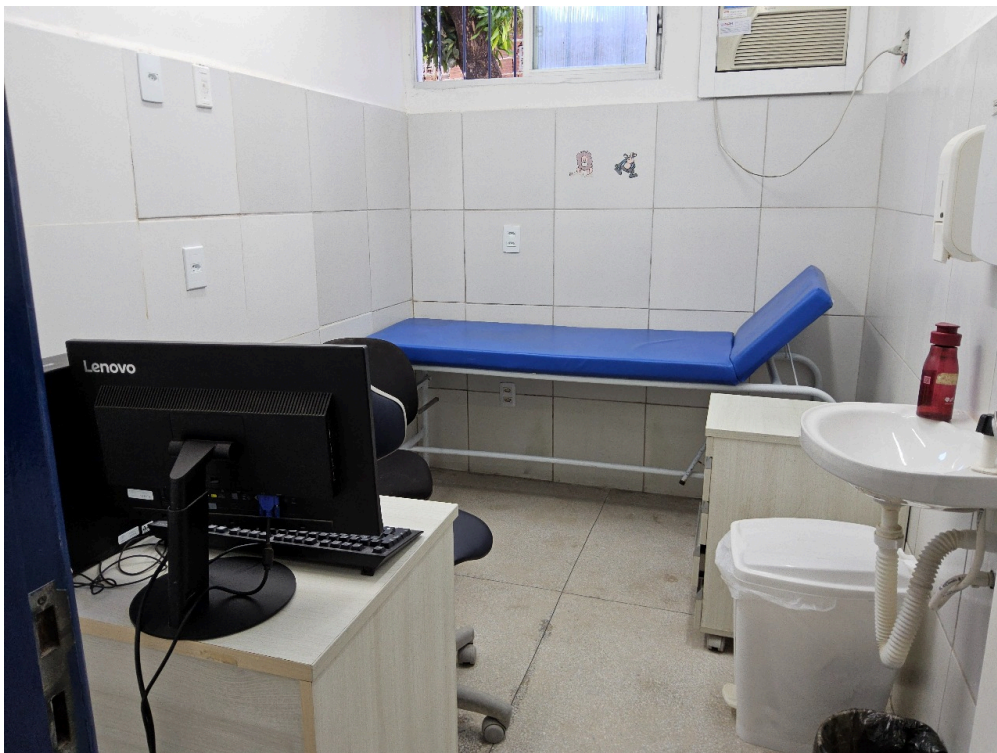
AMBIENTES E ESTRUTURAS FÍSICAS - Consultório Médico