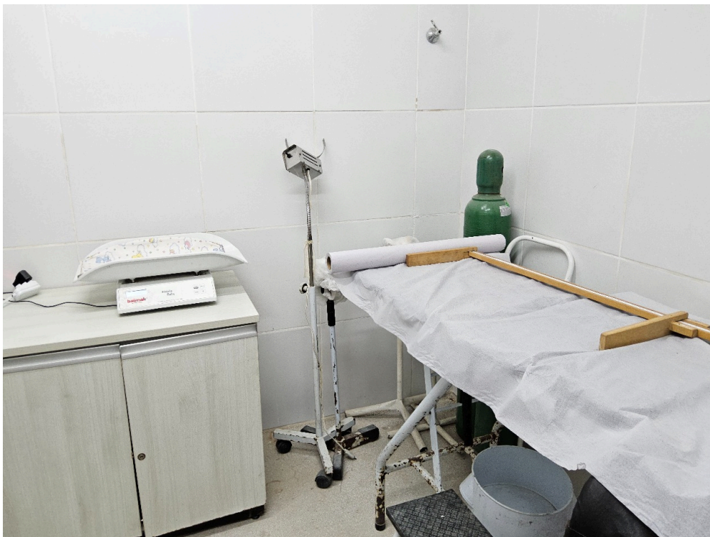
SALA INDIFERENCIADA - Acumula funções de consultório médico, sala de coleta ginecológica