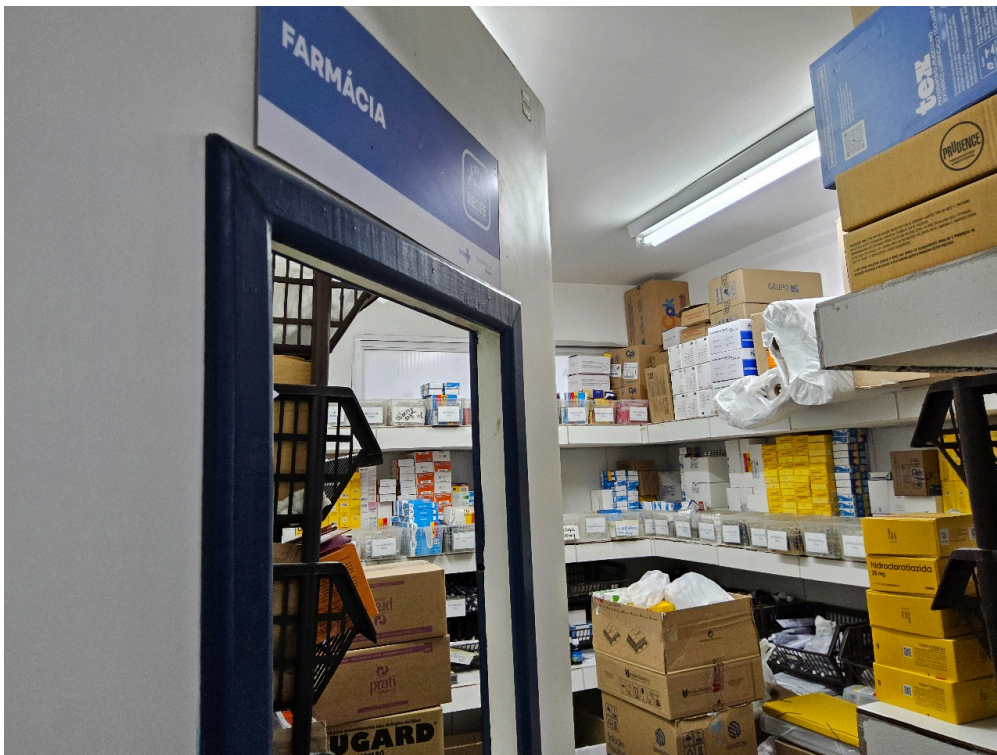
AMBIENTES E ESTRUTURAS FÍSICAS - Farmácia / Dispensário de Medicamentos