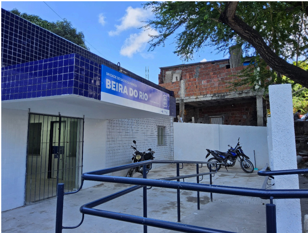
FACHADA DA UNIDADE