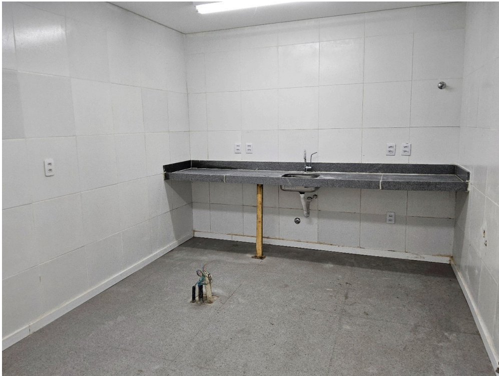
SALA REFORMADA - Aguardando limpeza, mobiliário e climatização