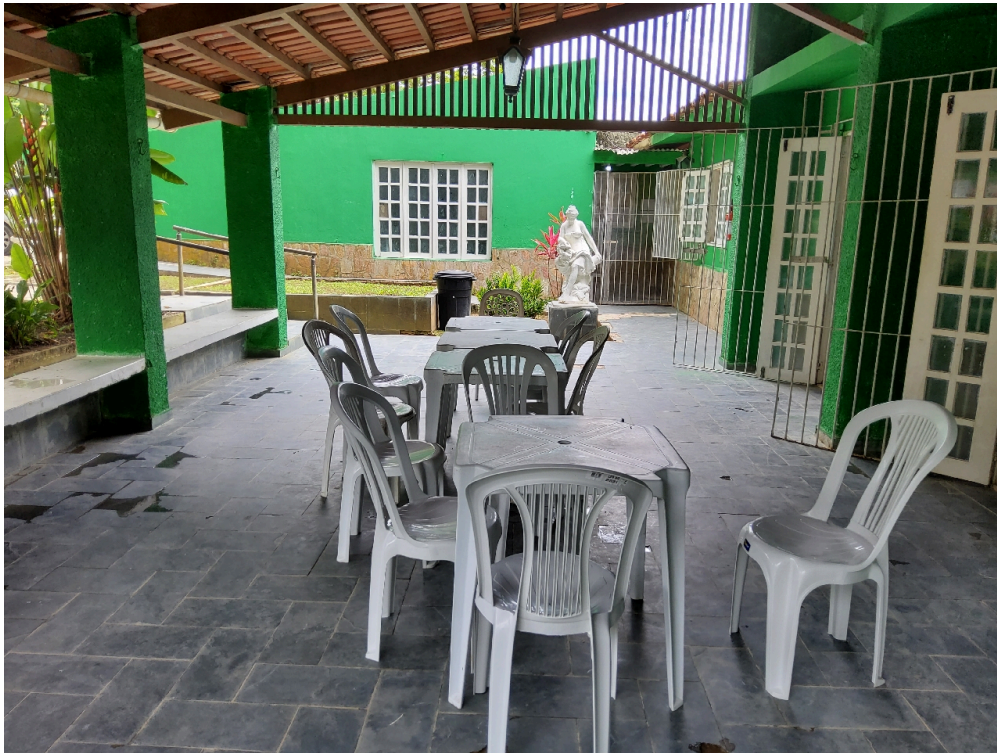
INFRAESTRUTURA - Refeitório