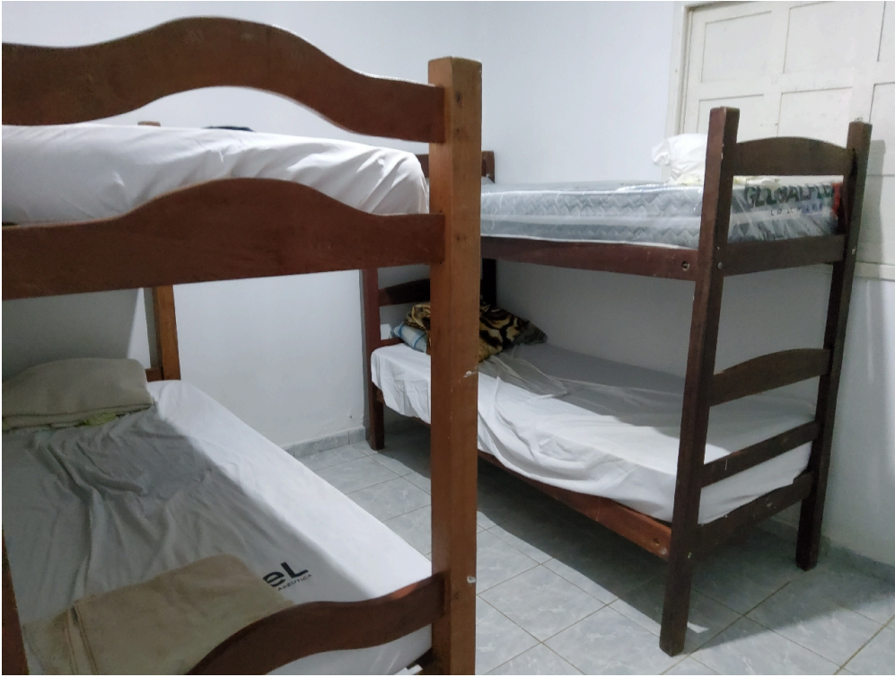
ENFERMARIA ADULTO (foto 2)