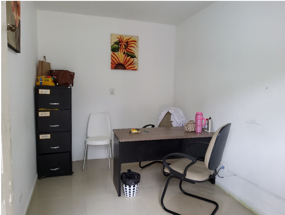
INFRAESTRUTURA - 1 sala/consultório para Psicologia