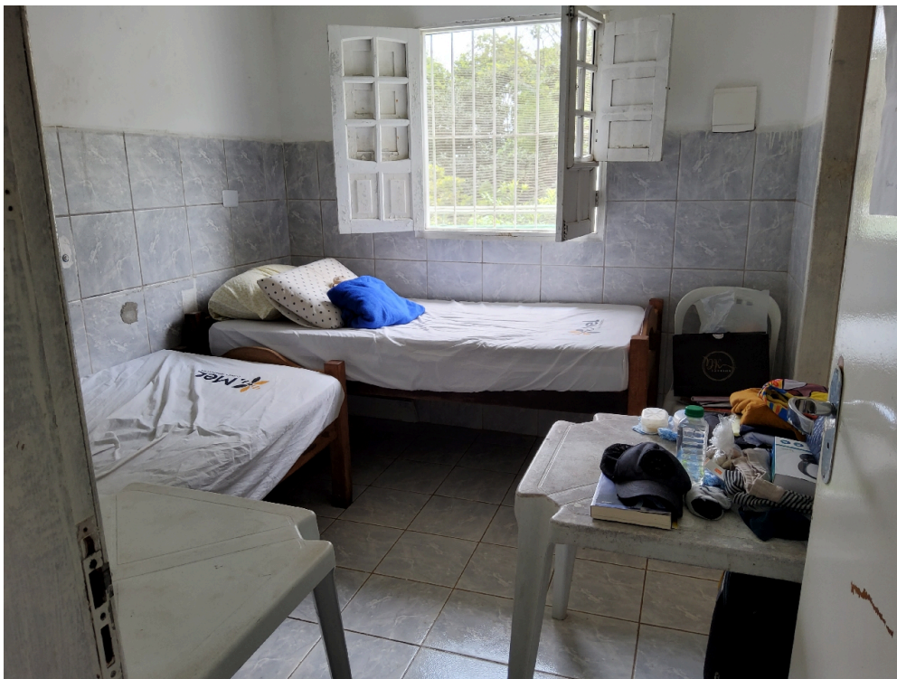
ENFERMARIA ADULTO (foto 1)