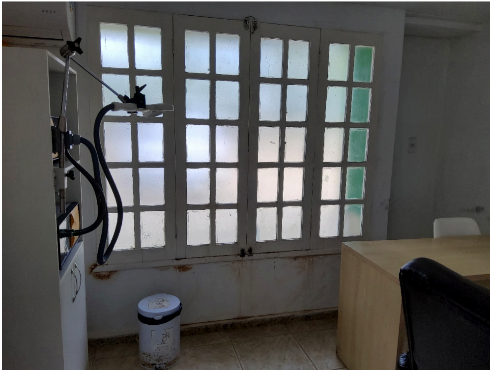
SALA DE ESTIMULAÇÃO MAGNÉTICA TRANSCRANIANA SUPERFICIAL