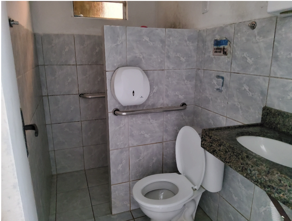
ENFERMARIA ADULTO (foto 4) - banheiro