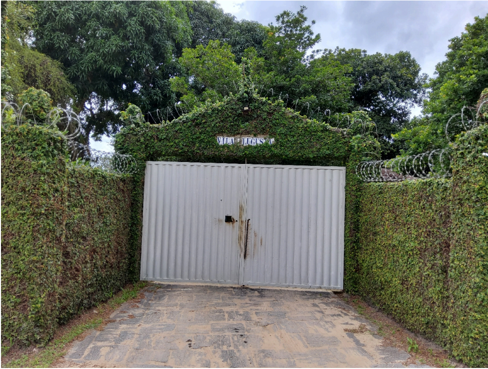
DADOS CADASTRAIS - Registro Fotográfico da Fachada