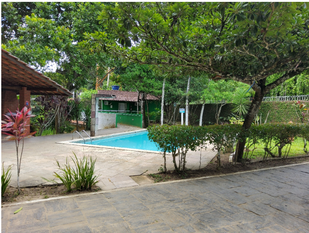
ÁREA PARA ATIVIDADES RECREATIVAS