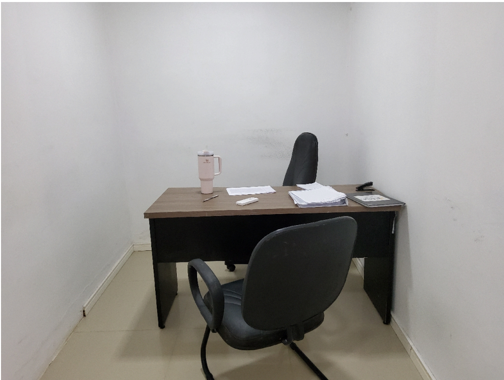
Consultório PSQUIATRIA (foto 1)