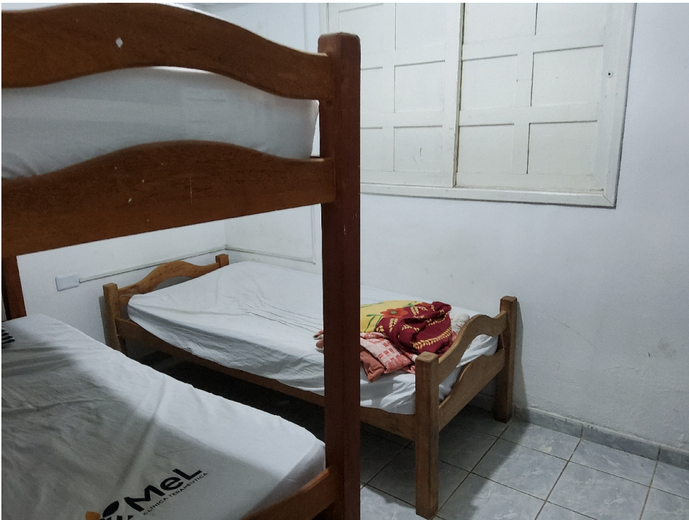
ENFERMARIA ADULTO (foto 3)