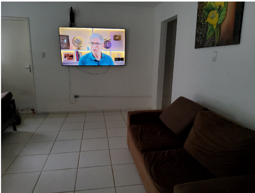
INFRAESTRUTURA - Sala de estar/Multiuso