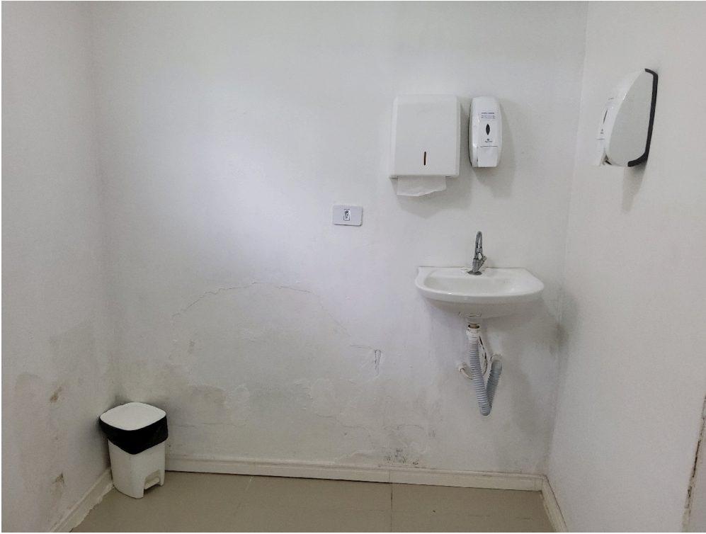
Consultório PSQUIATRIA (foto 2)