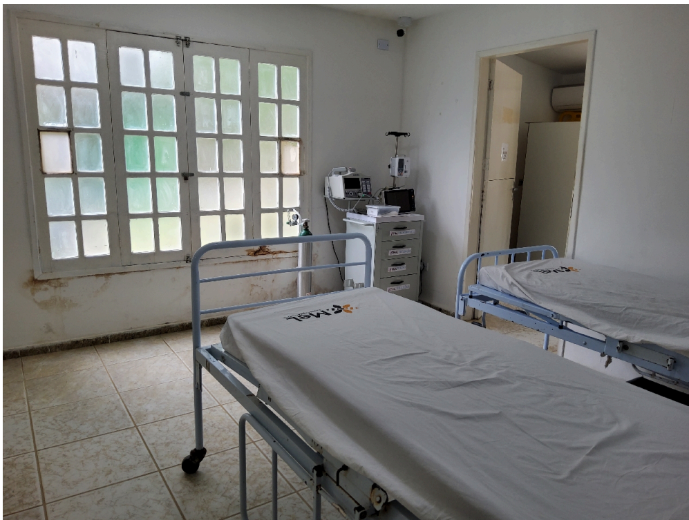
SALA DE OBSERVAÇÃO CLÍNICA