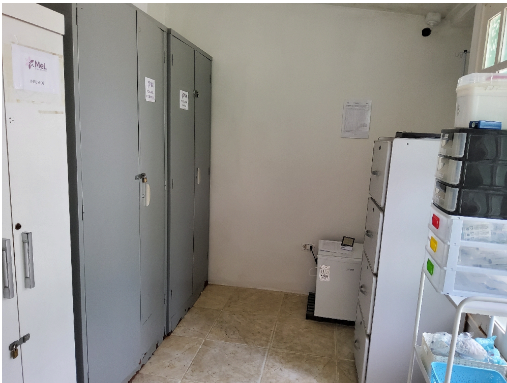
DISPENSÁRIO DE MEDICAMENTOS / FARMÁCIA - Dispensário de medicamentos