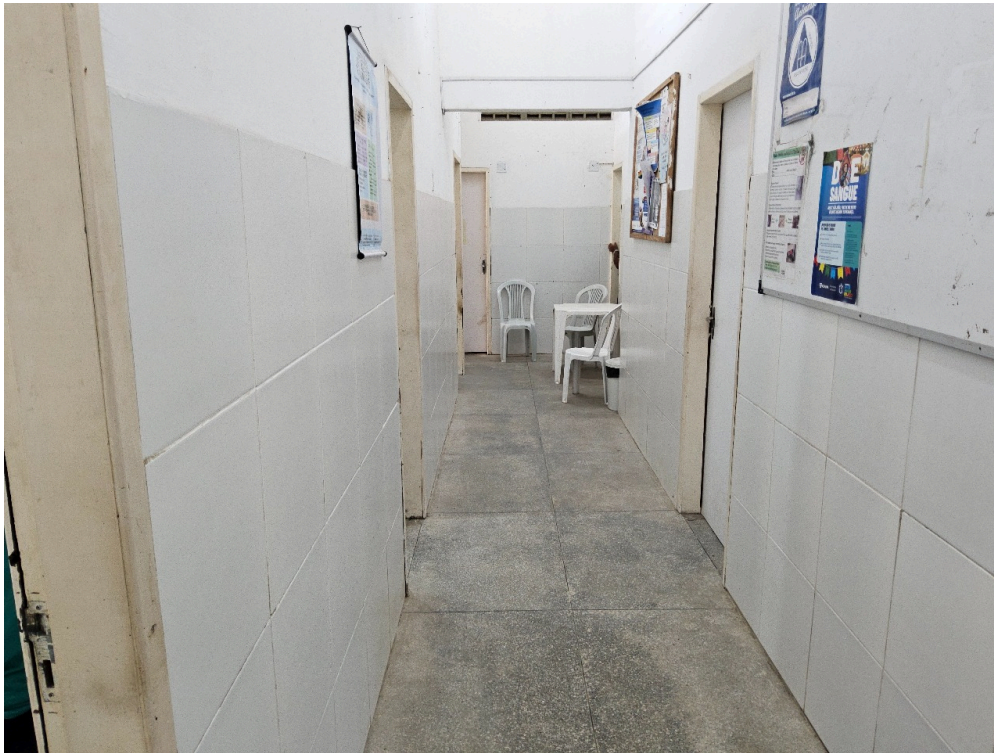
AMBIENTES E ESTRUTURAS FÍSICAS - Recepção / Sala de espera