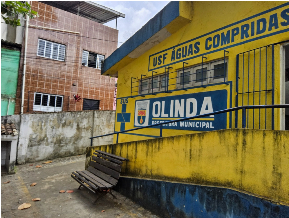
DADOS CADASTRAIS - Registro Fotográfico da Fachada