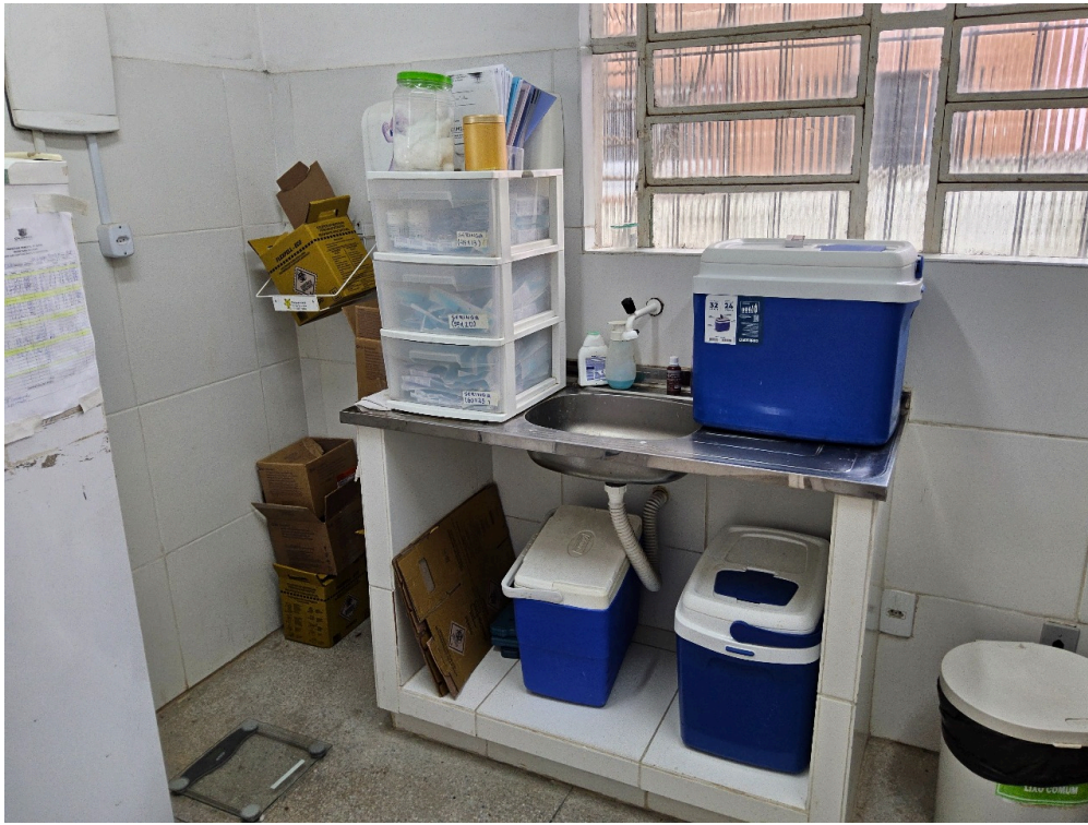
AMBIENTES E ESTRUTURAS FÍSICAS - Sala de Imunização / Vacinação