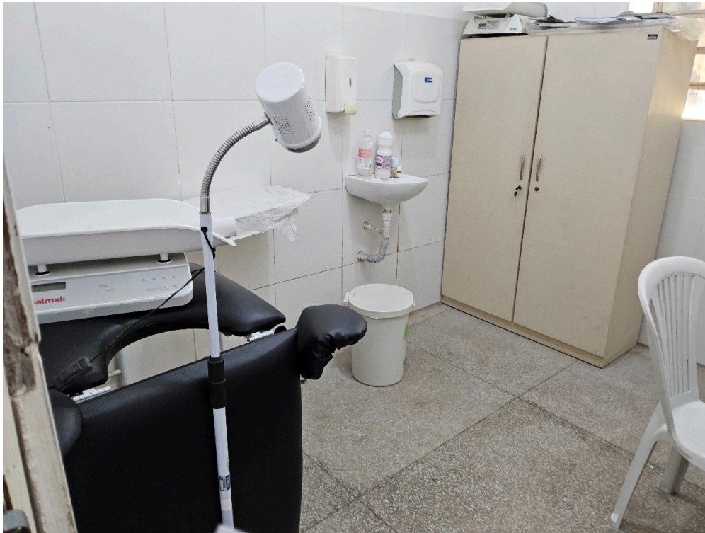
AMBIENTES E ESTRUTURAS FÍSICAS - Coleta Ginecológica / Citológica