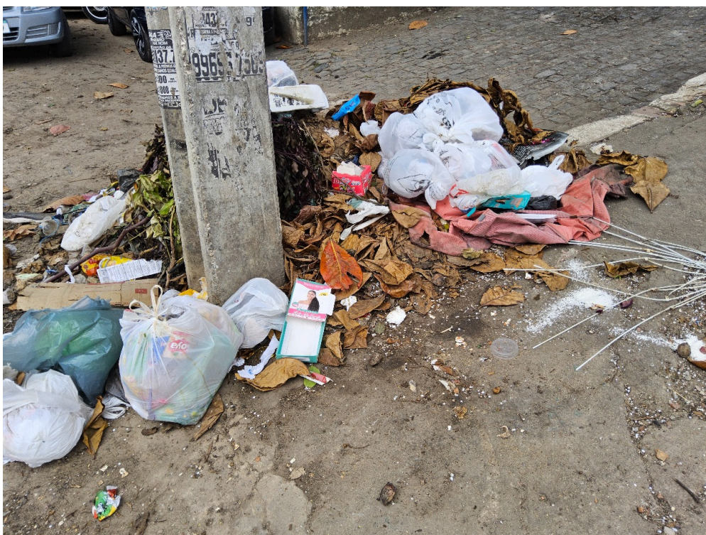
CONDIÇÕES ESTRUTURAIS DO AMBIENTE FÍSICO - GERAL - Ambiente com boas condições de higiene e limpeza