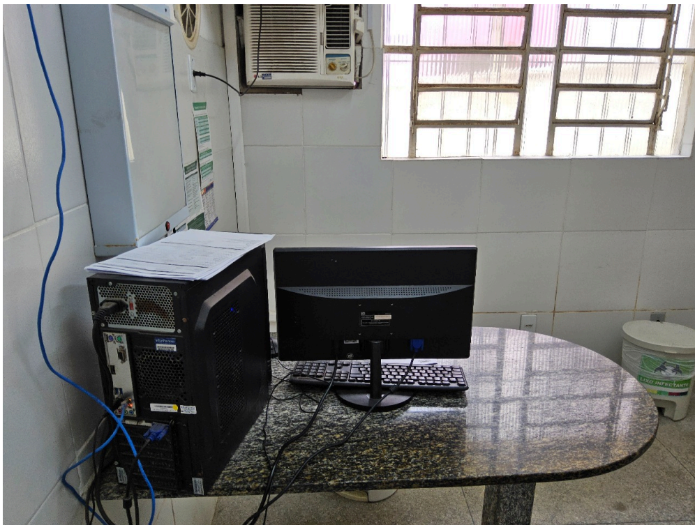
AMBIENTES E ESTRUTURAS FÍSICAS - Consultório Médico