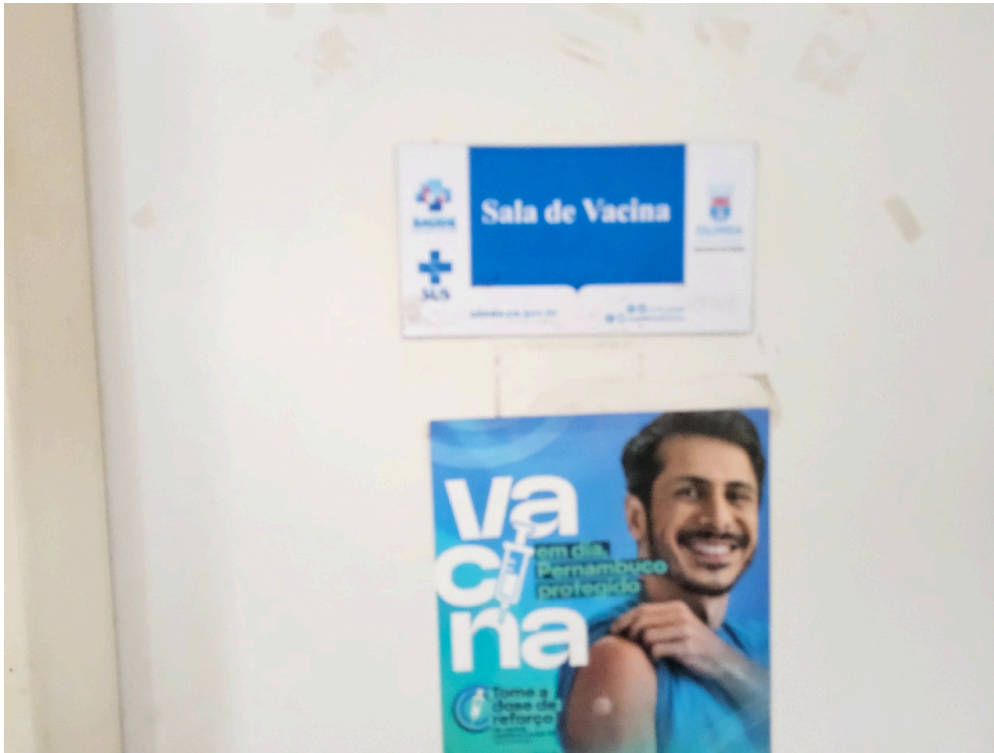
AMBIENTES E ESTRUTURAS FÍSICAS - Sala de Imunização / Vacinação