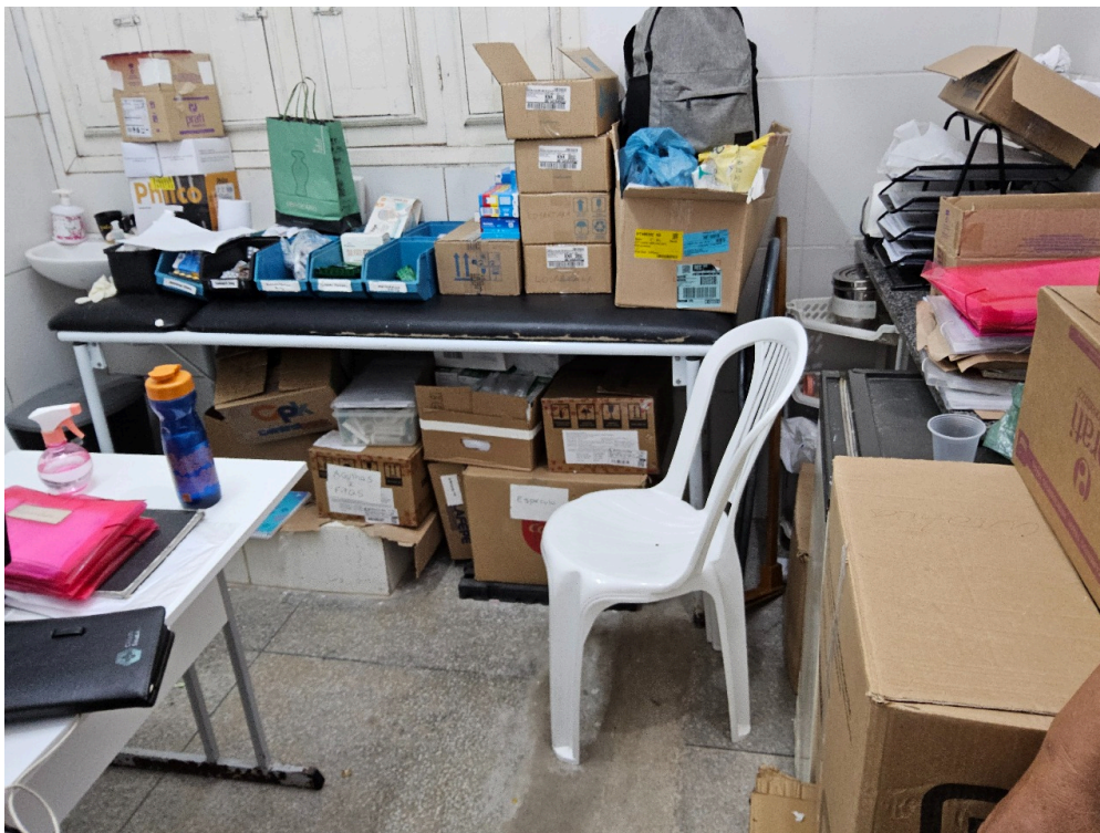
AMBIENTES E ESTRUTURAS FÍSICAS - Sala de Curativos / Procedimentos / Suturas