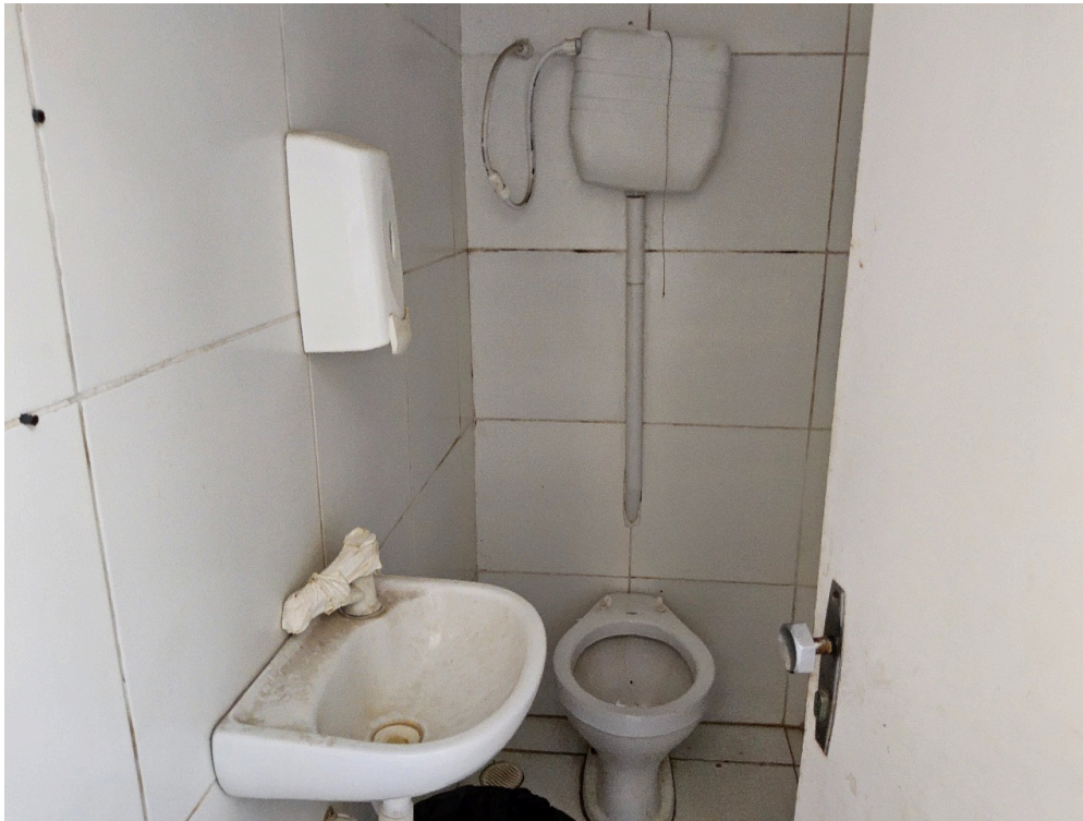
CONDIÇÕES ESTRUTURAIS DO AMBIENTE FÍSICO - GERAL - Ambiente com boas condições de higiene e limpeza