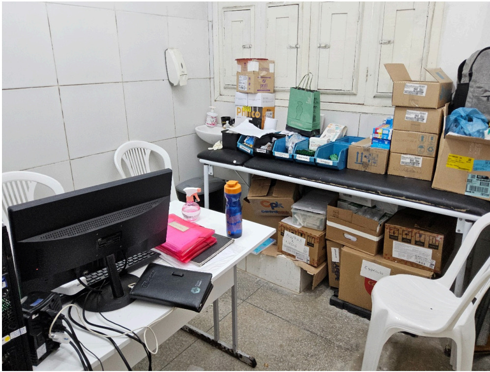
AMBIENTES E ESTRUTURAS FÍSICAS - Sala de Curativos / Procedimentos / Suturas