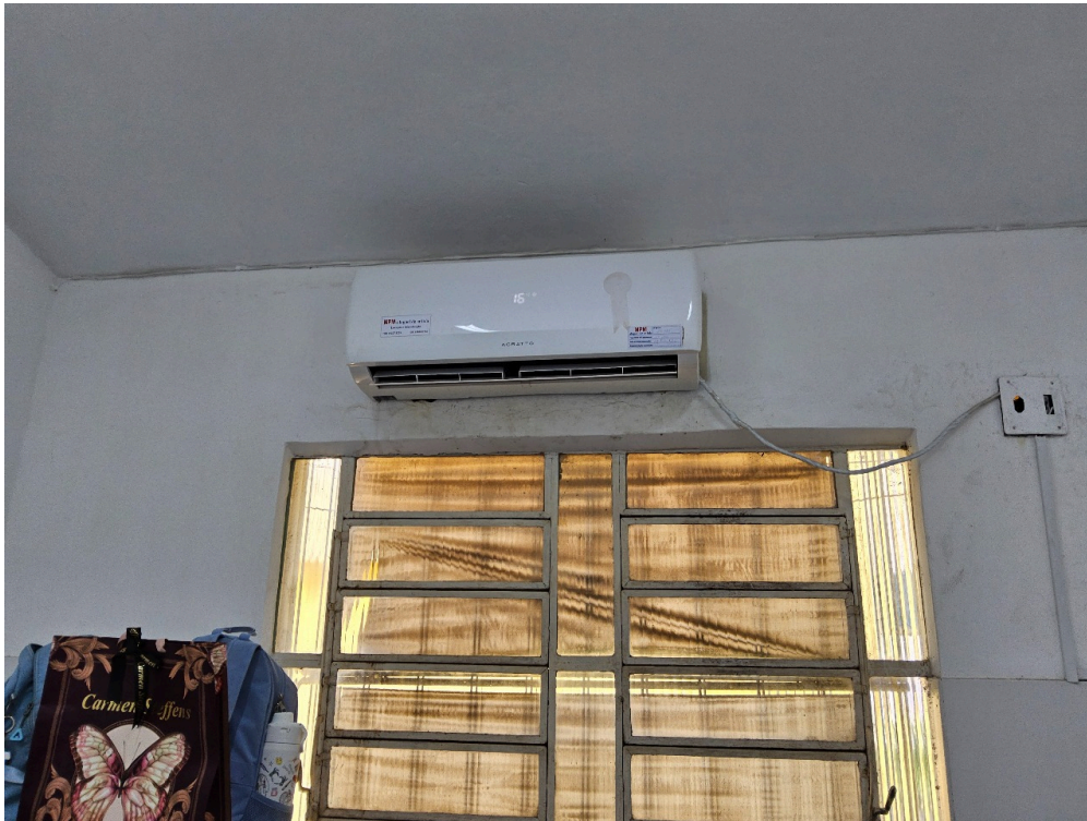
AMBIENTES E ESTRUTURAS FÍSICAS - Consultório Médico