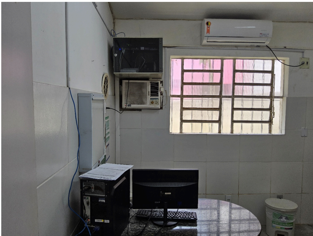
AMBIENTES E ESTRUTURAS FÍSICAS - Consultório Médico