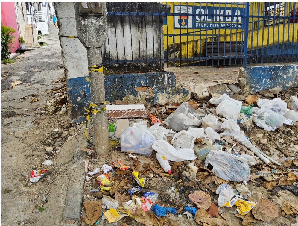
CONDIÇÕES ESTRUTURAIS DO AMBIENTE FÍSICO - GERAL - Ambiente com boas condições de higiene e limpeza