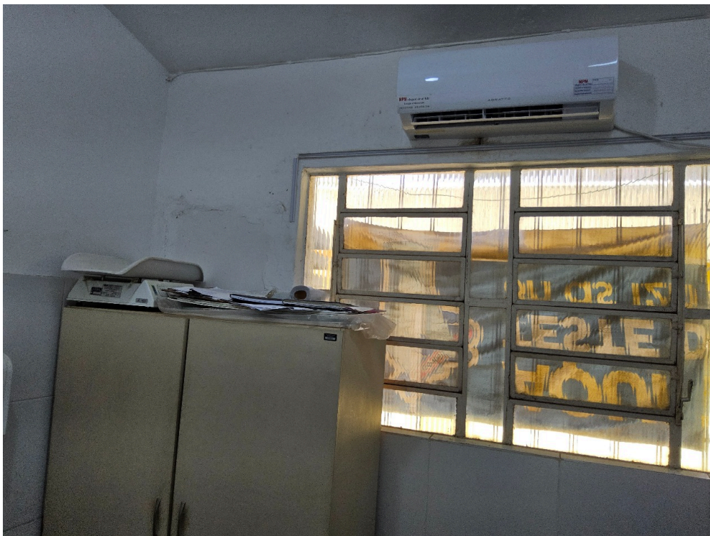
AMBIENTES E ESTRUTURAS FÍSICAS - Coleta Ginecológica / Citológica