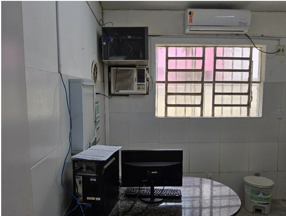
AMBIENTES E ESTRUTURAS FÍSICAS - Consultório Médico