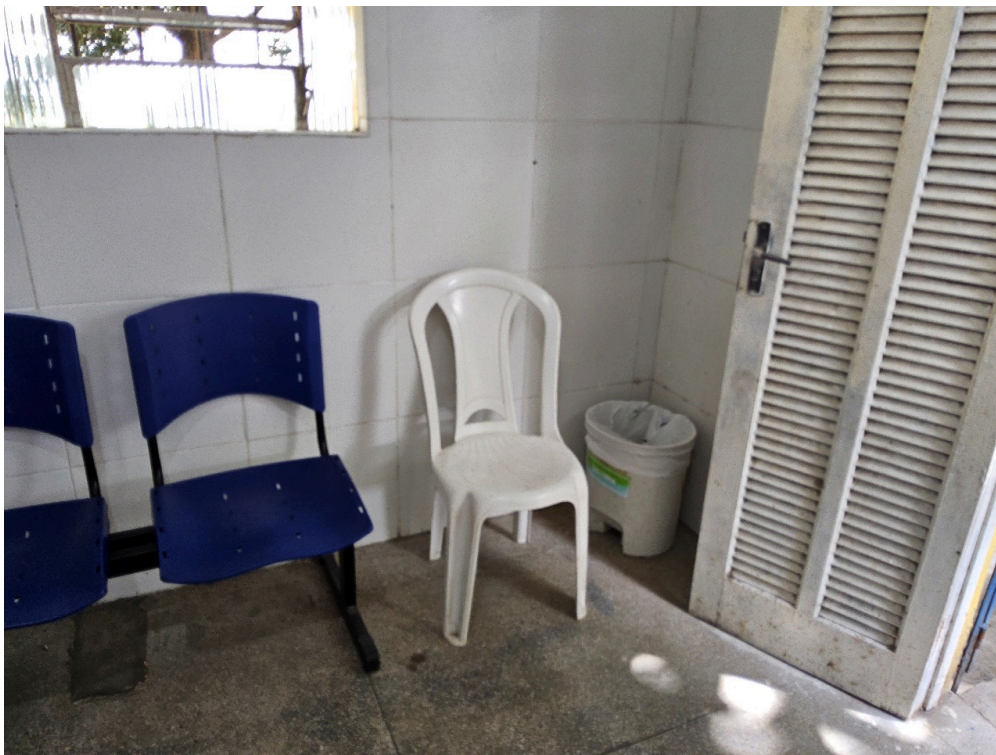
AMBIENTES E ESTRUTURAS FÍSICAS - Recepção / Sala de espera