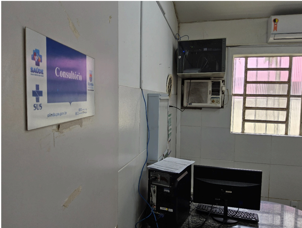
AMBIENTES E ESTRUTURAS FÍSICAS - Consultório Médico