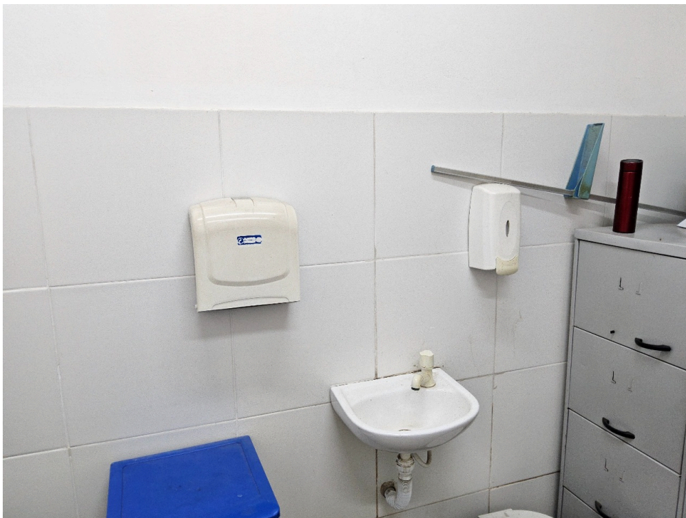
AMBIENTES E ESTRUTURAS FÍSICAS - Consultório Médico