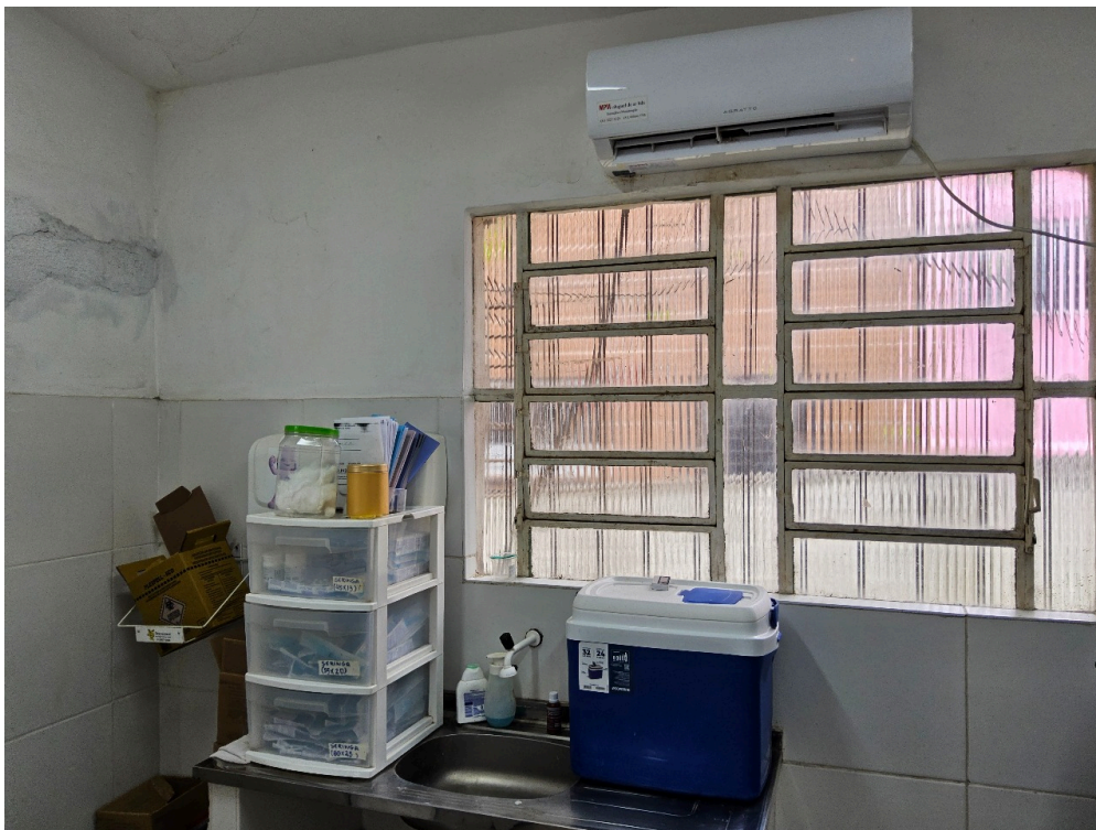
AMBIENTES E ESTRUTURAS FÍSICAS - Sala de Imunização / Vacinação