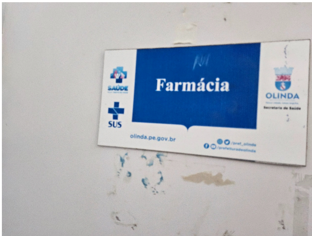
AMBIENTES E ESTRUTURAS FÍSICAS - Farmácia / Dispensário de Medicamentos