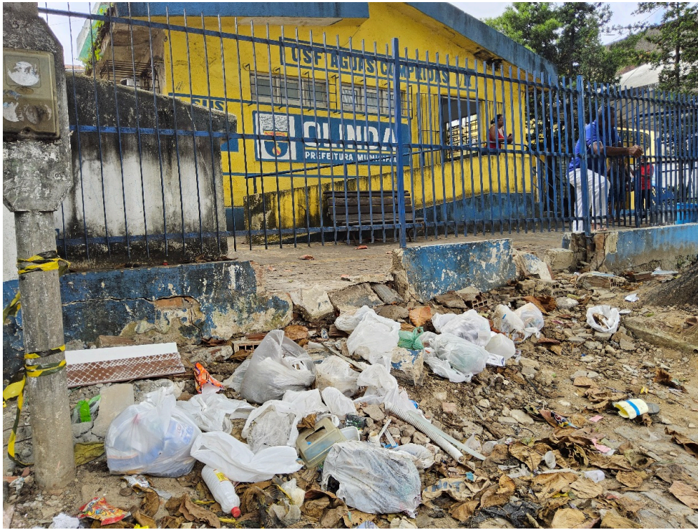
CONDIÇÕES ESTRUTURAIS DO AMBIENTE FÍSICO - GERAL - Ambiente com conforto térmico