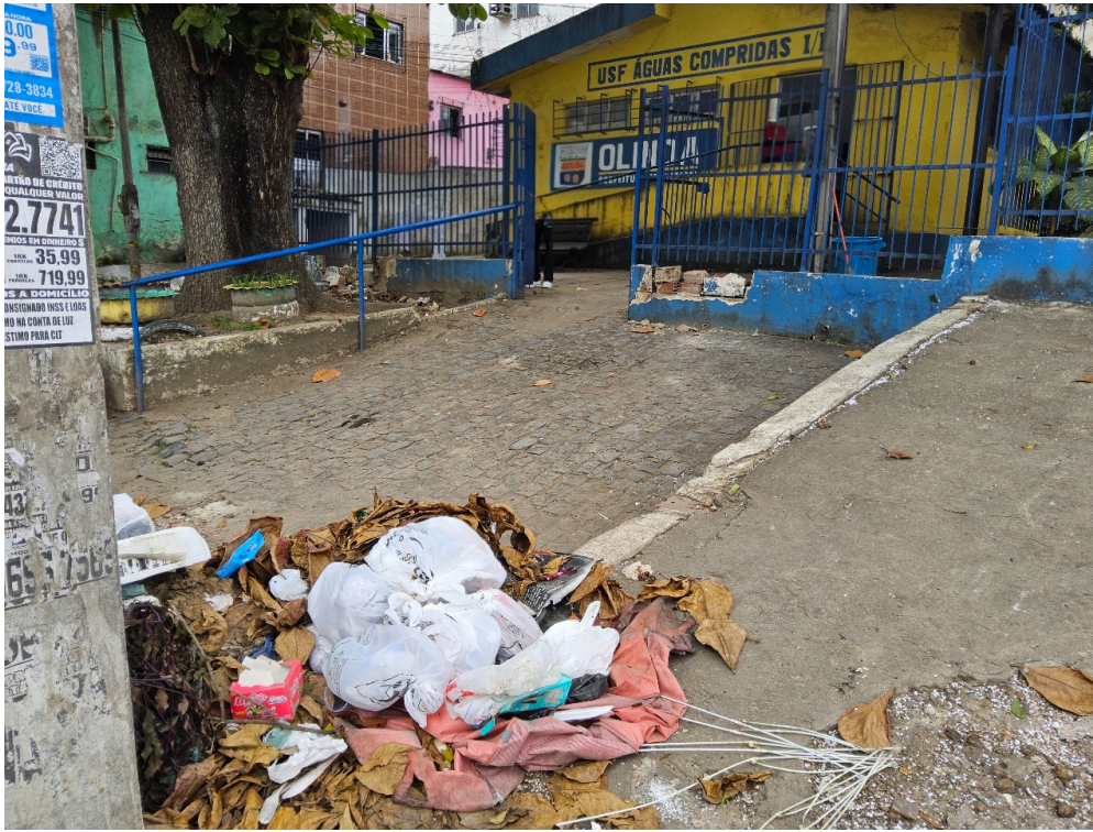
DADOS CADASTRAIS - Registro Fotográfico da Fachada (Faces suprimidas via edição)