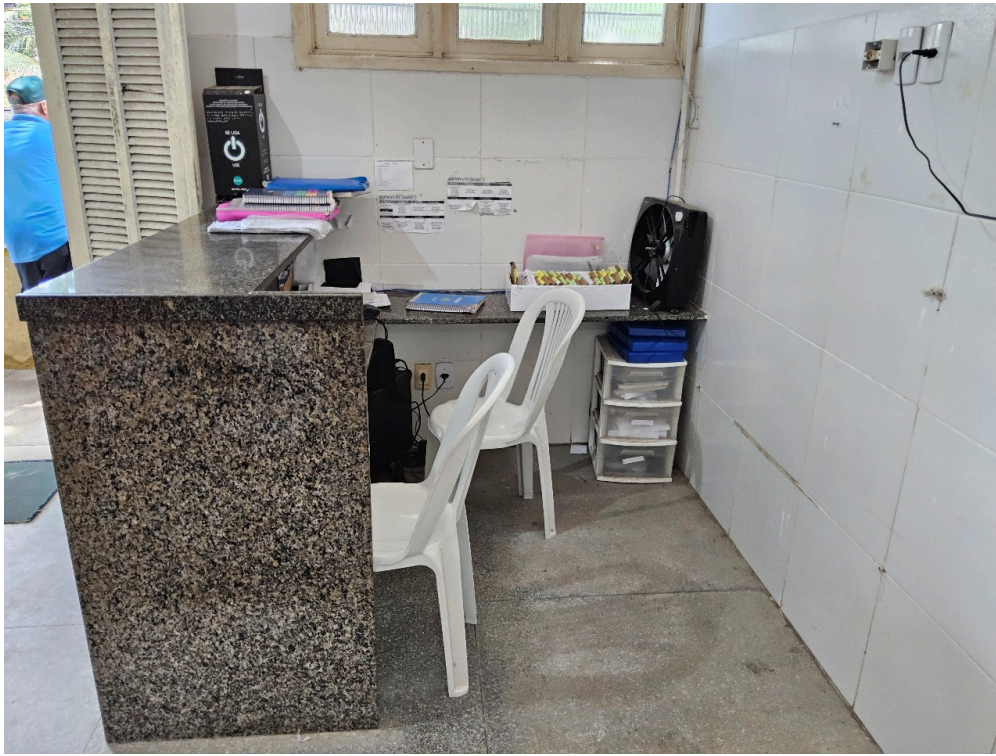
AMBIENTES E ESTRUTURAS FÍSICAS - Recepção / Sala de espera