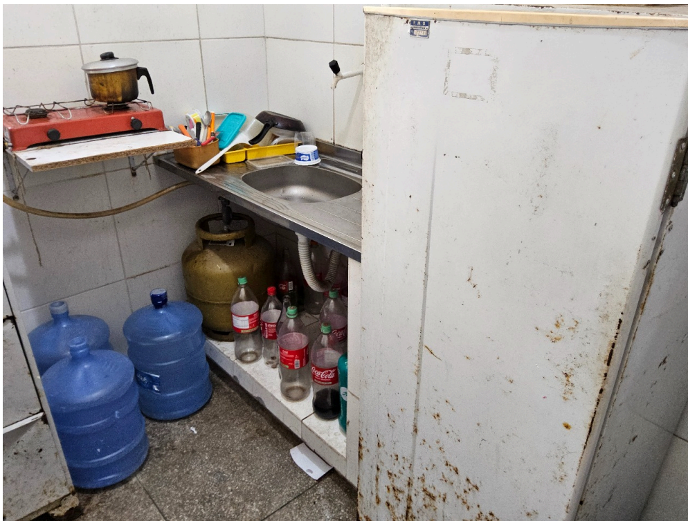
AMBIENTES E ESTRUTURAS FÍSICAS - Copa