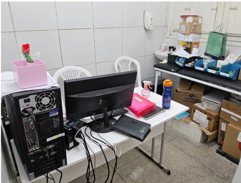
AMBIENTES E ESTRUTURAS FÍSICAS - Sala de Curativos / Procedimentos / Suturas