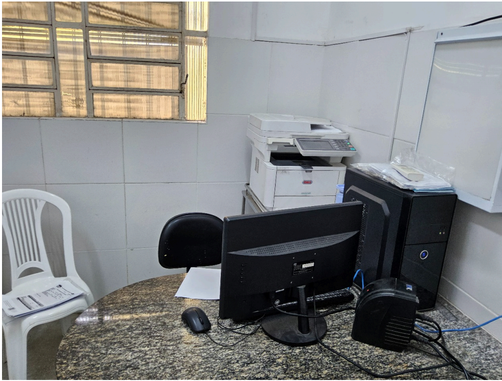
AMBIENTES E ESTRUTURAS FÍSICAS - Consultório Médico