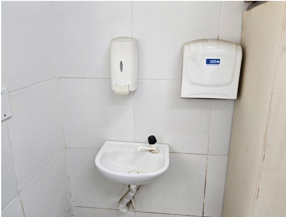
AMBIENTES E ESTRUTURAS FÍSICAS - Consultório Médico