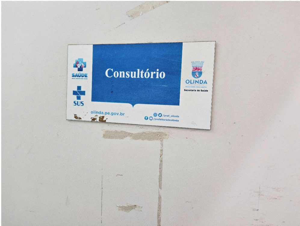
AMBIENTES E ESTRUTURAS FÍSICAS - Consultório Médico