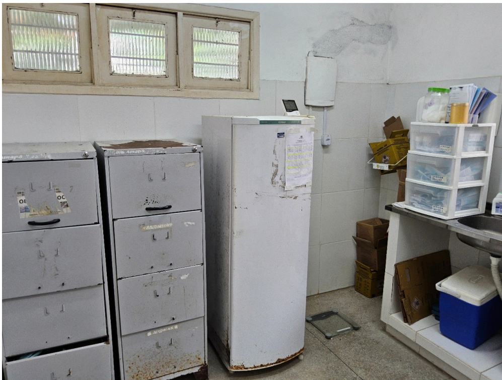
AMBIENTES E ESTRUTURAS FÍSICAS - Sala de Imunização / Vacinação