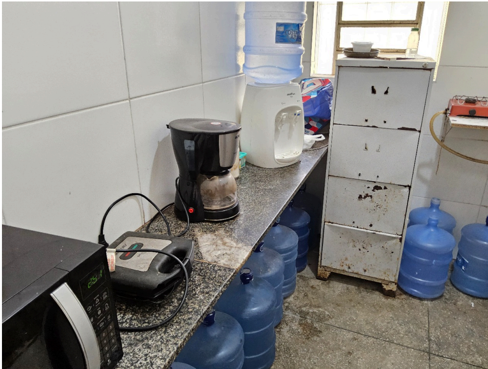
AMBIENTES E ESTRUTURAS FÍSICAS - Copa