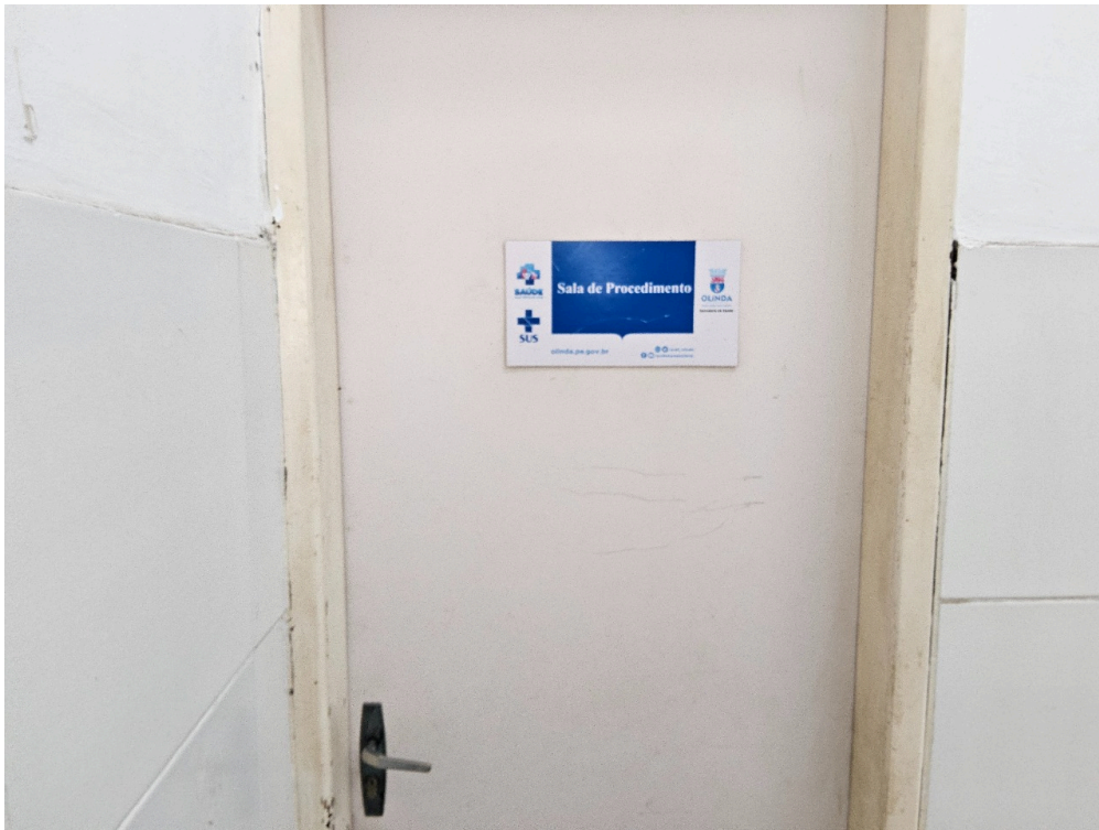
AMBIENTES E ESTRUTURAS FÍSICAS - Sala de Curativos / Procedimentos / Suturas