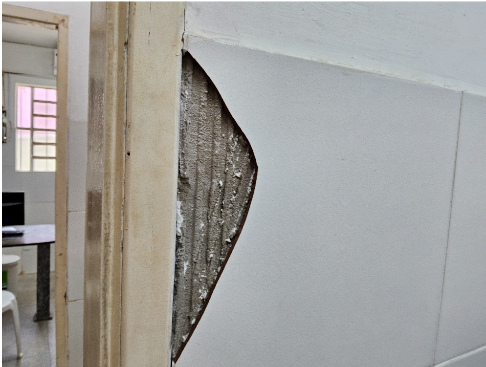
CONDIÇÕES ESTRUTURAIS DO AMBIENTE FÍSICO - GERAL - Instalações livres de trincas, rachaduras, mofos e/ou infiltrações