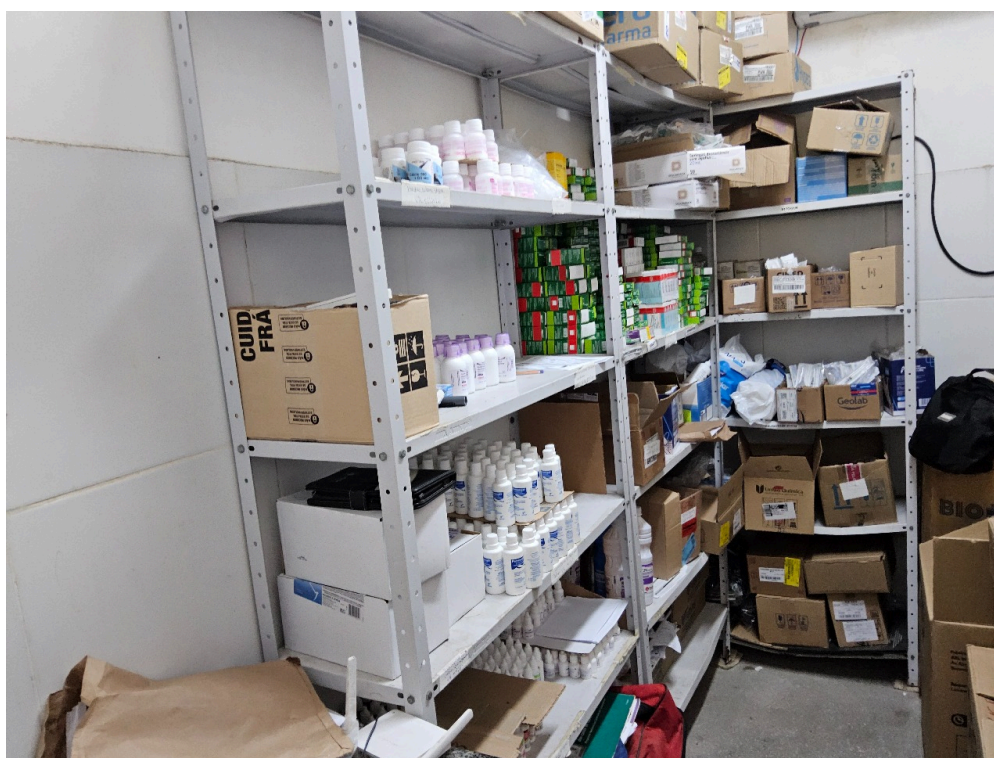
AMBIENTES E ESTRUTURAS FÍSICAS - Farmácia / Dispensário de Medicamentos