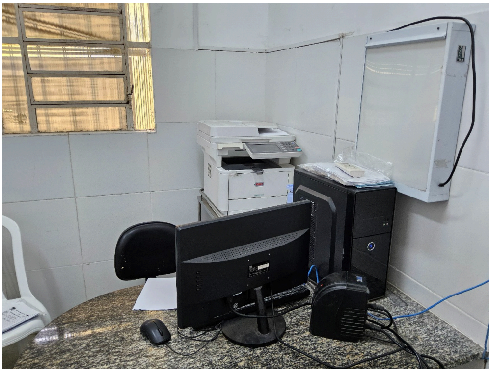
AMBIENTES E ESTRUTURAS FÍSICAS - Consultório Médico