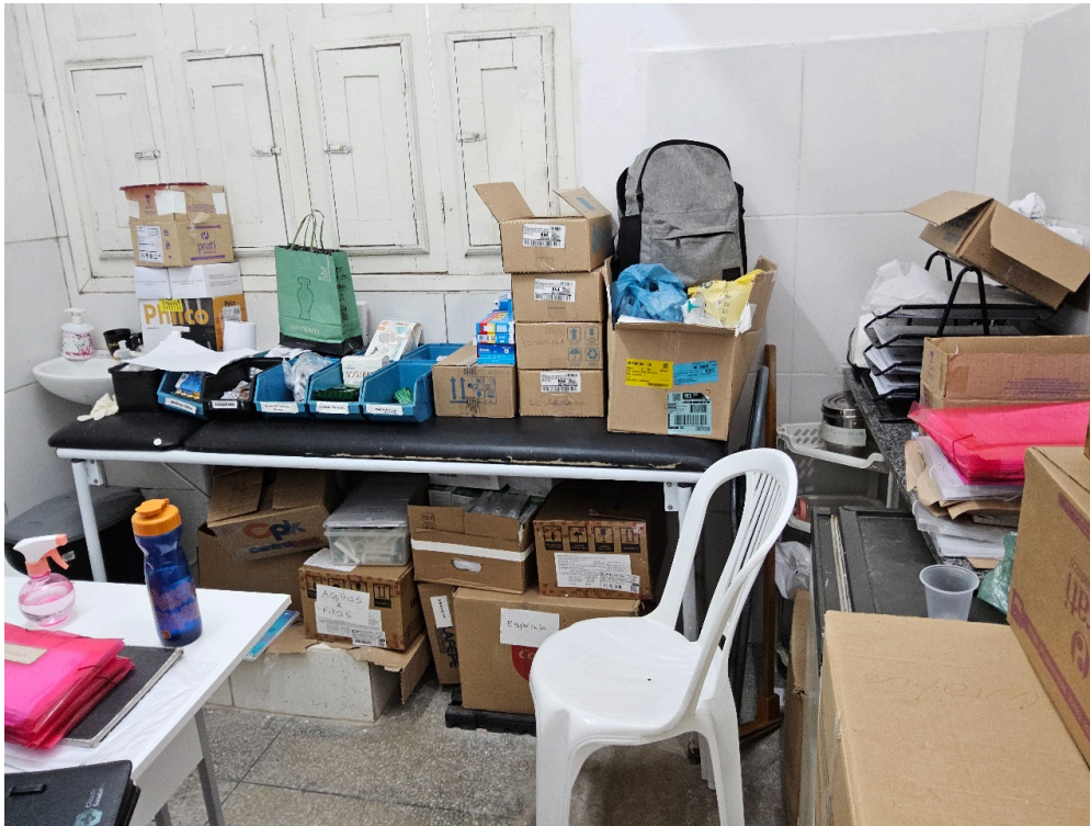
AMBIENTES E ESTRUTURAS FÍSICAS - Sala de Curativos / Procedimentos / Suturas