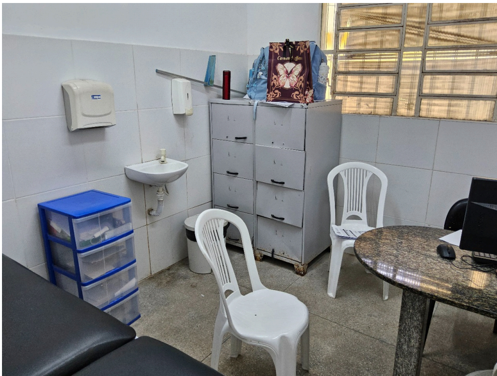
AMBIENTES E ESTRUTURAS FÍSICAS - Consultório Médico