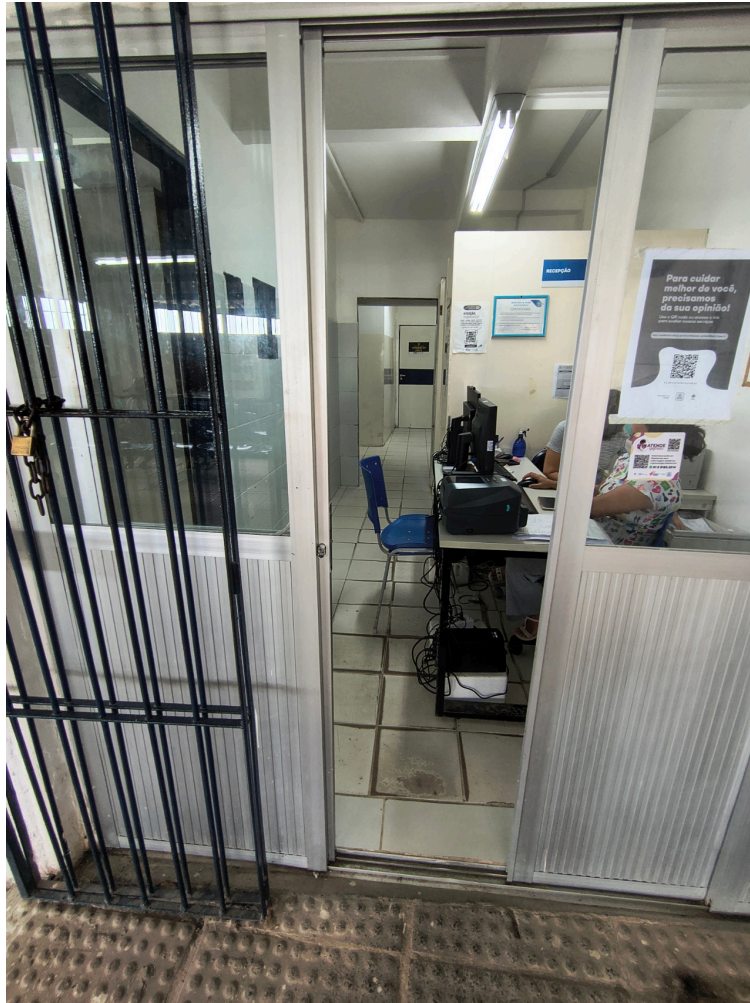
Recepção e SISREG