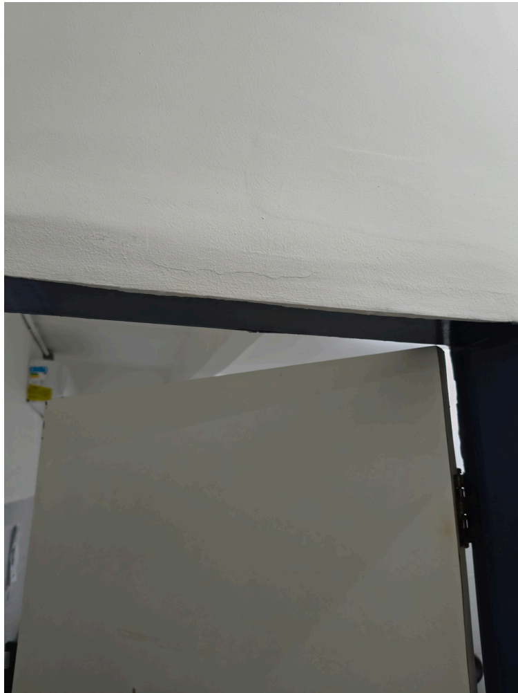
Sala de atendimento de enfermagem sem sinalização na porta