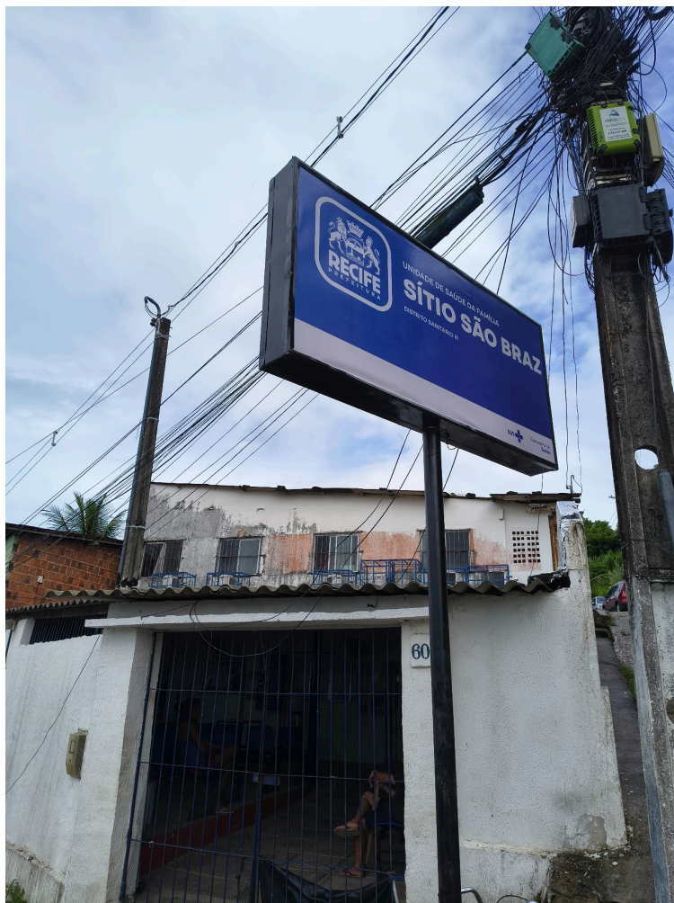
DADOS CADASTRAIS - Registro Fotográfico da Fachada