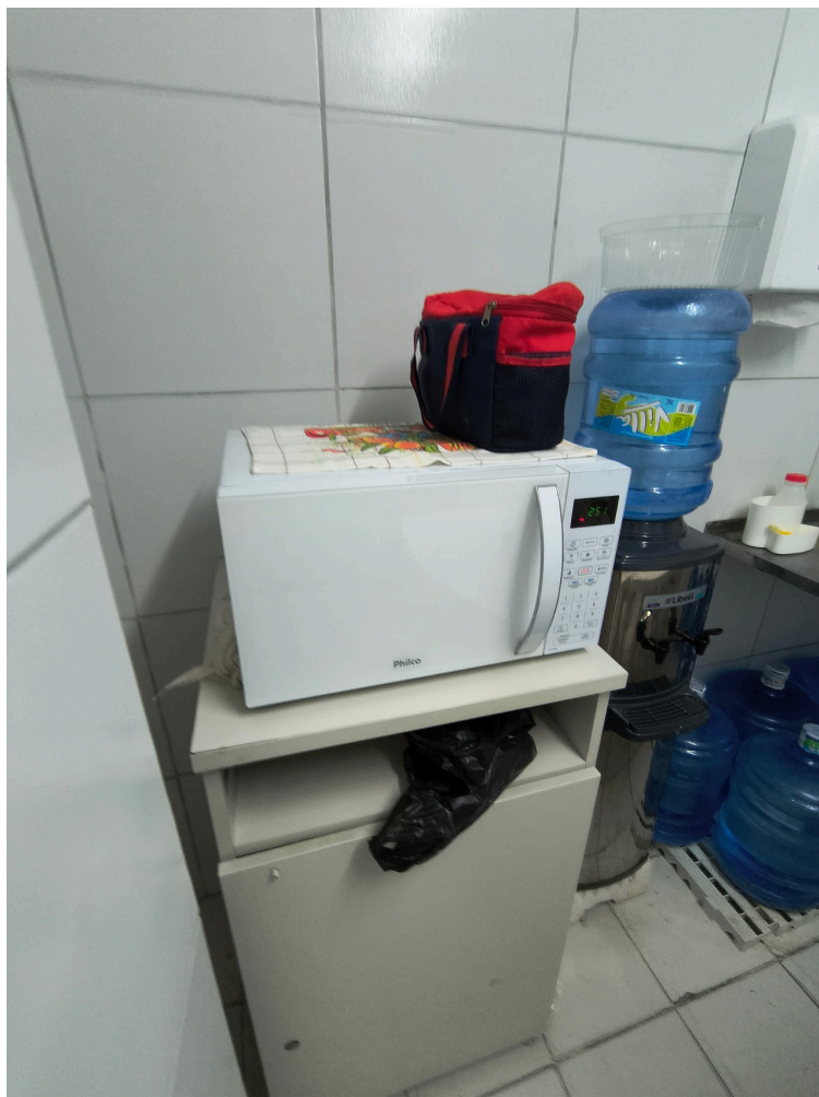
Micro-ondas da Cozinha