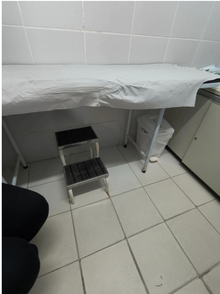
Primeiro consultório médico