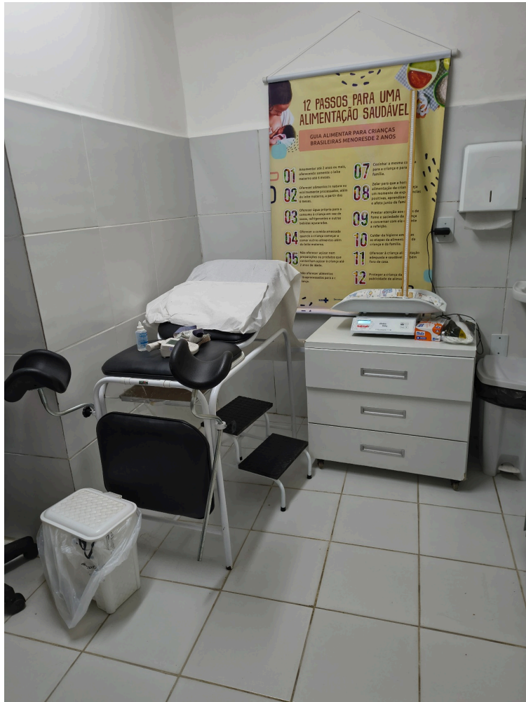
Sala de atendimento de enfermagem