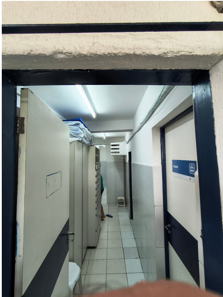
Corredor de acesso aos consultórios