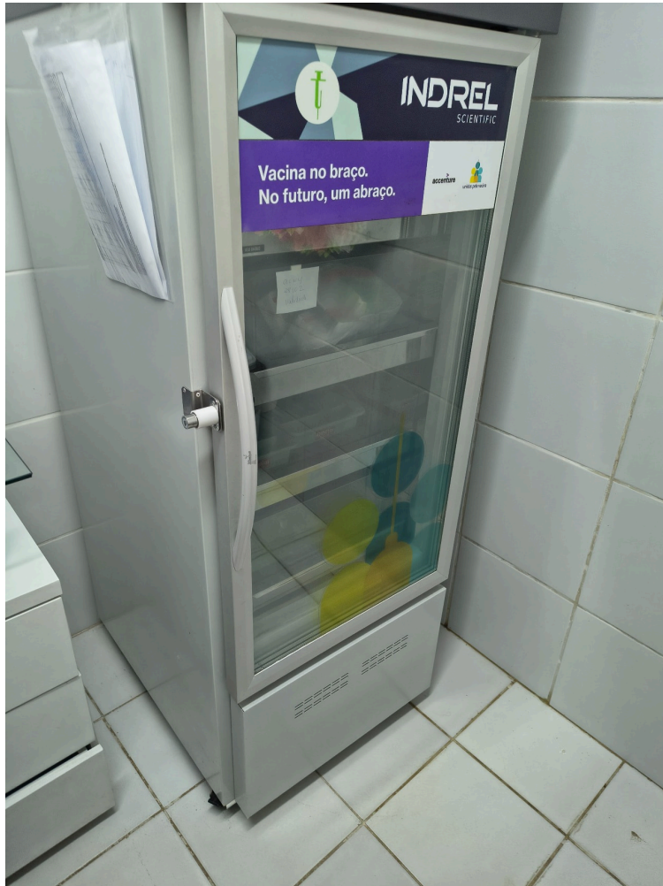
Câmara fria da sala de vacinas