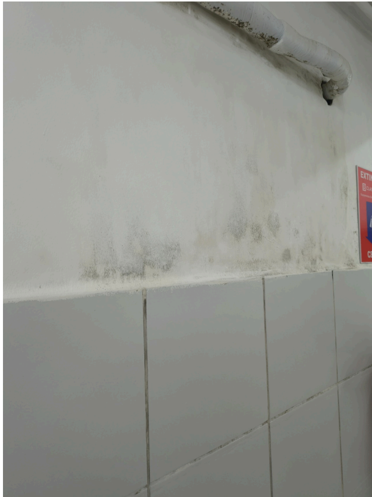
Área com infiltração e mofo em parede