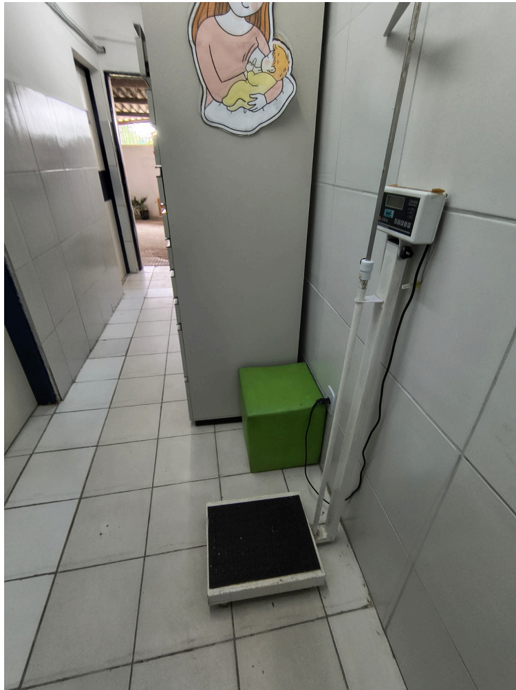
AMBIENTES E ESTRUTURAS FÍSICAS - Balança no corredor demonstra falta de Sala de Acolhimento / pré-consulta de enfermagem