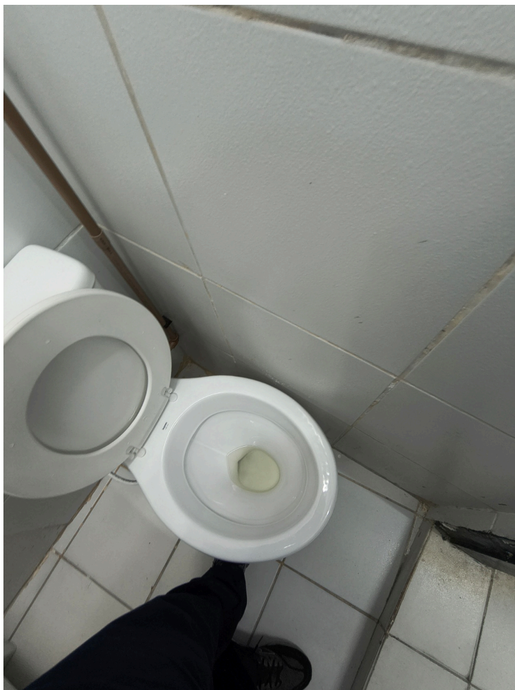
Banheiro único para trabalhadores, com bacia sanitária instalada muito próxima à parede, sem espaço para as pernas