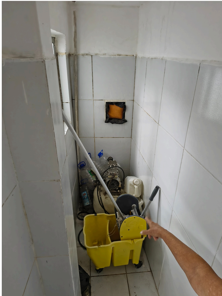
Materiais de limpeza