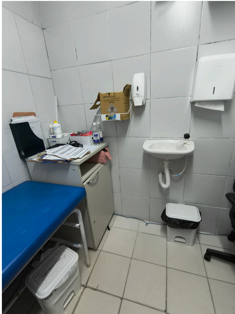
Segundo consultório médico