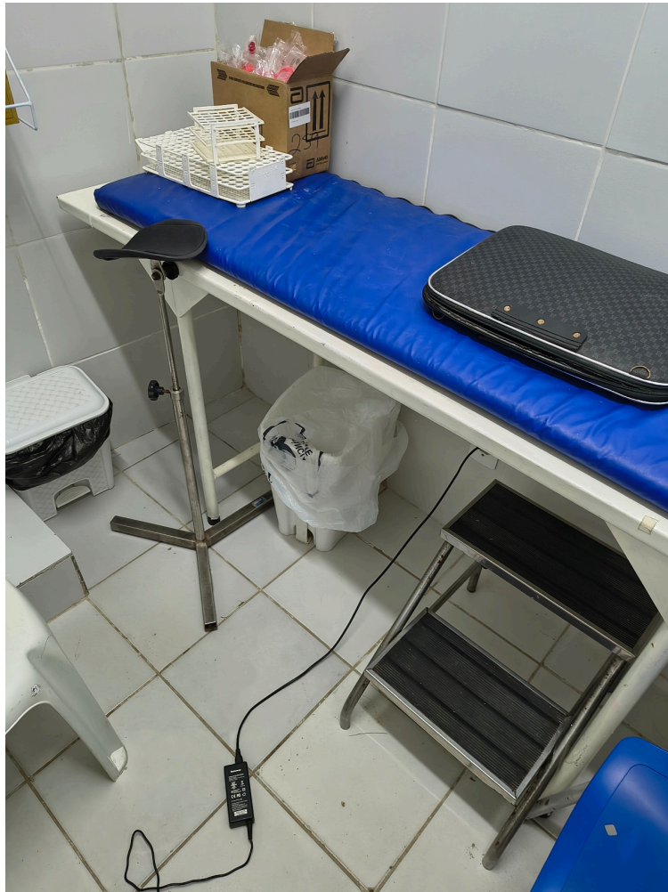
Sala de curativos também utilizada para as coletas de exames