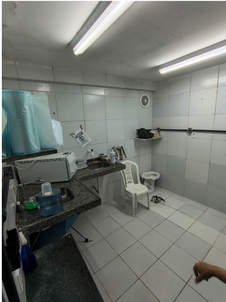
Consultório odontológico interdito