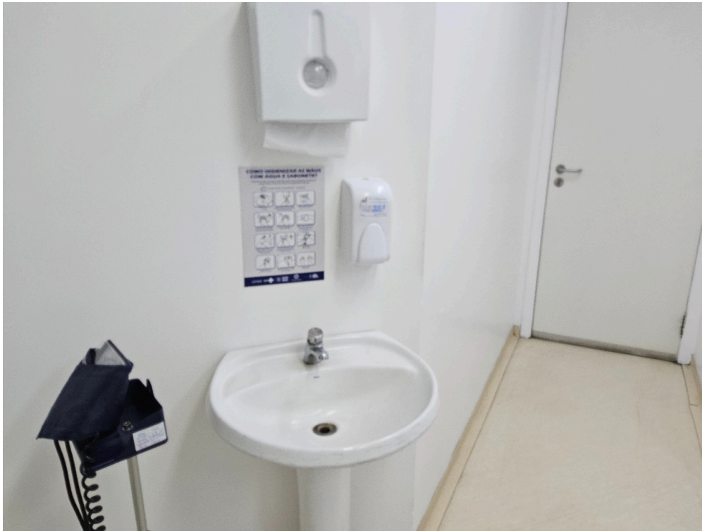
CLASSIFICAÇÃO DE RISCO - Há Acolhimento com Classificação de Risco