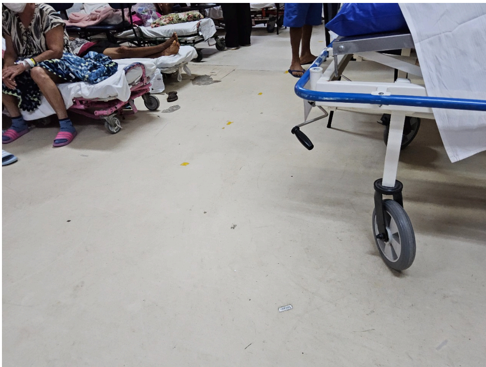
SALA DE OBSERVAÇÃO ADULTO - Número de leitos ocupados por pacientes