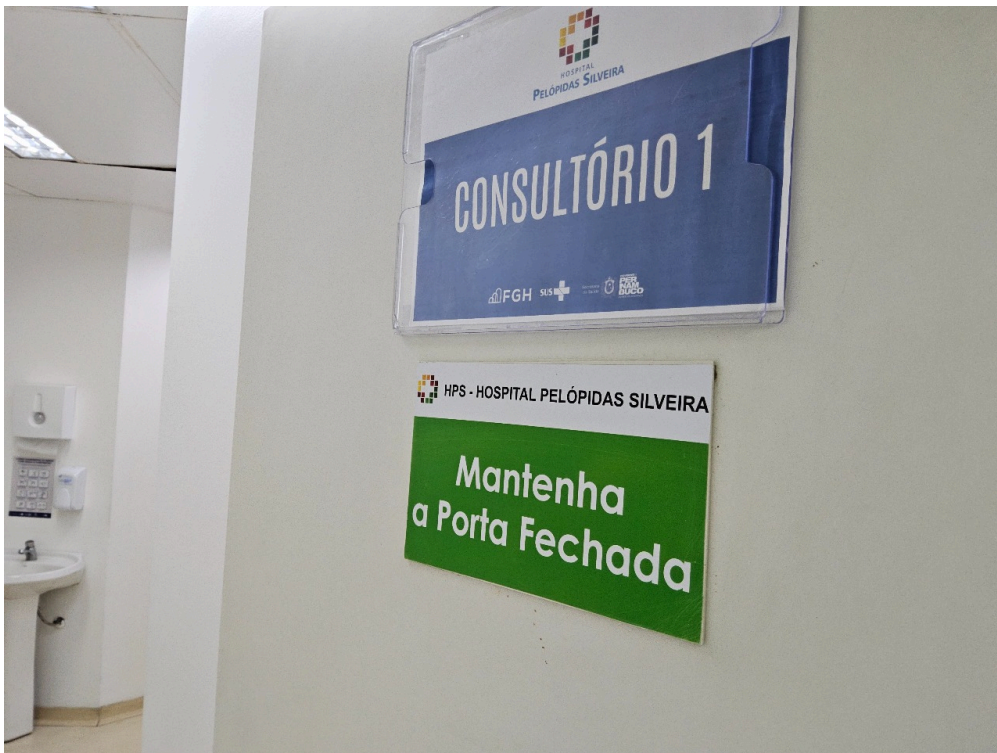
CLASSIFICAÇÃO DE RISCO - Há Acolhimento com Classificação de Risco