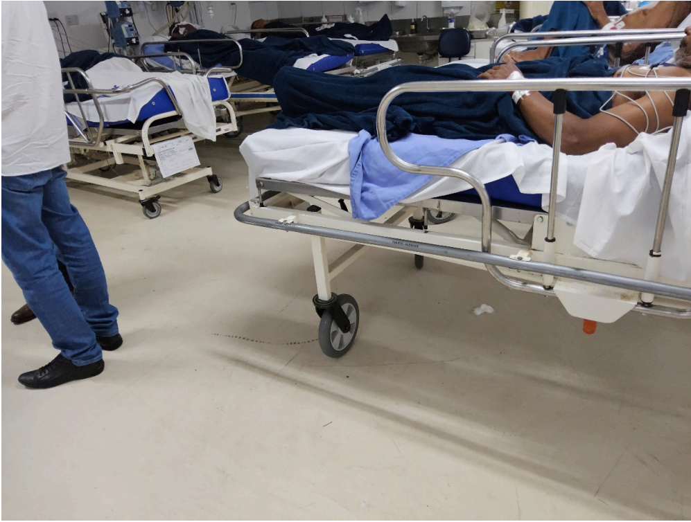
CORPO MÉDICO - Há previsão formal de disponibilidade de um médico exclusivo para a Sala de Reanimação e Estabilização de Pacientes Graves