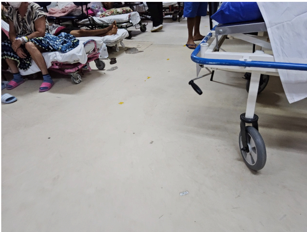
SALA DE OBSERVAÇÃO ADULTO - Número de leitos ocupados por pacientes