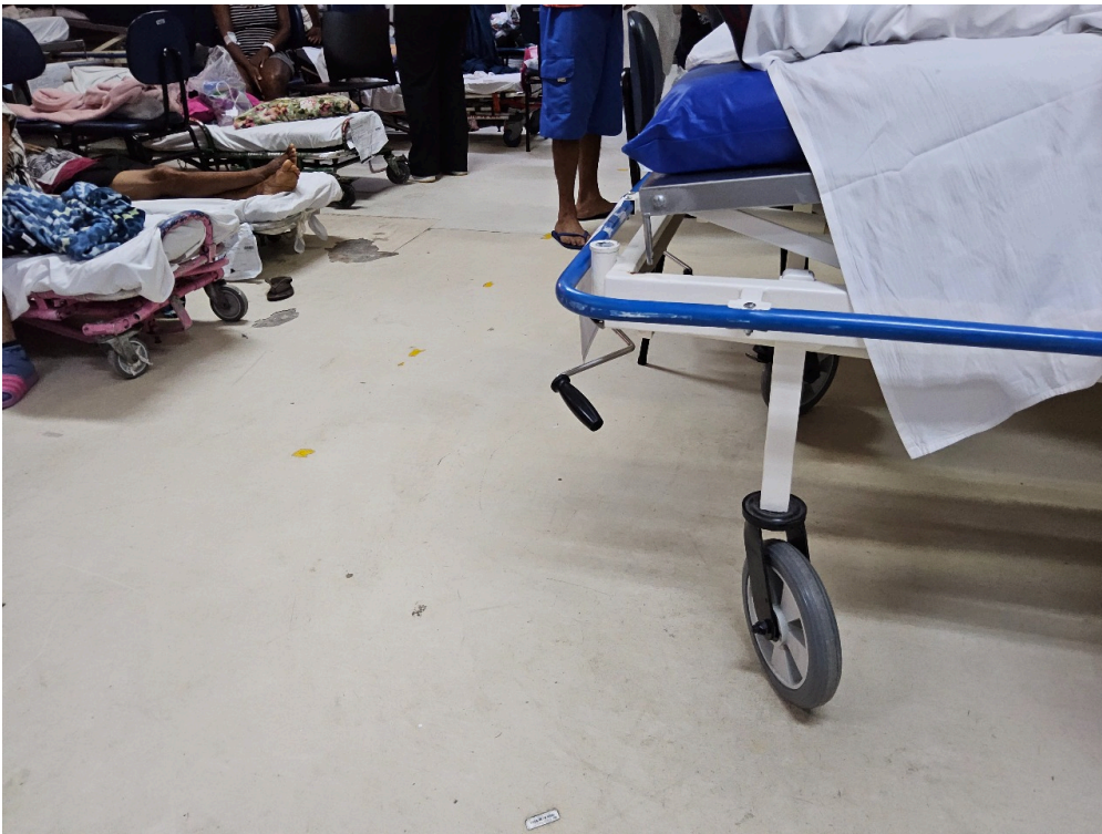
SALA DE OBSERVAÇÃO ADULTO - Número de leitos ocupados por pacientes