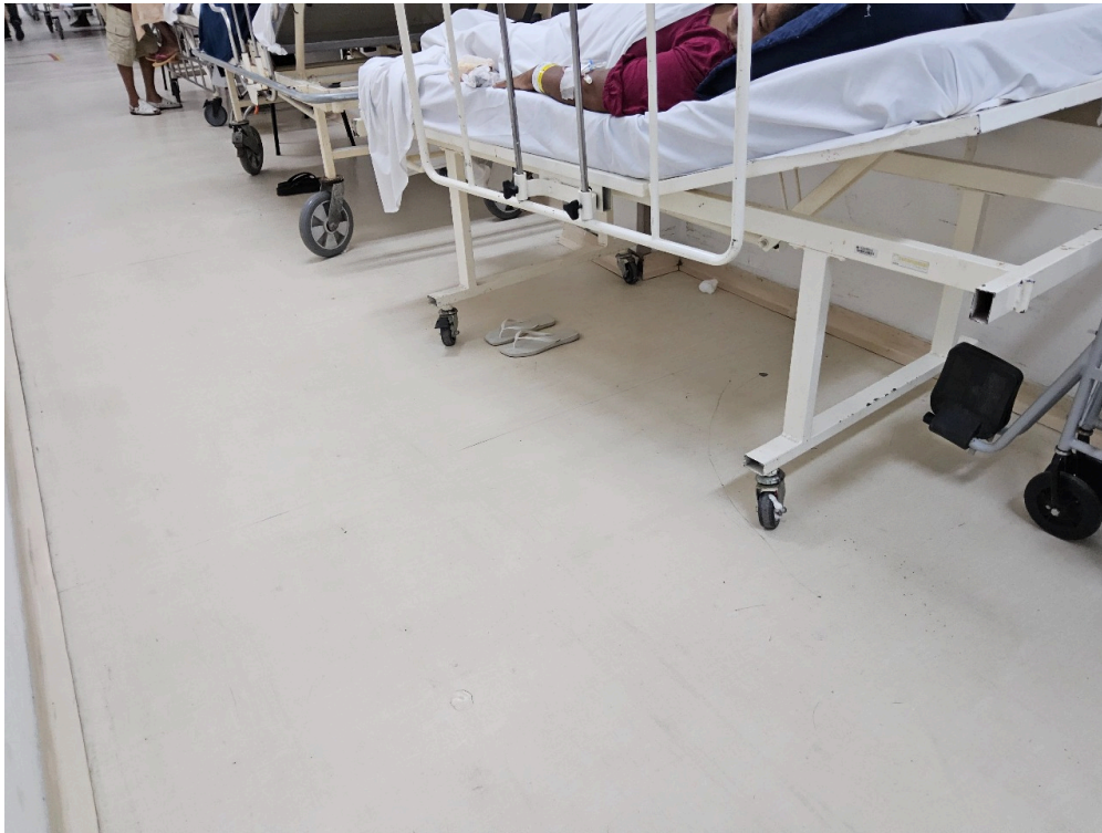
SALA DE OBSERVAÇÃO ADULTO - Número de leitos ocupados por pacientes