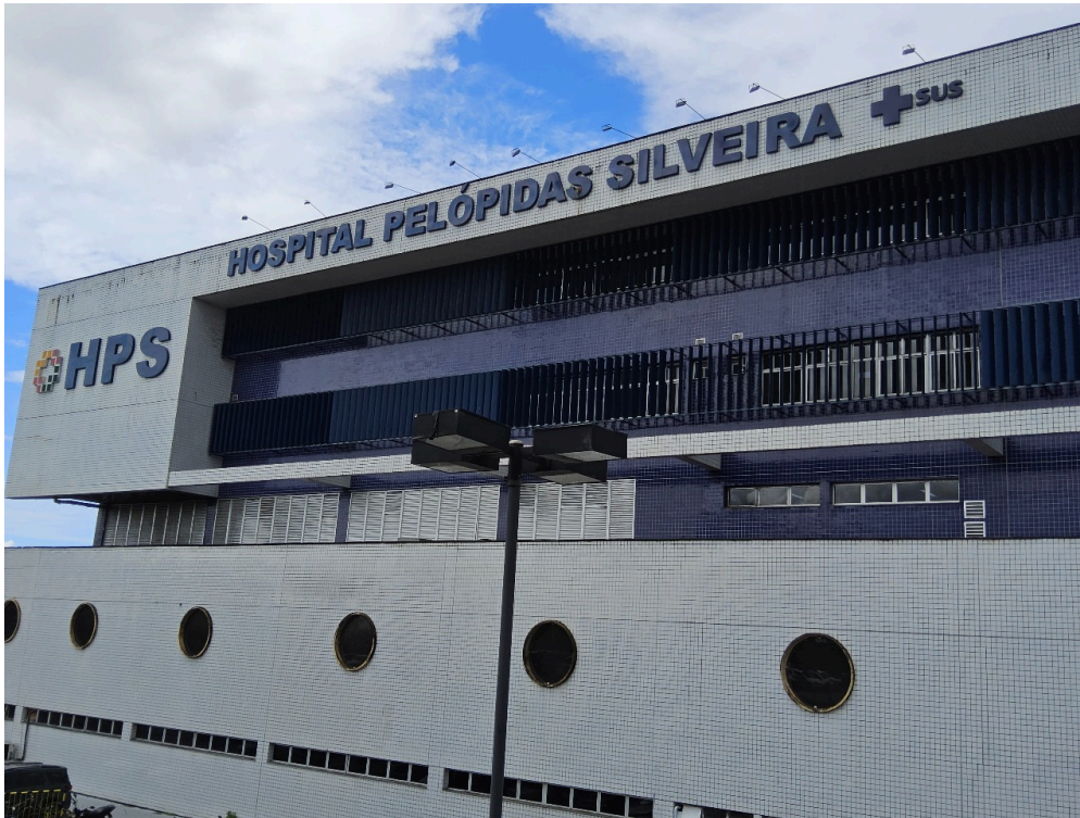
DADOS CADASTRAIS - Registro Fotográfico da Fachada