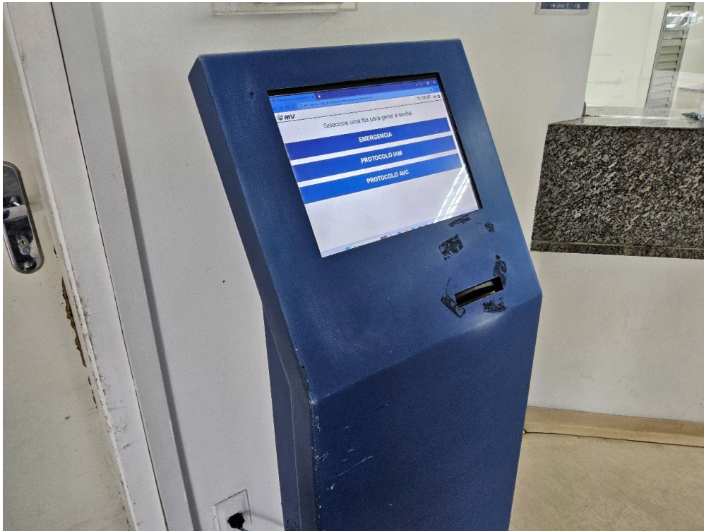
CLASSIFICAÇÃO DE RISCO - Há Acolhimento com Classificação de Risco