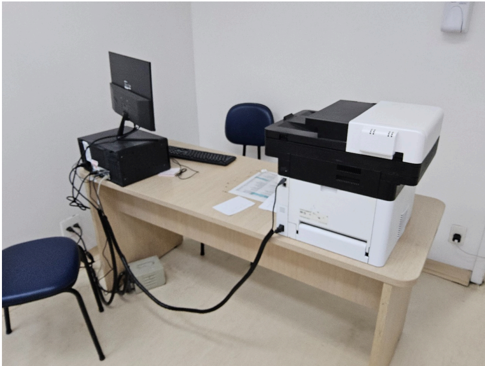
CLASSIFICAÇÃO DE RISCO - Há Acolhimento com Classificação de Risco