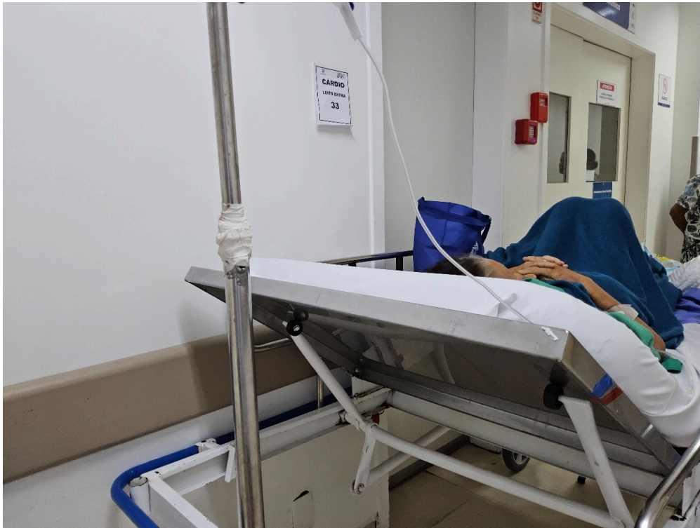
SALA DE OBSERVAÇÃO ADULTO - Número de leitos ocupados por pacientes