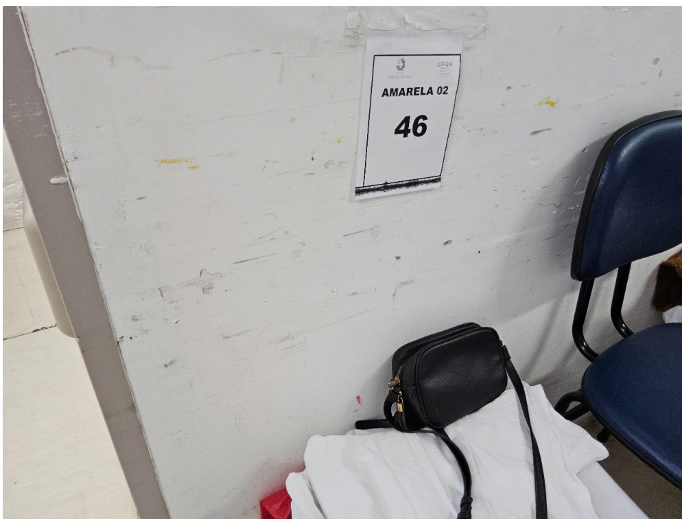
SALA DE OBSERVAÇÃO ADULTO - Número de leitos ocupados por pacientes