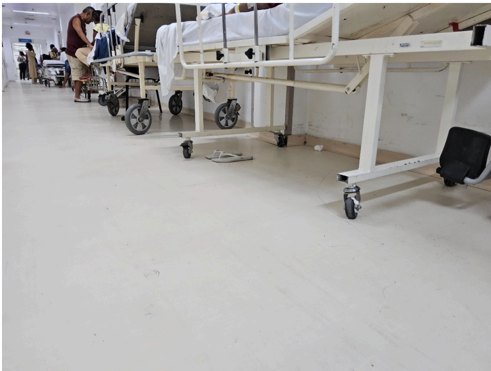
SALA DE OBSERVAÇÃO ADULTO - Número de leitos ocupados por pacientes