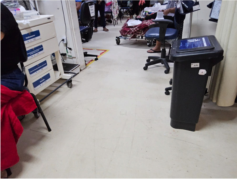
SALA DE OBSERVAÇÃO ADULTO - Número de leitos ocupados por pacientes