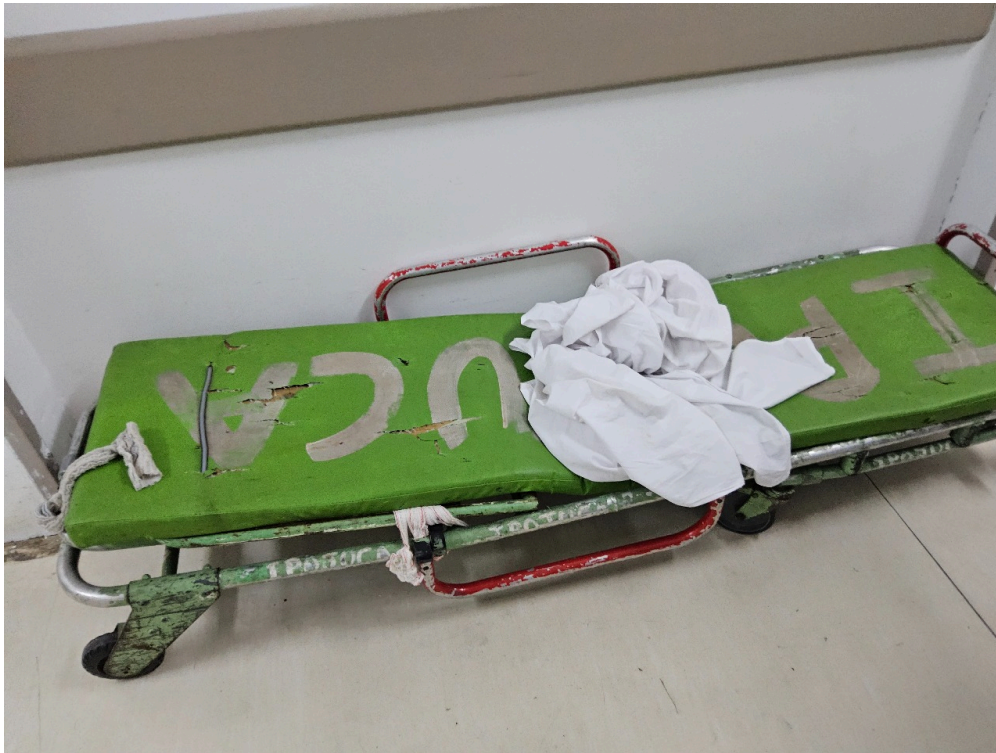
SALA DE OBSERVAÇÃO ADULTO - Número de leitos ocupados por pacientes