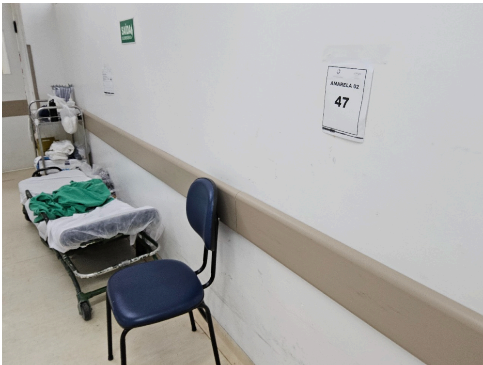
SALA DE OBSERVAÇÃO ADULTO - Número de leitos ocupados por pacientes