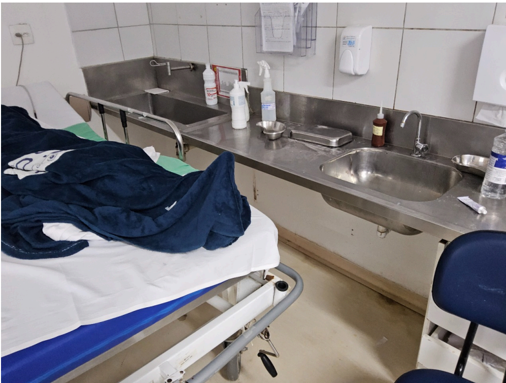
CORPO MÉDICO - Há previsão formal de disponibilidade de um médico exclusivo para a Sala de Reanimação e Estabilização de Pacientes Graves